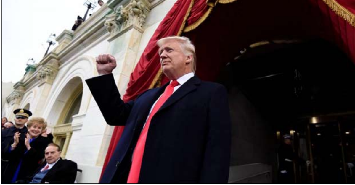
تغريدات ترامب قنبلة موقوتة

المعروف أن الرئيس الأمريكي مهوس جدا، وانفعالي في علاقته بشبكتة الاجتماعية المفضلة، تويتر. ومعروف أيضا، وذلك بفضل العمل الدقيق لواشنطن بوست على جدول أعمال دونالد ترامب، انه يقضي 13 ساعة (أي 2 بالمائة من الوقت) على تويتر.