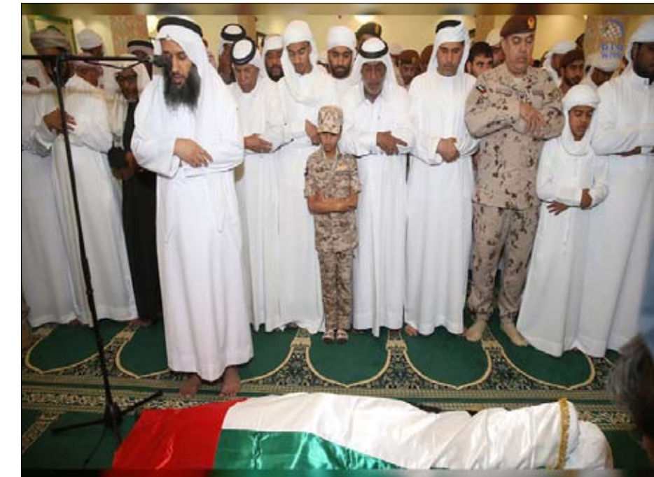
حكومته الشرعية. وقد أدى جموع المصلين قبل ظهر امس صلاة الجنازة على