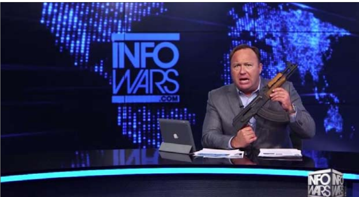
اللجوء لوسائل الاعلام الصديقة