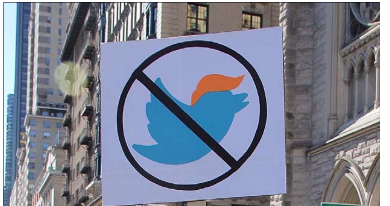
ادمان على تويتر يبحث عن علاج