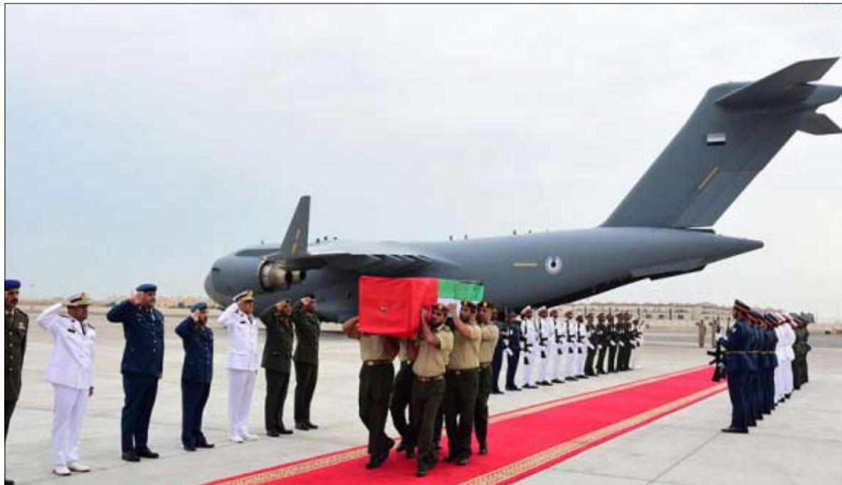
شهداء مع الشهداء والصديقين والأبرار وأن يلهم أهله وذويه الصبر والسلوان.