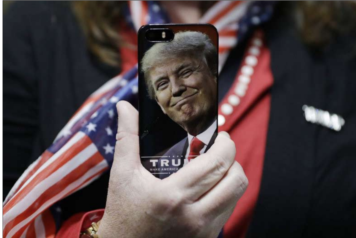
هاتفه الذكي سلاح دمار شامل

بعد المناوشات بين والد الجندي الذي قُتل في العراق ودونالد ترامب، عقد الجمهوريون لقاء مع أمهات الجنود القتلى في المعارك، قصة روجتها وسائل الإعلام المتواطئة معهم، ولحظة نشر المقالات، يسارع مستشارو الرئيس ببثها على تويتر. ولا يترددون في الاتصال بمنشطي فوكس نيوز، وكتاب الأعمدة المحافظة لتشجيعهم على التعليق على هذه المواد، وبالتالي يشككون