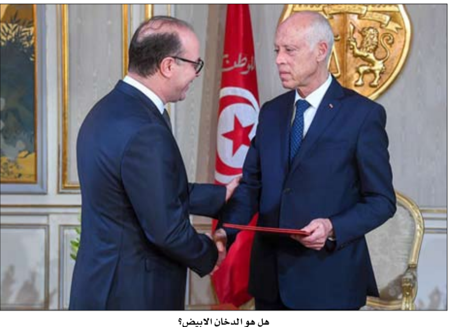
هل هو الدخان الابيض؟

وإنعقد المكتب التنفيذي لحركة الشعب مساء الثلاثاء، لدراسة امكانية انسحابه من مشاورات تكوين الحكومة في صورة إصرار إلياس الفخفاخ على مقترحه. ويبدو سيعقد المجلس الوطني لحزب التيار الديمقراطي اجتماعه للإعلان عن قراره النهائي بشأن مواصلة المشاركة في محادثات تحديد تركيبة