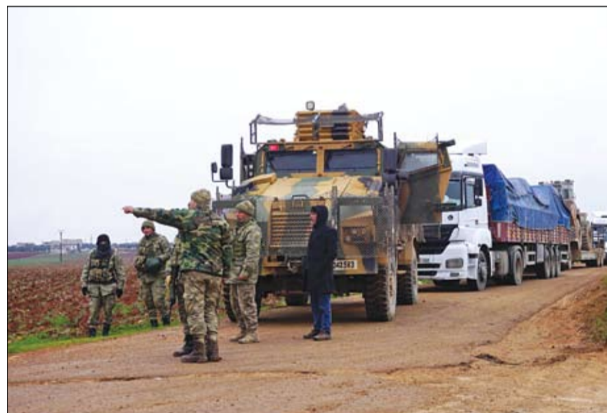
الجيش التركي يواصل التدخل في الشمال السوري

الكرملين: أنقرة لا تحترم التزاماتها احتدام الخلاف الروسي التركي حول إدلب •• عواصم-وكالات: احتدم الخلاف بين موسكو وأنقرة على الرغم من مساعي التهدئة، فحسب حين اتهم الرئيس التركي، رجب طيب أردوغان، روسيا بارتكاب مجازر في إدلب، شمال غربي روسيا، أكد الكرملين، أن تركيا لا تلتزم بالاتفاقيات التي أبرمتها مع روسيا لتحييد المتشددين في المحافظة السورية، مضيفاً أن الهجمات على قوات النظام السوري والنسوات الروسية مستمرة في المنطقة. كما قال المتحدث باسم الكرملين، ديمتري بيسكوف، إن موسكو لا تزال ملتزمة بالاتفاقيات مع أنقرة، لكنها تعتبر أن الهجمات في إدلب غير مقبولة وتتناقض مع الاتفاق مع أنقرة. يأتي هذا بعد تهديد أردوغان بضرب النظام في كل مكان، وتلميحه لهجوم كبير نهاية فبراير، إذا لم تنسحب قوات النظام من المواقع القريبة لمواقع المراقبة التركية في إدلب. وهدد الرئيس التركي بضرب قوات النظام السوري في كل مكان في حال تعرض جنوده لأذى، منهما روسيا حليفة دمشق بالمشاركة في ارتكاب مجازر في إدلب بشمال غربي سوريا. وقال في كلمة أمام كتلة حزبه الحاكم في البرلمان في أنقرة أعلن