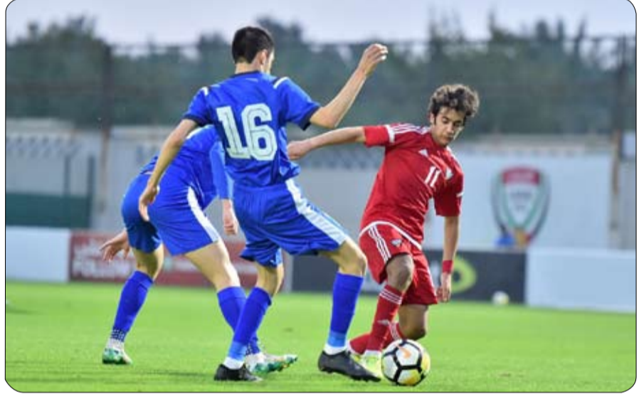
السفر إلى العاصمة السعودية الرياض يوم السبت المقبل لخوض

•• أبوظبي - الفجر ينظم نادي غنتوت لسباق الخيل والبولو بعد ظهر يوم غد الجمعة 14-2 مهرجان يوم الأمل لأصحاب الهمم والهلال الأحمر الإماراتي لفئة الأيتام، وتأتي تلك الفعالية برعاية كريمة من سمو الشيخ فلاح بن زايد آل نهيان - رئيس مجلس إدارة نادي غنتوت لسباق الخيل والبولو، والمخصص لصالح فئة اضطراب طيف التوحد بالدولة والأعمال الإنسانية التي يقوم بها الهلال الأحمر الإماراتي على مستوى العالم، وقد تقرر إقامة هذه الفعالية الخيرية المجتمعية لمعلم سلطان بن زايد للبولو الذي تم تشييده مؤخرا بالنادي. تفتح أبواب النادي من الساعة الثانية ظهراً للجمهور، ويتضمن برنامج الاحتفال، عقب استقبال كبار الضيوف اعتباراً من الثالثة والنصف، وفي الرابعة والثلاث عزف النشيد الوطني إيانا يبدأ مراسم المهرجان الذي يتضمن في فقرته الرئيسية على مباراة البولو الخيرية بمستوى 14 هاند كاب والتي تجمع بين فريق غنتوت (أ) وغنتوت (ب) وتضم