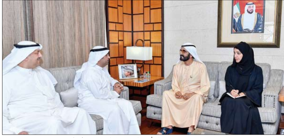
محمد بن راشد خلال استقباله أمين عام مجلس التعاون الخليجي

استقبل أمين عام مجلس التعاون الخليجي محمد بن راشد؛ قيادات الدول الأعضاء حريصة على تعزيز مسيرة مجلس التعاون على مختلف الصعد •• دبي - وام استقبل صاحب السمو الشيخ محمد بن راشد آل مكتوم نائب رئيس الدولة رئيس مجلس الوزراء حاكم دبي رعاه الله ظهر أمس في دبي بحضور سمو الشيخ مكتوم بن محمد بن راشد آل مكتوم نائب حاكم دبي .. معالي الدكتور نايف فلاح مبارك الأمين العام لمجلس التعاون لدول الخليج العربية الذي جاء للسلام على سموه بمناسبة تسلمه منصبه الجديد كأمين عام للمجلس. وقد رحب صاحب السمو الشيخ محمد بن راشد آل مكتوم بالدكتور الحجرف .. متمنياً له النجاح والسداد في أداء مهامه والعمل الجاد والمخلص لما فيه خدمة ومصصلحة الدول الأعضاء وشعوبها مجتمعة. التفاصيل (ص 2)