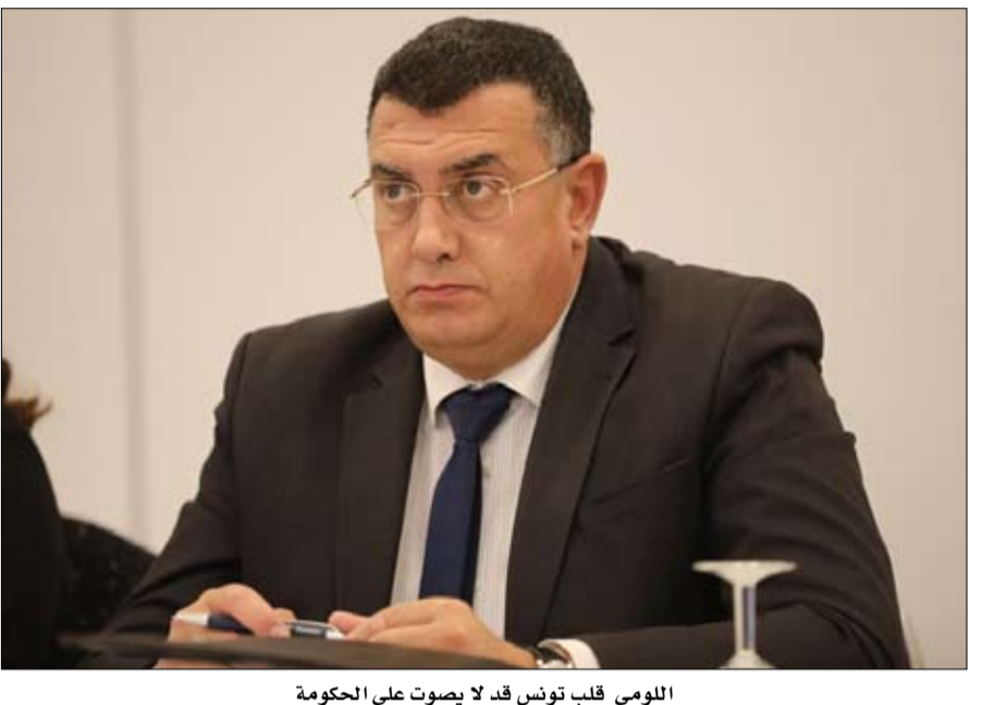
اللومي قلب تونس قد لا يصوت على الحكومة

الفخفاخ وإنما بيد الأحزاب. وأضاف اللومي أنه كان من المفترض تشريك قلب تونس في مشاورات تشكيل الحكومة منذ البداية وأخذ رأيهم في أن تقرّر موقفها من المشاركة في الحكومة. وأكد أنّ قلب تونس سيكون دوره في البرلمان وسيقترر التصويت لحكومة الفخفاخ من عدمه، مشيراً إلى أن أسلوب الإقصاء الذي اعتمده رئيس الحكومة المكلف سيدفع بحزب قلب تونس إلى عدم التصويت. وشدد النائب عن قلب تونس الفارغ خاططة وسياسة الإقصاء خاطئة وسيطئنة الخصم السياسي سياسة أيضاً خاطئة ودعا إلى تكوين جبهة برلمانية واسعة.