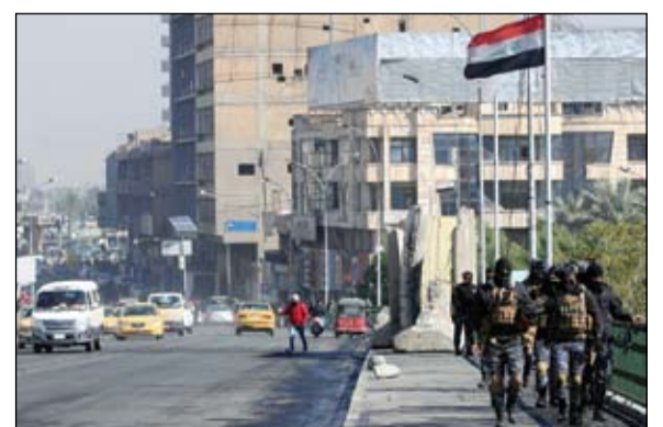
قوات الأمن العراقية تحكم سيطرتها على الطرقات في بغداد (رويترز)

الأمن يفتح طرقات بغداد.. والمحتجون يشعلون الإطارات •• بغداد-وكالات أعاد المتظاهرون في بغداد أمس الأربعاء، إغلاق الطرق المؤدية إلى جسر السنك وساحة التحرير بالإطارات المشتعلة، بعد أن عمدت القوى الأمنية إلى فتح طرقات العاصمة صباحاً. كما أظهر مقطع فيديو المحتجين وهم يلقون الطرقات المؤدية إلى جسر السنك وساحة التحرير بالإطارات المشتعلة. وكانت القوات الأمنية باشرت في وقت سابق الأربعاء فتح عدة طرقات في العاصمة العراقية كان المحتجون