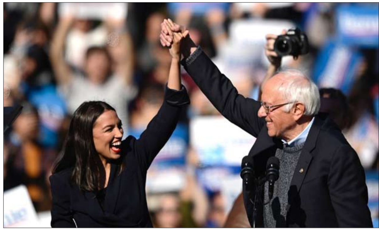
كورتيز في نصرة ساندرز