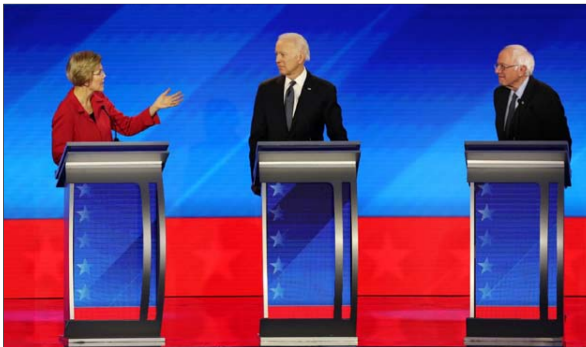
بيرني يتصدر استطلاعات الرأي

يؤكد ساندرز لياقته الاستثنائية، قبل ثلاثة أسابيع من مراتون الثلاثاء الكبير