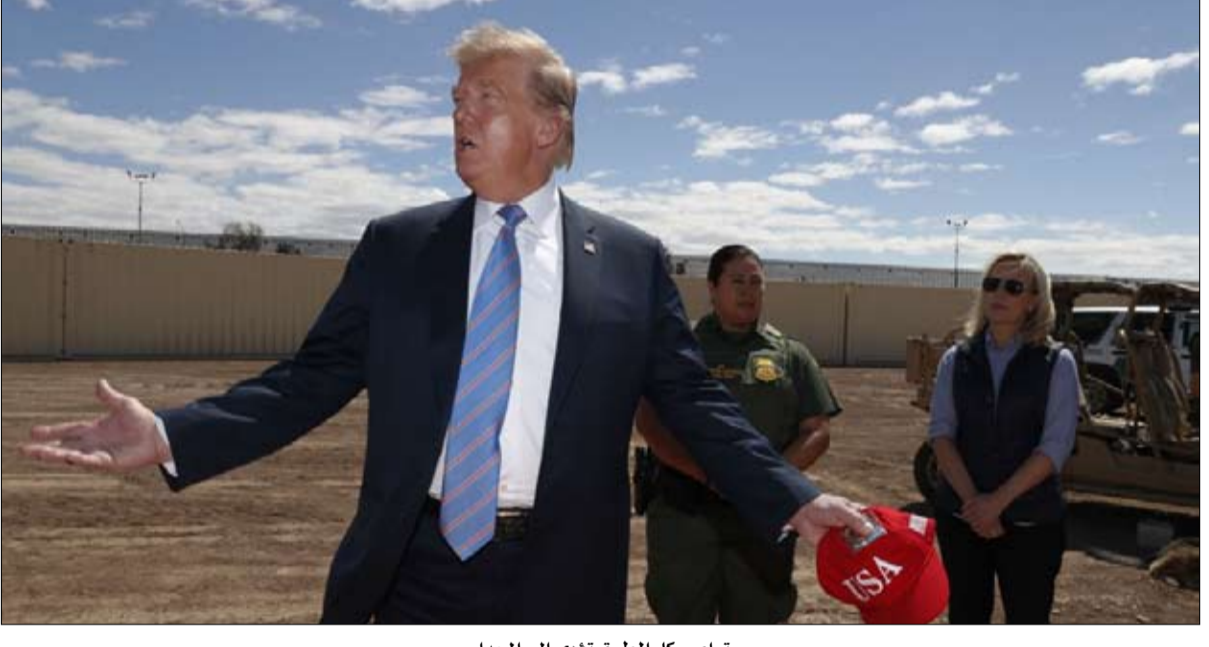
ترامب كل الطرق تؤدي الى الجدار