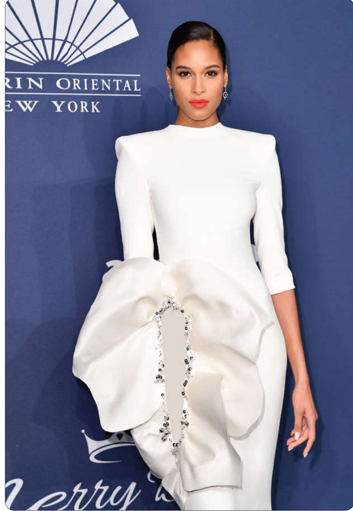
عارضة الأزياء الفرنسية سيندي برونا خلال حضورها مهرجان أمبار في نيويورك.

حول والدها طفلة بريطانية غرفتها إلى مشهد ساحر من قصة الحساء والوحش الشهيرة. ونشر والد الطفلة سكوت بريستون مجموعة من الصور على موقع التواصل الاجتماعي فيس بوك، تظهر التصميم الجديد لغرفة طفلته، بتكلفة لا تزيد عن 500 جنيه أسترليني 650 دولاراً، وتتميز الغرفة الساحرة بعدد من العناصر المستوحاة من فيلم الرسوم المتحركة "الحساء والوحش" لعام 1991، بما في ذلك مجموعة من المصابيح والتماثيل الشخصية والجدارية. وتم شراء اللوحة الجدارية الكبيرة، التي تشغل أحد الجدران بالكامل من أمازون، وتظهر الحساء وهي ترقص برفقة الوحش، في حين ضم الجدار المقابل لمصقات ضخمة فوق السرير لعنوان الفيلم.