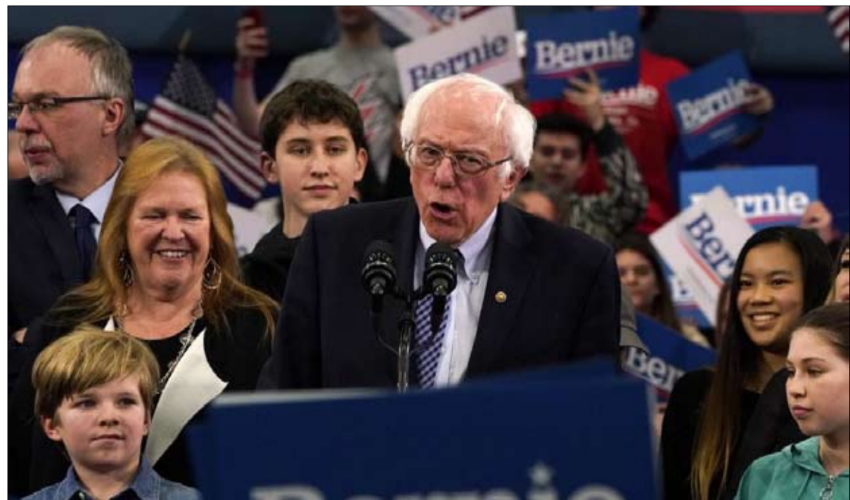
الشيخ الشيوعي يغوي الشباب