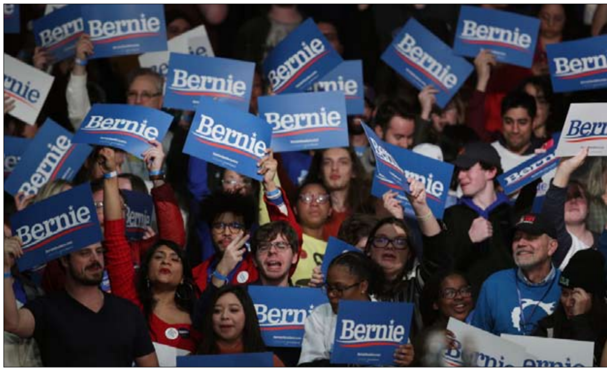
قاعدة صلبة تسنده