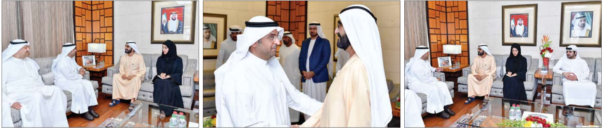
استقبل أمين عام مجلس التعاون الخليجي