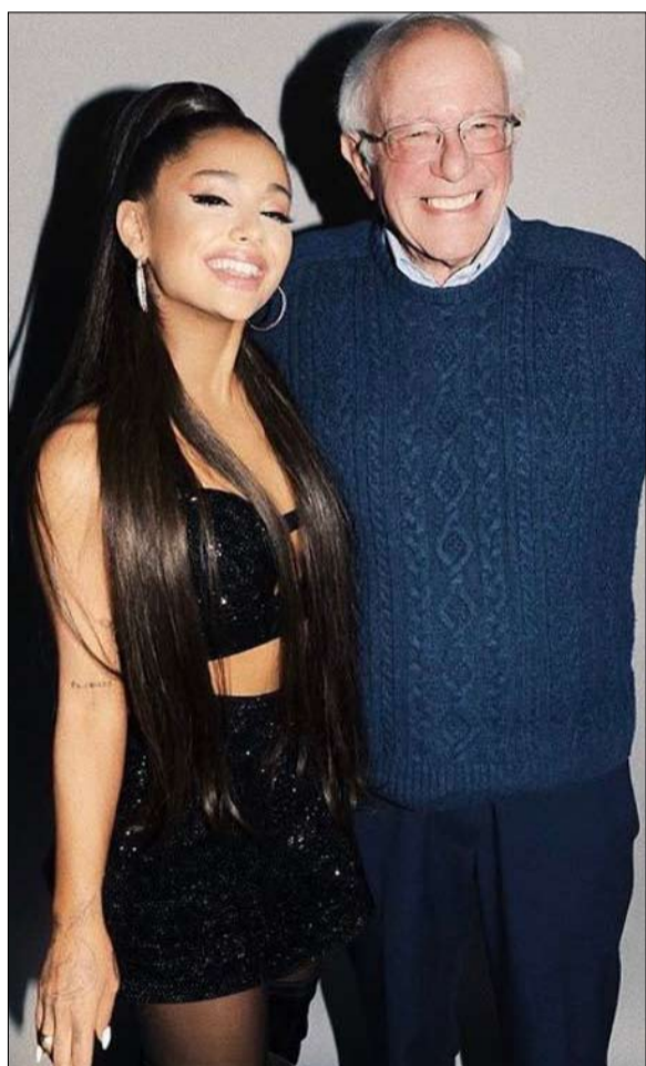
أريانا غراندي من النجوم المعجبين

ولأول مرة، يحتل ساندرز صدارة المترشحين في استطلاع مورنينغ كونسلت الوطني، ويقرب من جو بايدن في نيفادا، أول ولاية غربية تتم دعوتها إلى صناديق الاقتراع يوم السبت، 22 فبراير. سيناريو لم يصدقه أحد قبل بضعة أشهر. في مطلع أكتوبر، كان المترشح الخائب في تمهيدية عام 2016، ضحية أزمة قلبية نُقل على إثرها إلى