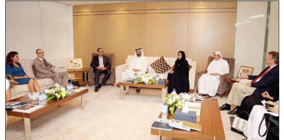
محمد بن راشد خلال لقائه ممثلي المؤسسات الإعلامية العالمية (وام)

• العين-وام: قام الفريق أول سمو الشيخ محمد بن زايد آل نهيان ولي عهد أبوظبي نائب القائد الأعلى للقوات المسلحة عصر امس بزيارة لنزل محمد سعيد مبارك المنصوري في منطقة الشعبية بمدينة العين. كما قام الفريق أول سمو الشيخ محمد بن زايد آل نهيان صباح امس بزيارة لابناء المرحوم محمد