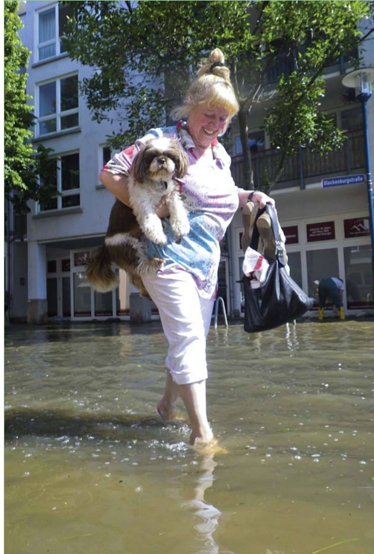
امرأة المانية تحمل كلبها وتعبير الطريق خلال الفيضانات من نهر الالب في ماغديبورغ بألمانيا الشرقية.

سيخضع الجنود البريطانيون السابقون الذين لا يحملون أية مؤهلات للتدريب على العمل كمعلمين، في إطار برنامج جديد اعتمده حكومة بلادهم لتسهيل اندماجهم بالمجتمع المدني بعد ترك الخدمة. وقالت هيئة الإذاعة البريطانية (بي بي سي) إن برنامج من الجيش إلى التعليم سيساعد الجنود السابقين على التحول إلى معلمين في غضون عامين، شريطة أن يتمتعوا بدرجة عالية من المهارة. وأضافت أن وزارة التعليم أعلنت بأنها ستسمح للجنود السابقين الأولوية في المناهج التدريبية لاعادهم كمعلمين من دون شهادة وتأهيلهم في غضون عامين، وستضعهم قبل ذلك لاختبارات صارمة لاختيار من يتمتع منهم بالقدرة على أن يصبحوا معلمين بارزين. وسيحصل الجنود البريطانيون السابقون على راتب وتدريب لمدة 4 أيام في الأسبوع في فصول دراسية لجميع أنحاء انكلترا وليوم واحد في الجامعة اعتباراً من كانون الثاني/يناير 2014، وسيتم تخرجهم بعد عامين كمعلمين مؤهلين بدرجة شرف بمجال التعليم. وقال وزير الدولة البريطاني لشؤون التعليم، ديفيد لوز، إن الجنود السابقين يمكن أن يصبحوا معلمين أكفاء بسبب تمتعهم بالقيم العسكرية، مثل القيادة والانضباط والتحفيز والعمل الجماعي، والتي ستفيد الأطفال.