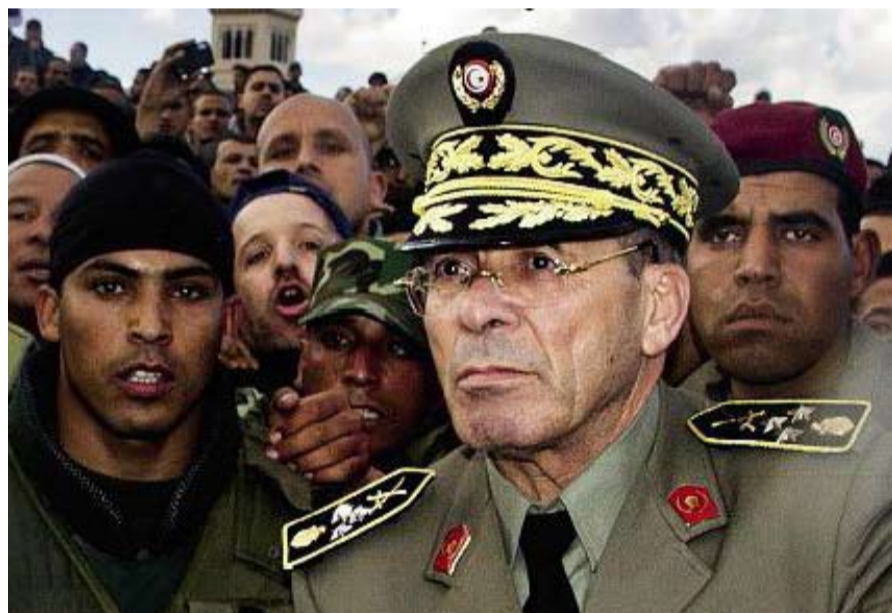
رشيد عمار قائد الجيوش الثلاثة في تونس

المجموعات الإرهابية دون حصول مزيد من الضحايا. كما دعت صفحات على الفايسبوك إلى حملة وطنية لمساندة الجيش والأمن الجمهوري . وقد اعتبر زعيم نداء تونس الباجي قائد السبسي إن الإرهاب السياسي أصبح حقيقة في تونس بسبب التهاون في التعامل معه مشيرا إلى أنّ التصدي لهذه الظاهرة يتطلب توحيد صفوف جميع التونسيين على حدّ قوله . في حين أدانت حركة النهضة في بيان لها لجوء عناصر إرهابية الى استعمال العنف قصد ترويع الناس وتخويفهم وبالتالي فرض أفكار وأجندات لا تخدم مصالح الوطن والمواطنين وفق نص البيان . من جهته اعتبر حزب التكتل الديمقراطي من أجل العمل والحريات هذا الاعتداء عمل إجرامي يحاك ضد كل التونسيين والتونسيات . ودعا كل الأحزاب والمجتمع المدني وكل المواطنين والمواطنات إلى جمع الكلمة في الرد الحاسم على المتآمرين والإرهابيين . هذا وقد حمل رئيس المرصد العربي للأديان والحريات محمد الحداد، الحكومة التونسية مسؤولية تقصي ظاهرة الإرهاب، مضرا ذلك بافتقاده لروية سياسية وخطاب واضح تجاه الجماعات المتشددة التي امتدّ عودها خلال الأشهر الأخيرة . وشدّد الحداد على أنّ وزارة الشؤون الدينية هي المسؤول الأكبر عن هذا المنزلق الخطير الذي دخلت في آتونه البلاد نتيجة التهاون و التقصير في إدارة المساجد التي أضحت قضاء حاضنا للأفكار المتطرفة والغريبة عن كنه ومبادئ ديننا الإسلامي الحنيف . كما أوضح رئيس المرصد العربي للأديان والحريات أنه لا سبيل إلى التحاور مع من رفع السلاح في وجه الشعب التونسي الذي دعاه المتحدث إلى اليقظة والتحلي بروح المسؤولية الوطنية من أجل التصدي للجماعات الخارجة عن سلطة القانون الذي غضت عنه بعض الأطراف السياسية النظر الانتخابية ضيقة.