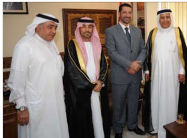
معهده والهيئة وتقديم الدعم الى معهد تدريب الائمة والوعاظ . مشيراً الى انه سيرعرض على سمو الشيخ حمدان بن راشد آل مكتوم موضوع تقديم الهيئة الدعم لمعهد تدريب الائمة والوعاظ .

الاعمال الخيرية الاماراتية في صدارة الداعمين للفئات الضعيفة وافعالها مشهودة في كل القطاعات الصحية والتعليمية والتنمية والاعاثة ولها بصمات في كافة المحافظات الفلسطينية ولاسيما في محافظة قلقيلية . وفي جانب آخر من المساعدات التي تقدمها هيئة الاعمال الخيرية الاماراتية قام وفد من الهيئة الاماراتية بحضور مندوبين عن وزارة الاوقاف الفلسطينية وجمعية بيت المقدس بتكريم حفلة القرآن الكريم في المدرسة الشرعية في قلقيلية وتسليم جلابيب شرعية لعدد من الفتيات .. كما تساهم الهيئة بصيانة احدى المدارس