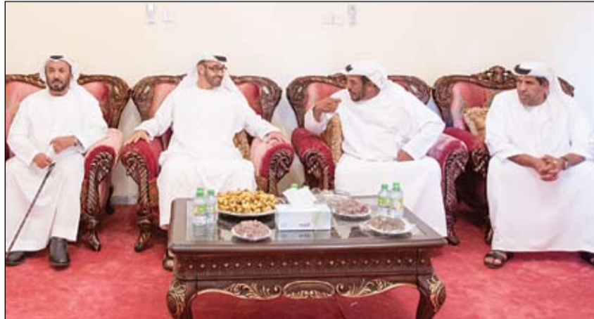
محمد بن زايد خلال زيارته محمد سعيد مبارك المنصوري

• أديس أبابا-الأناضول: تعقد الدول الموقعة على اتفاقية التعاون الإطاري لحوض النيل المعروفة باسم عنتيبي الرامية لإعادة تقسيم مياه نهر النيل اجتماعاً، متوقع له الخميس المقبل، لبحث تداعيات شروع إثيوبيا في بناء سد النهضة على مجرى أحد روافد النهر، وكسب مزيد من الدول للتوقيع على الاتفاقية. ويأتي الاجتماع استباقاً للاجتماع العادي لمجلس وزراء مبادرة حوض النيل العشرة (الدول الواقعة على مجرى النهر أو يقع فيها روافده) المقرر في 21 يونيو الجاري. وكشفت مصادر دبلوماسية لـ الأناضول عن اتصالات حثيثة تقوم بها إثيوبيا مع وزراء الري والمياه في دول كينيا، أوغندا، رواندا، وبورندي، وتنزانيا (الدول الموقعة على الاتفاقية) لتأكيد المشاركة في اجتماع عنتيبي المقرر في كينيا الخميس المقبل.