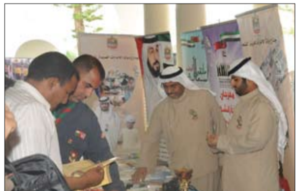
زاره رئيس مجلس الشعب ووزير الشباب اليمني

تتسم بالادارة الجيدة والدقيقة والترتيب المميز ..معرباً عن الشكر والتقدير لدولة الامارات وشعبها على هذه الجهود المقدرة لدى الحكومة الاردنية والشعب الاردني. ووجه معاليه الشكر والتقدير الى سمو الشيخ حمدان بن راشد آل مكتوم نائب حاكم دبي وزير المالية راعي هيئة آل مكتوم الخيرية والشيخ راشد بن حمدان بن راشد آل مكتوم رئيس الهيئة على ما تقوم به الهيئة من أعمال ومشاريع خيرية وانسانية في الاردن. وعبر معاليه عن أمله في أن يساهم هذا اللقاء بزيارة وفد الهيئة في زيادة التعاون والبناء على ماسبق خاصة وأن وزارة الاوقاف والشؤون والمقدسات الاسلامية بصد انشاء معهد تدريب للأئمة والوعاظ يمنح درجة البكالوريوس في الشريعة الاسلامية .. لافتاً الى ان سعادة ميرزا الصايغ وعد بالدمع