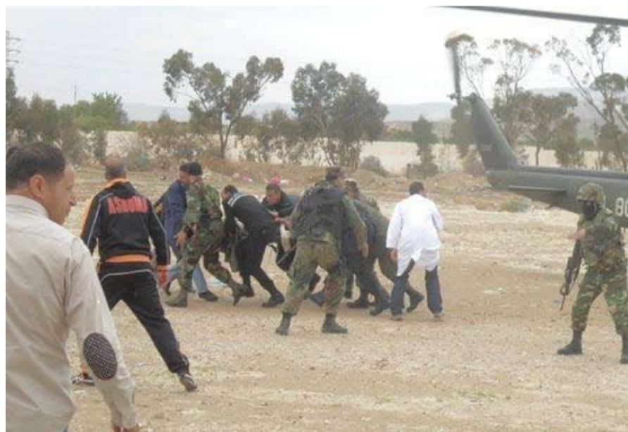
نقل المصابين في انفجار اللغم