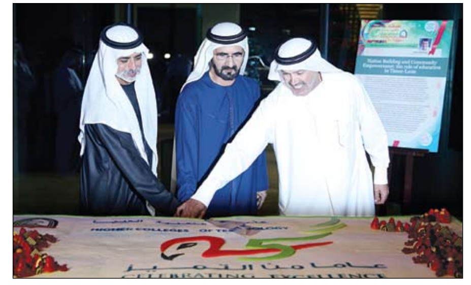
محمد بن راشد يشهد الاحتفال بمرور ربع قرن على انشاء كليات التقنية العليا

الإمارات الأولى في العام 1979 والثانية في العام 2010. وقال سمو الشيخ عبدالله بن زايد آل نهيان وزير الخارجية إن الزيارة الرسمية لصاحب السمو رئيس الدولة، والتي تأتي تلبية لدعوة جلالة الملكة إليزابيث الثانية، تعد شاهدا على العلاقات العميقة والتاريخية بين الإمارات والملكة المتحدة وعلى الفرص الكبيرة للتعاون المستمر بين البلدين. وأكد سموه التزام الإمارات تحت قيادة صاحب السمو الشيخ زايد بن سلطان آل نهيان طيب الله ثراه في العام 1989. وكانت الملكة إليزابيث الثانية وزوجها دوق أدنبرة قد قاما بزيارتين رسميتين لدولة