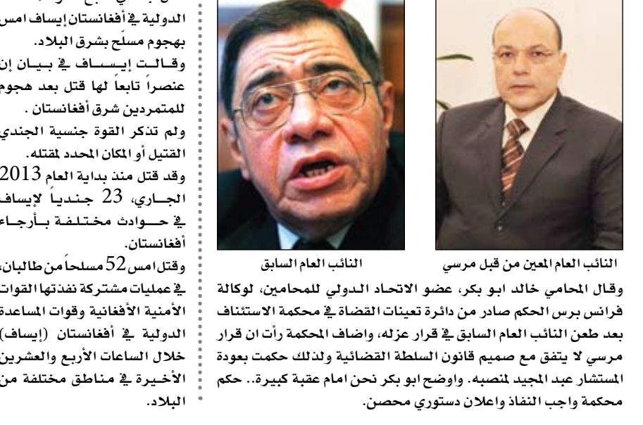
النائب العام العين من قبل مرسي النائب العام السابق

مقتل جندي للنااتو في أفغانستان كابول-يو بي أي: