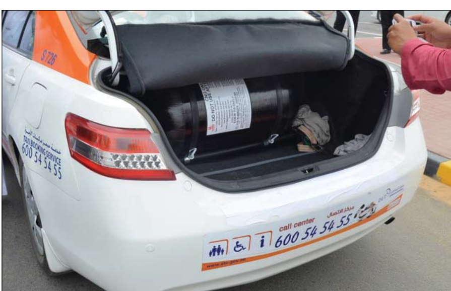
للتقليل من التلوث الناتج عن انبعاثات ثاني أكسيد الكربون والغازات الضارة من عوادم المركبات إلى جانب دورها في المحافظة على الموارد الطبيعية والتقليل من استهلاكها لتعمل بالغاز الطبيعي وتزويدها به.

التي أعدها المؤسسة، ستشهد تخفيض حوالي 52 طن من ثاني أكسيد الكربون سنوياً، فيما ستشهد المرحلة الثانية منه تخفيض 160 طن سنوياً على مستوى الأسطول. وأكد سعادة الزري أن حجم التحديات البيئية التي تواجه العالم اليوم يجعل الحاجة ماسة إلى تضافر جميع جهود المؤسسات والهيئات الدولية والإقليمية والمحلية في سبيل التصدي لهذا الخلل ووضع الحلول المناسبة لها، ومن ضمنها طرح المبادرات ذات العلاقة بالنقل والمواصلات، والتي تستهدف تحقيق توازن مستدام بين حماية البيئة واحتياجات التنمية خاصة بعد أن تبين أن قطاع النقل والمواصلات والمرحبات الخاصة يساهم وبشكل أساسي في تضخم المشاكل الصحية والبيئية، حيث ينتج من عوادم السيارات أول وثاني أكسيد الكربون وأكاسيد النيتروجين وثاني أكسيد الكبريت والمركبات الهيدروكربونية والجسيمات الدقيقة العالقة وغيرها من الغازات الضارة والتي صنف بعضها مؤخراً بالمسرطنات، الأمر الذي دعا إلى ضرورة الحد من هذه الأضرار. وأكد أن مشروع الغاز الطبيعي بإمارة الشارقة مشروع حضاري، ومن الشروعات الرائدة بمنطقة الخليج العربي باعتبار أن هذا الوقود نظيف وسديق للبيئة - ضمن خلال هذه المبادرات سيحافظ قطاع مركبات الأجرة بشكل كبير في تحسين المناخ في الدولة، كما سيكون له تأثيراً إيجابياً