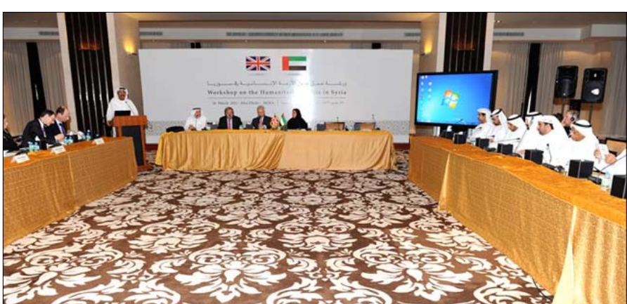
الاجتهاد المبذولة بالتعاون مع المنظمات الدولية وفي صدارتها الأمم المتحدة للاستجابة وتلبية احتياجات المتضررين من تلك

والتعاون الدولي البريطاني في تحقيق السلام والوئام العالمي .. مشيرة إلى أن دولة الإمارات قدمت ما يقرب من 318 مليون درهم معونات للشعب السوري منذ اندلاع الأزمة في سوريا. جاء ذلك خلال افتتاحها ورشة عمل حول أبعاد الأزمة الإنسانية في سوريا ومتابعة آليات الاستجابة لها وتقديم الدعم للمتضررين والتي نظمتها وزارة الخارجية بمقر الوزارة بأبوظبي بالتعاون مع وزارة التنمية البريطانية وضمها معالي آئن دنكن وزير التنمية والتعاون الدولي البريطاني