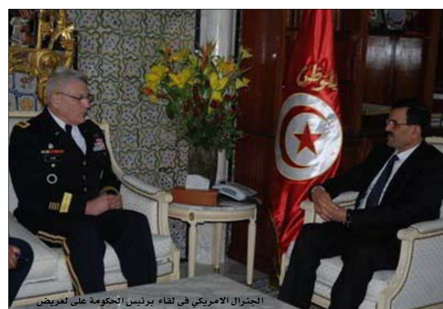
الجنرال الأمريكي في لقاء برئيس الحكومة على العريض

سهولة دخولها هو الوضع الأمني على الحدود التونسية الليبية ناهيا أن تكون تونس تحتوي على معسكرات تدريب مؤكداً رغم ذلك أن تونس ليست أبداً في مأمن من الإرهاب. وفي زده على رئيس الحكومة المؤقتة على العريض، قال زعيم التيار السلفي الجهادي أبو عياض بلهجة حادة على الصفحة الرسمية لأنصار الشريعة بالشبكة الاجتماعية الفيسبوك، قائلاً إلى عقلانكم نقول .. امسكوا مريضكم عنا ولا سنوجه حربنا إليه حتى إسقاطه وإلقائه في مزيله التاريخي .. واعلموا أننا لن نطيل القول فالجواب عليه ما ترون لا ما تسمعون .. إن لم تتداركوا أمركم.