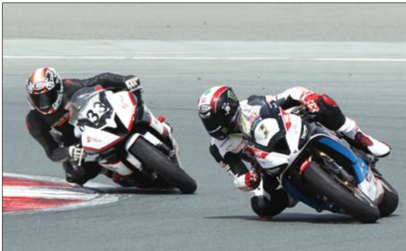
العائدة إلى هوك.

وتنطلق جولة التصفيات في حساب منافسات سلسلة سباقات إن. جي.ه. كي راسينغ في الساعة 9:45 صباحاً، بينما تنطلق الجولة الأولى من منافسات بطولة موتورستي الإمارات للدراجات النارية في الساعة 11:45 صباحاً، وتختتم سباقات أحداث اليوم بالجولة الأخيرة في تمام الساعة 4:45 مساءً. وسيكون الدخول لعشاق السرعة والإثارة مجاناً كعادة مع فرصة الدخول إلى المراب والمصنعة الرئيسية والجناح الجديد وستكون الماكولات والمرطبات متاحة في الصالة الرئيسية.