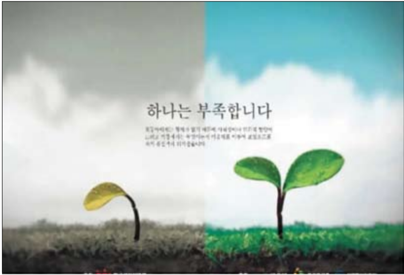
ملصق لحملة الكورية واحد لا يكفي والتي تهدف إلى تشجيع النساء على الإنجاب