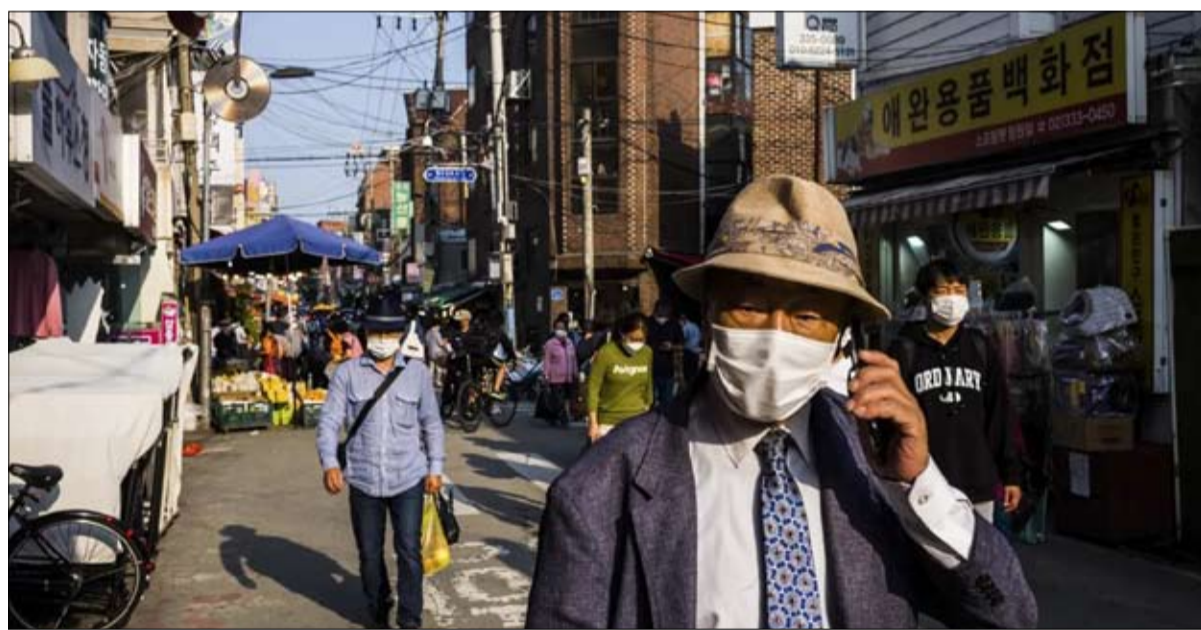
يتراقف تقلص عدد السكان في كوريا الجنوبية مع تسارع الشيخوخة

إغلاقها تماماً. ومن المتوقع أن يعاني ثلث الـ 152 الباقيين نفس المصير في السنوات القادمة. وتصانديق المعاشات التقاعدية. ويشكل عام، كيف ستكون آسيا قادرة على تحقيق الهيمنة الاقتصادية العالمية المتوقعة لها مع تراجع التركيبة السكانية؟ ومن سيملاً المدارس غداً؟ في