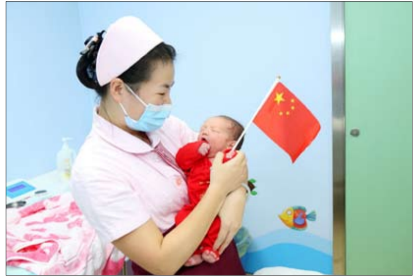
الصين تراجعت عن سياسة الطفل الواحد