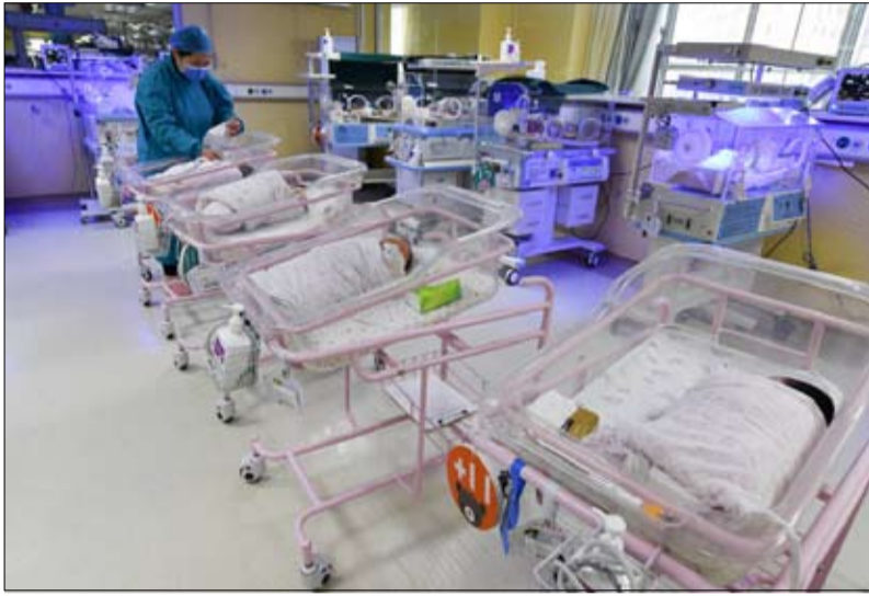
تقلص الولادات يهدد المجتمعات الآسيوية