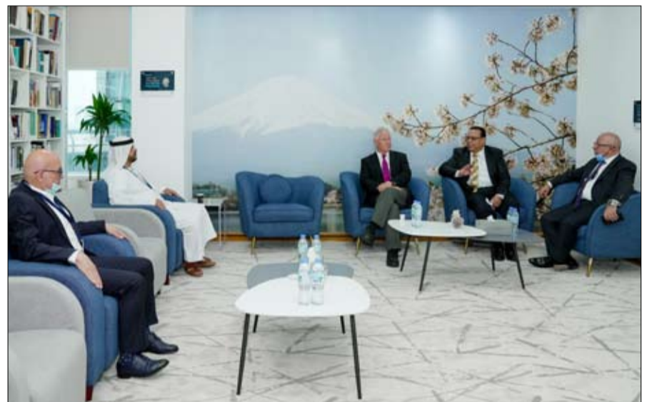
تقديم الخدمات الأكاديمية والبحشية، وتبادل الخبرات والمعلومات، والالتزام بمتطلبات ونشر المعرفة. وتشمل مجالات التعاون الأخرى بموجب مذكرة التفاهم كذلك لتحقيق مستويات عالية من الابتكار والتكنولوجيا والتعليم والبحث والتدريب والتطوير

وقعت جامعة زايد، إحدى الجامعات الحكومية الرائدة، مذكرة تفاهم مع مجموعة موانئ أبوظبي، المحرك الرائد للتجارة واللوجستيات والصناعة في أبوظبي، لتحقيق عدد من أهداف التنمية المستدامة في العديد من المجالات الرئيسية. وكجزء من التعاون، يسعى الطرفان لتطوير أجهزة الكشف عن الانسكابات والتسربات النفطية وتطوير أنظمة مبتكرة لعملية المراقبة، إضافة إلى التعاون في البحث المتعلق بالمواد الحيوية الصديقة للبيئة لاستخدامها كمواد لاصقة أو ماصة لمعالجة انسكاب النفط، وسيقودان معا العديد من المساعي المكرسة