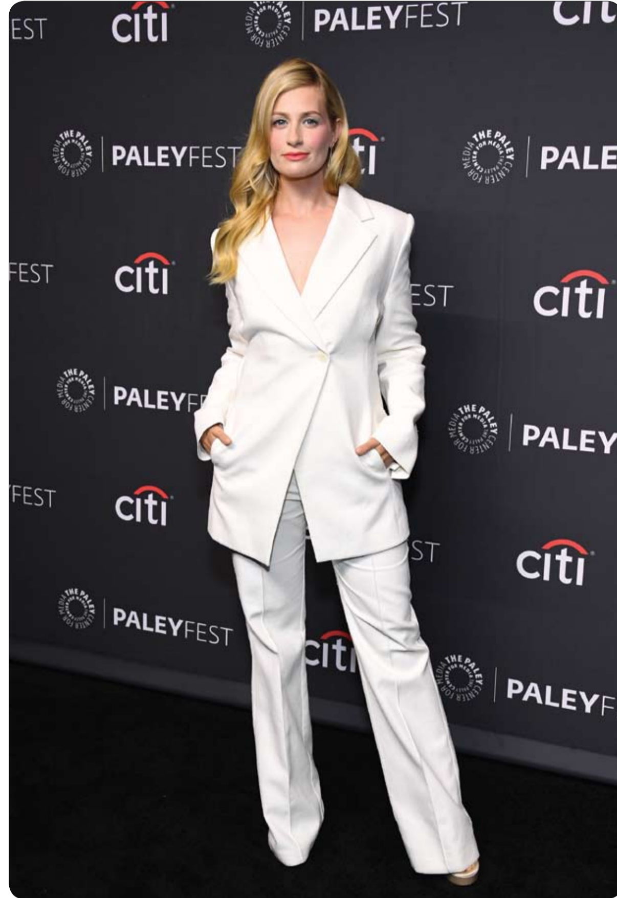
بيت بيهرس خلال حضورها العرض الأول لفيلم Ghosts في هوليوود، كاليفورنيا. ا ف ب

أصدرت فرقة بينك فلويد البريطانية أغنية أصلية من تلحينها وعزفها هي الأولى لها منذ العام 1994 دعماً للشعب الأوكراني، على ما أعلنت شركة إنتاج أعمالها وما أوردته صفحات الفرقة على شبكات التواصل الاجتماعي. وتهدف الأغنية التي تحمل عنوان Hey, Hey, Rise Up (أي اهض) إلى جمع الأموال للأعمال الإنسانية. وأدرج ركنها الفرقة ديفيد غيلمور ونيك ميسون في هذا العمل أغنية بصوت أندري خليفيشوك من فرقة بومبوكس الأوكرانية.