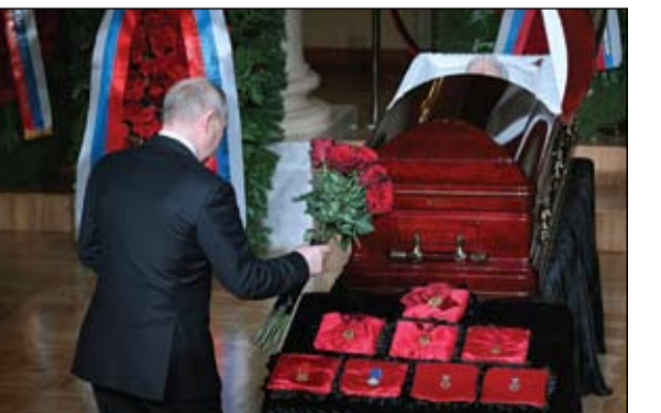
بوتين يضع إكليلاً من الزهور على نعش فلاديمير جيرينوفسكي

قال التحالف الذي تقوده الولايات المتحدة ومصادر أمنية عراقية إن القوات في قاعدة عين الأسد الجوية بالعراق، التي تستضيف قوات أمريكية، اعترضت وأسقطت طائرة مسيرة أثناء تحليقها بالقرب من القاعدة الجوية. وقالت قوة المهام المشتركة - عملية العزم الصلب على تويتر في حوالي الساعة 01:46 صباحاً (2246 بتوقيت جرينتش)... أسقطت أنظمة الدفاع الجوي الأمريكية مركبة جوية مسلحة بدون طيار تدخل إلى قاعدة الأسد الجوية في العراق. وقالت إن الحادث لا يزال قيد التحقيق، وأنه لم ترد أنباء عن وقوع إصابات بشرية أو أضرار. ولم يتسن الاتصال بمسؤولين عراقيين للتعليق. ولم تعلن أي جهة مسؤوليتها عن إطلاق الطائرة المسيرة.