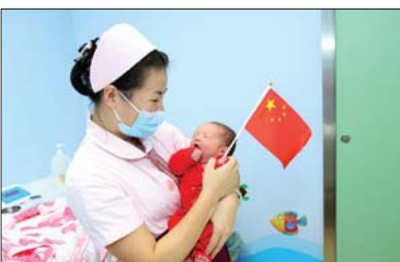
الصين تراجع عن سياسة الطفل الواحد

قالت المفوضية الأوروبية أمس الجمعة إن حكومات الاتحاد الأوروبي جمدت أصولاً قيمتها 29.5 مليار يورو ترتبط بالنخبة وشخصيات أخرى خاضعة للعقوبات بسبب علاقتها بالكرملين. ووفقاً للمفوضية فإن هذه الأصول التي تم جملتها منذ بدء الغزو الروسي لأوكرانيا تشمل حسابات مصرفية وقوارب وطائرات هليكوبتر وعقارات وأعمالاً فنية. وذكرت أنها منعت بالإضافة إلى ذلك معاملات مالية تبلغ قيمتها نحو 196 مليار يورو. وقالت المفوضية إن نحو نصف الدول الأعضاء في الاتحاد هي فقط التي أعلنت عن إجراءات اتخذتها لتجميد الأصول رغم وجود إلزام قانوني بفعل ذلك.