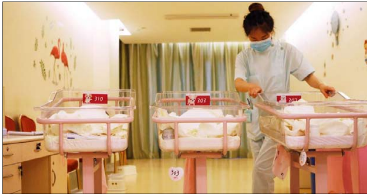
إحدى العائلات تتولى رعاية الأطفال حديثي الولادة في مستشفى توليد في شنغهاي

حقوق المرأة، الخاسر الأكبر؟ هل يمكن أن تتحول هذه الرغبة في الأطفال، مع ذلك، إلى ضغط على الشباب، وخاصة على