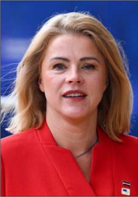
رئيسة وزراء لاتفيا إيفيكا سيلينا

القادة فجأة بالقول: لقد مر وقت طويل منذ آخر مرة تحدثنا فيها مع بوتين، يجب علينا استئناف الحوار معه، وهو يعتقد أن أوروبا يمكن أن تلعب دوراً في المفاوضات، ولكن بشرط أن تستق الدول الأعضاء الـ 27 جهودها. في المقابل، في إيطاليا، يتوافق اقتراح استئناف الحوار بين الأوروبيين وموسكو مع موقف رئيسة الوزراء، جورجيا ميلوني، التي صرحت في يناير-كانون الثاني بأن إيمانويل ماكرون كان «مُحَقاً»، في دعوته إلى هذا التطور. ويبقى السؤال مطروحاً: كيف نمضي قدماً؟ قالت جورجيا ميلوني، التي كانت قد أعربت عن دعمها لتعيين مبعوث خاص من الاتحاد الأوروبي لأوكرانيا؛ إذا ارتكبت خطأ إعادة فتح المحادثات مع روسيا والتصرف بشكل غير منسق، فسنكون بذلك نهدى معروفًا لبوتين. منذ توليها السلطة عام 2022، اضطرت رئيسة الوزراء الإيطالية إلى التعامل مع أحد أحزاب انطلاقتها، حزب الرابطة الليمين المتطرف، الذي ظل متشككاً في التزام روما تجاه كييف، بعد أن تبنى موقفاً مؤيداً للكرملين بشدة قبل الحرب الشاملة ضد أوكرانيا.