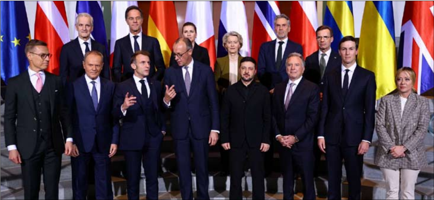
انقسام بين قادة أوروبا حول الحوار مع الرئيس بوتين