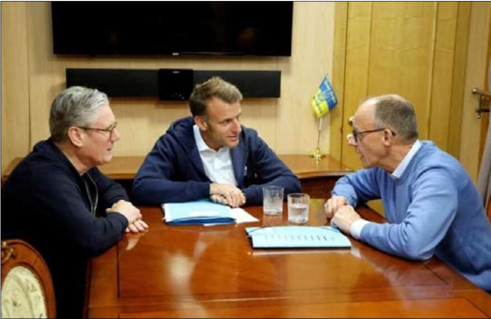
نقاش حول أوكرانيا بين قادة فرنسا وألمانيا والمملكة المتحدة