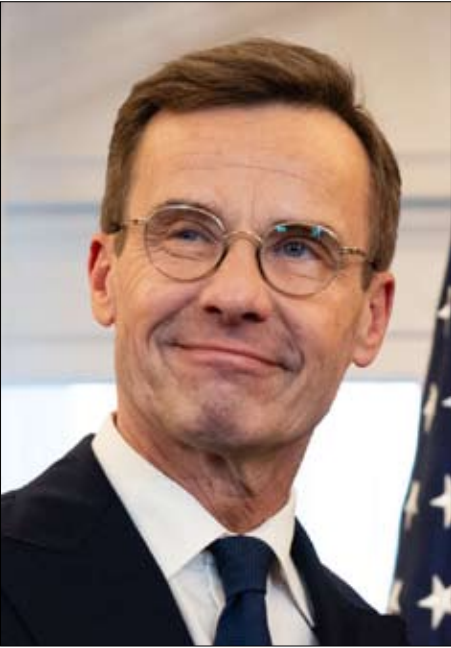
رئيس الوزراء السويدي أولف كريسترسون

مع يورونيوز أن الوقت قد حان لبدء حوار: «يجب أن نكون على طاولاة المفاوضات، لأن الأوكرانيين أنفسهم قد بدأوا المفاوضات. فلماذا لا يتفاوض الأوروبيون؟» لا بد لنا من أن نكون واضحين، مع هذا الرأي، قائلاً: «مع أننا لا نخوض حرباً مباشرة ضد روسيا، إلا أننا نندعم أوكرانيا منذ سنوات عديدة وما زلنا ندمعها. لذا، يجب أن يكون لنا رأي في الأمر. ولكننا مرة أخرى، تأخرنا قليلاً». وقد استكر وزير الخارجية، مارغوس تساخنا، هذه التصريحات في تأييده، قائلاً: «إن الرغبة في بدء محادثات مع بوتين في الكرملين وإقامة علاقات جيدة معاً أمر كارثي لأوكرانيا. ويهدد أمن أوروبا بشكل مباشر، ويتناقض تماماً مع سياستها الحالية القائمة على الضغط والعزل». وفي حديثه على قناة LRT-TV يوم الثلاثاء 10 فبراير، انتقد الرئيس الليتواني، جيتاناس ناوسيدا، مبادرات بعض الدول لاستئناف الحوار مع موسكو قائلاً: «لا يميز موقف أوروبا عندما يبدأ بعض