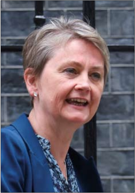
وزيرة الخارجية البريطانية إيفيت كوبر

القادة فجأة بالقول: لقد مر وقت طويل منذ آخر مرة تحدثنا فيها مع بوتين، يجب علينا استئناف الحوار معه، وهو يعتقد أن أوروبا يمكن أن تلعب دوراً في المفاوضات، ولكن بشرط أن تستق الدول الأعضاء الـ 27 جهودها. في المقابل، في إيطاليا، يتوافق اقتراح استئناف الحوار بين الأوروبيين وموسكو مع موقف رئيسة الوزراء، جورجيا ميلوني، التي صرحت في يناير-كانون الثاني بأن إيمانويل ماكرون كان «مُحَقاً»، في دعوته إلى هذا التطور. ويبقى السؤال مطروحاً: كيف نمضي قدماً؟ قالت جورجيا ميلوني، التي كانت قد أعربت عن دعمها لتعيين مبعوث خاص من الاتحاد الأوروبي لأوكرانيا؛ إذا ارتكبت خطأ إعادة فتح المحادثات مع روسيا والتصرف بشكل غير منسق، فسنكون بذلك نهدى معروفًا لبوتين. منذ توليها السلطة عام 2022، اضطرت رئيسة الوزراء الإيطالية إلى التعامل مع أحد أحزاب انطلاقتها، حزب الرابطة الليمين المتطرف، الذي ظل متشككاً في التزام روما تجاه كييف، بعد أن تبنى موقفاً مؤيداً للكرملين بشدة قبل الحرب الشاملة ضد أوكرانيا.