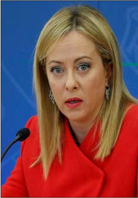
رئيسة الوزراء الإيطالية جورجيا ميلوني

التي تُعد مع ذلك جوهر المناقشات، ولا سيما مصير دونباس، التي لا يزال الروس يطمعون بها بالكامل؛ ولم تقدم أي تنازلات بشأن إشراك الأوروبيين في المفاوضات». في البداية، فكر إيمانويل ماكرون في اتباع نهج مشترك مع ألمانيا والمملكة المتحدة - ضمن مجموعة الدول الأوروبية الثلاث - لكن شريكه ما زالاً مترددين، على الرغم من اعتراف المستشار فريدريش ميرز، في الأساس من فبراير-شباط، بأن المبادرة قد نسقت معه بشكل وثيق، وأصر ميرز على ضرورة «تنسيق» المفاوضات بالدرجة الأولى مع الولايات المتحدة وأوكرانيا، رافضاً فتح قنوات نقاش موازية، وفي داخل الحزب الاشتراكي الديمقراطي الألماني، الشريك في الائتلاف الحاكم والمعروف بمواقفه السلمية، تُسمع أصوات مؤيدة للحوار مع موسكو. فقد دعا أديس أحمدوفيتش، المتحدث باسم الحزب للشؤون الخارجية في البوندستاغ، في 28 يناير-كانون الثاني، الأوروبيين إلى «التواجد على طاولة المفاوضات». وخارج الاتحاد الأوروبي، تبدي المملكة المتحدة أيضاً شكوكاً. فقد صرّحت وزيرة