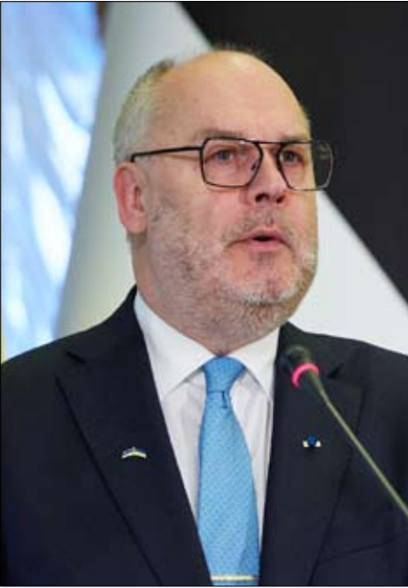
الرئيس الإستوني آلار كاريس

مع ذلك، لا تزال الآراء منقسمة حتى الآن حول جدوى وأليات المشروع الذي يتبناه إيمانويل ماكرون، حتى مع وجود مسألة لم يعد استئناف الاتصالات من الحرام، بل بات يحظى باهتمام متزايد. إنه صراع تدفع فيه أوروبا لثمة دون أن تشارك فيه. يسعى ماكرون لضمان عدم وجود الولايات المتحدة