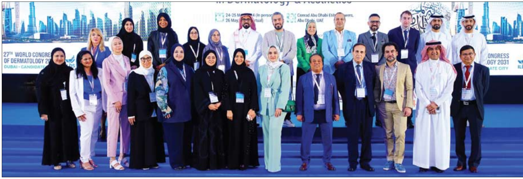
في ختام أعمال دورته العاشرة