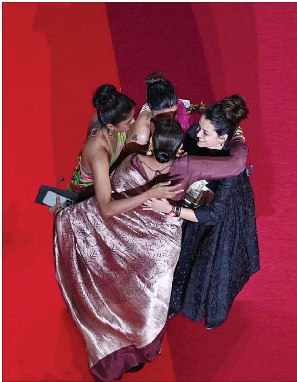
المخرجة الهندية بايال كابدايا تحتفل مع طاقمها بعد فوزها بالجائزة الكبرى عن فيلم «كل ما نتخيله» كضوء، خلال الحفل الختامي للدورة الـ77 لمهرجان كان السينمائي.

يعتقد الكثيرون أن السكر البني قد يكون أقل ضرراً من السكر الأبيض على الصحة لاحتوائه على سعرات أقل، فهل هذه المعلومة صحيحة من الناحية العلمية؟ وحول الموضوع قال الطبيب الروسي، ألكسندر مياسنيكوف خلال برنامجه الطبي الذي يقدمه على قناة روسيا: "أعتقد بأنه لا يوجد فرق يذكر بين السكر الأبيض والسكر البني من حيث عدد السعرات الحرارية، فهو في كلا النوعين متقارب إلى حد كبير، لذا فإن تأثيرهما متشابه على الجسم عند اتباع الحميات الغذائية". وأضاف: "الاختلاف بين هذين النوعين يكمن في المصدر الخام لإنتاجهما وفي طريقة المعالجة، فالسكر الأبيض يتم الحصول عليه غالباً من الشمندر السكري، والسكر البني يستخرج عادة من قصب السكر أو الشمندر". وتشير العديد من الدراسات العلمية إلى أن النوعين المذكورين من السكر متشابهان إلى حد كبير من حيث احتوائهما على السعرات الحرارية، لكن هناك اختلاف في طريقة معالجتهما، فالسكر الأبيض يتعرض لمعالجات معالجة أكثر، كما أن السكر البني يكون أحياناً عن مزيج من السكر الأبيض وبيس السكر، وهذا ما يعطيه اللون الغامق. وللتقليل من أضرار السكر المعالج على الجسم ينصح بعض الأخصائيي التغذية بالاستعاضة عنه بالعلس أو بتناول الفواكه الطازجة لكن بكميات معقولة.