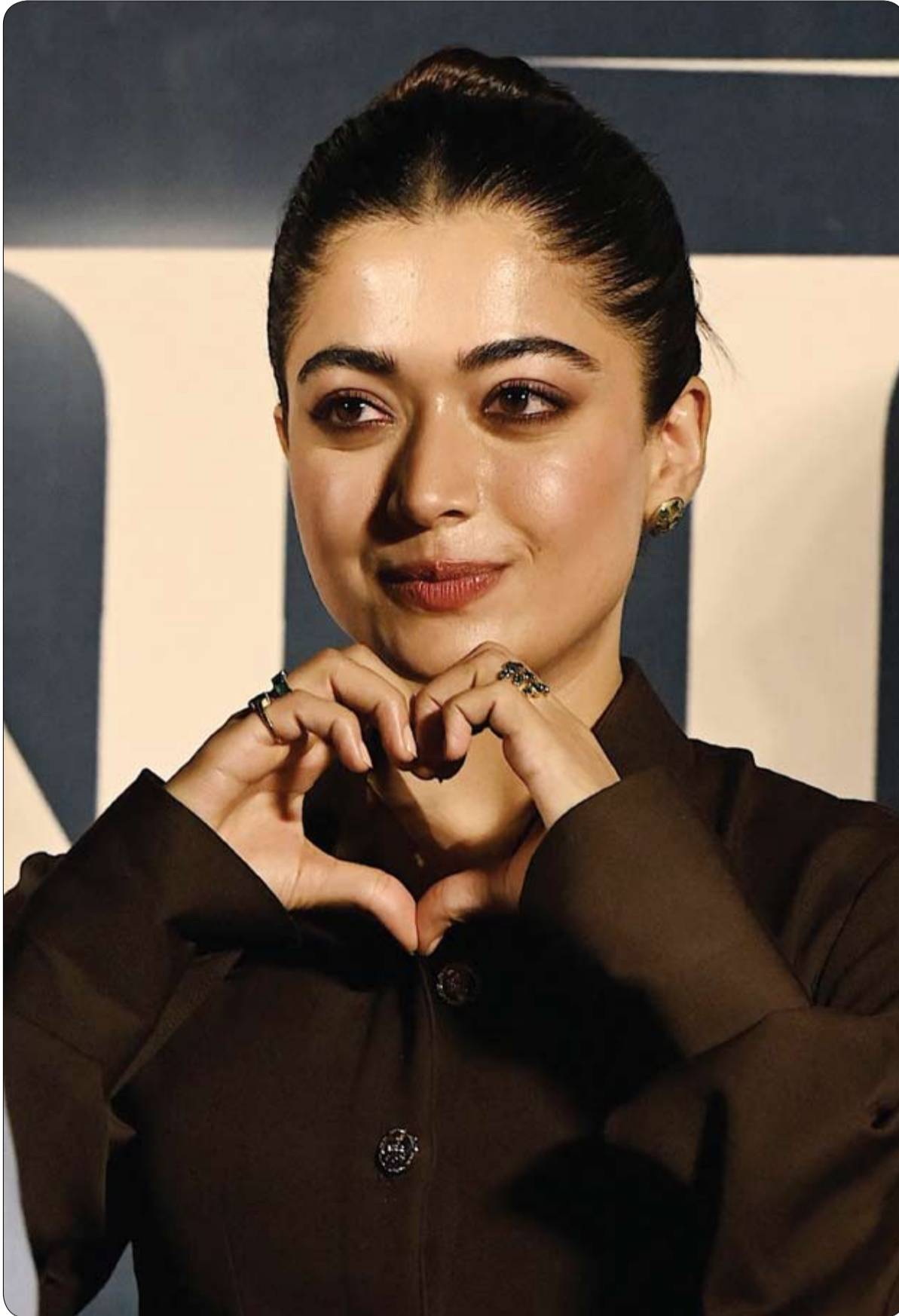
الممثلة الهندية راشميكا ماناندا لدى حضورها حفل إطلاق فيلمها القادم «سكندر» في مومباي. (ا ف ب)

الحظر ليشمل جميع المواطنين الصينيين في الصين.