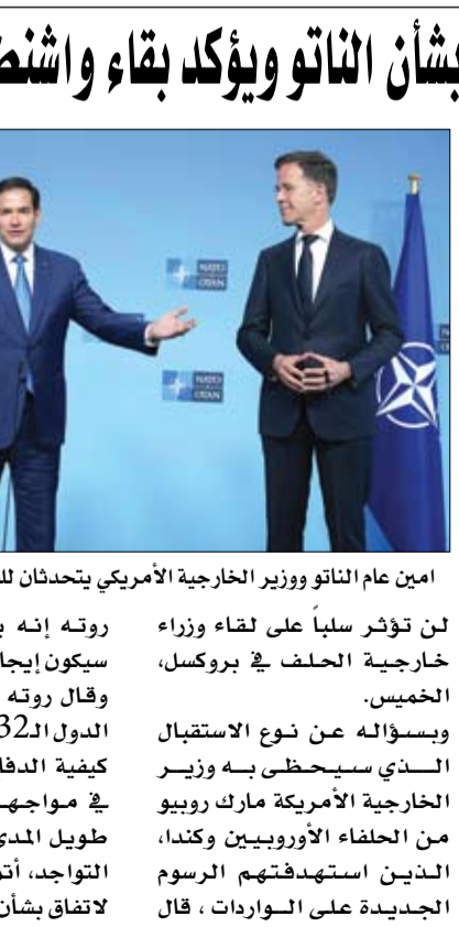
امين عام الناتو ووزير الخارجية الأمريكي يتحدثان للصحفيين في بروكسل