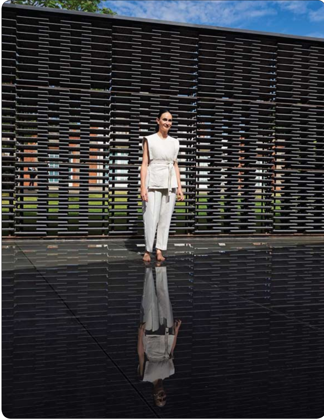
المعمارية المكسيكية فريدا إسكوبيدو خلال المعاينة الصحفية لجمع سريبتين غاليري الذي تم تركيبه حديثاً، في حدائق كنسينغتون بغرب لندن.

يحتوي اللوز على نسبة مرتفعة من المغنيسيوم، وهو من أهم المعادن التي تساعد في علاج الصداع وخاصة الصداع النصفي.