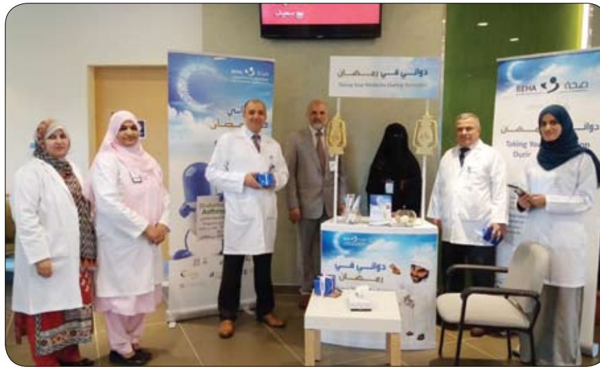
تجاوب يعكس الثقافة الصحية لدى الجمهور

ولفت إلى أهمية العلاج الطوعي من الإدمان الذي تسعى شرطة أبوظبي إلى التعرف به في المجتمع ضمن مبادرة "عندنا الحل" والذي يهدف إلى إعفاء المدمن من عدم إقامة الدعوى الجنائية إذا تقدم من تلقاء نفسه للعلاج مؤكداً حرص شرطة أبوظبي على الاستفادة من المتكثبات المجتمعية، في تعزيز التوعية لحماية الأسر من وقوع أبنائها، لا سيما الشباب والمراهقين في براثن الإدمان باعتبارهم الشريحة الأكثر استهدافاً من قبل مروجي المخدرات.