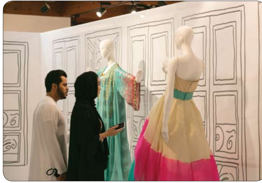
يستكشف الأساليب المتنوعة في تصميم الأزياء