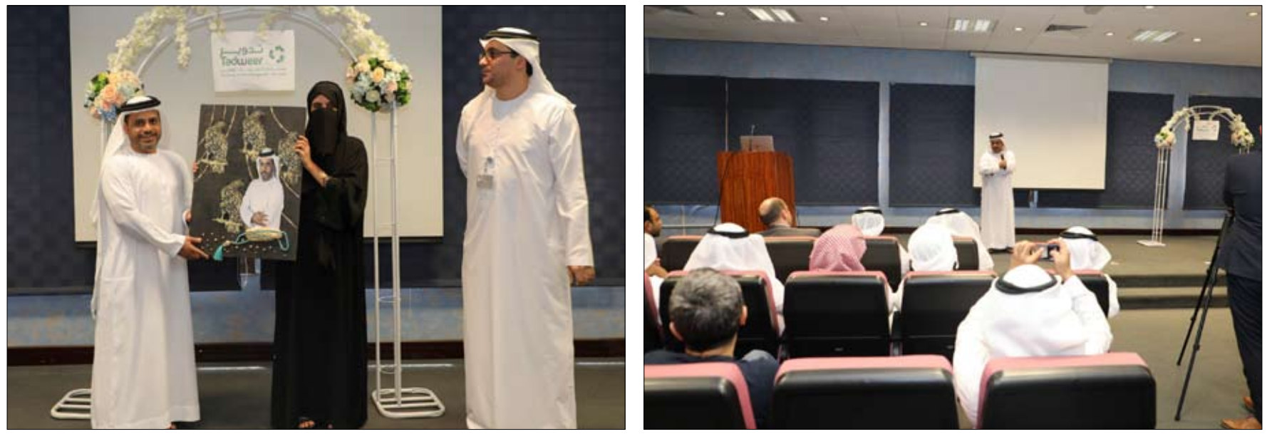
في إطار دعمها لجهود المسؤولية المجتمعية للشركات والأفراد

يشار إلى أن دولة الإمارات حرصت ولا زالت على تعزيز مساهمة أداء قطاع الشركات الصغيرة والمتوسطة من خلال مبادرات وبرامج وأنظمة تساعد في توفير مصادر تمويل لها.