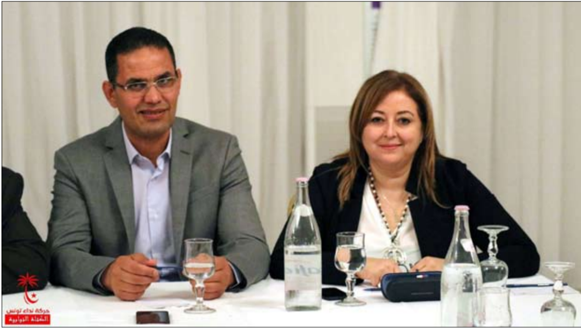
الحرباوي عملية سطو مسلح