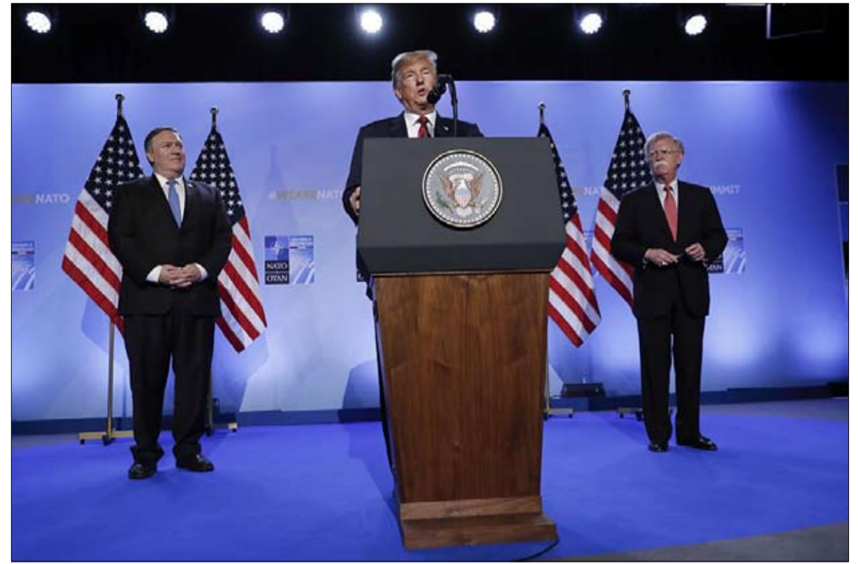
ترامب فرض ندوته الصحفية