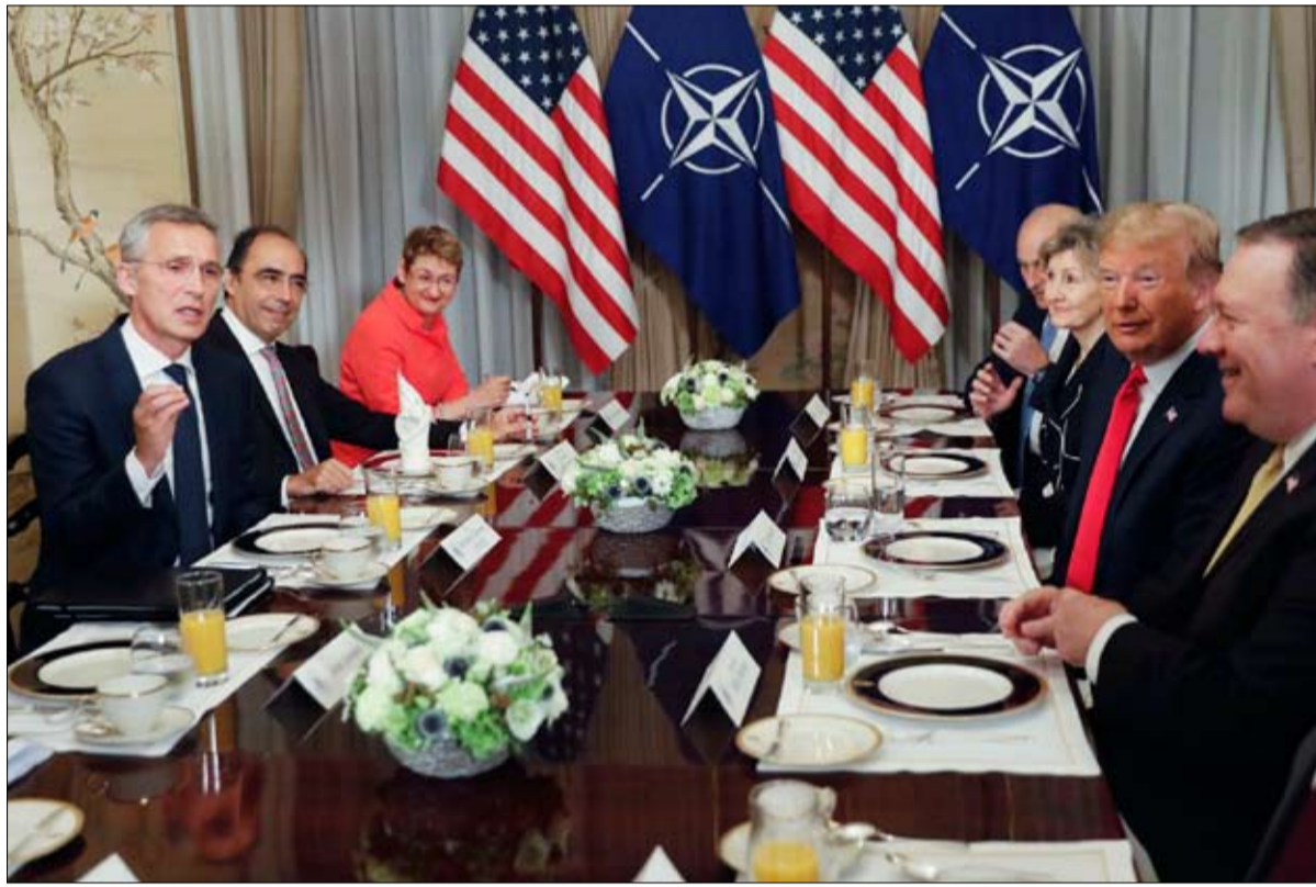
جلسة عمل مع الامين العام للناتو