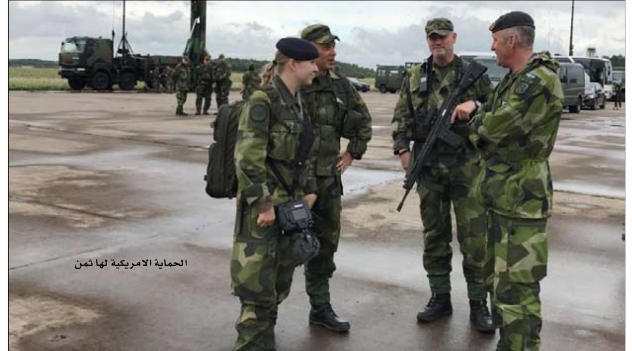
الحماية الامريكية لها ثمن

الأمّن والتضامن العابر للأطلسي" بأسلوب ومفردات دبلوماسية جدا، حسب ذوقه، مع الالتزام بـ "تحمل المسؤولية في الدفاع المتبادل"، لم يتردد في الدفاع البيت الأبيض، كمقدم بارع لبرامج تلفزيون الواقع، في المطالبة بمؤتمر صحفي قبل جميع شركائه لتقديم مسرحيته، مع تسريب عزمه الانسحاب من التحالف الذي تأسس عام 1949 إذا لم يبذل الحلفاء جهدا ماليا اضافيا يصل إلى 4 بالمائة من ناتجهم المحلي الإجمالي لتمويل قواتهم المسلحة - وهو رقم لم يسبق ذكره من قبل، بل حتى الولايات المتحدة الأمريكية لم تصله. تصريحات انتصارية