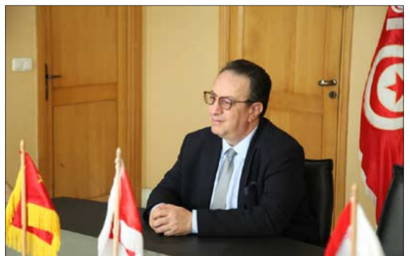
السبسي الابن هل هو الحصار الاخير؟