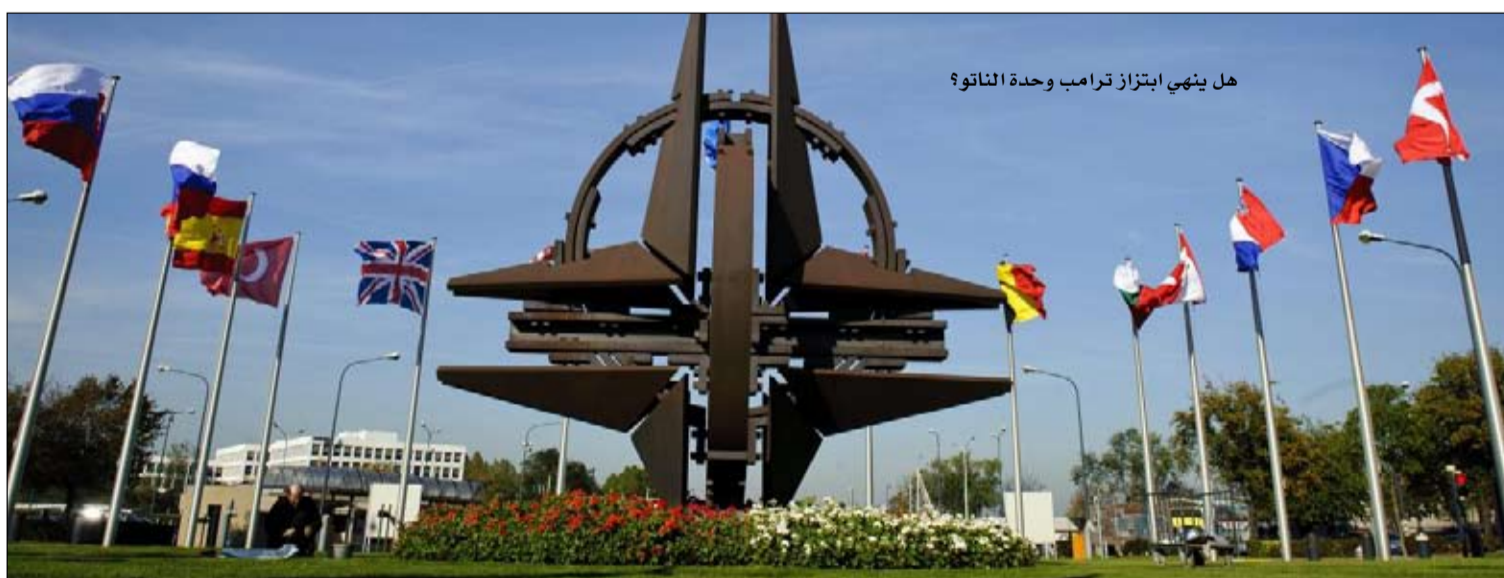
هل ينهي ابتزاز ترامب وحدة الناتو؟

في الوقت الحالي أي خيار سوى استيعاب هذا الحامي المصمم على الحصول على عائدات وارباح ملموسة وحقيقية مقابل قواته المنتشرة في القارة العجوز. وحدها أنجيلا ميركل، التي استهزأ بها ترامب بسبب محدودية الميزانية العسكرية الألمانية، واعتماد بلادها على الغاز الروسي، وقفت في وجهه وعارضته علنا الأربعا، بالتذكير أنها، على الأقل، تعرف ماذا تعني الحياة في دولة ضفها الاتحاد السوفياتي. كم من الوقت سيستمر هذا الابتزاز الترمبي الصارخ؟ الرئيس الفرنسي إيمانويل ماكرون، الذي أصدر أمس الجمعة قانون البرمجة العسكرية الفرنسية للسنوات السبع المقبلة، متضمنا 16 مليار يورو إضافية من الائتمان و2 بالمائة من الناتج المحلي الإجمالي للدفاع، فضل، في