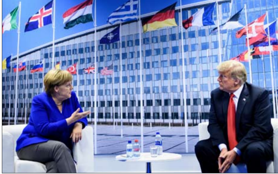
ميركل تصدت علنا للبيع الأمريكي

- من المستحيل معرفة ما يفكر به ترامب بشأن الحلف، ومعرفة رأيه في التهديدات العالمية