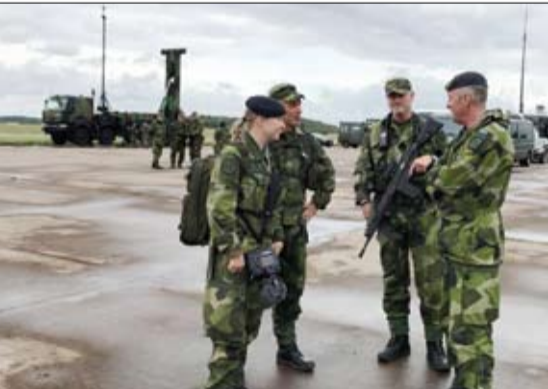
الحماية الامريكية لها ضمن

تجددت التظاهرات في بعض مناطق محافظة البصرة، أمس، حيث قطع عدد من المحتجين الطريق المؤدي إلى ميناء أم قصر، أحد أكبر موانئ العراق مطالبين بتنفيذ مطالبهم، وذلك عقب زيارة رئيس الوزراء العراقي، حيدر العبادي، للمحافظة ولقاءه بالقادة الميدانيين. وكان عدد من شيوخ ووجهاء البصرة قد هددوا، الخميس، بتوسيع احتجاجاتهم لتشمل الموانئ والمنافذ البرية والحقول النفطية في حال لم تتم الاستجابة لمطالبهم بتوفير فرص عمل وتحسين منظومة الإمداد بالكهرباء. ووصل العبادي، الجمعة، إلى محافظة البصرة جنوبي البلاد، سعيًا إلى تهدئة الاحتجاجات.