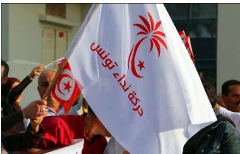
نداء تونس في عين الاعصار