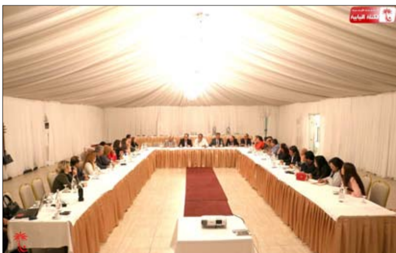
الكتلة البرلمانية من التقلص الى التذمر