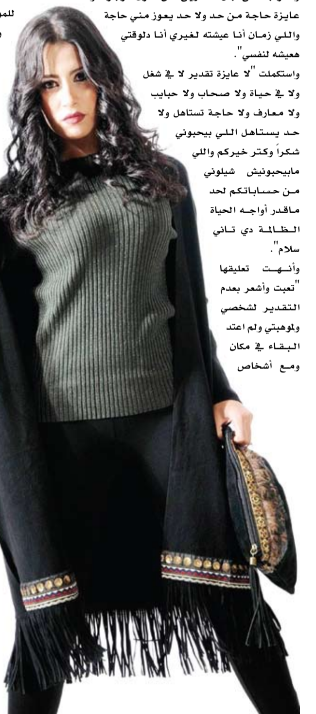
وأيضاً من الفنانين الذين قرروا

وأنهت تعليقها "تعبت وأشعر بعدم التقدير لشخصي ولوهبتي ولم اعتد البقاء في مكان ومع أشخاص