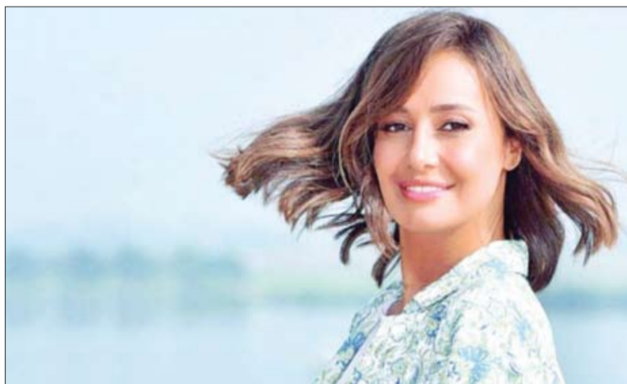
صفحة على موقع يوتيوب.

بينما قصة الفنانة حلا شيحة مع الفن مليئة بالإثارة، حيث اعتزلت التمثيل تماماً لمدة 13 عاماً وكان طيلة هذه الفترة ترى أن التقرب من الله وعبادته أفضل من عودتها إلى التمثيل، ولكن بعد قرار انفصالها عن زوجها الكندي قررت أن تعود إلى التمثيل، ولكن لم تمض كثيراً حتى قدمت فيلم "مش أنا" مع تامر حسني وقررت بعدها أن تعتزل وارتبطت بالداعية معز مسعود وهاجمت الفن وحرمته وتبرأت من الفيلم بسبب بعض المشاهد التي قدمتها وظهرت فيها وهي تحتضن تامر حسني، وتسبب هذا الأمر في هجوم حاد عليها من قبل الوسط الفني والذي أعلن أن الفن ليس حراماً.