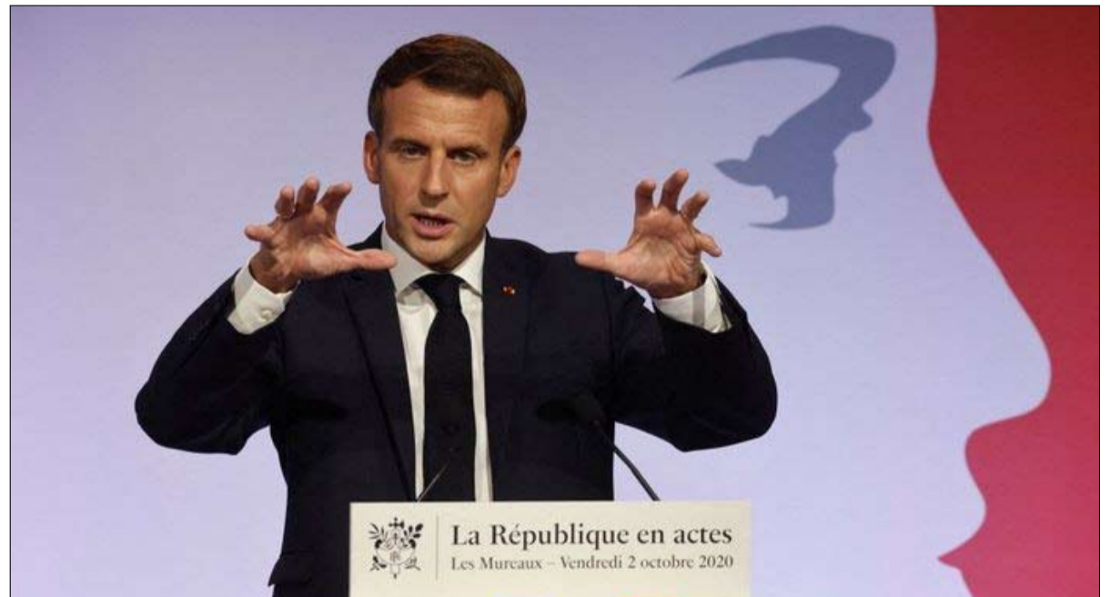
فوز ماكرون سيكرس النموذج الأمريكي

بتهم يقول أنصاره إنها مفبركة تتعلق بالاشتباه بارتكابه جرائم جنسية بحق أطفال، سيمضي المورخ البالغ 65 عاماً حالياً عامين إضافيين في السجن. وتعد "ميموريال" هيئة فضفاضة مكونة من منظمات مسجلة محلياً، فيما تحتفظ "ميموريال إنترناشونال" بأرشفات الشبكة الواسعة في موسكو وتتسق عملها. وأمضت المجموعة سنوات في توثيق فظائع ارتكبتها الاتحاد السوفياتي، خصوصاً في شبكة من معسكرات الاعتقال السوفياتية "الغولاج". كما دافعت "ميموريال" عن حقوق السجناء السياسيين والمهاجرين وغيرها من الفئات المهمشة فيما أضاءت على الانتهاكات، خصوصاً تلك التي ارتكبت في منطقة شمال القوقاز الضطرية التي تضم الشيشان. ويفيد أنصارها بأن إغلاقيها سيطوي صفحة حقبة إعادة الديمقراطية في روسيا ما بعد الحكم السوفياتي، والتي سيمر عليها 30 عاماً هذا الشهر.