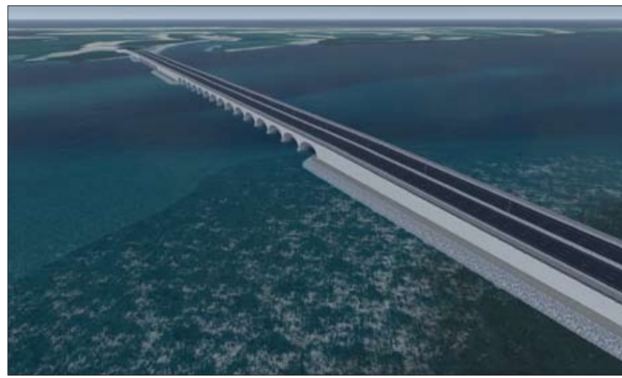
المتأثرة بأعمال المشروع، وسينفذ مشروع تطوير جزيرة السينية على مساحة إجمالية

تبلغ /30.000.000/ قدم مربعة، الأمر الذي من شأنه أن يدعم عجلة نمو وتطوير ونهضة إمارة أم القيوين، كوجهة جذب تجارية وسياحية، من خلال تطوير مجمع فيلات فخمة مطلة على الواجهة المائية والفنادق، ومجموعة من خيارات الترفيه والتسليّة مستوحاة من نمط الحياة على الجزر. وأشارت "أم القيوين العقارية" إلى أن المشروع الذي تبلغ تكلفته الإجمالية 2.47 مليار درهم، يضم ما يقارب من 300 فيلا فاخرة مطلة على الواجهة المائية و250 تاون هاوس، و14 بناية تحتوي على ما يقارب من 570 وحدة سكنية، وفندقين، و85 هكتاراً من الحدائق والأماكن