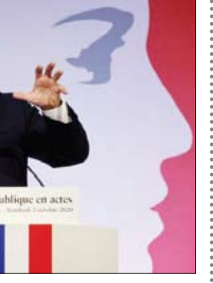
فوز ماكرون سيكرس النموذج الأمريكي

دمشق-أ ف ب: استهدف قصف جوي إسرائيلي فجر الثلاثاء ساحة الحاويات في مرفأ اللاذقية في غرب سوريا، وفق ما أفاد الإعلام الرسمي السوري. في ثاني استهداف من نوعه للمرفق الحيوي خلال شهر واحد. وخلال الأعوام الماضية، شنت إسرائيل مئات الضربات الجوية في سوريا، مستهدفة مواقع للجيش السوري وخصوصاً أهدافاً إيرانية وأخرى لحزب الله اللبناني، وقد استهدفت ميناء اللاذقية للمرة الأولى في السابع من ديسمبر (كانون الأول) الحالي.