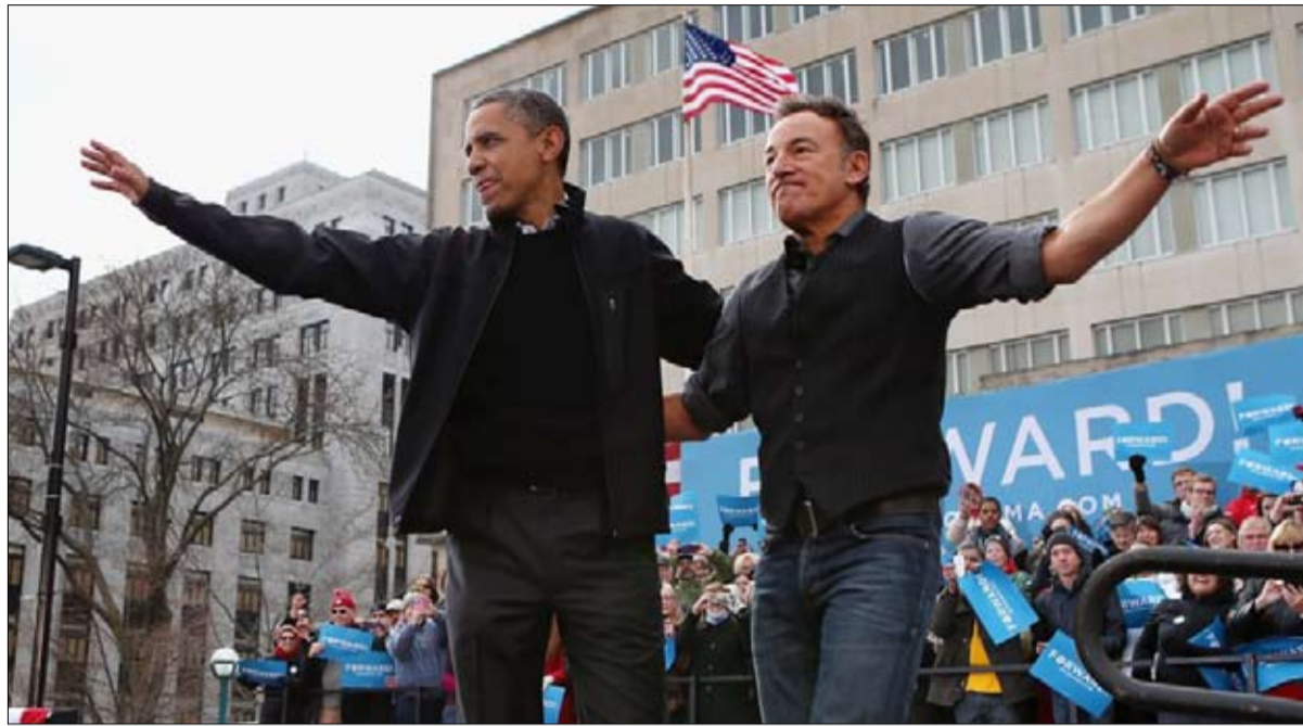
تحديث الحملات الأمريكية قبل انتخاب باراك أوباما