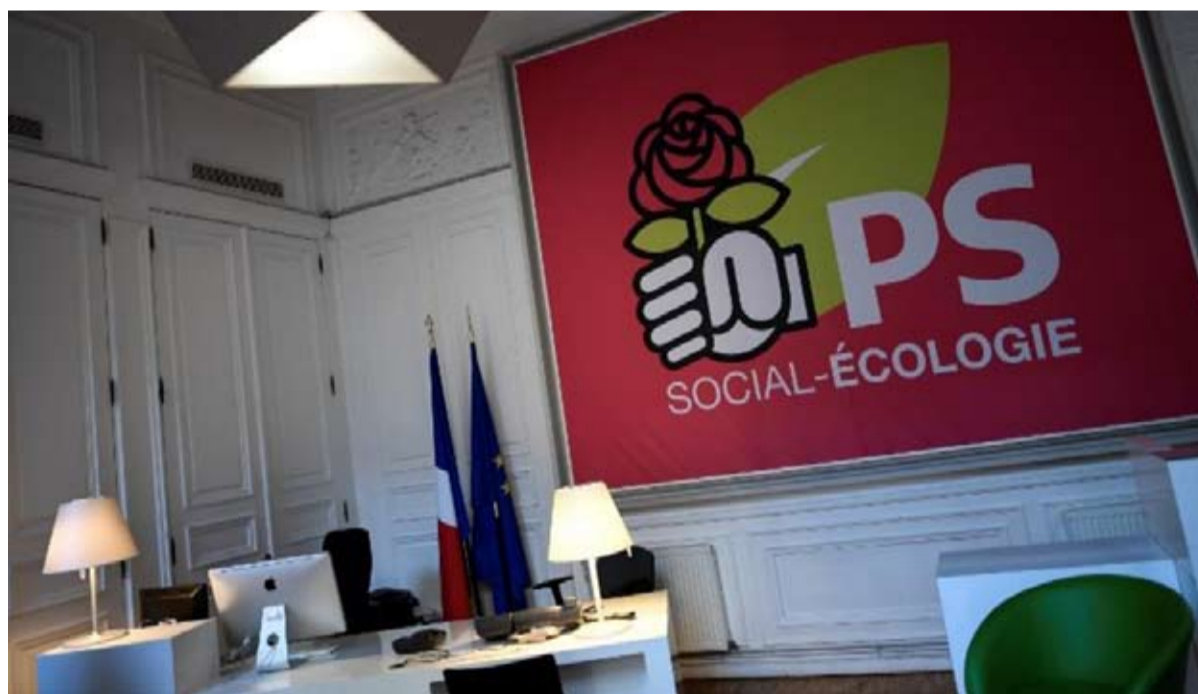
اقول الحزب الاشتراكي اريك اليسار الفرنسي

إضفاء الطابع الشخصي على السلطة من الواضح أن فرنسا والولايات