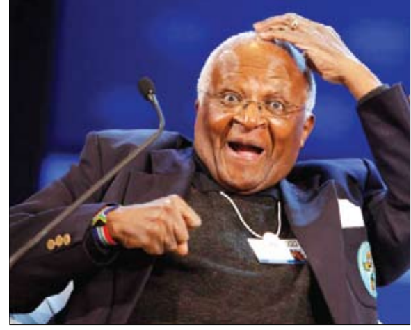
ديزموند توتو رحل عن عمر يناهز التسعين

الفجر -خيرة الشيباني دعونا تكون صنّاع سلام، وإذا أردنا السلام، فلنعمل من أجل العدالة... دعونا نحول سيفنا إلى محاربت. عام 1984، تحدث ديزموند توتو بهذه الكلمات إلى الأكاديمية التي منحتها جائزة نوبل للسلام. بعد 31 عاماً، تقاعد رئيس أساقفة جنوب إفريقيا السابق من الحياة العامة، لكن كفاحه غير المسلح من أجل العدالة والسلام استمر. موته يهز بلداً بأكمله؛ وفاة رئيس الأساقفة الفخري ديزموند توتو، هو فصل جديد من الحاد في وداع أمتنا لجيل من مواطني جنوب إفريقيا الاستثنائيين الذين ورتونا جنوب إفريقيا المحررة، هكذا كانت كلمات الرئيس سيريل رامافوزا لإعلان رحيل رجل الدين عن عمر يناهز التسعين. (التفاصيل ص10)