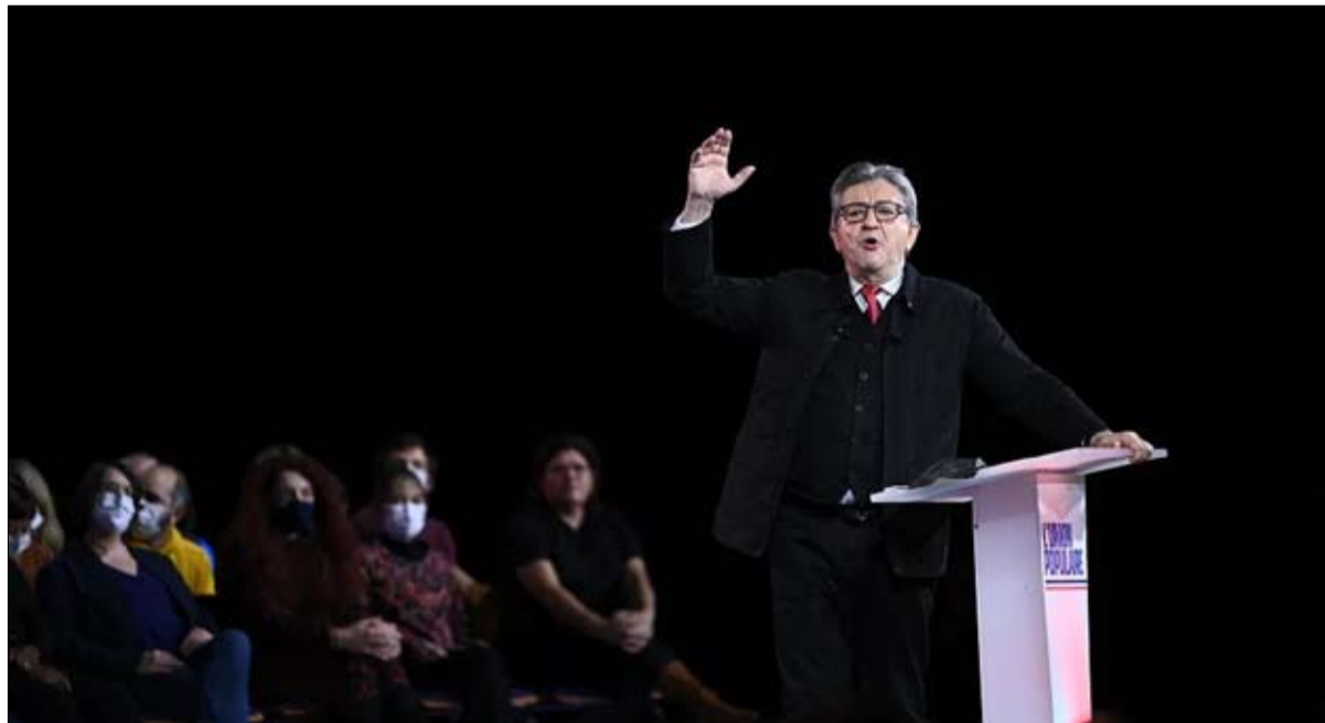
ميلينشون ثاني الناجح من المنسحبين من الحزب الاشتراكي