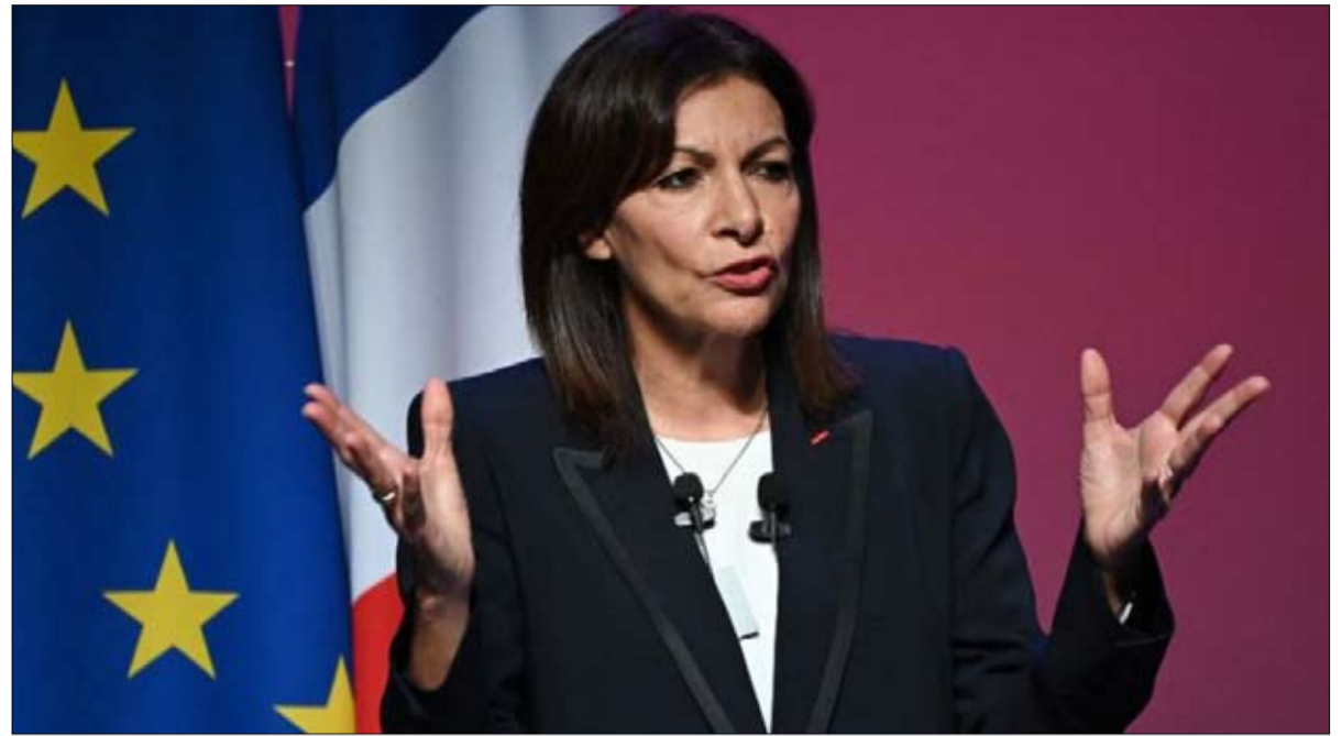
إن هيدالغو أزمة تنظيم وليست أزمة برنامج

الاستخدامات المؤسسية مسالة أخرى، حيث يساهم التقليد الأمريكي المتمثل في الانتخابات التمهيدية التي يوافق المرشحون على الخضوع لها في الحد من عدد الأحزاب المتنافسة في الانتخابات الرئاسية، وفي نفس الوقت تضمن التعبير بقياس الاختلافات. إنها أيضاً فرصة لاختبار موهبة الشخصيات التي يمكنها تقديم الخبرة كحكام ورؤساء دول.