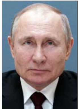
•• موسكو-أ ف ب

وصفه بايدن بأنه "قاتل"، ولم يقبل البيت الأبيض الاقتراح الذي بدأ كأنه مجرد امتداد للحرب الكلامية بين الرئيسين. عرضت فلندا الجمعة استضافة القمة المرتقبة بين بايدن وبوتين، وفق ما أعلنت الرئاسة في هلسنكي الجمعة. كما أعلنت النمسا وسبق أن استضافت فلندا قمة بين الرئيس الأميركي السابق دونالد ترامب وبوتين في تموز/يوليو 2018.