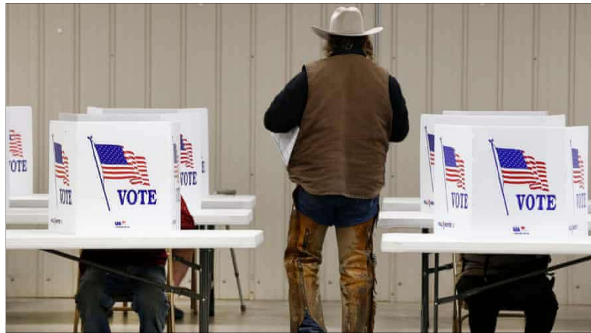
•• موسكو-أ ف ب

وتشمل العقوبات التي أعلن عنها الخميس، طرد عشرة دبلوماسيين روس ومنع الصراف الأميركي من أن تشتري مباشرة سندات خزينة تصدرها روسيا. واستهدفت العقوبات أيضا ست شركات تكنولوجيا روسية متهمة بدعم أنشطة القرصنة التي تقوم بها استخبارات موسكو. يأتي ذلك ردا على هجوم إلكتروني كبير في 2020 حوّلت واشنطن رسميا روسيا مسؤوليته، استخدم كناقول أحد منتجات شركة البرمجيات الأميركية سولارويندز لزراعة فجرة أمنية في الشرق الأوكراني. ودعت الدول الغربية موسكو إلى خفض عديد قواتها في المنطقة وأعربت عن دعمها لكيف، ويزور الرئيس الأوكراني فولوديمير زيلينسكي باريس للبحث في هذا الموضوع مع نظيره الفرنسي إيمانويل ماكرون وكذلك المستشار الألمانية أنغيلا ميركل. ولم تكف روسيا عن التأكيد أن مناوراتها في المنطقة ليست تهديدا لأحد، وتعتبر أنها رد مناسب لوجود المتزايد لحلف الأطلسي في أوروبا الشرقية ودعمه لأوكرانيا.