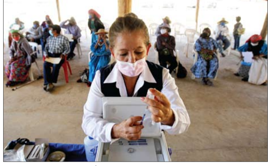
ماكسيكيون ينتظرون ممرضة تجهز جرعة من لقاح كورونا في أحد مراكز التطعيم

إعطاء 863 مليون جرعة على المستوى العالمي 3 ملايين وفاة بكورونا في العالم وسباق التلقيح يتواصل •• باريس-أ ف ب: تجاوز عدد الوفيات بكوفيد-19 السبب عتبة ثلاثة ملايين في العالم منذ ظهور فيروس كورونا في أواخر 2019. في وقت يتواصل السباق من أجل التلقيح. وتوفي مليونان و987 ألفاً و891 شخصاً على الأقل منذ أن أبلغ مكتب منظمة الصحة في الصين عن ظهور هذا المرض في أواخر كانون الأول ديسمبر 2019. بحسب حصيلة أعضائها الجمعة وكالة فرانس برس استناداً إلى مصادر رسمية. وقد لا تعكس هذه الأعداد إلا جزءاً بسيطاً من العدد الإجمالي الفعلي، لأنها تستند إلى التقارير اليومية الصادرة عن السلطات الصحية في كل بلد. وتستثني المراجعات اللاحقة من قبل الوكالات الإحصائية. وسجلت حملات التلقيح وهي متفاوتة جداً بحسب البلد، على المستوى العالمي حقق قرابة 863 مليون جرعة بحسب تعداد أجزته وكالة فرانس برس حتى يوم الجمعة. وتعماني حملات التلقيح وهي السلاح الرئيسي