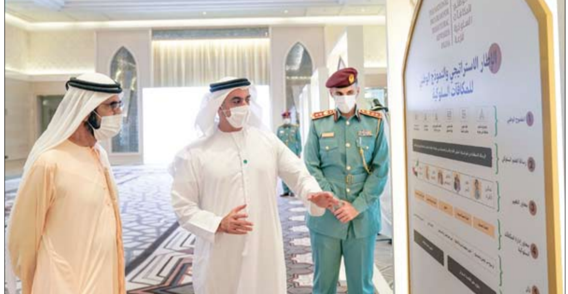
محمد بن راشد خلال إطلاقه برنامج المكافآت السلوكية

شهد تخريج الدفعة الأولى من دبلوم علم الاقتصاد السلوكي محمد بن راشد يطلق برنامج المكافآت السلوكية ويؤكد أهمية المواطنة الإيجابية لبناء المجتمعات •• دبي-وام: أطلق صاحب السمو الشيخ محمد بن راشد آل مكتوم نائب رئيس الدولة رئيس مجلس الوزراء حاكم دبي رعاه الله، صباح أمس في قصر الوطن