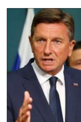
•• ليوبليانا-أ ف ب

بشدة أي تغيير للحدود (في المنطقة) لأنني لا أعتقد أنه يمكن تحقيق ذلك بطريقة سلمية"، داعيا ياناشا إلى توضيح موقفه علنا. لكن رئيس الوزراء المحافظ المثير للجدل لم يرد إلا من خلال تغريدات على تويتر أكد فيها أنه لم يلتق ميشال مؤخرا، بدون أن يقدم نفييا رسميا. وكتب أن "سلوفينيا تبحث بجديّة عن حل لتثمينة المنطقة ومنظور أوروبي لدول غرب البلقان".