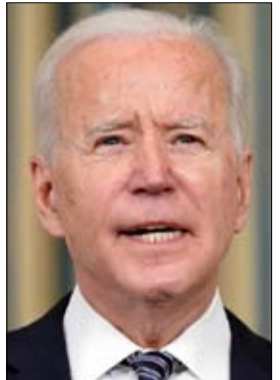
•• موسكو-أ ف ب

الشهر الماضي، استدعت روسيا سفيرها لدى الولايات المتحدة للتشاور بشأن مستقبل العلاقات مع واشنطن، في خطوة جاءت