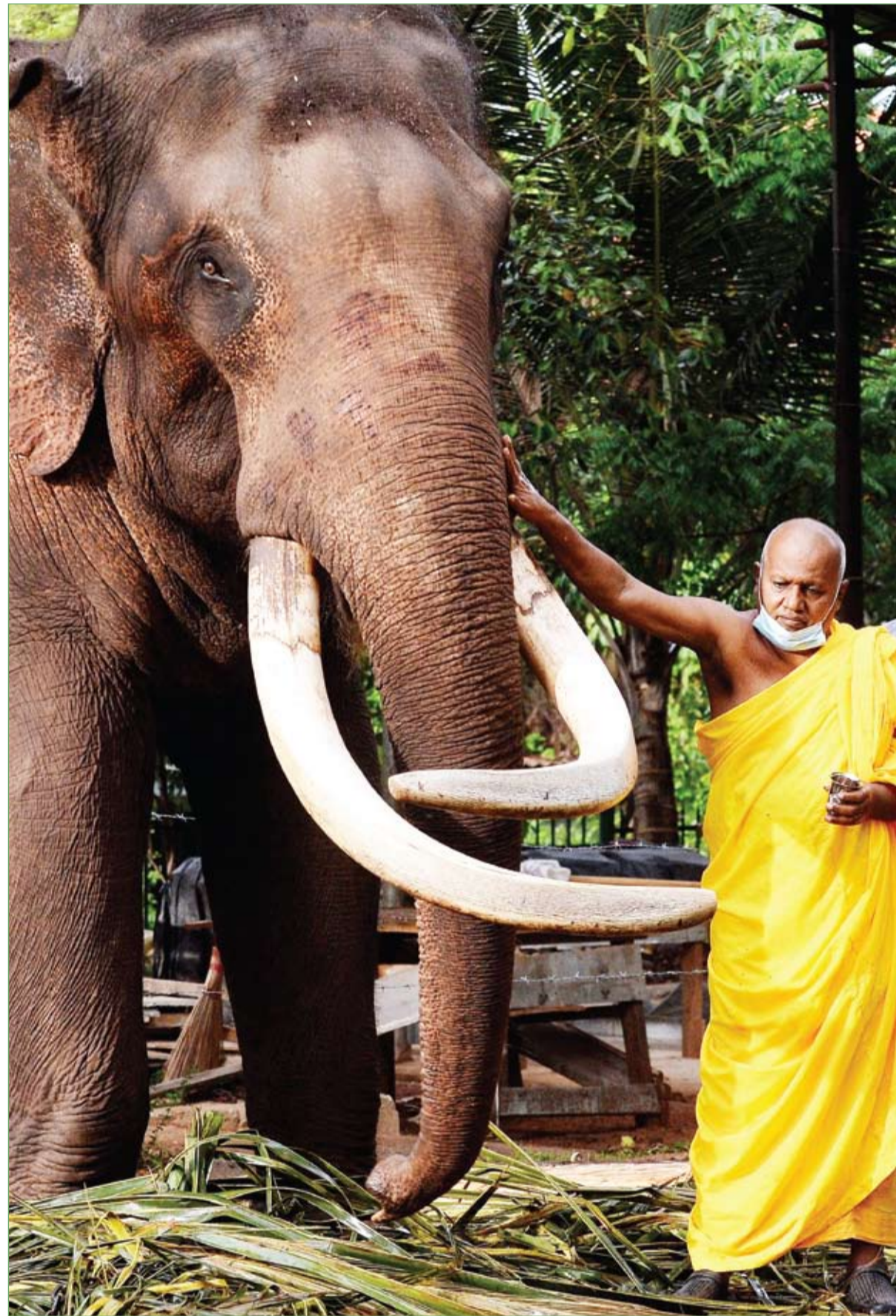
راهب سيريلانكي يمسح فيلاً كجزء من طقوس الاحتفال بالعام الجديد وفقاً للتقاليد في معبد كولومبو

ذكرت تقارير علمية، أن صورة غير مسبوقة التقطت، مؤخرا، للتثقب الأسود، وربما تساعد على فك اللغز المحير، بشأن الأشعة الكونية التي تعبر الفضاء بسرعة الضوء. وهذه الصور الأولى من نوعها، التقطت للتثقب الأسود المسمى بـM78، وأظهرت النفاثات المتدفقة التي تقوم بإصدار الضوء الممتد في ما يعرف بـ "المجال الكهرومغناطيسي". وتتراوح هذه التدفقات بين الترددات، وضوء مرئي، وصولا إلى أشعة "غامما" ذات الطاقة الهائلة، بحسب صحيفة "ديلي ميل". وما تكشفه هذه الصور هو أن كل تثقب أسود له قابله الخاص به، وهذا الأمر يرتبط أساسا بكثافة الضوء الذي يتنجح.