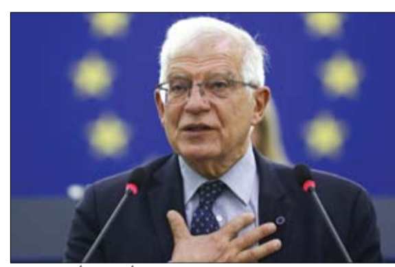
بوريل يحذر من اتساع رقعة الحرب في الشرق الأوسط (أرشيفية)

هذه الحرب على جنوب لبنان وامتدادها يوماً بعد يوم. وتابع نحن على أعتاب حرب يتسع نطاقها. وبدأت جماعة حزب الله في مهاجمة إسرائيل بعد فترة وجيزة من هجوم حركة المقاومة الإسلامية الفلسطينية (حماس) على جنوب إسرائيل في أكتوبر والذي أشعل فتيل أحدث حرب في غزة. وقال حزب الله إنه لن يوقف هجماته إلا بالتوصل لوقف لإطلاق النار في غزة. وفي وقت سابق من هذا الشهر، استهدفت الجماعة اللبنانية بلدات ومواقع عسكرية إسرائيلية بأكبر وإبسل من الصواريخ أكتوبر، والطائرات المسيّرة حتى الآن في إطار الأعمال القتالية بينهما، رداً على هجوم إسرائيلي تسبب في مقتل قائد كبير في حزب الله. وقال حسن نصر الله الأمين العام لجماعة حزب الله الأسبوع الماضي إنه في حال اندلاع الحرب (إسرائيل) لن يكون هناك مكان في الكيان (إسرائيل) بنمى عن صواريخنا ومسيراتنا، وهدد أيضاً قبرص العضو في الاتحاد الأوروبي للمرة الأولى ومناطق أخرى بمنطقة البحر المتوسط.