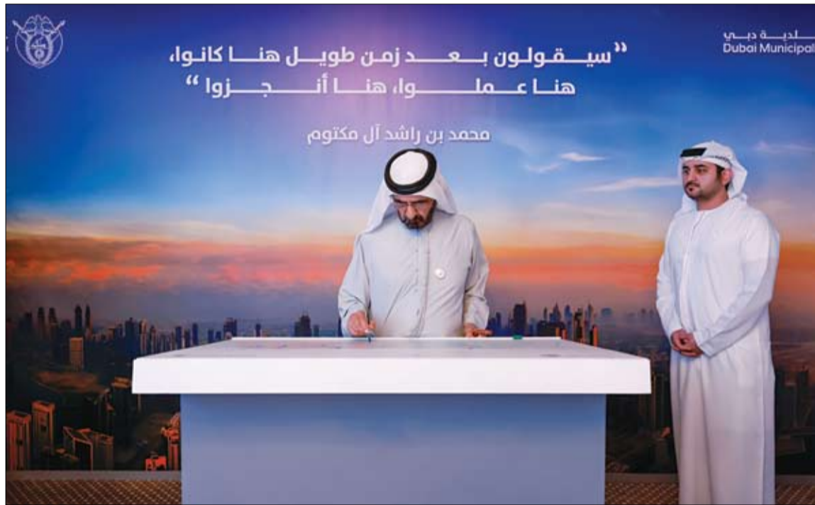
محمد بن راشد خلال اعتماده مشروع (تصريف) لتطوير شبكة تصريف مياه الأمطار في دبي

اعتمد صاحب السمو الشيخ محمد بن راشد آل مكتوم، نائب رئيس الدولة رئيس مجلس الوزراء حاكم دبي، «رعاه الله»، بحضور سمو الشيخ مكتوم بن محمد بن راشد آل مكتوم، النائب الأول لحاكم دبي نائب رئيس مجلس الوزراء وزير المالية، وسمو الشيخ أحمد بن محمد بن راشد آل مكتوم، النائب الثاني لحاكم دبي، مشروع (تصريف) لتطوير شبكة تصريف مياه الأمطار في دبي، أحد أكبر مشاريع البنية التحتية الاستراتيجية، والذي سيخدم إدارة منظومة تصريف مياه الأمطار في دبي، ويتكلف إجمالاً بـ 30 مليار درهم، لتغطي كافة مناطق الإمارة، معززة بذلك الطاقة الاستيعابية لعمليات التصريف بنسبة 700%. وأكد صاحب السمو الشيخ محمد بن راشد آل مكتوم أن مشاريع تطوير البنية التحتية المتقدمة والمستدامة عملية متواصلة وملازمة لنمو دبي وازدهارها، هدفها تصميم بنية نموذجية لتكثف الأحدث والأكثر أماناً وتطوراً ومرونة على مستوى العالم، وأكثر جاهزية لمواجهة التحديات المستقبلية، بما يحقق غاياتها في خدمة المجتمع وضمان السلامة والأمان والاستقرار لكل من يعيش على أرض دبي ويعمل بها. وقال صاحب السمو الشيخ محمد بن راشد آل مكتوم: الأخوة والأخوات .. اعتمدنا اليوم مشروعاً متكامل لتطوير شبكة تصريف الأمطار بدبي بكلفة 30 مليار درهم .. أكبر مشروع لتجميع مياه الأمطار في نظام واحد على مستوى المنطقة... والذي سيرفع الطاقة الاستيعابية لتصريف مياه الأمطار في الإمارة بنسبة 700% ويعزز جاهزية الإمارة لمواجهة التحديات المستقبلية المناخية. (التفاصيل ص 2)