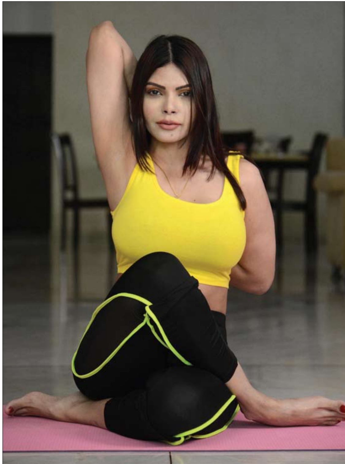
ممثلة بوليوود شيرلين تشوبرا تمارس اليوغا في منزلها في ممباي خلال الاحتفال باليوم العالمي لليوجا. ا ف ب

أوضحت الدكتورة يوليا نينايشيفا، أخصائية أمراض الدم، في حديث تلفزيوني، تأثير فصيلة الدم في ميل الجسم واستعداده للإصابة بأمراض القلب والأوعية الدموية والتخثر. ووفقا لها، الأشخاص الذين لديهم فصيلة الدم O هم أقل عرضة للإصابة بهذه الأمراض. وتقول، "عند تعرضهم إلى مسببات معينة، فإنهم أقل عرضة لتشكيل جلطات دموية، واحتشاء عضلة القلب أو الجلطة الدماغية". وتضيف موضحة، يوجد في دم هؤلاء الأشخاص عدد أقل من مسببات تخثر الدم في عامل التخثر الثامن وعوامل فون ويلبراند. وأعربت الخبيرة، عن أملها أن تصبح معرفة خصائص فصيلة الدم مسألة ضرورية، لأنه استنادا إلى خصائصها يتم اختيار المواد الغذائية وطرق العلاج والوقاية. وعامل التخثر الثامن Factor VIII-Factor VII هو عامل أساسي لتخثر الدم المعروف أيضاً بالعامل المكافح لهيموفيليا الدم Anti-hemophilic factor. ويتم ترميز وإنتاج العامل الثامن بواسطة الجين F-8. أما عامل فون ويل براند Von Willebrand factor، هو سلسلة من بروتين سكري متعدد، وهو كبير نسبياً بالنسبة لعوامل تخثر الدم الأخرى، ويتم تصنيع عامل فون ويل براند في الصفائح الدموية والأنسجة الأندوثيلية المكونة للأوعية الدموية على عكس باقي عوامل التخثر التي تصنع في الكبد.