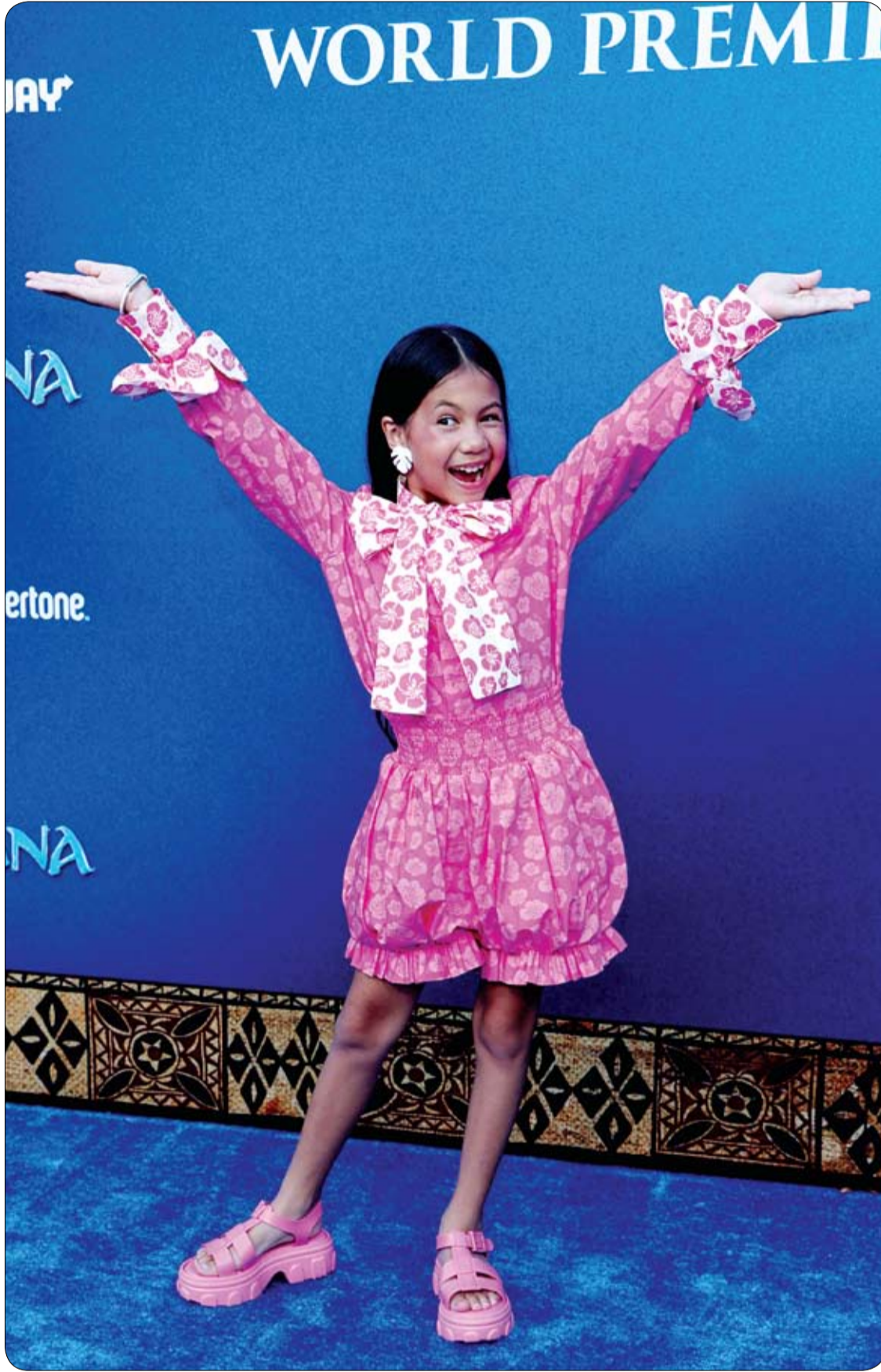
الممثلة الأمريكية مايا كيلوها لدى حضورها العرض العالمي الأول لفيلم ديزني «موانا» في هوليوود.

وأضاف المصدر «أن المؤشرات الأولية تدل على أن الدافع كان بهدف السرقة والاستيلاء على الإرث وأموال الضحية من داخل المنزل..»