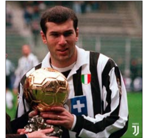
زين الدين زيدان