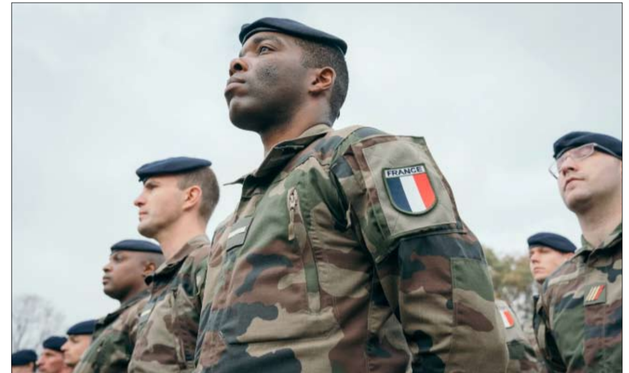
جندي افريقي يعمل في الجيش الفرنسي

مهاجرة، ولكن لا يوجد مدعون عامون أو قضاة، وبالمثل، هناك العديد من الشباب الفرنسيين من أصل إفريقي الذين يخدمون بشرف وامتنياز في الجيوش. لكننا بالكاد نرى أي عقداة أو جنرالات من نفس الأصل. والتناقض مع الدول المجاورة أو المماثلة، مثل بريطانيا العظمى والولايات المتحدة، لافت للنظر. إن الإصلاح الشامل