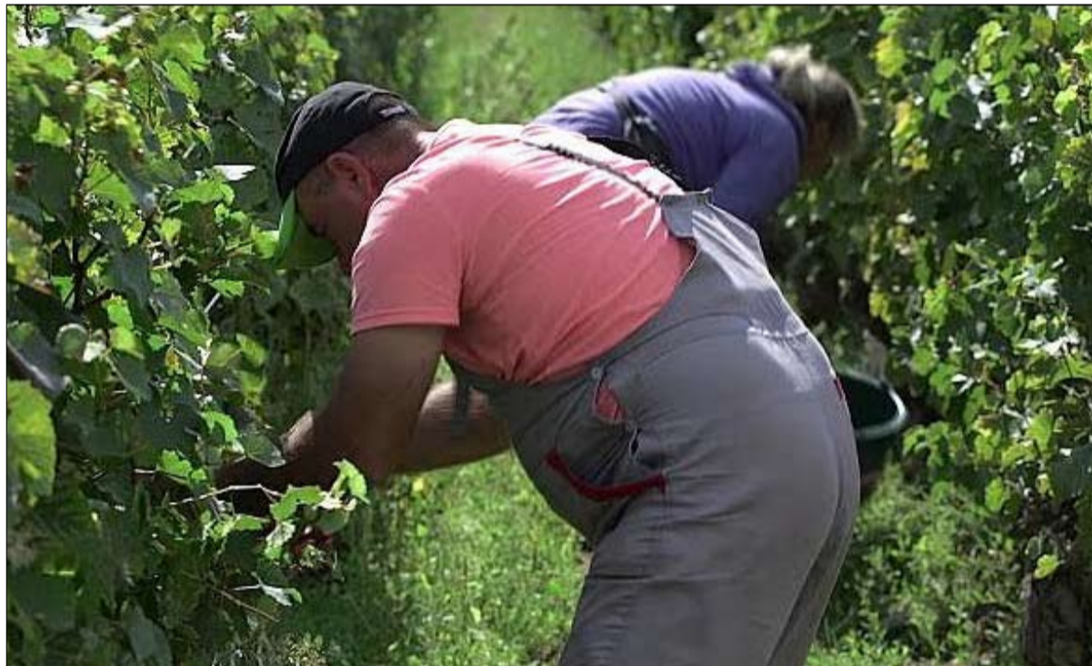
إفارقة في وظائف دينا في فرنسا

أرباح أرزقي مدير الأبحاث بالمركز الوطني للبحوث العلمية جان بيار لاندوا أستاذ علوم سياسية ترجمة : خيرة الشيباني عن صحيفة sohcE seL