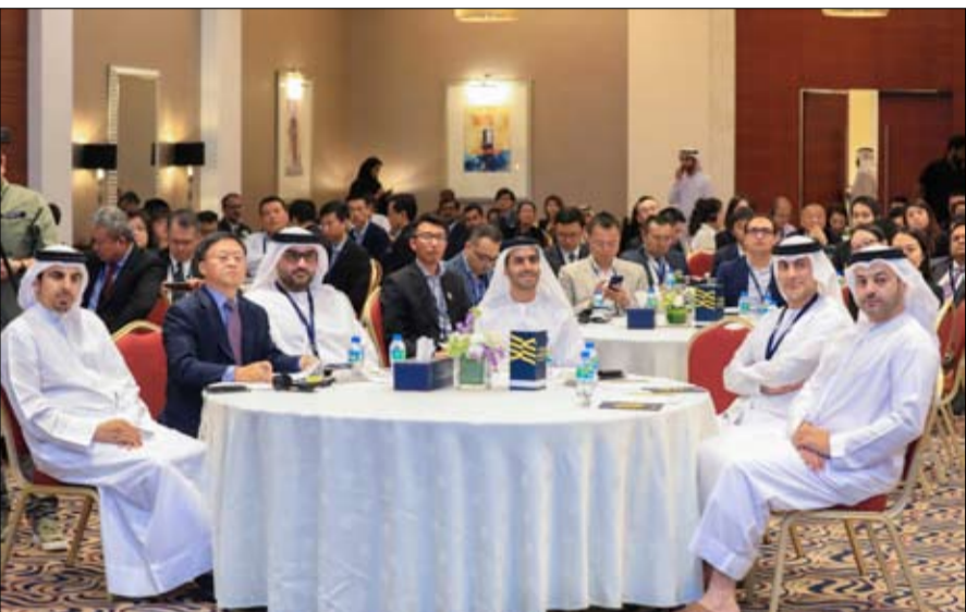
في ملتقى أعمال نظمه مكتب «استثمر في الشارقة»