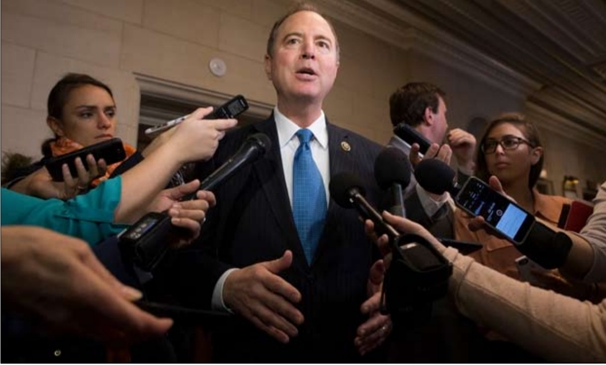
آدم شيف.. تصرفات غير نزيهة