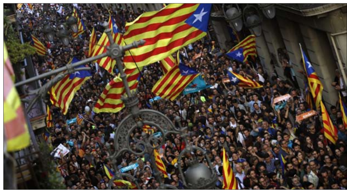
ينتصر للحوار مع الانفصاليين

اليمن المتطرف يتهم الاشتراكيين بالرغبة في «كسر وحدة إسبانيا، بتحالفهم مع الأحزاب الانفصالية»