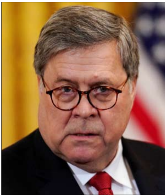
الاستماع الى وزير العدل

وعلى الرغم من أن واشنطن كررت تحذيراتها إلى سوريا لإهفال ومراقبة حدودها اليالفة 885 كيلومتراً مع سوريا، فإن أنقرة سمحت لداعش باستغلال أراضيها حتى 2016، حين ساعد الجيش التركي في تطهير آخر معقل للتنظيم بالقرب من الحدود مع تركيا. يظهر تصنيف وزارة الخزانة الأخير أن التنظيم استمر في عمله من داخل الأراضي التركية ومعظم فترات 2018. إن إخفاق أنقرة في قمع الشبكات الجهادية في تركيا هو مسألة خيار لا مسألة غياب كفاءة. منذ انقلاب