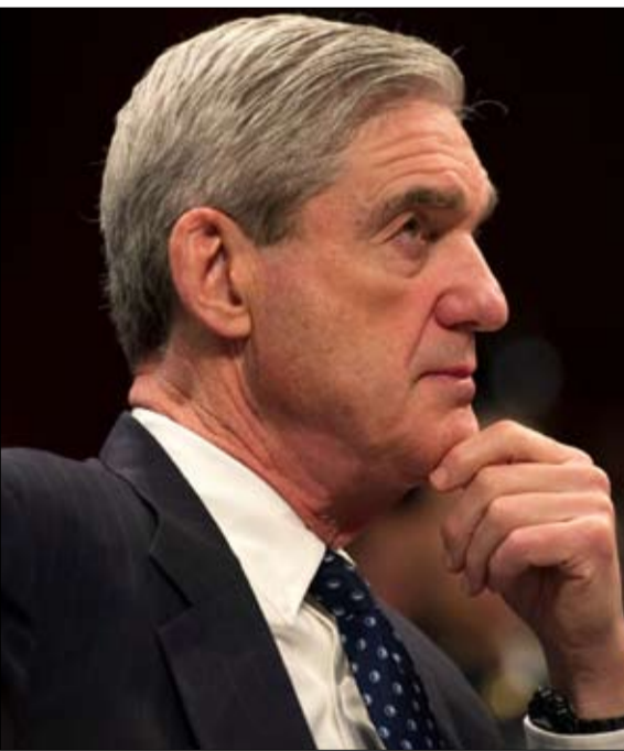
تقرير مولر.. اداة ضمنية