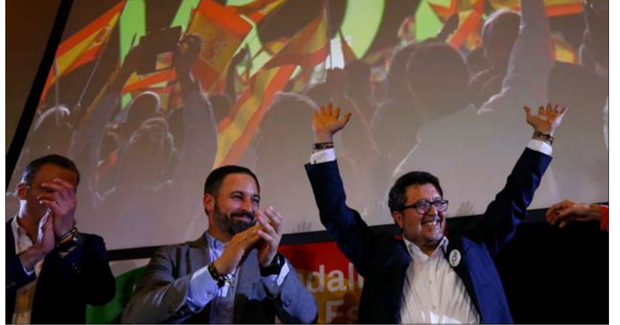
فوكس.. اليمين المتطرف يقلب المعادلة