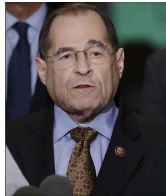
جيري نادلر.. حجج مقلقة