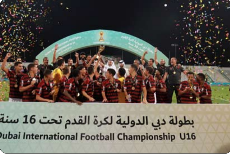
بطولة دبي الدولية لكرة القدم تحت 16 سنة Dubai International Football Championship U16