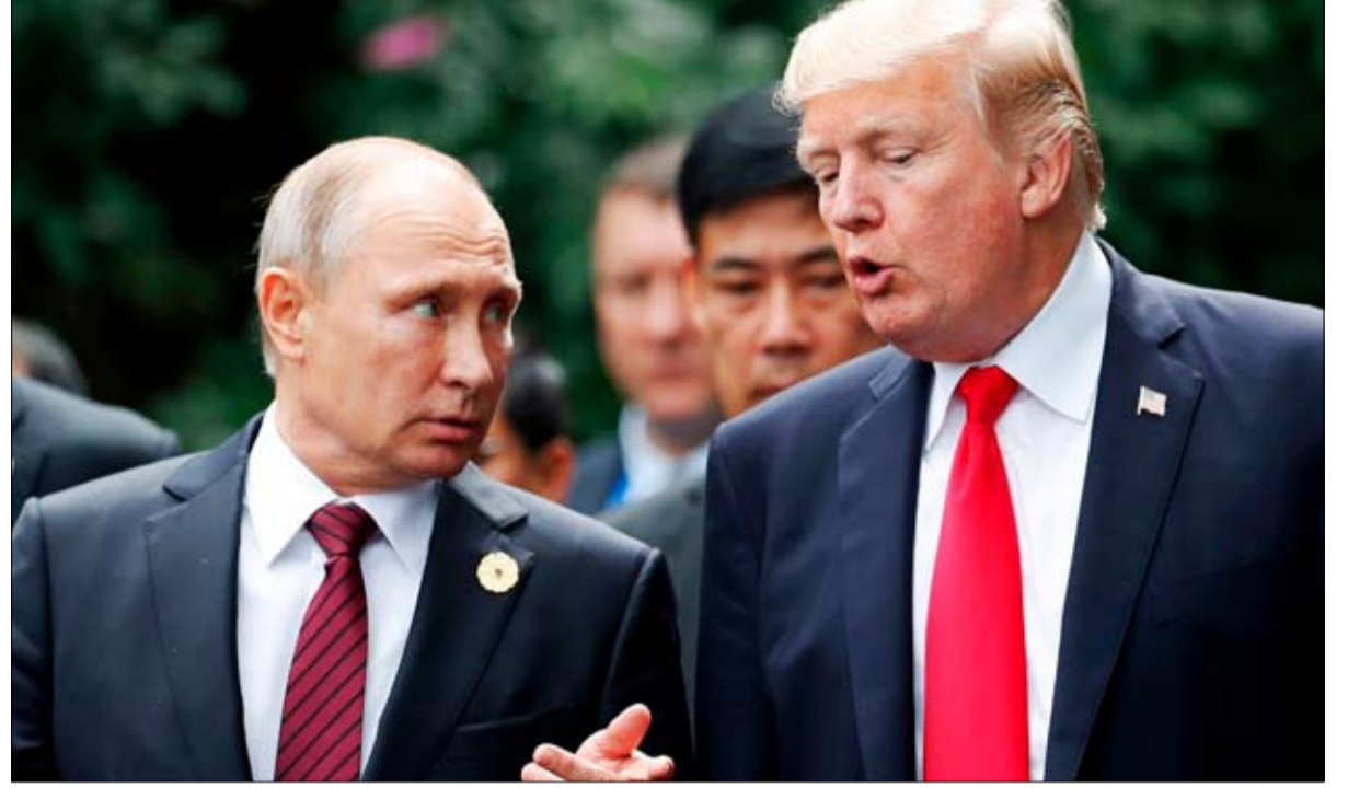
ترامب.. تبرة ولكن..