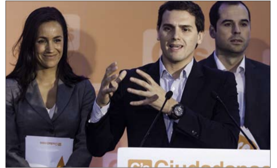
سيودادانوس.. جسر نجاة محتمل للاشتراكيين

•• الفجر - سيسيل ثيبو ترجمة خيرة الشيباني رئيس عن طريق الصدفة، لم يكن بيدرو سانثيز رئيسا ليستمر. بعد وصوله إلى السلطة في مدريد في يونيو 2018 إثر تصويت مفاجئ بحجب الثقة، اعتمد الزعيم الاشتراكي على لعبة تحالفات محفوفة بالمخاطر مع الانفصاليين الكاتالونيين وكتاب الأعمدة السياسية، الذين أطلقوا عليه اسم "بيدرو المختصر"، عابر لا مستقبل له. وبعد عشرة أشهر، نجح في قلب الأوضاع فلأدائه، ليصبح الأوفر حظا في حملة الانتخابات التشريعية المبكرة في 28 أبريل الجاري.