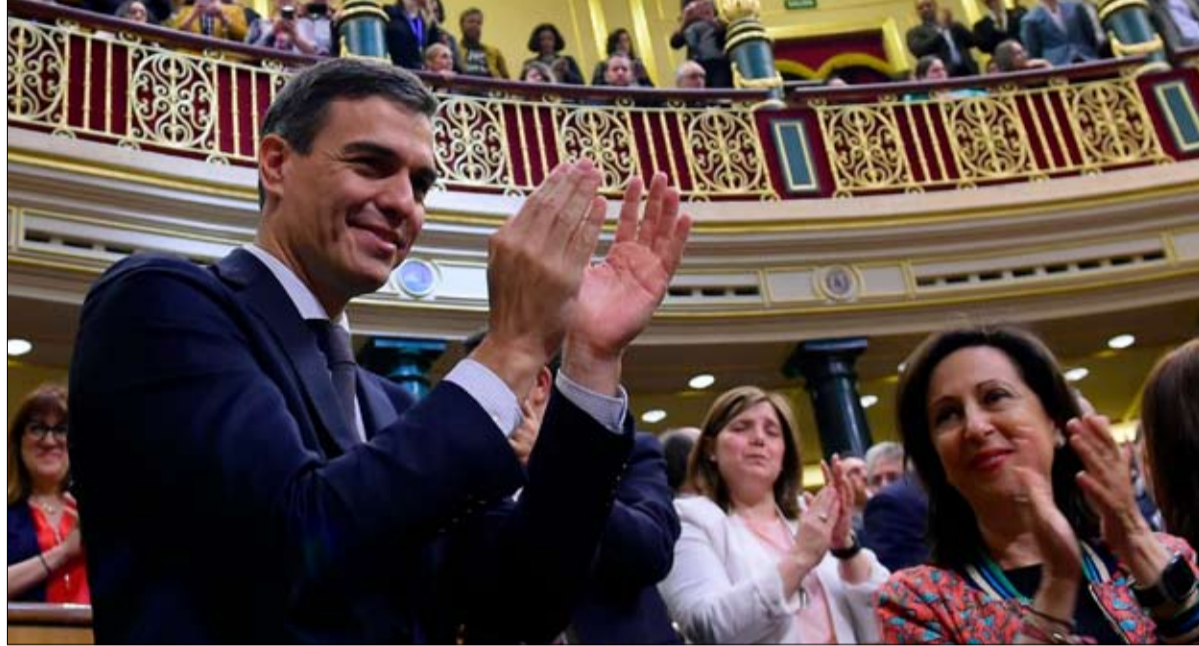
بيدرو سانثيز.. ريمونادا مذهلة