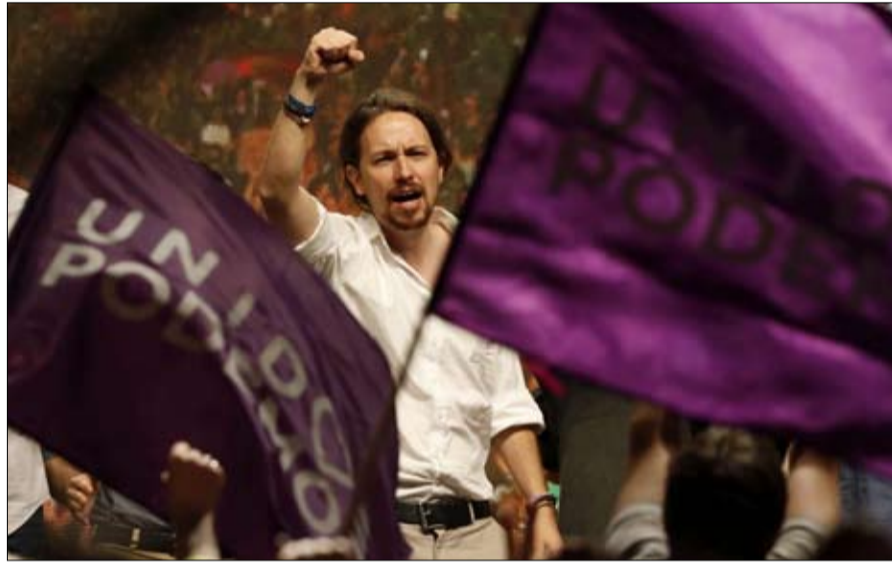
تراجع بوديموس قد يعقد مهمة سانثيز

•• الفجر - سيسيل ثيبو ترجمة خيرة الشيباني رئيس عن طريق الصدفة، لم يكن بيدرو سانثيز رئيسا ليستمر. بعد وصوله إلى السلطة في مدريد في يونيو 2018 إثر تصويت مفاجئ بحجب الثقة، اعتمد الزعيم الاشتراكي على لعبة تحالفات محفوفة بالمخاطر مع الانفصاليين الكاتالونيين وكتاب الأعمدة السياسية، الذين أطلقوا عليه اسم "بيدرو المختصر"، عابر لا مستقبل له. وبعد عشرة أشهر، نجح في قلب الأوضاع فلأدائه، ليصبح الأوفر حظا في حملة الانتخابات التشريعية المبكرة في 28 أبريل الجاري.