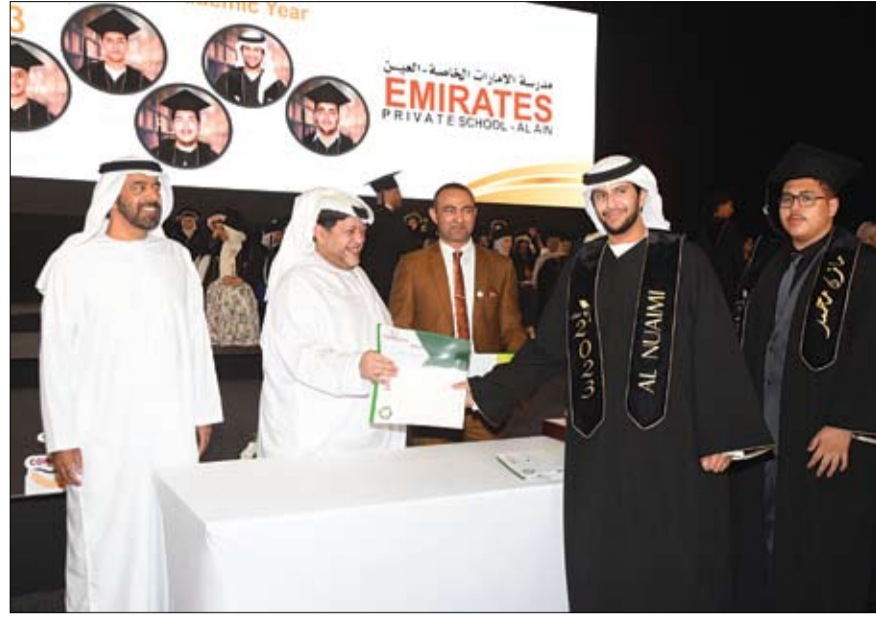
في مركز العين للمؤتمرات