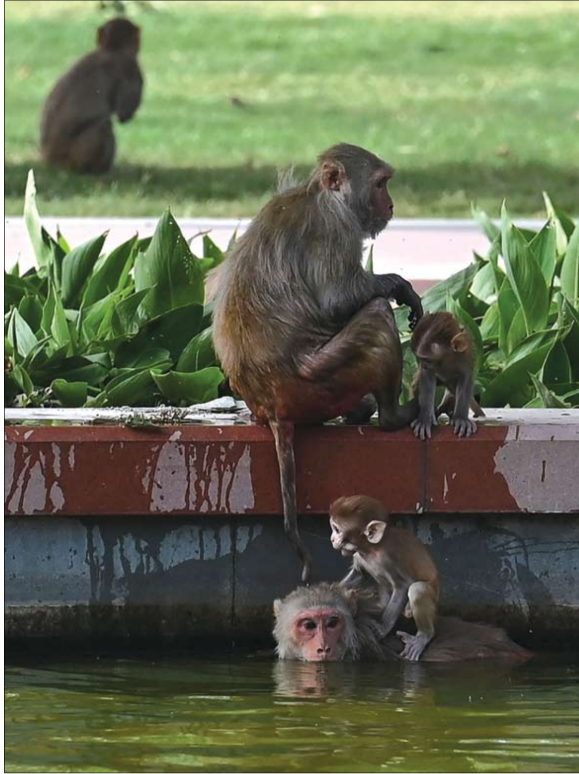
قروود في بركة مياه خلال يوم صيفي حار في نيودلهي