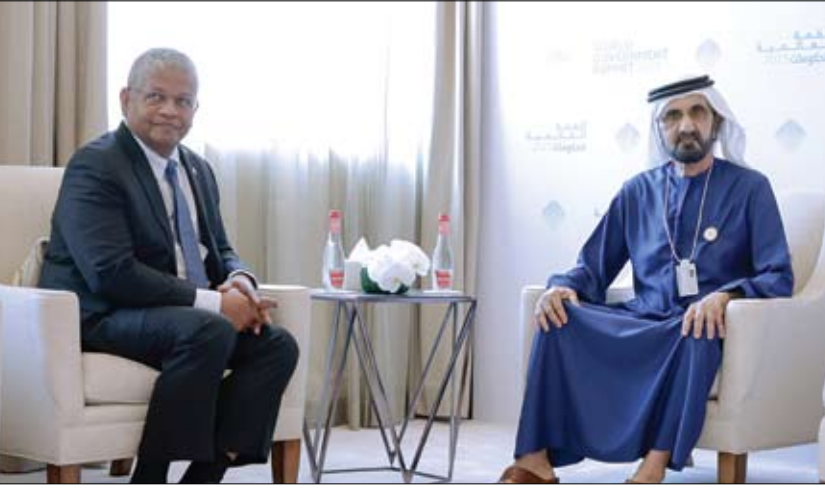
محمد بن راشد خلال لقائه رئيس جمهورية سيشل

من جهة أخرى تلقى صاحب السمو رئيس الدولة رسالة خطية من فخامة رودريغو تشافيز رويلاز رئيس جمهورية كوستاريكا تتعلق بتعزيز العلاقات الثنائية بين البلدين. (التفاصيل 2ص)