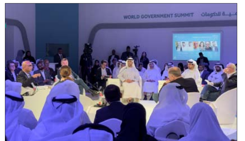
مركز تريندز يساهم في القمة العالمية للحكومات