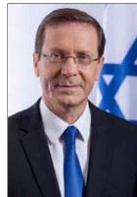
في هذا الإصلاح القضائي..

ويشير الكاتب إلى أن رئيس إسرائيل نفسه إسحاق هرتسوغ، "يحدرن علناً من أن رفض ائتلاف نتانياهو الحاكم الدخول في حوار هادئ وصور مع المعارضة حول التغيير المقترح للنظام القانوني الإسرائيلي واستقلال المحكمة العليا الإسرائيلية سيمرّق الداخل، لافتاً إلى أنها حالة طارئة.." ويرى فريدمان أنه كقاعدة عامة، لا يحب المستثمرون الاستثمار في البلدان التي تعج بالاحتجاجات والفضوض، وهذا هو السبب في أن البعض بدأ في الضغط على زر الإيقاف المؤقت، ويظهر ذلك جلياً في تصريحات أدلى بها ليو باكمان، رئيس المعهد الإسرائيلي للابتكار (منظمة غير ربحية تعمل كحاضنة لـ 2500 شركة ناشئة)، نهاية الأسبوع الماضي، متحدثاً عن المخاطر التي تطوي عليها مسألة إصلاح القضاء. وقال باكمان في تصريحه: "المستثمرون يتراجعون، كنت أعمل مع الوزارات الحكومية لسنوات، كنا دائماً غير سياسيين.. والان نحن نطلق النار على رؤوسنا