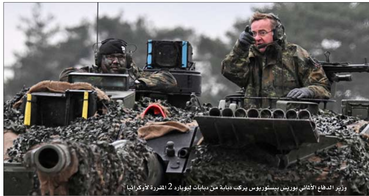
وزير الدفاع الألماني بوريس بيستوريس يركب دبابة من دبابات ليوبارد 2 المضرة لأوكرانيا

إلى جانب هذا البعد القانوني لشروط الانضمام لأوكرانيا ثمة تخوف اوروبي كبير ان يذهب الدعم اللامشروط لأوكرانيا حد قبولها عضوا بالاتحاد الى صدام مباشر مع روسيا . فما يريد حلفاء اوكرانيا هو أن لا تسقط كييف و تقديم دعم عسكري لإدارة الصراع داخل حدودها و ان لا يتجاوز الى تضيق الخناق عليهم من طرف الاراضي الروسية ، لذلك كانت الموافقة على تسليم طائرات لصد الهجمات الروسية و على تقديم