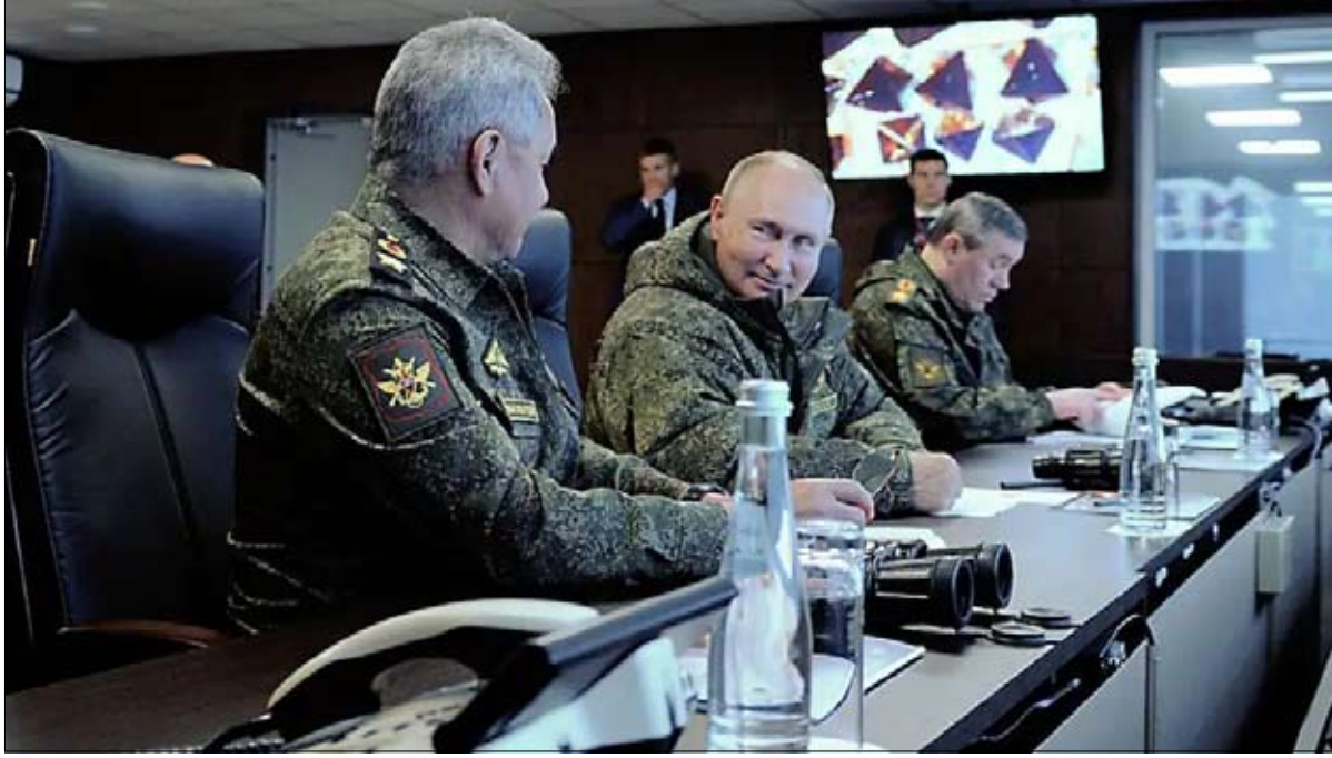
الابقاء على مناطق النفوذ الروسي بكل الوسائل

صواريخ لا تنتهك أمن روسيا داخل اراضيها . الجميع يتجنب اشارة غضب روسيا و تجنب استفزازها حتى لا تتسع رقعة الحرب على الاراضي الأوروبية فتندلع حرب عالمية ثالثة بسبب تقادم شعور روسيا أن أمنها مهدد .