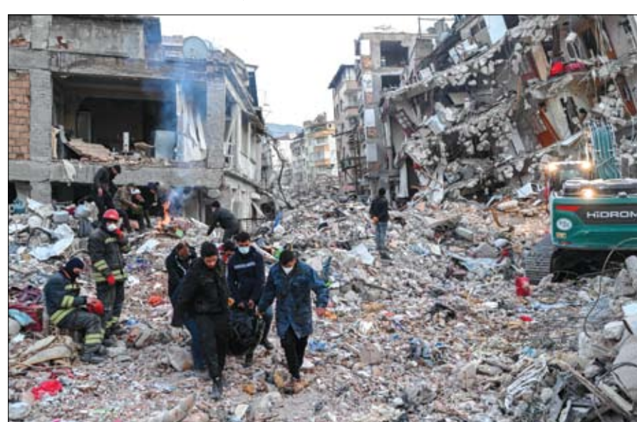
مسعفون يحملون جثثاً، بينما ينتظر السكان إخراج أقاربهم من بين الأنقاض في هاتاي بتركيا.

وكان الأمين العام للأمم المتحدة أنطونيو غوتيريش قد أطلق نداء طارئاً لجمع نحو 400 مليون دولار لمساعدة ضحايا الزلزال في تركيا وسوريا. وقال غوتيريش بالنص: الأمام المتحدة تطلق نداء لجمع 397 مليون دولار لمساعدة ضحايا الزلزال في سوريا. هذا المبلغ سيغطي فترة 3 أشهر.