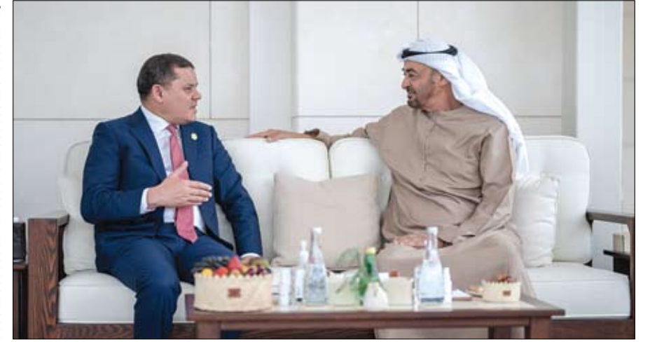
رئيس الدولة خلال استقباله عبد الحميد الدبيبة رئيس حكومة الوحدة الوطنية في ليبيا