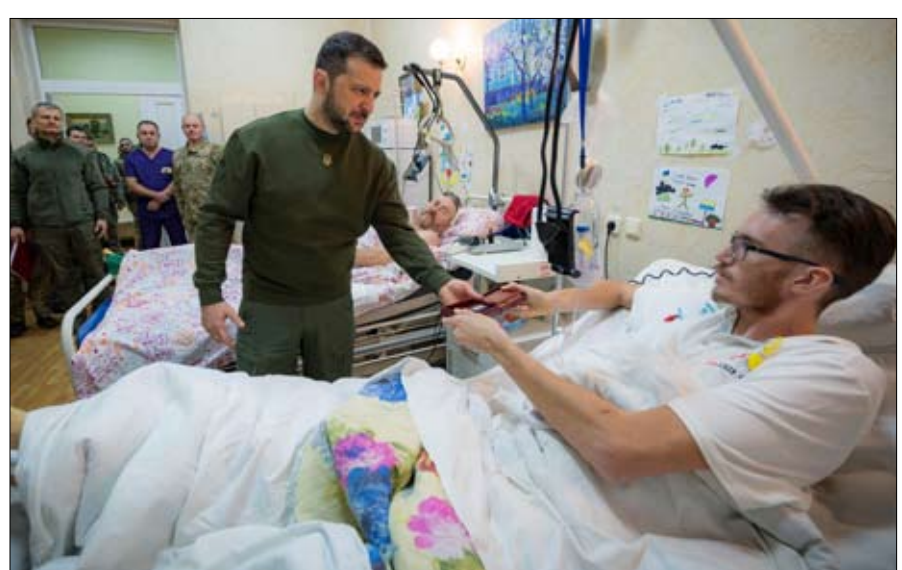
زيلينسكي يزور جرحى الحرب في مستشفى بكييف

هذه الإصلاحات تمثل ضرورة قصوى بالنسبة للغرب للاطمئنان على الهبات التي يمكن أن يقدمها لإعادة إعمار أوكرانيا و استرجاع عافيتها الاقتصادية . و يأتي على رأسها اجتثاث الفساد الذي يُنظر اليه البعض على أنه من بقايا الاتحاد السوفياتي ، بل ان الاعتقاد يذهب حد القول ان للفساد في أوكرانيا ، فأن يكون هناك خطوات جديدة على هذا الطريق . وبعد ذلك سينظر شركاؤها في مدى قدرتها ليس فقط على القتال ، ولكن أيضا على إعادة بناء البلاد ، وكيف ستستخدم