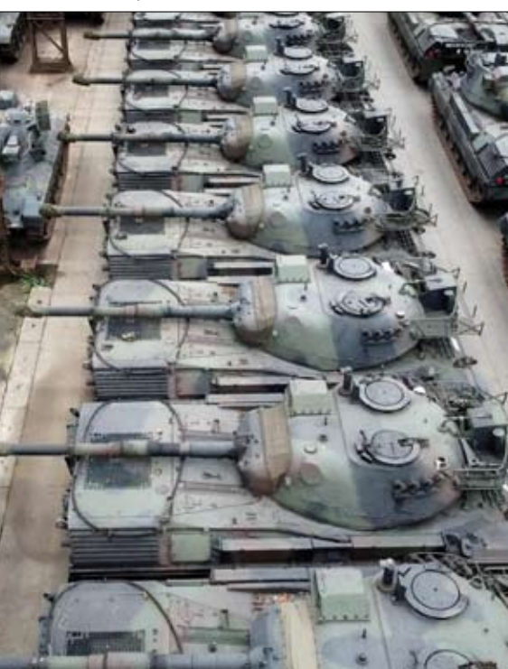
دبابات ليوبارد 2 الألمانية الصنع في بولجيا

حملته الانتخابية سنة 2019 بالقضاء على الفساد ، كما تزامنت حملة إيقاف و تفتيش لمسؤولين سابقين منهم وزير للدفاع ، مع انعقاد القمة الأوروبية ببروكسل ، و اعتبرت الحملة رسالة واضحة للغرب ان أوكرانيا على الطريق الصحيح في محاربة الفساد الذي عطل تنميتها وأعاق تقدمها ، و انه يجب ان يكون عند حلفائنا يقين ان الاموال التي سيهبونها ستستخدم على النحو المطلوب . و فعلا كان الهدف من حملة اجتثاث الفساد هو تعزيز عضوية اوكرانيا في الاتحاد الاوروبي ، حيث يعد تطوير سيادة القانون و الحد من الفساد امرا ضروريا للترشح لعضوية المجموعة الأوروبية . و