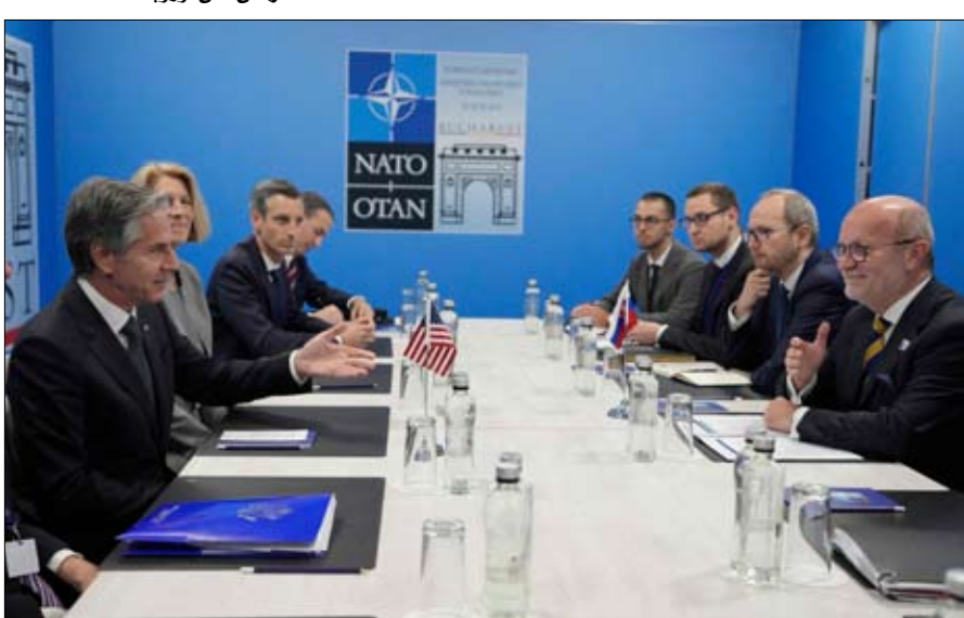
وزراء خارجية دول الناتو خلال اجتماعهم في بروكسل

العامة للأمم المتحدة في أيار/مايو 2019 " الاعتراف بأن أرخبيل تشاغوس جزء لا يتجزأ من أراضي موريشيوس ، ودعم إنهاء استعمار موريشيوس في أقرب وقت ممكن والامتناع عن عرقلة هذه العملية من خلال تطبيق أو الاعتراف بأي إجراء يتخذ من قبل أو باسم "الأرض البريطانية في المحيط الهندي" وتم تبني القرار بعد حكم مماثل أصدرته محكمة العدل الدولية قبل أشهر . وبدأت المملكة المتحدة وموريشيوس مناقشات حول سيادة الأرخبيل الشهر الماضي ، لكن وزير الخارجية البريطاني جيمس كليفرلي صرح أن الدولتين اتفقتا على استمرار عمل القاعدة العسكرية . وفي 2016 ، مدت لندن حتى 2036 عقداً مع الولايات المتحدة بشأن استخدام القاعدة العسكرية التي لعبت دوراً استراتيجياً واضحا خلال الحرب الباردة ثم في العقد الأول من القرن الحادي والعشرين خلال النزاعين في العراق وأفغانستان .