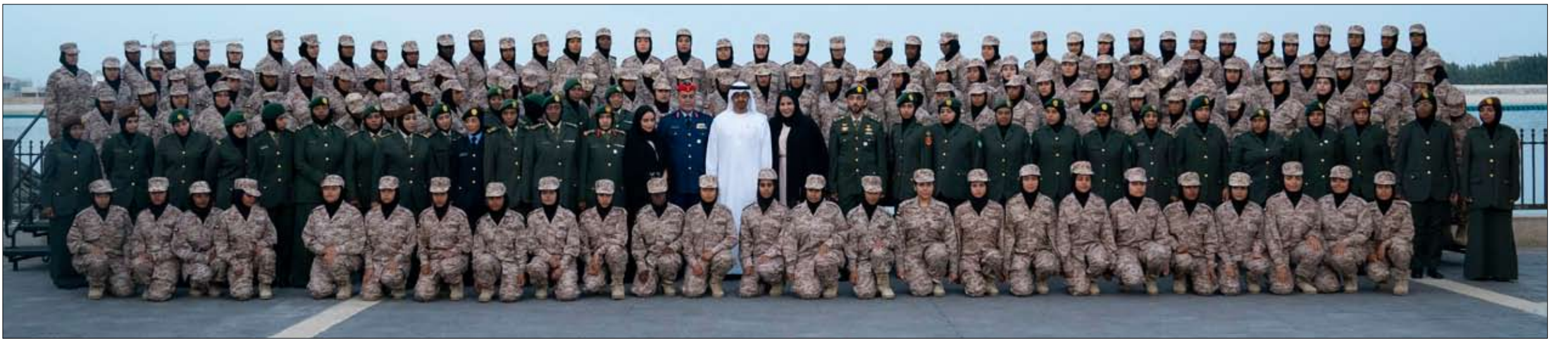
استقبل المشاركات في البرنامج الأممي لتطوير قدرات المرأة العربية بمهام حفظ الأمن والسلام

رئيس مجلس أمناء مؤسسة زايد بن سلطان آل نهيان للأعمال الخيرية والإنسانية و الفريق سمو الشيخ سيف بن زايد آل نهيان نائب رئيس مجلس الوزراء وزير الداخلية و سمو الشيخ خالد بن زايد آل نهيان رئيس مجلس إدارة مؤسسة زايد العليا لأصحاب الهمم ومعالي الشيخ نهيان بن مبارك آل نهيان وزير التسامح ومعالي الشيخ حمدان بن مبارك آل نهيان