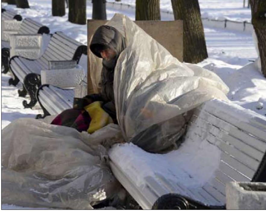
الفقر فيروس روسي قاتل

بعد عام من إعادة انتخابه ووعده بتخفيض معدل الفقر إلى النصف بحلول عام 2024، يجد الرئيس الروسي فلاديمير بوتين صعوبة لإقناع أن الوضع يتحسن بشكل كبير. وتقدم النتائج المنشورة مؤخراً في دراسة طويلة للأسلحة والأجوبة مع الجمهور، ستحتاج فلاديمير بوتين هذا العام، مرة أخرى، المطالب الاجتماعية. لا شك أن نسبة الروس القادرين على تحمل هذه النفقات الأساسية قد زادت،