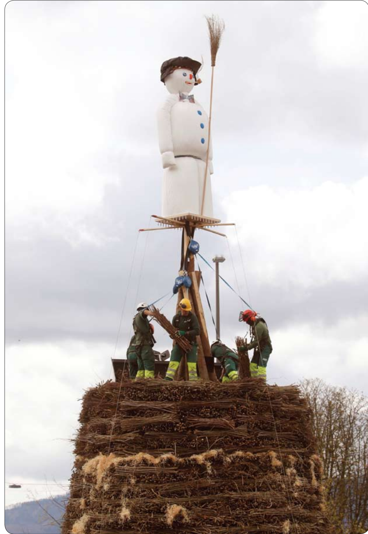
عمال ينصبون رجل ثلج مصنوع من الحشو ملوء بالعباب ناربية لإحراقه.. وذلك في تقليد خاص لاستقبال الربيع في زيوريخ بسويسرا.

وخلال اقترابه من الشمس أيضا، فإن الأجهزة الأربعة على متنه ستعمل على جمع البيانات والمعلومات من الغلاف الجوي الخارجي للشمس أو ما يعرف باسم "الكورونا" أو "هالة الشمس"، على أن يتم إرسالها إلى مقر وكالة ناسا على الأرض مع حلول فصل الربيع، وخلال فترة أسابيع.