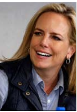
بوتين والوعد الصعب

وأضافت بيلوسي: "سياسات الرئيس تعديل صيغة هذا البيان الرئاسي، للهجرة، لم تؤد إلا إلى تفاقم المعاناة الإنسانية على الحدود، وتسببت في معاناة كبيرة للعائلات التي تم تفرقتها.. وقال زعيم الديمقراطيين في مجلس الشيوخ الأمريكي تشاك شومر، يوم الأحد أمس الأول: "حتى عندما تكون الأصوات الأكثر تشدا في الإدارة ليست متشددة بما يكفي للرئيس ترامب، فأنت تعلم أنه فقد تماماً التواصل مع الشعب الأمريكي.."