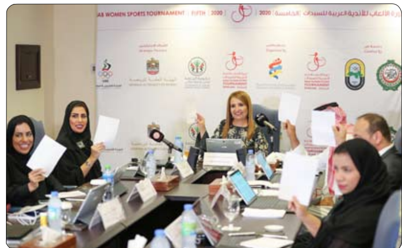
ترأسته حياة بنت عبد العزيز آل خليفة