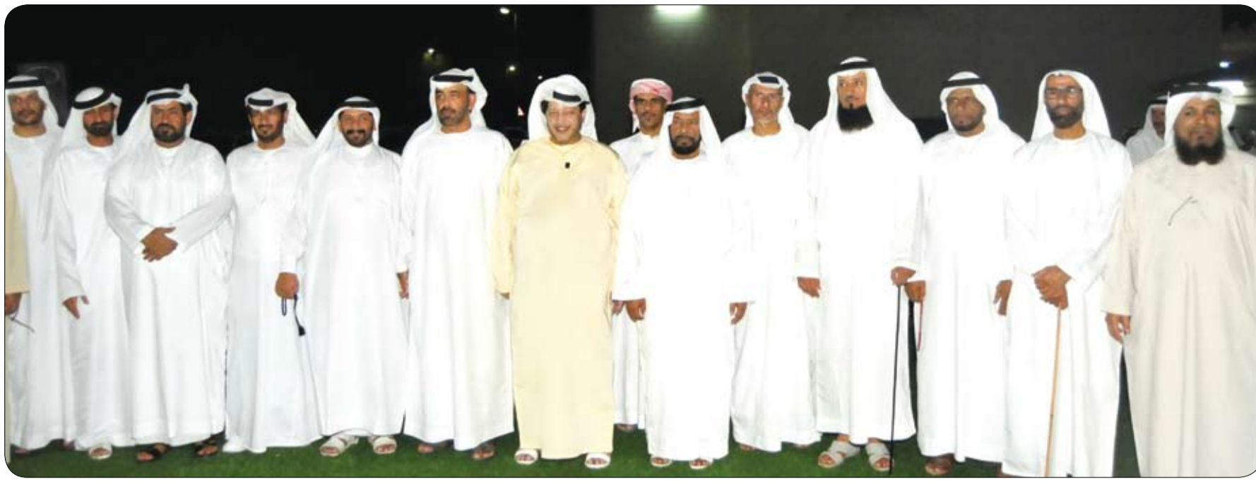
بمناسبة يوم العمل الإنساني