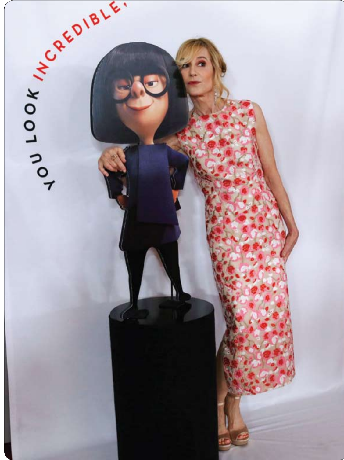
المثلة هولتي هنتر خلال حضورها العرض الأول لفيلم "الخارقون 2" في لوس أنجلوس، كاليفورنيا.

يمكن أن يساعد الزنجبيل في إنقاذ الأرواح بعد أن وجد العلماء أنه يعمل كملاح قوي ضد فيروس مرض الالتهاب المعدي المعوي، المسبب للجفاف والموت في العالم النامي. وشملت التجربة السريرية 140 طفلاً من نابولي، ولم يكن أي من المرضى أو الأطباء على علم بما إذا كان الأطفال يتناولون الزنجبيل. ووجدت النتائج المتعلقة بالتأثيرات المضادة للقيء لدى الأطفال، الذين يعانون من التهاب المعدة والأمعاء الخطير، أن الزنجبيل يمكن أن يقلل من شدة وتواتر القيء. ووجد الباحثون أن الأطفال الذين تتراوح أعمارهم بين سنة واحدة و10 سنوات، ويعانون من التهاب معدي معوي خطير، شهدوا انخفاضاً واضحاً في تواتر القيء بنسبة 20%. وقال الدكتور روبرتو بيريني كاناني، الأستاذ المساعد في قسم طب الأطفال من جامعة نابولي الإيطالية، الذي قاد الدراسة: إن النتائج قد (تقتد الأرواح على الأرجح) في جميع أنحاء العالم، فضلاً عن تخفيض الضغط على الأنظمة الصحية. وأوضح (كاناني)، أن (ما يزال التهاب المعدة من أكبر مسببات الوفاة بين الأطفال الذين يعيشون في البلدان النامية، والجفاف يعد من المضاعفات الأكثر تكراراً وخطورة). يذكر أن التهاب المعدة والأمعاء يحدث بسبب البكتيريا شديدة العدوى، بما في ذلك السالمونيلا المتواجدة في الطعام والماء، والفيروسات وأنواع الطفيليات. ويؤدي القيء والإسهال إلى استحالة امتصاص جسم المرضى للطعام والماء، أو حتى تناول العلاج عن طريق الفم لعلاج العدوى. ويمكن أن يكون الأمر خطيراً على المرضى الضعفاء، مثل الأطفال الصغار أو كبار السن.