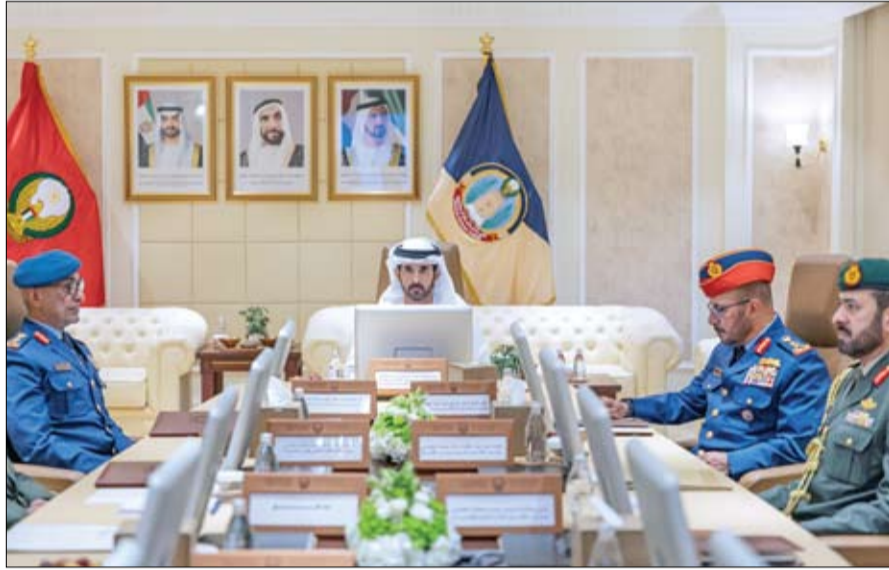
استعراض المبادرات والبرامج الرامية إلى الارتقاء بمستوى القدرات البشرية والتقنية، بما يعزز من كفاءة الأداء ويرسخ قدرة القوات المسلحة على تنفيذ مهامها بكفاءة واقتدار.

الجاهزية العملية، وتطوير القدرات البشرية والتقنية، بما يعزز من كفاءة الأداء ويرسخ قدرة القوات المسلحة على تنفيذ مهامها بكفاءة واقتدار. كما تم بحث مجموعة من المشاريع والمبادرات المستقبلية التي تدعم أولويات وزارة الدفاع خلال المرحلة المقبلة، وتساهم في تعزيز مسيرة التطوير المستمر في مختلف القطاعات الدفاعية. حضر الاجتماع معالي الفريق الركن عيسى سيف بن عبلان المرزوعي، رئيس أركان القوات المسلحة، ومعالي الفريق الركن إبراهيم ناصر العلوي، وكيل وزارة الدفاع، إلى جانب عدد من كبار الضباط والمسؤولين في وزارة الدفاع.