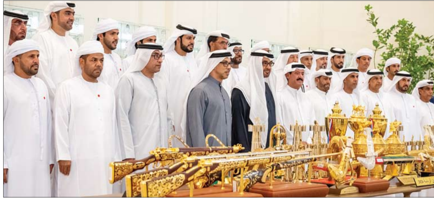
رئيس الدولة خلال استقباله فريق هجن الرئاسة بحضور منصور بن زايد

وتتضمن أبرز اختصاصات مؤسسة الإمارات للخدمات الصحية، وهي مؤسسة اتحادية تتبع مجلس الوزراء، تعزيز كفاءة القطاع الصحي الاتحادي، وتوفير خدمات الرعاية الصحية والعلاجية والوقائية اللازمة، واقتراح ومتابعة تنفيذ السياسات والإستراتيجيات والمعايير المتعلقة بقطاع الرعاية الصحية والوقائية والصحة العامة في الدولة، إضافة إلى إنشاء وإدارة المستشفيات والمراكز الصحية والمنشآت الصحية الاتحادية، وتعزيز كفاءتها. (التفاصيل ص2)