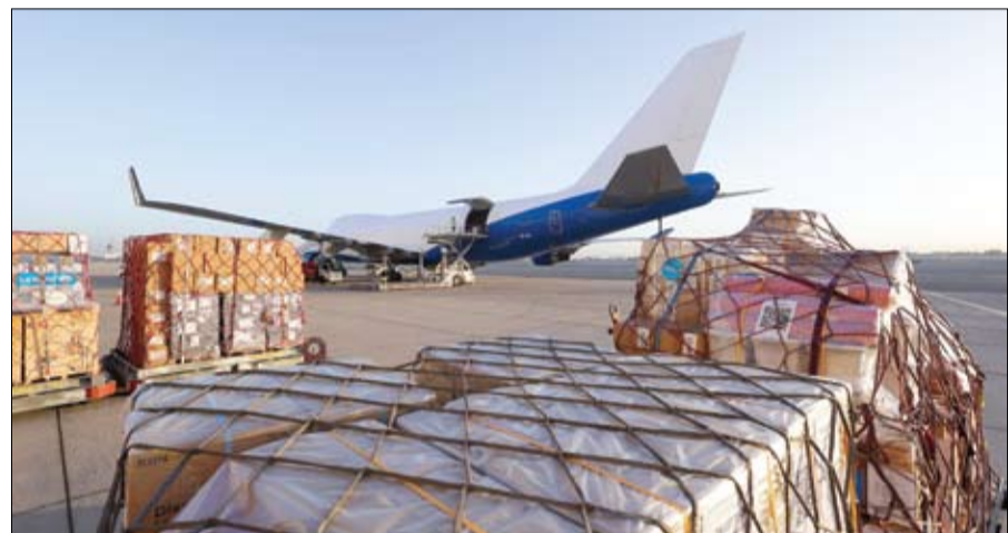
•• دبي -وأم:

بتوجيهات صاحب السمو الشيخ محمد بن راشد آل مكتوم، نائب رئيس الدولة رئيس مجلس الوزراء حاكم دبي، رعاه الله، سيّرت دبي الإنسانية شحنة جوية إغاثية ثانية دعماً لجهود الاستجابة الطارئة المستمرة لتفشي فيروس إيبولا في جمهورية الكونغو الديمقراطية عبر أوغندا، وذلك بالتنسيق وثيق مع المديرية العامة للحماية المدنية وعمليات المساعدات الإنسانية الأوروبية