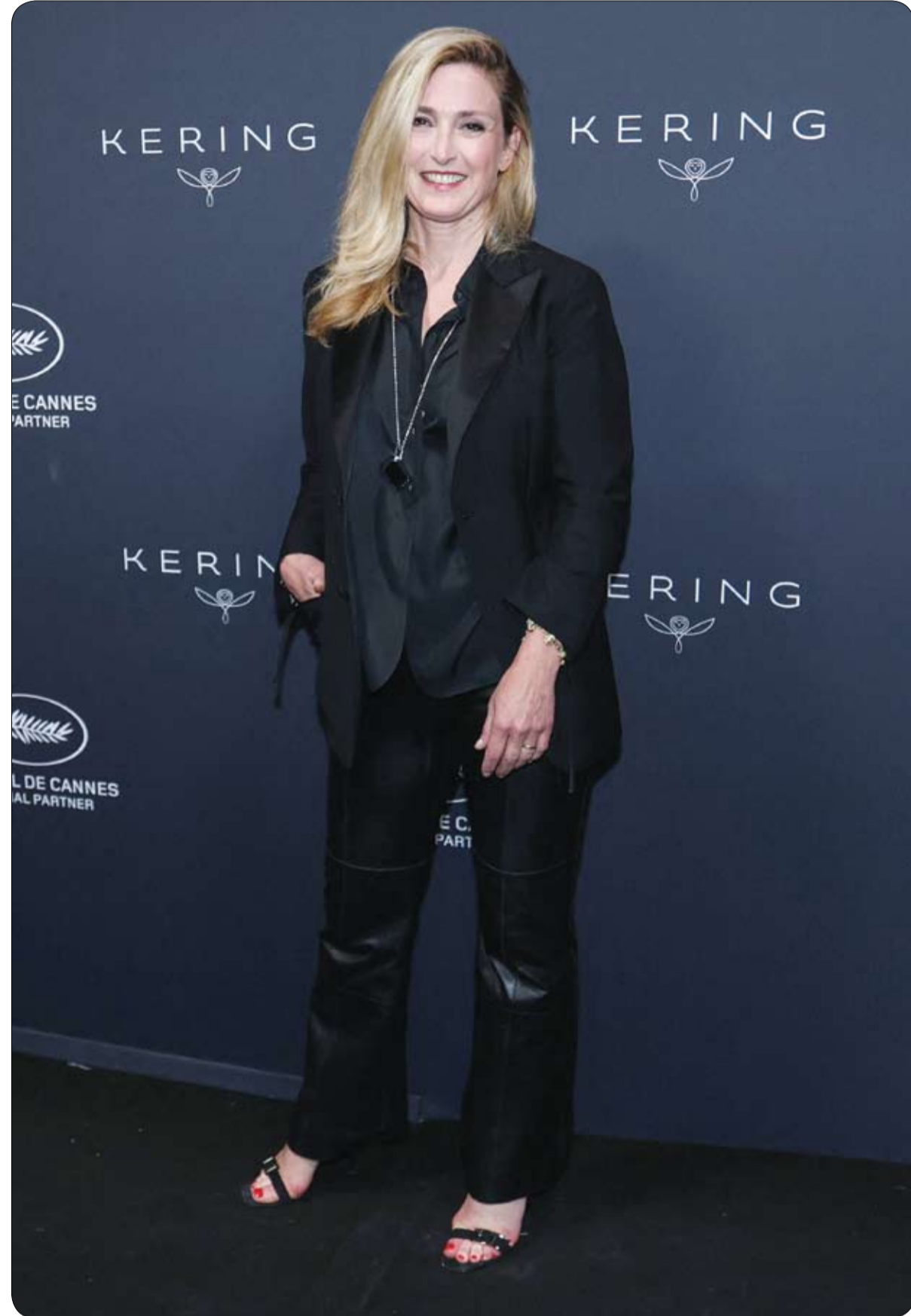
الممثلة الفرنسية جولي غاييه لدى حضورها حفل توزيع جوائز كيرينغ للنساء في الحركة لعام 2026 على هامش الدورة 79 ل مهرجان كان السينمائي.

ويعد هذا الإنجاز الثاني من نوعه لامرأة في التاريخ تعبر المحيط الأطلسي بمنطاد غازي، فيما أصبحت هيملمان-آدامز أول بريطانية تحقق هذا الإنجاز. ويحمل والدها، المستكشف البريطاني السير ديفيد هيملمان-آدامز، سجلاً مماثلاً بعدما سبق له عبور المحيط الأطلسي منفرداً بمنطاد مفتوح، وقد عبر عن فخره بما حققتته ابنته.