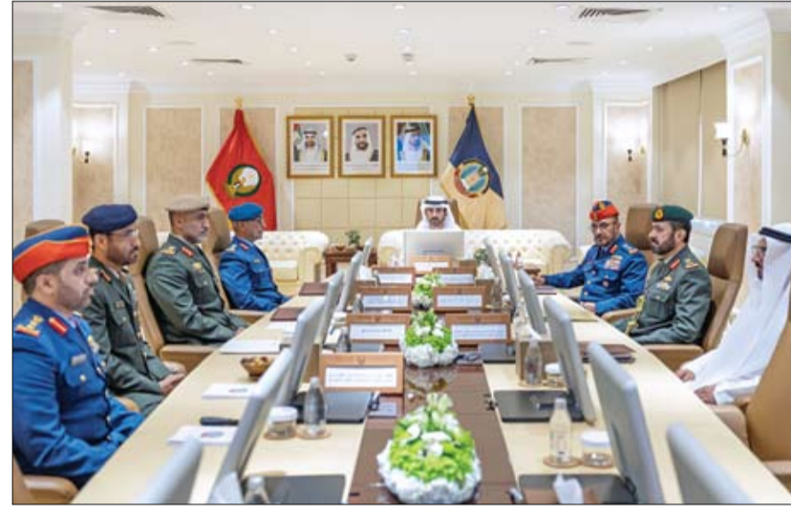
ووصون مكتبساته. وناقش المجلس عدداً من الإستراتيجية لوزارة الدفاع ويساهم في دعم أمن الوطن الجاهزية والكفاءة في مختلف القطاعات، بما يواكب التوجهات