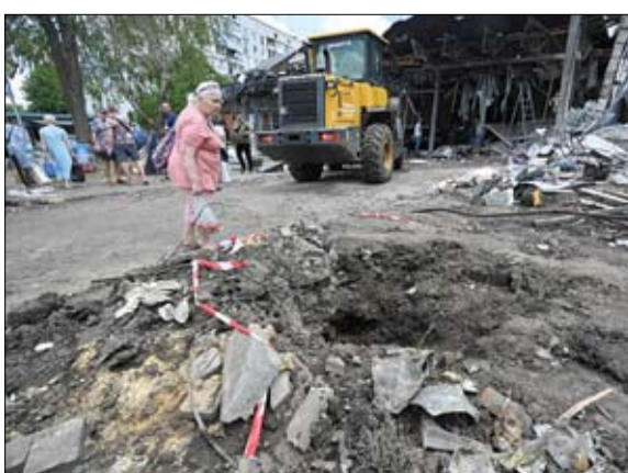
امرأة تنظر إلى حفرة خلفتها غارة روسية على خاركيف.

في شمال شرق أوكرانيا وجنوبها، بحسب ما أفادت السلطات. ويعد أكثر من أربع سنوات على بدء الغزو الروسي لأوكرانيا، تتواصل عمليات القصف بشكل شبه يومي على جاني الجبهة، فيما تشهد الجهود الدبلوماسية إنهاء النزاع حالا من المراهقة. وأسفرت ضربة روسية في تشوهيفيف بمنطقة خاركيف عن مقتل امرأة تبلغ 22 عاماً ورجلين في السادسة والخمسين، والسبعين من العمر، بحسب حصيلة جديدة نشرها حاكم المنطقة أوليغ سينيغويوف على تلغرام.