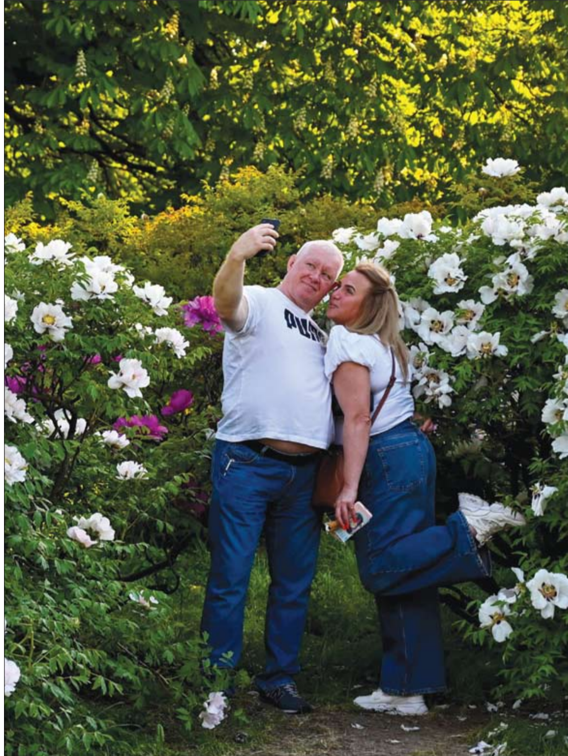
زوجان يلتقطان صورة سيلفي بالقرب من شجيرات الفاوانيا المزهرة في الحديقة النباتية في كيبف.

وأوضح أحد خبراء النوم: "السرير المرتب بشكل مثالي هو بيئة خصبة لعث الغبار، وهو بمثابة مساحة دافئة مثالية لهذه الحشرات للبقاء على قيد الحياة والازدهار.