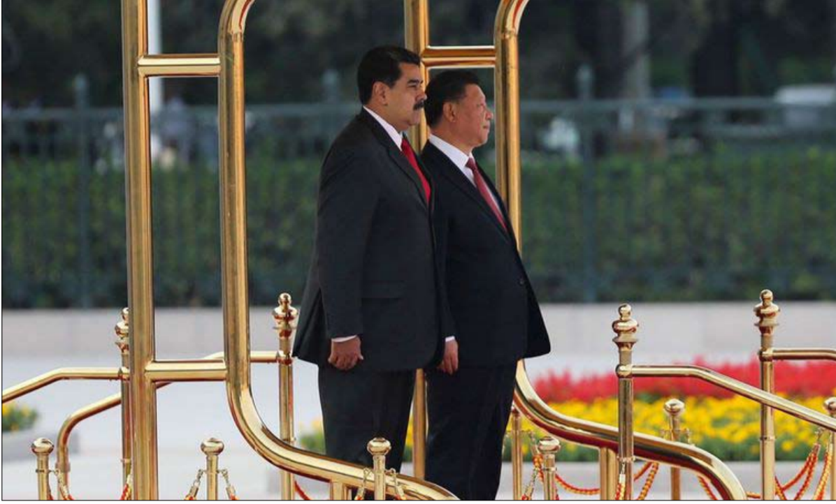
الصين: مصالحي اول... مادورو لاحقا