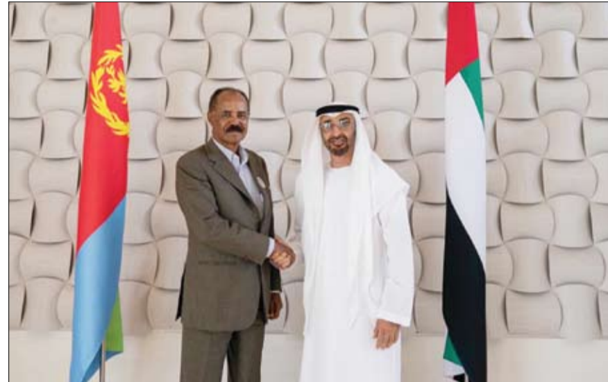
محمد بن زايد خلال استقباله الرئيس الأذربيجي