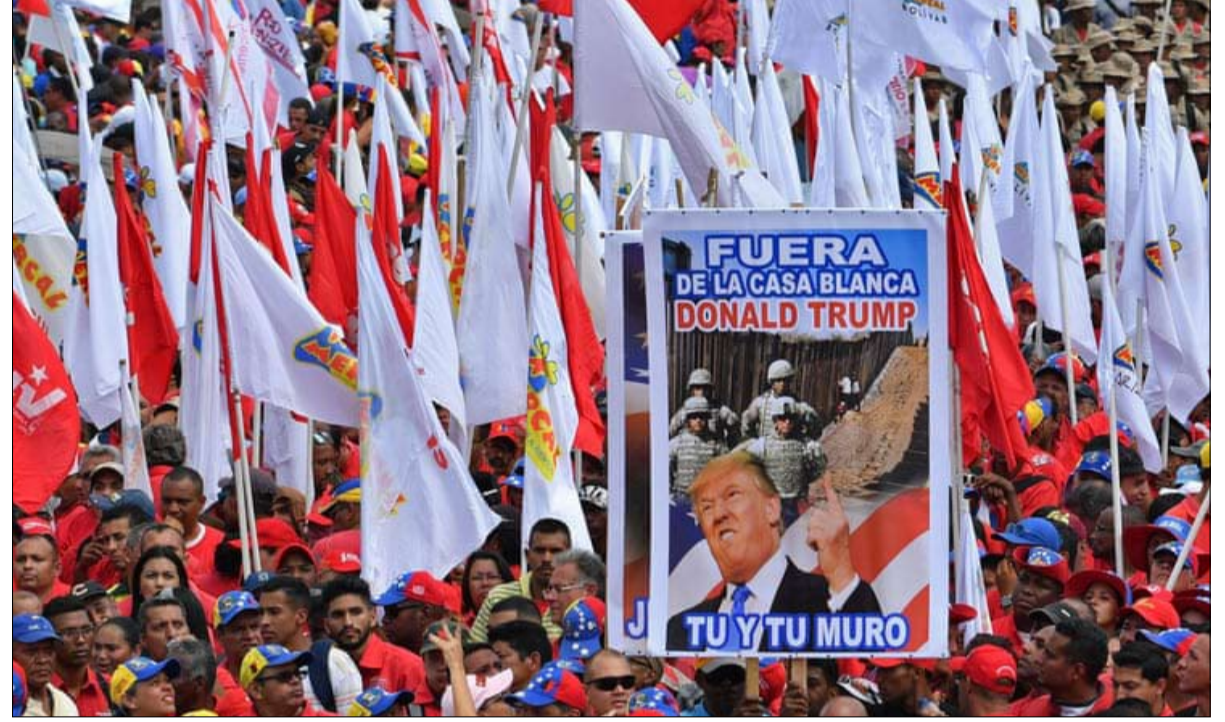
الضغط الأمريكي يؤلم ويستفز انصار مادورو