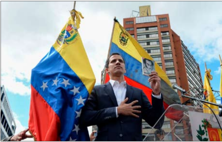
غوايدو يلقط اليد الصينية المدودة