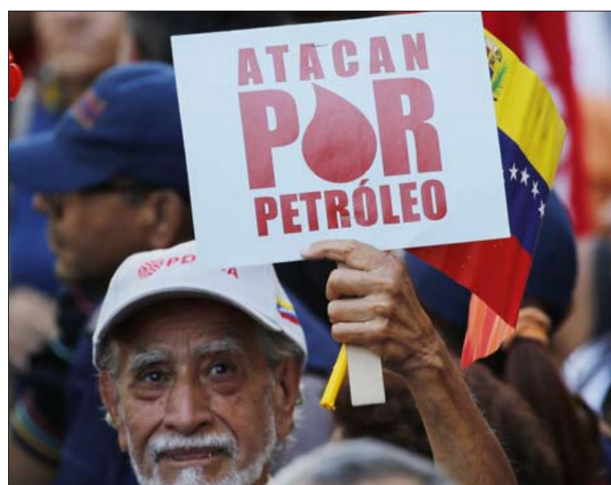
المعركة الاقتصادية نفطية بالاساس

واشنطن تخلق الحثيثة النفطية ولا شك في أن الوضع سيزداد سوءاً مع سلسلة العقوبات التي اعتمدها البيت الأبيض في 28 يناير، دعماً لخوان غوايدو؛ تجميد أصول بقيمة 7 مليارات دولار لشركة النفط الوطنية، وحظر التجارة مع الكيانات الأمريكية. الضربة قاسية بالنسبة إلى كاراكاس، التي تظل واشنطن أكبر مشتر للنفط منها، بمعدل 400 ألف برميل في اليوم - أي أقل من الثلث عن عام 2017 - تليها الهند (300 ألف) والصين (240 ألف). وحتى الآن، تأتي 80 بالمائة من السيولة من مبيعات النفط الفنزويلية، من علاقتها التجارية مع الولايات المتحدة.