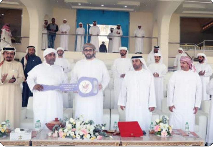
الأول إلى العاشر وتسليمهم المنظمة للمهرجان فيما حصل عشر إلى السابع عشر على جوائز مفتاح السيارات من اللجنة الفائزون من الشوط الحادي نقدياً.