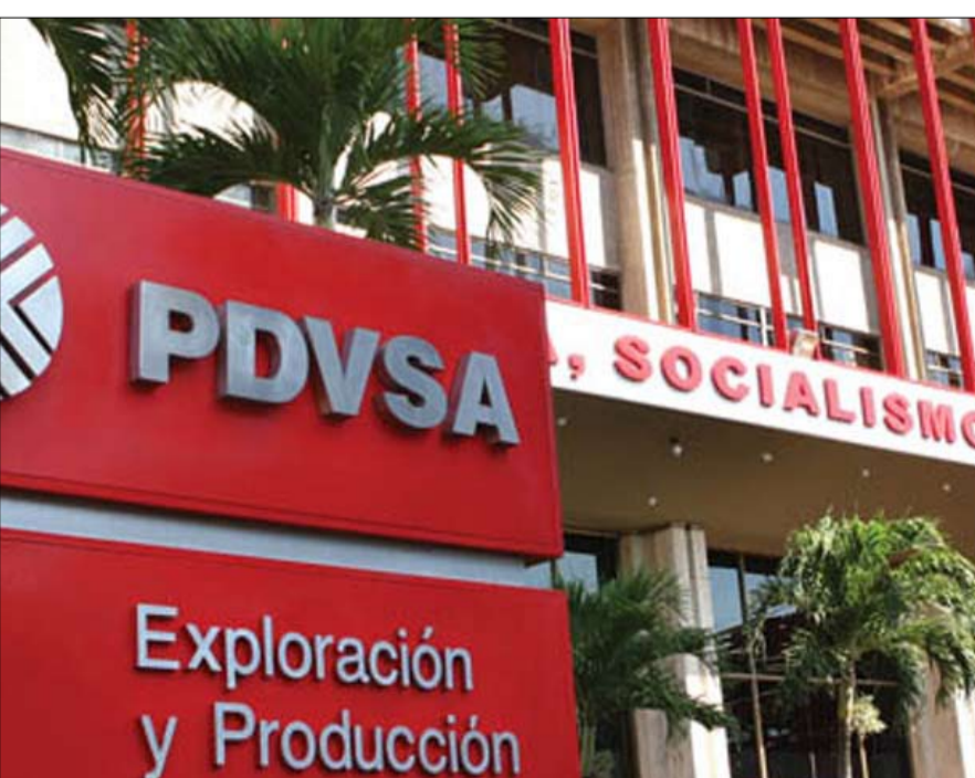
قطع الشريان النفطي لفنزويلا