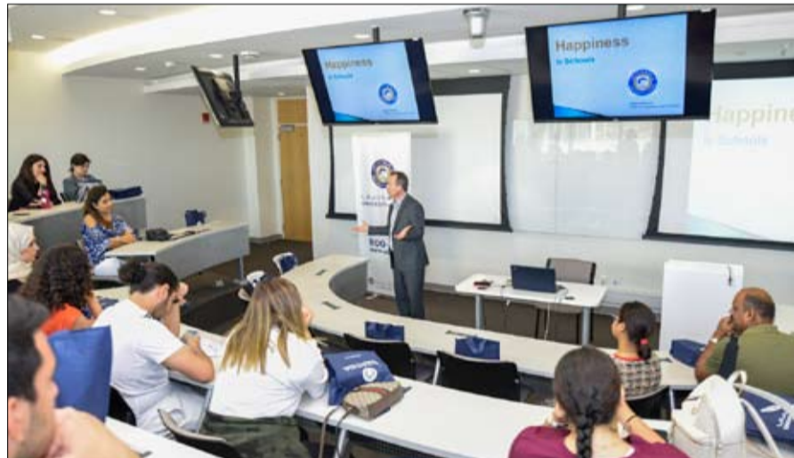
العام الحالي عام التسامح. يشجع خلالها المدربون الطلبة على العطاء والتسامح والمحبة والاستقامة في الحياة كجزء من أسرار السعادة بشكل أفضل.

بمبادرة من صاحب السمو الشيخ محمد بن راشد آل مكتوم نائب رئيس الدولة رئيس مجلس الوزراء حاكم دبي «رعاه الله» أطلقت القيادة العامة لشرطة دبي مع بداية عام التسامح مبادرة «تسوية المخالفات المرورية» لتتيح للسائقين الذين تم تحرير مخالفات مرورية بحقهم عدم دفع تلك المخالفات لشرطه الالتزام بقانون السير والمرور وعدم ارتكابهم مخالفات مرورية طوال العام. أعلن ذلك سعادة اللواء عبدالله خليفة المري القائد العام لشرطة دبي خلال المؤتمر الصحفي الذي عقده