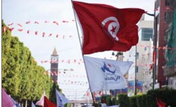
محامون يضعون النهضة في قفص الاتهام

تونس واحتكار الفضاء العام بكل مكوناته وهيباته، وذلك بتثبيت منتسبها والمواكين إليها في المواقع الحساسة، سواء منها الإدارية أو الأمنية أو القضائية أو السياسية، في خرق صريح للقوانين المنظمة والنصوص الترتيبية الخاصة حسب الحالات وأنها اعتمدت تنفيذاً لسياسة التمكين على توظيف بعض الأحزاب السياسية التي تم تغييرها باستمرار لتمير برنامج الولوع إلى قلب الدولة ومن ثمة تغيير عقيدة الموظفين العموميين من الولوع للوطن إلى الولوع للتنظيم" (التفاصيل ص15)