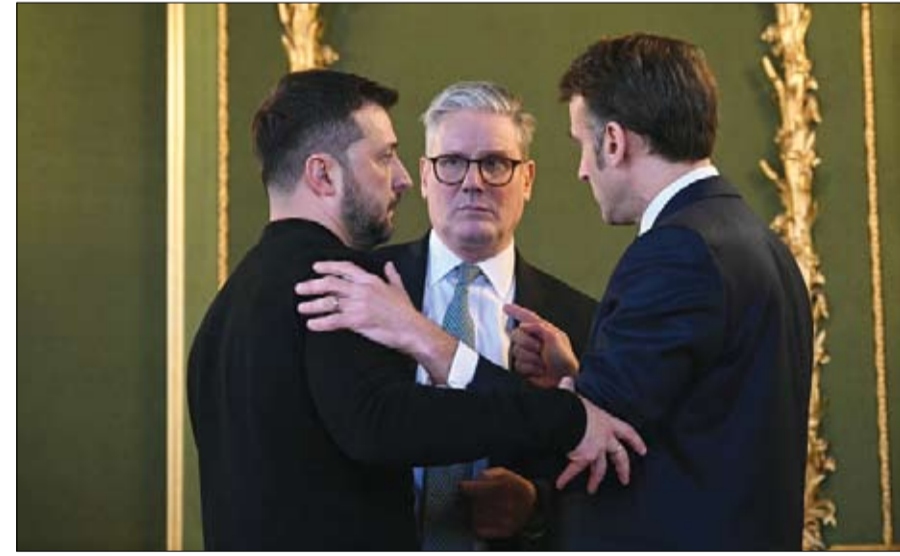
ماكرون وستارمر وزيلينسكي.. وفشل التوصل لهدنة في أوكرانيا

قال الرئيس الفرنسي إيمانويل ماكرون لصحيفة لو فيغارو، إن باريس ولندن تقترحان هدنة لمدة شهر في أوكرانيا تشمل الجو والبحر والبنية التحتية للطاقة. كما اقترح أن ترفع الدول الأوروبية إنفاقها الدفاعي إلى ما بين 3% و3.5% من إجمالي الناتج المحلي، في مواجهة تبدل السياسات الأميركية في عهد ترامب. هذا وأعلن الرئيس الأوكراني فولوديمير زيلينسكي، أن استبداله لن يكون سهلا، في وقت ترغب إدارة الرئيس الأميركي دونالد ترامب برحيله بسبب رفضه الرضوخ لطلب موسكو.