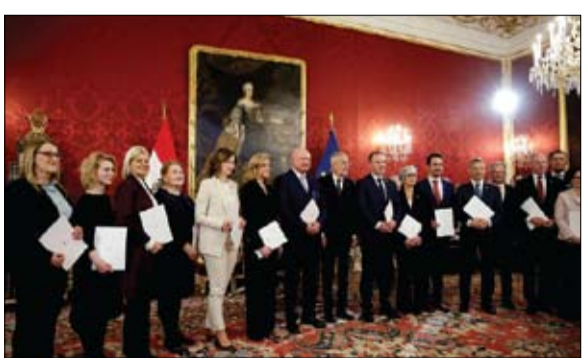
الرئيس النمساوي والمستشار الجديد في صورة مع الحكومة الجديدة

عبر فولكر تورك مفوض الأمم المتحدة السامي لحقوق الإنسان أمس عن قلق عميق بسبب تحول جذري في توجهات الولايات المتحدة في عهد الرئيس دونالد ترامب وممارسات إسرائيل في الضفة الغربية المحتلة. وقال تورك إنه قلق من استخدام الأسلحة والأساليب العسكرية مع الفلسطينيين في الضفة الغربية، بما في ذلك الدبابات والضربات الجوية، ومنزعج من تدمير وإخلاء مخيمات لاجئين وتوسع المستوطنات غير القانونية والقيود الصارمة على التنقل ونزوح عشرات الآلاف. وتابع قائلا يجب أن تتوقف تحركات إسرائيل الأحادية وتهديداتها بالضم في الضفة الغربية، مشيرا إلى أن ذلك يشكل انتهاكا للقانون الدولي. كما حذر تورك من مغبة استغلال لغة خطاب تتسبب في انقسامات لخارج واستقطاب الناس وتقسيمهم. وقال تورك تمتعنا بدعم من الحزبين في الولايات المتحدة بشأن حقوق الإنسان على مدى عقود عديدة... أنا الآن قلق للغاية بشأن التحول الجذري في التوجه محليا ودوليا دون أن يذكر ترامب بالاسم. وتابع قائلا السياسات التي ترمي لحماية الناس من التمييز يشار إليها الآن على أنها تمييزية... لغة خطاب تتسبب في الانقسامات تستغل للإرباك والخداع والاستقطاب. هذا يؤدي إلى الخوف والقلق لدى الكثيرين. ويعبر تورك أيضا عن قلقه بشأن التراجع في مجال المساواة بين الجنسين وتزايد استخدام التضييق والترهيب والتهديدات ضد الصحفيين والمسؤولين الحكوميين. ومنذ توليه السلطة في 20 يناير، أصدر ترامب سلسلة من الأوامر التنفيذية لتفكيك وإيقاف برامج لدعم التنوع والمساواة والشمول في مؤسسات اتحادية وفي القطاع الخاص.