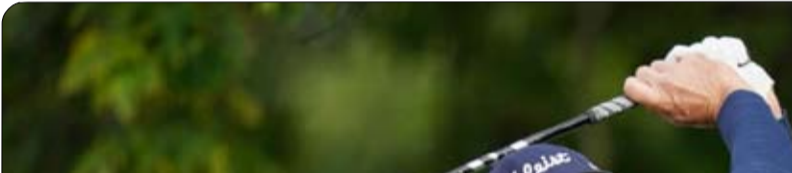
الاصطناعي، ثم بطولة زايد

للوولف يتفوق في بطولة هوك بالعراق. وكانت مرحلة المجموعات قد اختتمت بتعادل النصر مع أهلي صنعا اليمنى بدون أهداف، فيما