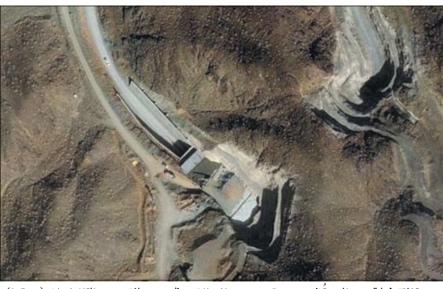
صورة التقطها قمر صناعي تظهر جهود تحسين مدخلي نفق في مجمع بالقرب من نانتر، إيران.

باسم البيت الأبيض، إن التقدم بشأن الاتفاق محدود. في المقابل، تعد طهران حالياً مسودة إطار عمل لمباحثات مرتقبة مع الولايات المتحدة، بحسب ما ذكره وزير الخارجية عباس عراقجي. وأوضح عراقجي، خلال مكالمة هاتفية مع مدير وكالة الطاقة الذرية ورافيل غروسو، أن إيران تركز على إعداد هذه المسودة لدفع المحادثات المستقبلية في إطار عمل متماسك. وأفاد مسؤول أمريكي أن وزير الخارجية ماركو روبيو سيوزع إسرائيل الأسموية المقبل وسط تصاعد التوترات مع إيران. وأوضح المسؤول الأمريكي لغراس برس أن روبيو سيلتقي خلال زيارته رئيس الوزراء الإسرائيلي بنيامين نتنياهو، دون ذكر المزيد من التفاصيل. من جهة أخرى أجرت القوات البحرية الروسية والإيرانية مناورات بحرية في خليج عمان تم خلالها إجراء تمرين على تحرير سفينة مختطفة.