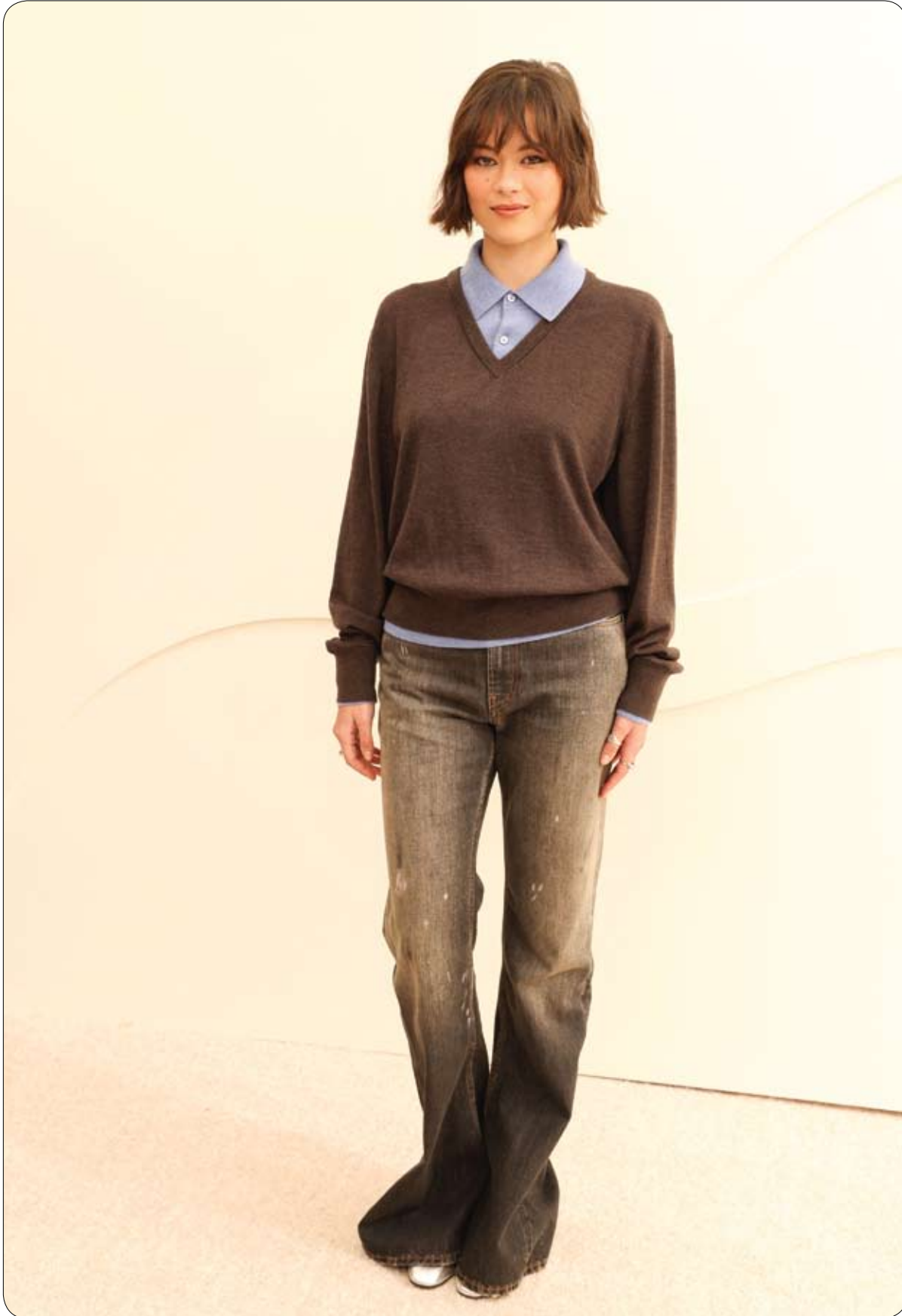
الممثلة الأمريكية لوكيتا ماكسويل لدى حضورها فعاليات اليوم الصحفي لشركة أبل تي في في سانتا مونيكا، كاليفورنيا.

في مشهد قد يختلط على كثيرين بين دودة أرض و ثعبان صغير، يبرز "براهميني الأعمى" Brahminy blind snake، المعروف باسم "ثعبان أبيض الزهور"، كأحد أغرب الزواحف في العالم، بخصائص بيولوجية فريدة تثير دهشة العلماء. هذا الثعبان الصغير، الذي لا يتجاوز طوله 10 إلى 15 سنتيمتراً، يتميز بجسم أسود لامع وانسيابي، مع تشابه كبير بين الرأس والذيل؛ ما يجعل التفرقة بينهما صعباً. وينتمي إلى فصيلة الثعابين الحفارة التي تعيش تحت سطح التربة، حيث يقضي معظم وقته في الجحور، معتمداً على بقع عينية بدائية تمكنه فقط من استشعار الضوء، دون قدرة حقيقية على الإبصار. والسمة الأكثر إثارة للدهشة تكمن في تكاثره؛ فجميع أفراده إناث، ويتكاثر عبر التوالد العذري، حيث تضع الأنثى بيضاً ينمو دون الحاجة إلى تلقيح من ذكر، لينتج أفراداً مطابقين وراثياً لها. وتعد هذه الظاهرة نادرة للغاية بين الفقاريات. وبحسب العلماء، فإن الموطن الأصلي لهذا النوع يعود إلى مناطق في آسيا وأفريقيا، إلا أنه انتشر في دول عدة حول العالم عبر تجارة النباتات ونقل التربة، إذ يستطيع الاختباء بسهولة داخل أوصع الأشجار والشجيرات، ورغم تصنيفه كنوع غير محلي في بعض المناطق، فإن الخبراء لا يعتبرونه غازياً، لعدم ثبوت تسببه في أضرار بيئية أو اقتصادية. ويتميز هذا الثعبان بكونه غير سام ولا يشكل خطراً على الإنسان، كما أنه لا يعض. بل على العكس، يتغذى على بيض ويرقات النمل والنمل الأبيض، ما يجعله عنصرًا مفيداً في الحد من بعض الآفات.