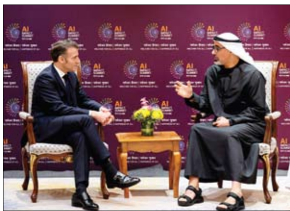
ولي عهد أبوظبي خلال لقائه الرئيس الفرنسي