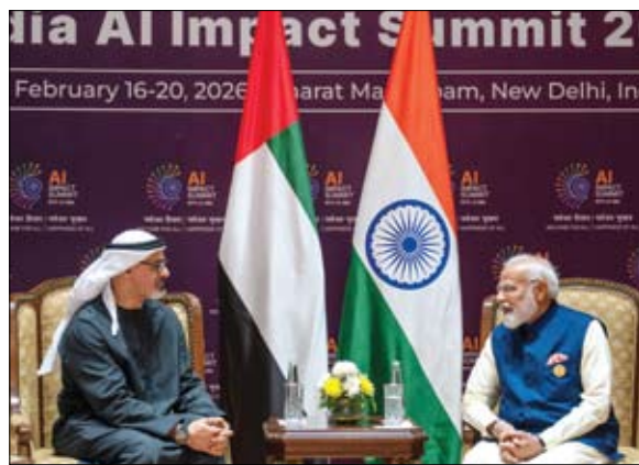
ولي عهد أبوظبي خلال لقائه رئيس الوزراء الهندي