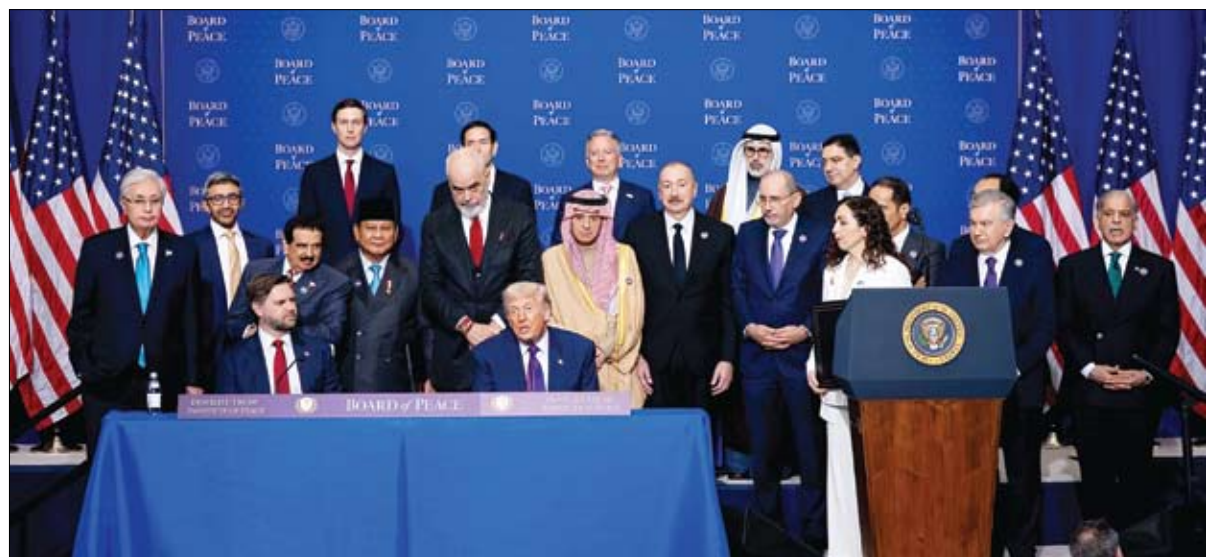
الرئيس الأمريكي يتحدث بحضور عبد الله بن زايد والقادة المشاركين في الاجتماع الافتتاحي لمجلس السلام (وام)

التقى سمو الشيخ خالد بن محمد بن زايد آل نهيان، ولي عهد أبوظبي، فخامة إيمانويل ماكرون، رئيس الجمهورية الفرنسية، على هامش انعقاد أعمال قمة تأثير الذكاء الاصطناعي، في العاصمة الهندية نيودلهي. وجرى خلال اللقاء بحث مسارات التعاون الإماراتي - الفرنسي، في إطار الشراكة الاستراتيجية التي تجمع دولة الإمارات وفرنسا، واستعراض سبل تطويرها لمواكبة تطورات العالمين نحو توسيع آفاق التعاون الثنائي بما يخدم المصالح المشتركة. كما التقى سمو الشيخ خالد بن محمد بن زايد آل نهيان، ولي عهد أبوظبي، دولة ناريندرا مودي، رئيس وزراء جمهورية الهند، وذلك على هامش أعمال قمة تأثير الذكاء الاصطناعي، وجرى خلال اللقاء بحث آفاق تعزيز الشراكة الاستراتيجية بين دولة الإمارات العربية المتحدة وجمهورية الهند الصديقة، واستعراض فرص توسيع التعاون في القطاعات الاقتصادية والتكنولوجية ودعم الاستثمارات في قطاع الرعاية الصحية والتأمينات، ومختلف المجالات ذات الاهتمام المشترك، بما يدعم توجهات البلدين نحو بناء نماذج تنموية مستدامة تواكب التحولات التي يشهدها الاقتصاد العالمي.