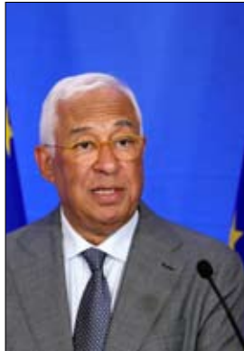
رئيس المجلس الأوروبي

في الأول من أبريل 2025، أعلن تراوري حكومة جديدة أعُتبرت الوجه العسكري