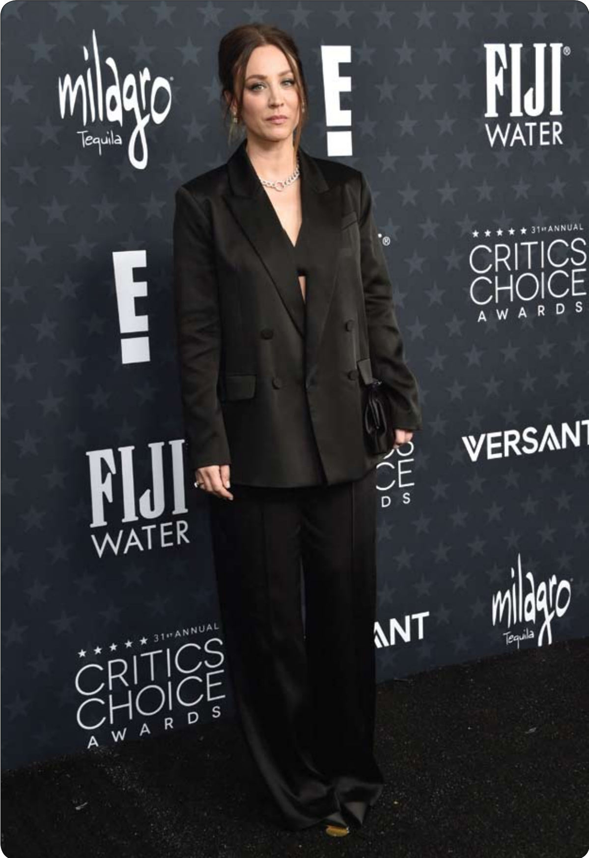
الممثلة الأمريكية كالي كوكو لدى حضورها حفل توزيع جوائز اختيار النقاد السنوي الـ31 في باركر هانغار، كاليفورنيا.

استضافت السيدة الأولى في أمريكا ميلانيا ترامب عرضاً حصرياً لفيلمها الوثائقي الجديد "ميلانيا" في البيت الأبيض، واصفة الحدث بـ "لحظة تاريخية". جاء ذلك خلال تجمع أقيم يوم السبت 24 يناير بحضور الأصدقاء والعائلة وشخصيات بارزة في مجالات الثقافة والسياسة. ونشرت ميلانيا، 55 عاماً، عبر موقع "إكس"، صورة لها على منصة العرض، معبرة عن شعورها بالتواضع والفخر لمشاركة قصصها الشخصية مع الجمهور قبل الإطلاق العالمي للفيلم. وقالت: "قصصنا الشخصية تبقى خالدة وتذكرنا بالتزامنا المتبادل تجاه بعضنا البعض. كان شرفاً لي تقديم فيلمي الجديد قبل عرضه للجمهور". ويروي الفيلم الوثائقي المشرين يوماً الأولي من عام 2025 وصولاً إلى تنصيب زوجها دونالد ترامب رئيساً للولايات المتحدة للمرة الثانية. والفيلم من إخراج بريت راتنر وإنتاج استوديوهات "أمازون إم جي إم"، ويتضمن لقطات لم تُعرض من قبل تظهر عودة العائلة إلى واشنطن ودور