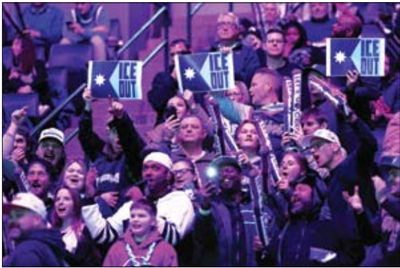
جموع يحتجون على وجود عملاء فيدراليين في مينيابوليس

الأميركية رينيه غود البالغة 37 عاما، أيضا برصاص عناصر أمن فدراليين في السابع من يناير في المدينة نفسها. وقال الرئيس الديموقراطي السابق بيل كلينتون الأحد يقع على عاتق كل واحد منا ممن يؤمنون بوعد الديموقراطية الأميركية أن ينهضوا ويتكلموا، معتبرا أن إدارة ترامب كذبت على الأميركيين في شأن مقتل