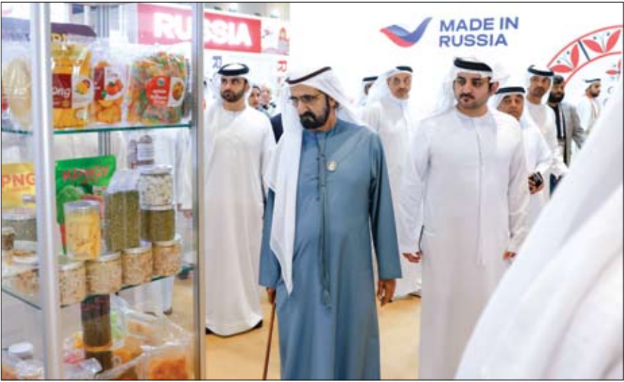
محمد بن راشد خلال زيارته معرض جلفود 2026

بدأت الولايات المتحدة الأميركية تحرّكات جديدة للضغط على الأطراف السياسية الليبية في كل من طرابلس وبنغازي، ودفعها نحو مسار توحيد المؤسسات وإنهاء سنوات الانقسام. فقد قاد هذه الجهود كبير مستشاري الرئيس الأميركي مسعد بولس، الذي أجرى سلسلة لقاءات يومي 24 و25 يناير، شملت رئيس حكومة الوحدة الوطنية عبد الحميد الدبيبة في طرابلس، ونائب قائد الجيش الليبي صدام حفتر في بنغازي. في خطوة تمكس رغبة واشنطن في الانفتاح على مختلف أطراف الأزمة. وأكد بولس، في منشور عبر حسابه في منصة أكس، أمس عدم بلاده للجهود الليبية الرامية إلى تحقيق الوحدة، معتبرا أن الاستقرار السياسي والمؤسسي يمثلان شرطا أساسيا لجذب الاستثمارات الأميركية ودفع عجلة التنمية.