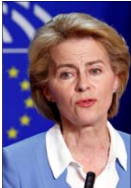
رئيسة المفوضية الأوروبية

ونقلت الصحيفة عن عدة تقارير أنه سيتم الإعلان عن اتفاقية التجارة الجديدة في 27 يناير-كانون الثاني، عندما يلتقي قادة الجانبين في قمة رفيعة المستوى، وقد وصفت فون دير لاين وزير التجارة الهندي، بيوش غويال، الصفقة الناشئة بأنها «أم كل الصفقات»، والتي تأتي بعد مفاوضات