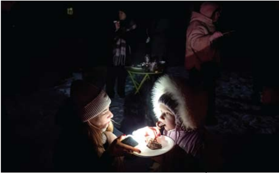
أمراة تطعم طفلاً خلال حفل أقيم في ملعب بحّ أنقطع عنه الكهرباء إثر غارات روسية في كييف، أوكرانيا. (رويترز)

نقلت وسائل إعلام روسية رسمية عن الكرملين قوله أمس الاثنين إن مسألة الأراضي لا تزال ذات أهمية جوهرية لروسيا في محادثات السلام مع الولايات المتحدة وأوكرانيا. ونقلت وكالة الإعلام الروسي عن المتحدث باسم الكرملين دميتري بيسكوف قوله إن موسكو تقيم