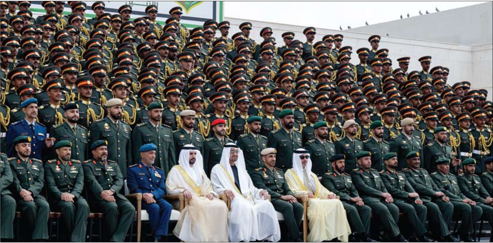
رئيس الدولة في صورة تذكارية مع خريجي الدورة الـ 50 للمرشحين والدورة الأولى للمرشحين الجامعيين من كلية زايد الثاني العسكرية في منطقة العين

شهد صاحب السمو الشيخ محمد بن زايد آل نهيان رئيس الدولة «حفظه الله، أمس حفل تخريج الدورة الـ 50 للمرشحين والدورة الأولى للمرشحين الجامعيين من كلية زايد الثاني العسكرية في منطقة العين. وهنا صاحب السمو الشيخ محمد بن زايد آل نهيان رئيس الدولة حفظه الله الخريجين، متمنيا لهم التوفيق في مسيرتهم العسكرية المقبلة لخدمة الوطن والدفاع عن مكتسباته وتجسيد القيم الأصيلة لدولة الإمارات في دعم الاستقرار والسلام في المنطقة والعالم، وتعزيز النهج الإنساني للدولة على الساحتين الإقليمية والدولية. كما وجه سموه الشكر إلى قائد الكلية وهيئة التدريس وجميع العاملين في كلية زايد الثاني العسكرية لجهودهم التي بذلوها.. مؤكدا أهمية الدور الذي تقوم به الكليات العسكرية في الدولة في رفد القوات المسلحة بكفاءات نوعية مؤهلة بالعلوم والمعارف النظرية والعملية. (التفاصيل ص2)