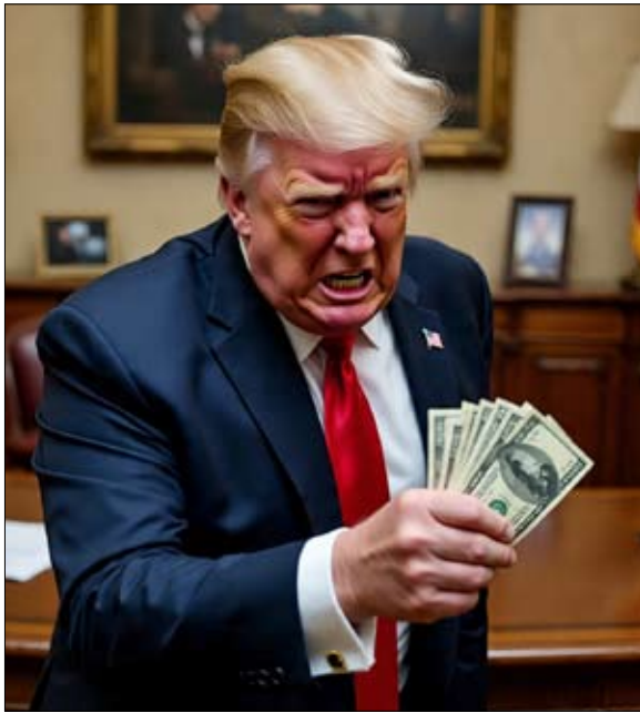
صورة مولدة عن طريق الذكاء الاصطناعي

ومن المتوقع ألا يتم تزويده برأس حربي نووي، رغم أن منظومة DRDO صممت الصاروخ ليحمل حمولات متنوعة؛ ما يمنحها مرونة تكتيكية كبيرة في المستقبل.