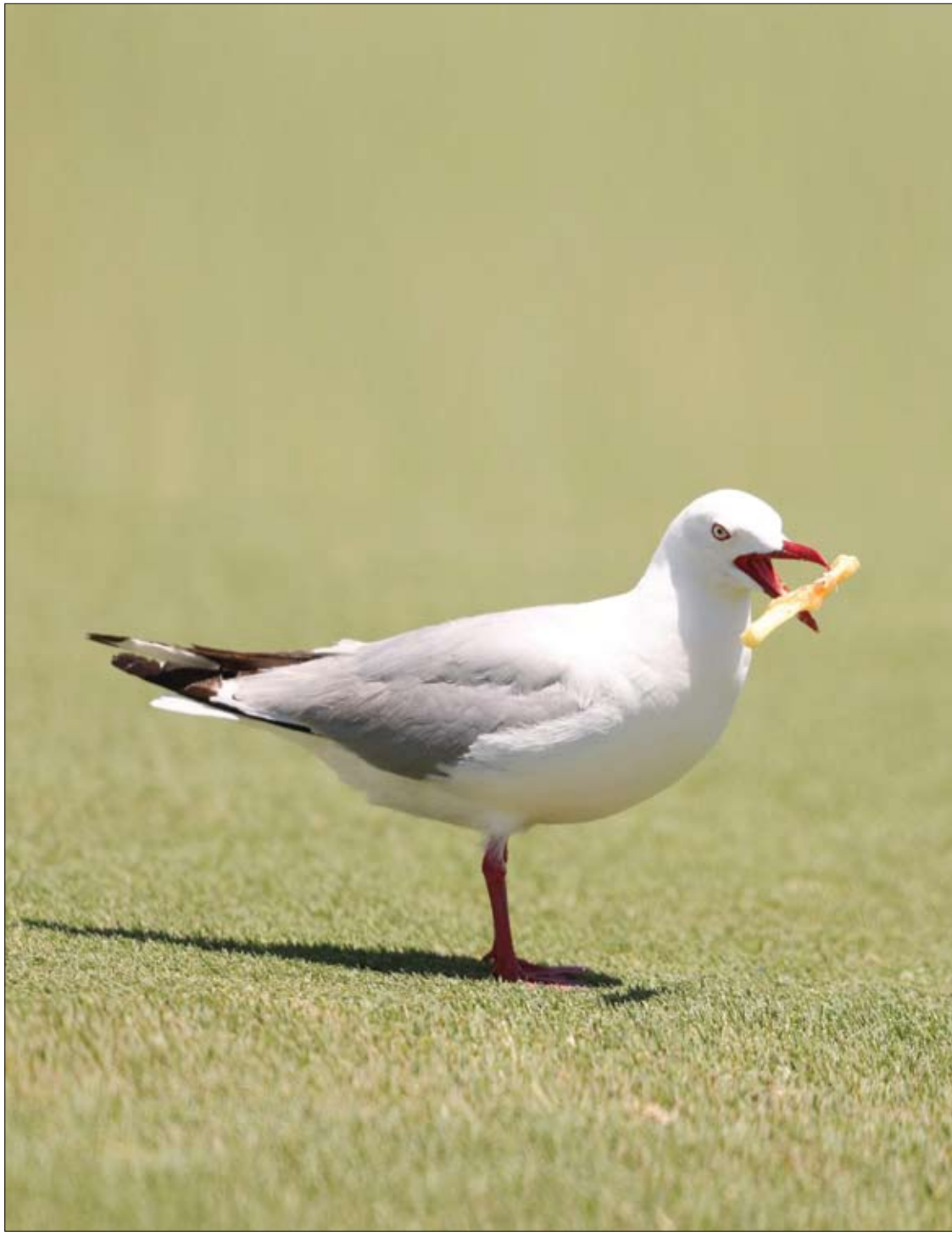
طائر النورس يستمتع برفاعة ساخنة في الملعب خلال اليوم الثالث من أول مباراة في لعبة الكريكت بين نيوزيلندا وبنغلاديش في Bay Oval في نيوزيلندا

واستنتج الباحثون من هذه النتائج، أن بدائل السكر الصناعية، وخاصة السكرالوز، تزيد الشهية والرغبة في تناول الطعام، وتسبب الشعور بالجوع، خاصة عند النساء والأشخاص الذين يعانون من السمنة المفرطة.