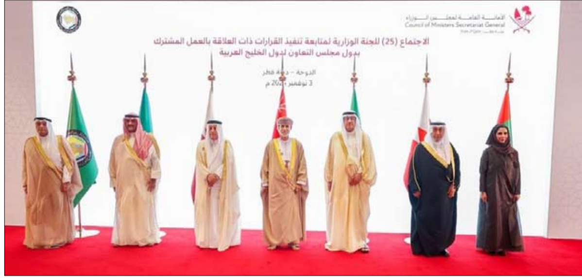
المشترك لدول مجلس التعاون لدول الخليج العربية في كافة القطاعات، وذلك من خلال الالتزام بتنفيذ كافة القرارات والمبادرات والمشاريع التي تم إقرارها في مختلف المجالات، وبما يسهم في ترسيخ رخاء وازدهار دول وشعوب مجلس التعاون الخليجي.

ترأست معالي مريم بنت أحمد الحمادي، وزيرة دولة، الأمين العام لمجلس الوزراء، وفد حكومة دولة الإمارات المشارك في الاجتماع رقم "25" للجنة الوزارية المكلفة بمتابعة تنفيذ القرارات ذات العلاقة بالعمل المشترك لدول مجلس التعاون لدول الخليج العربية، في العاصمة القطرية الدوحة. وتضمن جدول أعمال الاجتماع متابعة قرارات وتوصيات الاجتماع الـ "24" للجنة وسير التقدم في تنفيذ الدول الأعضاء لقرارات المجلس الأعلى لمجلس التعاون لدول الخليج العربية من خلال إصدار الأدوات التشريعية اللازمة للتنفيذ، إضافة إلى مناقشة آية تسريع التصديق على الأنظمة والقوانين والاتفاقيات التي يعتمدها المجلس الأعلى في هذا الشأن. كما تمت مناقشة مذكرة المركز الإحصائي الخليجي بشأن سير العمل في دراسة قياس مدى تنفيذ قرارات العمل الخليجي المشترك على أرض الواقع "السوق الخليجية المشتركة"، والبرنامج الزمني المحدد لإنجاز هذا المشروع وتوصيات المركز بهذا الشأن. وقالت معالي مريم الحمادي إن دولة الإمارات، حريصة، وفق توجيهات القيادة الرشيدة، على دعم كل ما من شأنه إنجاح التعاون، والعمل