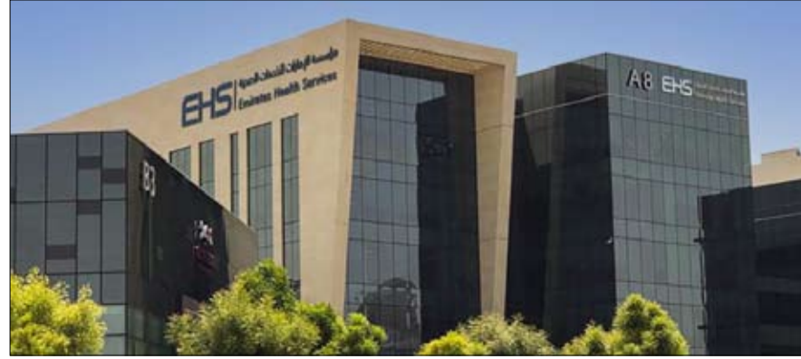
متكاملة للتواصل مع المتعاملين وأفراد المجتمع بطريقة فعالة ومباشرة، وتبني إدارة الاتصال والتسويق في المؤسسة نهجاً شاملاً يدمج بين التكنولوجيا الحديثة والدكاء الاصطناعي لإيصال الرسائل بطرق تفاعلية إلى جميع أفراد المجتمع، حيث نجحت بفضل هذه الجهود في تنفيذ أكثر من 3000 حملة ومبادرة مجتمعية