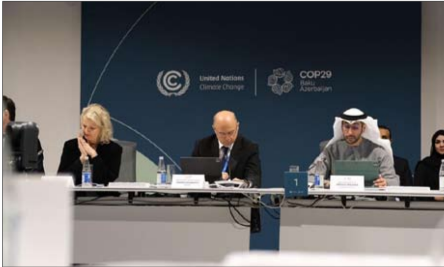
الخسائر والأضرار لا تقتصر على اقتصادها فقط، بل تؤثر في ثقافتها وهويتها وأسلوب حياتها بشكل عميق. وأضاف: تقع على عاتقنا مسؤولية مشتركة في توحيد الجهود وتعزيز التنسيق وتبادل المعرفة والخبرات بشكل فعال، والأهم من ذلك، تعبئة الموارد على مستوى غير مسبوق، وبينما نحفل بهذا الإنجاز المهم، نجدد التزامنا بالعمل الجماعي وضمان أن كل جهد نبذله، وكل

أكدت دولة الإمارات خلال مشاركتها في مؤتمر الأطراف COP29 بأذربيجان، على ضرورة مواصلة نهج الشراكة والتعاون وتوحيد الجهود بين مختلف الدول الأطراف من أجل المساهمة في تمويل صندوق الاستجابة للأضرار والاستجابة للخسائر والأضرار "FRLD" الذي تم تفعيله وبهذه تمويله خلال COP28. ومن المتوقع أن تبدأ عمليات تمويل ودعم المشاريع في الدول الأكثر تضرراً من تغير المناخ في عام 2025. جاء ذلك خلال فعاليات إطلاق الحوار السنوي رفيع المستوى بشأن التنسيق والتكامل لترتيبات تمويل صندوق الخسائر والأضرار والذي استضافته رئاسة COP29 على هامش المؤتمر بالتعاون مع مجلس إدارة الصندوق. وشهد سعادة عبد الله بالعلاء، مساعد وزير الخارجية لشؤون الطاقة والاستدامة وعضو إدارة صندوق "اتفاق الأضرار" خلال مشاركته في فعاليات إطلاق الحوار السنوي على التزام دولة الإمارات بالمساهمة في إيجاد حلول فعالة تلبي الاحتياجات العاجلة للمجتمعات والدول الأكثر تضرراً من تداعيات تغير المناخ. وقال سعادته: نحن متحدون في هدفنا الجماعي لدعم المتضررين من تداعيات التغيرات المناخية، لا سيما في المجتمعات الهشة والأكثر عرضة لتلك التداعيات، فبالنسبة لهذه المجتمعات، آثار