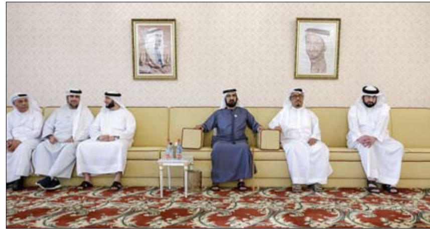
محمد بن راشد خلال استقباله رجال الأعمال والمستثمرين من القطاع الخاص (وام)

أكد صاحب السمو الشيخ محمد بن راشد آل مكتوم نائب رئيس الدولة رئيس مجلس الوزراء حاكم دبي رعاه الله، أن تصدّر الإمارات ودبي لمؤشرات التنافسية العالمية في العديد من المجالات، وارتقاءها المستمر مراتب أعلى ضمن تلك المؤشرات، هو ثمرة عمل جماعي تتضافر فيه الجهود وتتكامل فيه الأدوار في سياق رؤية واضحة للمستقبل ونهج قائم على الرصد الدقيق للمتغيرات العالمية، وتحرك سريع لمواكبة ما تحمله من فرص وما قد تجلبه من تحديات، وفكر مبدع يقدم كل يوم إضافات تخدم مسيرة التنمية وتصونها من أية مخاطر أو موقفات. جاء ذلك خلال لقاء سموه جمعاً من أعيان البلاد ورجال الأعمال