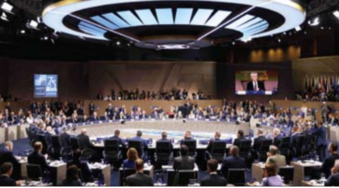
قادة الناتو خلال قمتهم التي انعقدت أمس

الأوروبي في بيان يجب على حلف شمال الأطلسي الناتو أن يتوقف عن تضخيم ما يسمى تهديداً صينياً، وأن يتوقف عن التحريض على المواجهة والتنافس، وأن يساهم بشكل أكبر في السلام والاستقرار في العالم. وإذ أعربت الصين في بيانها عن استيائها الشديد، بذت بالبيان الصادر عن قادة الحلف و"المشعب بعقلانية جديرة بالحرب الباردة ويخطأ عدائي والمليء بافتراءات،