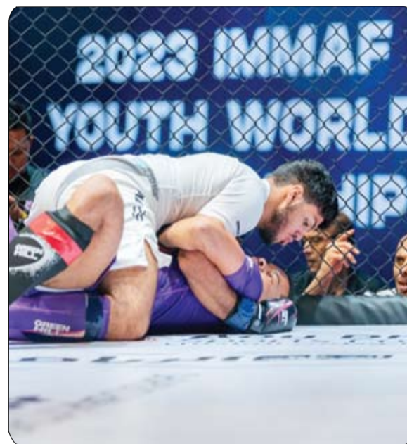
الظاهري: تستضيف العاصمة أبوظبي نسخة جديدة من بطولة البطولات العالمية. وقال سعادة محمد بن دلوج

ضيوف أبوظبي تجارب استثنائية تبرز الغنى الثقافي والحضاري للدولة". مع اقتراب موعد انطلاق البطولة، تستعد منتخباتنا الوطني لخوض المنافسات وفق برنامج تدريبي مكثف، حيث يسعى أبطالنا إلى التفوق وتقديم أداء عالياً يمكنهم من التميز وحصد الميداليات واعتلاء منصات التتويج. وأعلن اتحاد الإمارات للجوجيتسو والفنون القتالية المختلطة عن تمديد البطولة ليوم إضافي مقارنة بالنسخة الماضية وذلك لاستيعاب أكبر عدد من اللاعبين، في ظل الإقبال اللافت على التسجيل والمشاركة من مختلف دول العالم، ويعكس هذا الأمر مدى النمو الذي تشهده رياضة الفنون القتالية المختلطة على مستوى العالم.