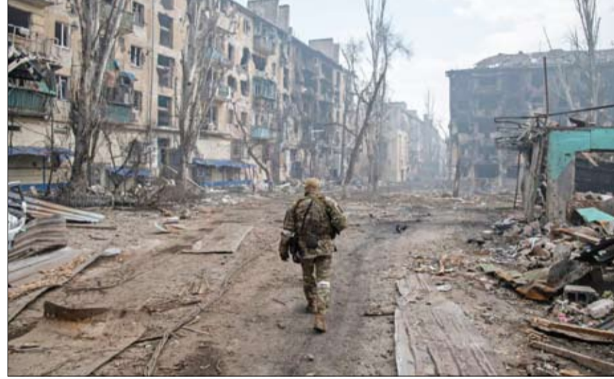
آثار الدمار جراء العمليات العسكرية في شرق أوكرانيا

وبحسب البيان تم صد 5 هجمات مضادة شنتها مجموعات هجومية أوكرانية، وبلغت خسائر العدو 335 عسكرياً ومركبتين قتاليتين للمشاة، بما في ذلك مركبة قتال مشاة أميركية الصنع من طراز برادلي ومركبتين، حسب ما ذكر موقع سيوتنيك الإخباري الروسي. وأشار بيان وزارة الدفاع إلى أن العسكريين الروس من مجموعة قوات الغرب استهدفوا القوات الأوكرانية في منطقتي سينكوفكا وبيريسستوفوي في مقاطعة خاركييف، وبلغت خسائر القوات الأوكرانية 460 جندياً، ودبابه، و3 ناقلات جند مدرعة، والعديد من المدافع.