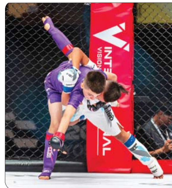
والفريدة للرياضيين والجمهور على حد سواء، بما يؤكد على مكانتها كعاصمة لرياضات الفنون القتالية ووجهة لاستضافة كبرى

رئيس لجنة الفنون القتالية المختلطة حيث تم الاطلاع على كافة تحضيرات واستعدادات اللجنة المنظمة واللجان الفرعية لاستضافة البطولة وفقاً لأعلى المعايير العالمية. ورفع الحضور أسى آيات الشكر والامتنان إلى القيادة الرشيدة، وللدعم اللامحدود للرياضة والرياضيين، مؤكداً أن كل ما حققته رياضة الجوجيتسو والفنون القتالية المختلطة الإماراتية من تقدم ونجاح وإنجازات ما هو إلا ترجمة لرؤية الحكمة والتوجهات السديدة من القيادة الرشيدة. وركز الاجتماع على متابعة سبل الارتقاء بالمعايير المعتمدة في تنظيم واستضافة البطولات، للتأكيد على المساهمة في تعزيز رياضة العاصمة أبوظبي في توفير التجارب المبتكرة