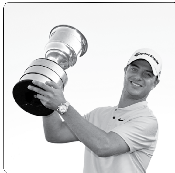
جولة دي بي ورلد للجولف إقامة 44 بطولة في 24 دولة حول 317 نقطة. وتشهد روزنامة 81 برصيد جولة دي بي ورلد للجولف إقامة

أولى، انتهت بتعادلهم مجدداً برصيد 4 ضربات تحت المعدل، ثم تفوق الإيطالي في الجولة الفاصلة الثانية بتسجيله 4 ضربات تحت المعدل مقابل 5 ضربات تحت المعدل منافسيه.