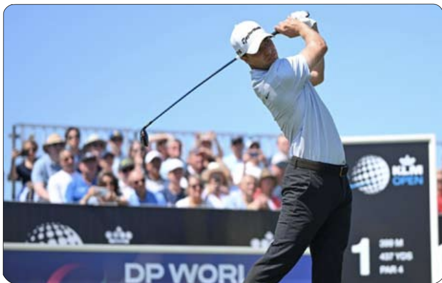
العالم هذا الموسم، على أن يكون ختام الموسم الحالي للجولة التي تطوف العالم تحت شعار "السباق إلى دبي"، بضيافة الإمارات مع نظام متجدد عبر بطولتين على التوالي في شهر نوفمبر من العام

ويشهد الموسم الحالي إقامة خمس سلسلات دولية لكل منها هويتها الخاصة هذا الموسم في جولة دي بي ورلد، ولكل سلسلة بطولها الخاص، الذي سيكسب في كل منها 200 ألف دولار أمريكي من مجموع مكافآت مالية إضافية تبلغ مليون دولار أمريكي. ويتأهل أبطال كل سلسلة إلى بطولات سلسلة "باك 9"، قبل أن يختتم الموسم بعد أن يطوف العالم تحت عنوان "بلاي أوف" الختامي لجولة دي بي ورلد.