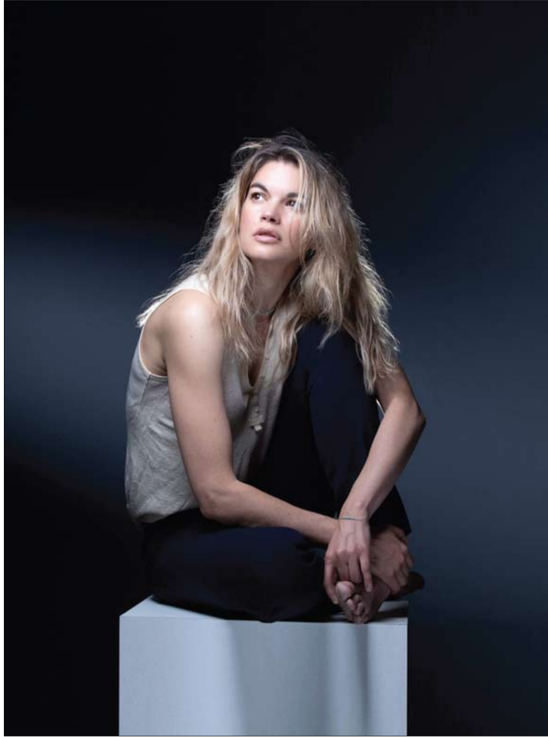
الممثلة الفرنسية ماري صوفي هردان خلال جلسة تصوير في باريس.

ويشير الباحثون، إلى أنه لم تعرف بعد كيف تؤثر الفواكه في حساسية الأنسولين، ولكن يحتمل أن يكون التأثير متعدد الجوانب. وأن الفواكه والخضروات التي تحتوي على مركبات الفلافونويد مفيدة بصورة خاصة في هذه المسألة.