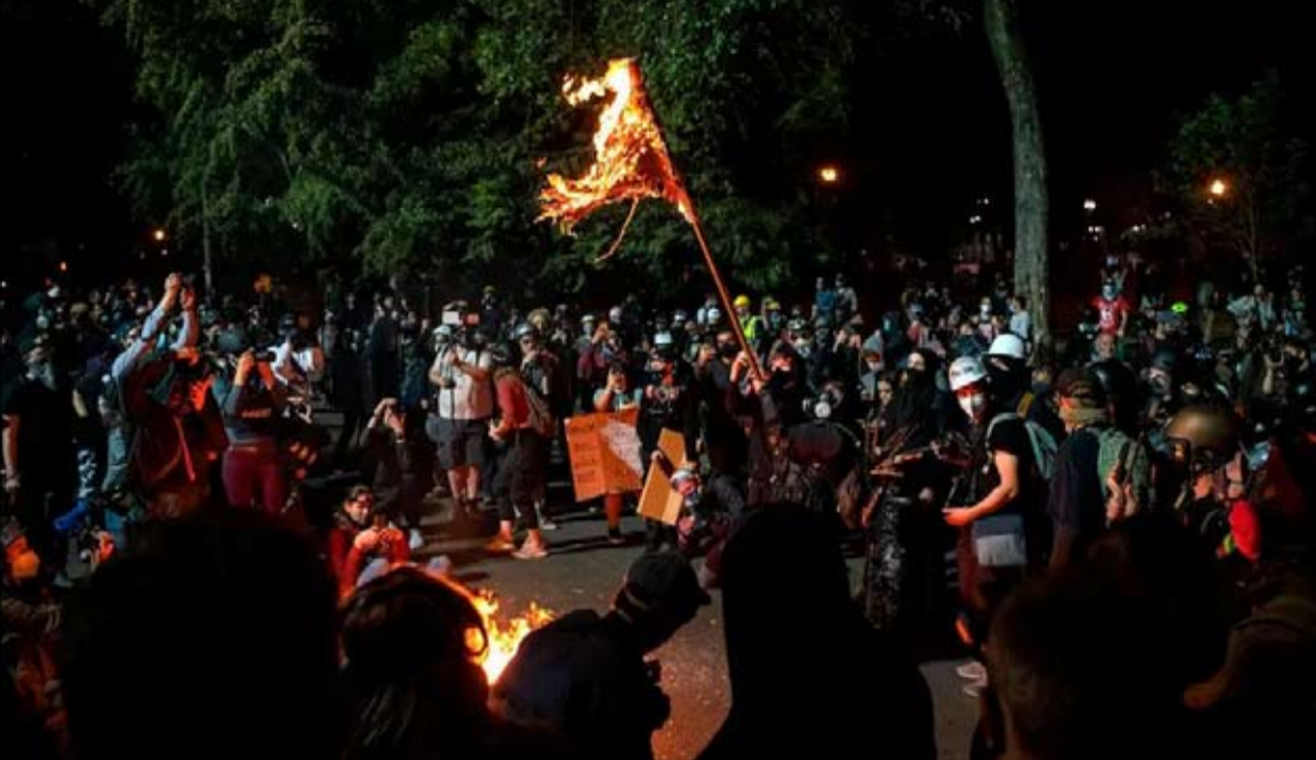
العنف السياسي قابل للاشتعال في كل لحظة