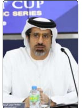
•• أبو ظبي - وام:

العالمية وتشجيعهم على زيادة إنتاج الخيل العربي، دعماً لنهج المفهوم له الشيخ زايد بن سلطان آل نهيان، طيب الله ثراه.. يأتي ذلك تحت مظلة اللجنة العليا المنظمة برئاسة سعادة مطر سهيل البهيوني، ويشرف عام من فيصل الرحماني مستشار مجلس أبوظبي الرياضي، في ظل التنسيق والتعاون مع الاتحاد الألماني للخيول العربية.