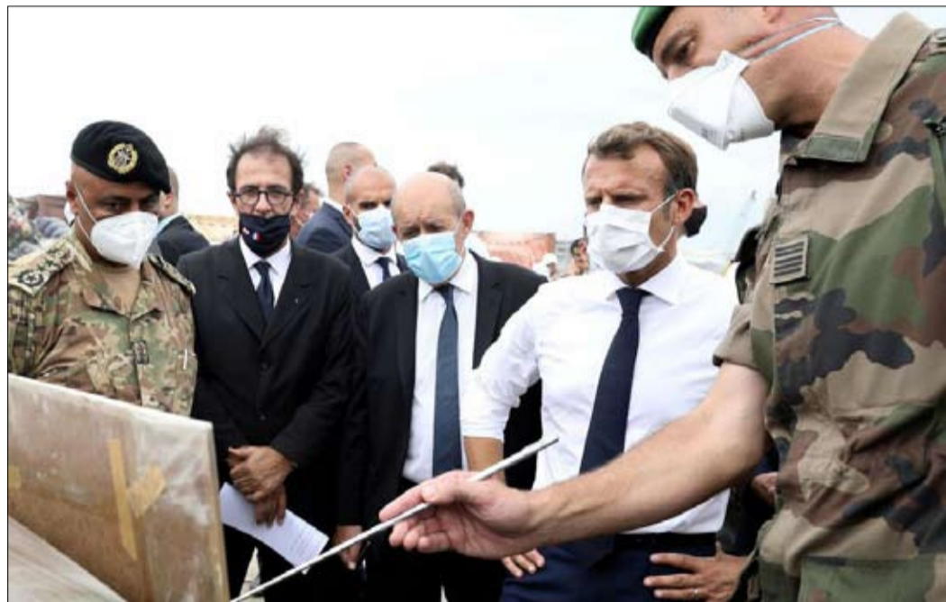
الزيارة الثانية لبيروت

ترجع إلى «صلابة قاعدته» أكثر من نشاطه الدولي... لكن الرأي العام يتغير. كل شهر، يطلب المعهد الفرنسي للرأي العام من الفرنسيين ترتيب الموضوعات التي حركت نقاشاتهم في الأيام القليلة الماضية حسب الأهمية. عادة في أسفل الجدول، تصيل القضايا الدولية إلى الصعود: في أغسطس، كان انفجار بيروت يحتل المرتبة الرابعة على قائمة المستطلعين. وفي العام