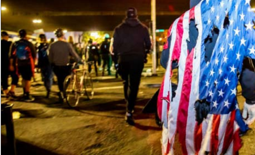
متظاهر خلال مسيرة في أوكلاند، كاليفورنيا

تقوم مجموعة العمل هذه بأعمال التوعية، فإنها ستكون في وضع جيد بشكل خاص لترميز المعلومات إلى السلطات الفيدرالية التي يمكن أن تغذي أحياناً، عن قصد أو عن غير قصد، دورات العنف. كما أنها تخفف من تأثير العنف عند حدوثه، على سبيل المثال، من خلال وضع برامج لمكافحة أنشطة التوظيف، أو إنشاء "جسور خروج" لمن يرغبون في مغادرة مجموعة عنيفة. ثالثاً، تقوم هذه المجموعة المتخصصة في العنف السياسي بتنسيق رد الإدارات المختصة المختلفة في حالة حدوث أزمة. ومن خلال تبادل أفضل الممارسات، فإنها ستوفر المعلومات والمشورة الأساسية للوكالات المشاركة في التدخل المبكر، وإجراء أنشطة التوعية لساعة لضمان أن تدخلات الدولة تقلل