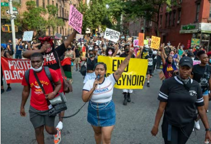
سلمية الاحتجاجات مطلب ملح عشية الرئاسية