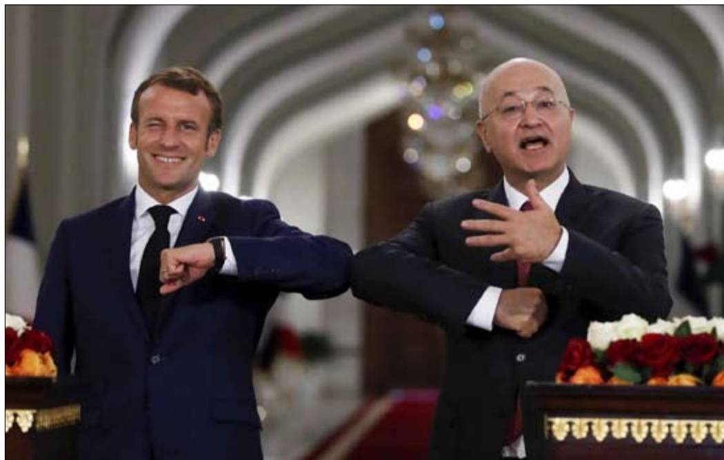
ماكرون في العراق

فترة الخمس سنوات، كانت مقلته 'نجل كوكينا عظيماً' مرة أخرى قد بنت صورته بقوة، ولا تزال قدرته على تمثيل فرنسا نقطة قوة، يلاحظ برنارد سانان، مدير ايلاب. لكن، من زاوية نظره، قد ينقلب ذلك على الرئيس الفرنسي ويأتي بنتائج عكسية. فإذا اشتدت الأزمة الاجتماعية هذا الخريف، سيجد الفرنسيون الأكثر اهتماما بالقضايا الفرنسية-الفرنسية، صعوبة في فهم أن الرئيس ينفق الكثير من الطاقة والجهد على الساحة الدولية.