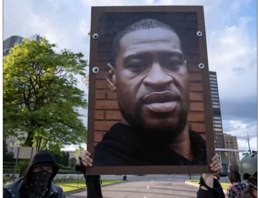
الضحيا تتحول الى رموز سياسية

لقد أدرك ليندون جونسون ذلك عندما واجه اضطراباً سياسياً أثناء رئاسته. في مساء عام 1968، عندما اغتيل مارتن لوثر كينغ، خاطب الرئيس الأمريكي، رئيس البلدية على النحو التالي: "من فضلك لا ترسل شرطتك بينادق ضخمة وتتركهم لحالهم؛ لأنه إذا بدأ إطلاق النار، فقد لا يتوقف أبداً..". يخشى العديد من الخبراء من ظهور العنف السياسي مع اقتراب أو لحظة الانتخابات الرئاسية هذا الخريف. في 18 أغسطس، ظهرت مذكرة من وزارة الأمن الداخلي مع هذا التحذير: يمكن لمثيري الشغب والتعبئة "بسرعة" لتخريب الانتخابات "بعد ما يعتبره البعض مطالب المؤيدين المرتبطين بالسياسات الحكومية".