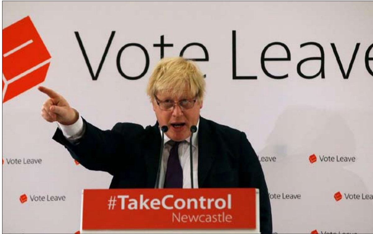
ذريعة بوريس تدحضها الوقائع