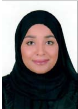
المتعلقة بالمرأة على أيدي مختصين قانونيين واجتماعيين ونفسيين لضمان وحفظ حقوقها.

وقع عليهن عنف جسدي ولفظي، إلى جانب احتضان 99 مرافقاً من الاطفال، حيث أن المركز يستقبل الحالة مع مرافقها. علماً أن دائرة الخدمات الاجتماعية خصصت خطاً مالياً 800800700 مجانياً لتقديم الاستشارات الاجتماعية والنفسية والقانونية، وإيجاد الحلول للمشاكل الأسرية