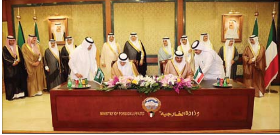
صباح خالد الصباح وعادل الجبير خلال توقيعهما محضر إنشاء مجلس تنسيقي بين الكويت والسعودية