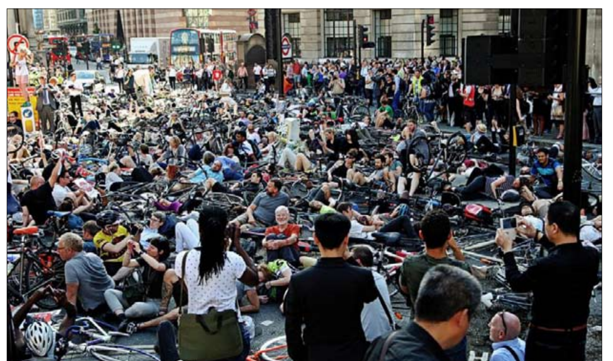
تظاهرة الموت على طرقات لندن