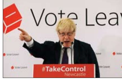
ذريعة بوريس تدحضها الوقائع الخارجية المستقبل واستنجد بمشال من خبرته كعمدة... لقد عبر عن إحباطه من منعه من حماية مستعملي الدراجات ضد الحوادث بسبب أوروبا. (التفاصيل ص12)

توصلت حكومة جنوب السودان والمتمردون إلى اتفاق لتقاسم السلطة، سيتم التوقيع عليه بصيغته النهائية قبل نهاية الشهر الجاري. وقالت وزارة الخارجية السودانية في بيان صدر في الخرطوم، حيث تجري جولة جديدة من محادثات السلام منذ يونيو: تعلن الوساطة السودانية في النزاع الداخلي بجمهورية جنوب السودان عن توصل أطراف النزاع في ذلك البلد الشقيق لاتفاق في ملف الحكم وتقاسم السلطة، مؤكدة أنها لم تتلق من أي طرف ما يفيد برفض الاتفاق. وأوضح البيان أنه سيتم التوقيع لاتفاق اليوم الخميس بالأحرف الأولى على أن يتم التوقيع النهائي في يوم الخميس الموافق 26 من الشهر الجاري. وفتلت العديد من الجهود لإحلال السلام في جنوب السودان.