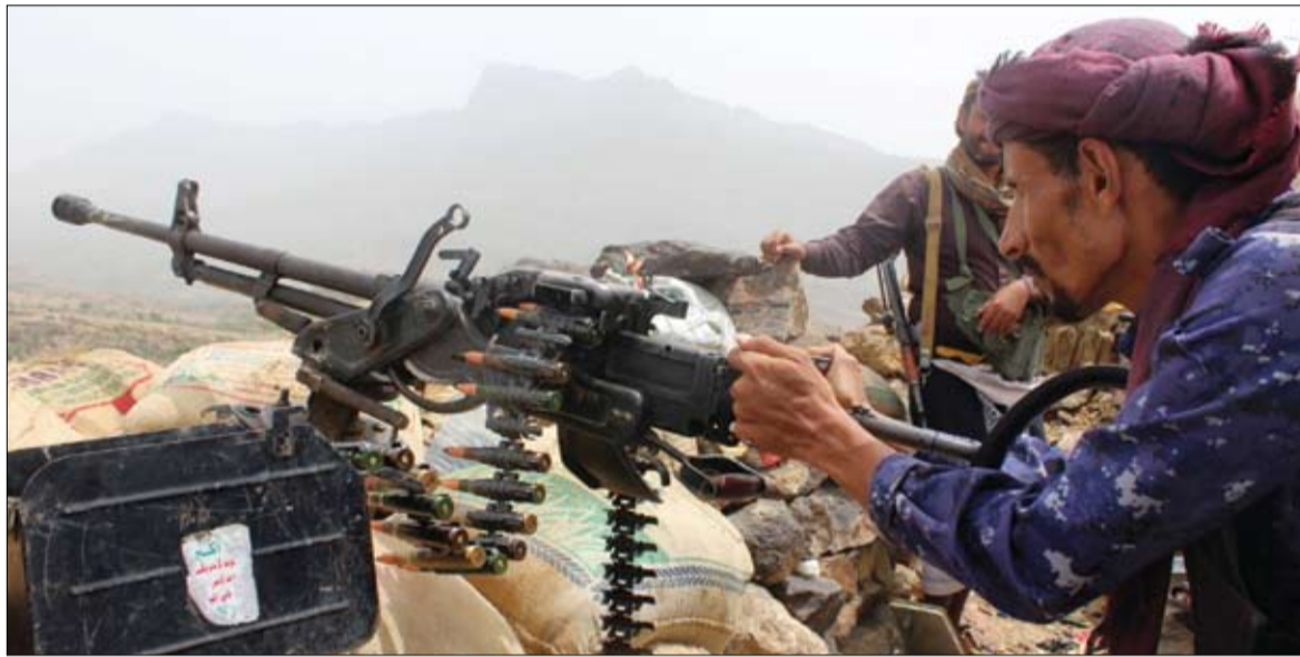
المقاومة اليمنية تصد هجوما للمليشيات الانقلابية شرق وغربي مديرية التحتيا

والجرحى نحو منطقة المزارع، تحت قصف قوات المقاومة. وتتوافد تعزيزات قوات المقاومة إلى مدينة التحتيا وحول منطقة الفازة استعدادا لشن هجوم كبير على مليشيات الحوثي الإيرانية في مديرية زيد، ثاني أكبر مدن محافظة الحديد.