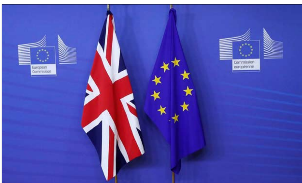
ثقل بيروقراطية بروكسل فرضت الانسحاب