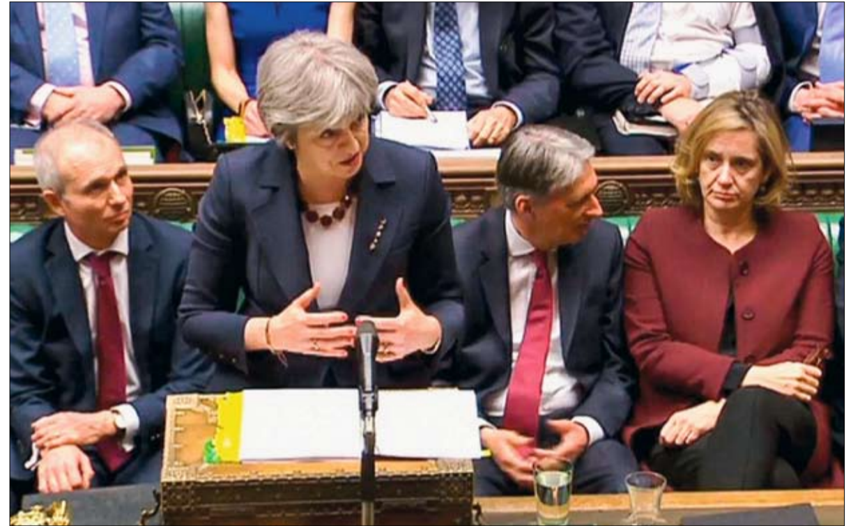
درجات بوريس تزعم مستقبل ماي