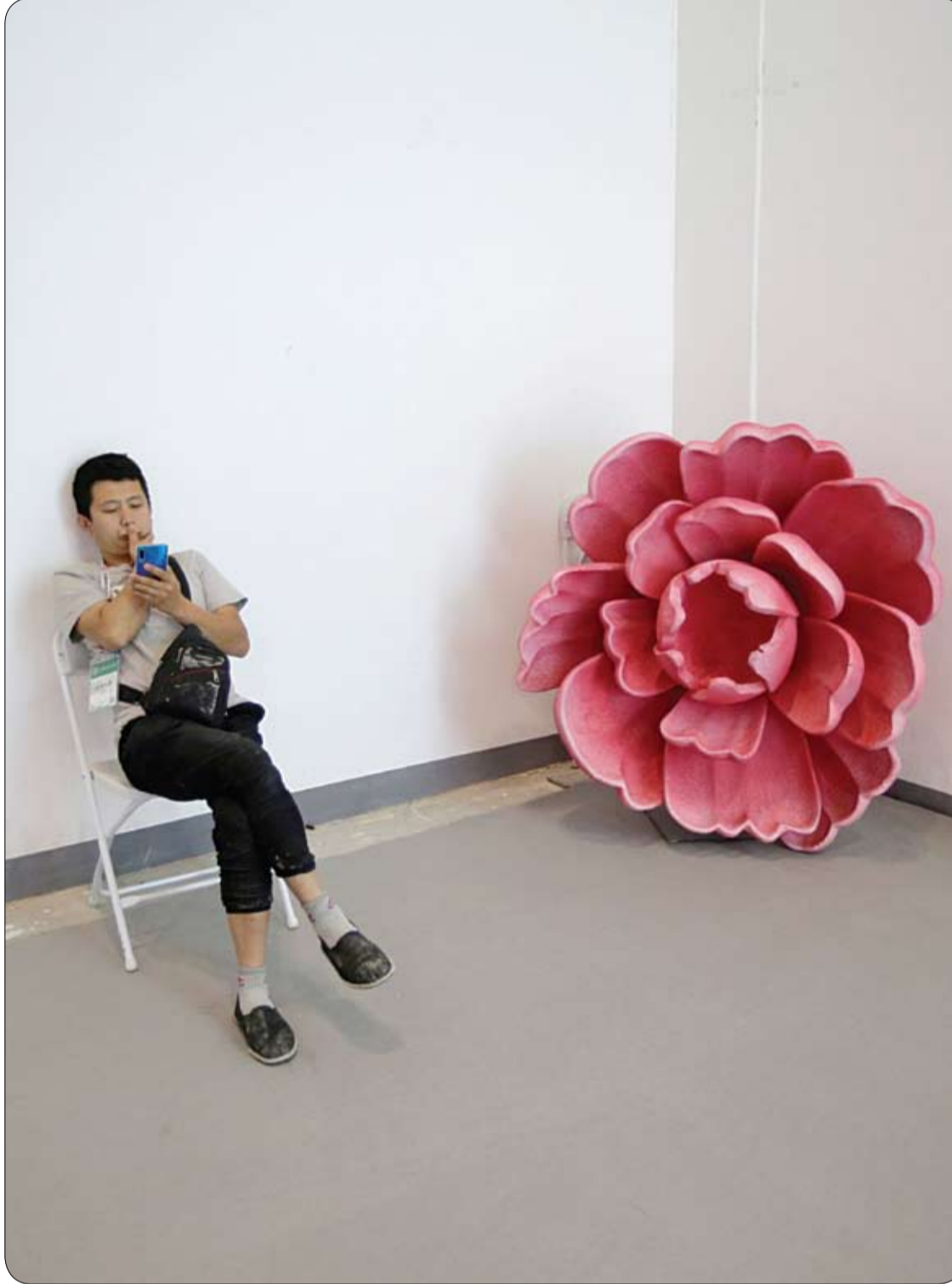
رجل يجلس بجانب وردة ضخمة كديكور في معرض الصين الدولي لتجارة الخدمات في بكين.

وأضافت: نخطط الآن لتوضيح التأثيرات المضادة للسرطان للمركبات النشطة بيولوجيا، والمستمدة من النباتات في الأمازون، بهدف استخدامها في المستقبل في الوقاية والعلاج من سرطان المعدة.