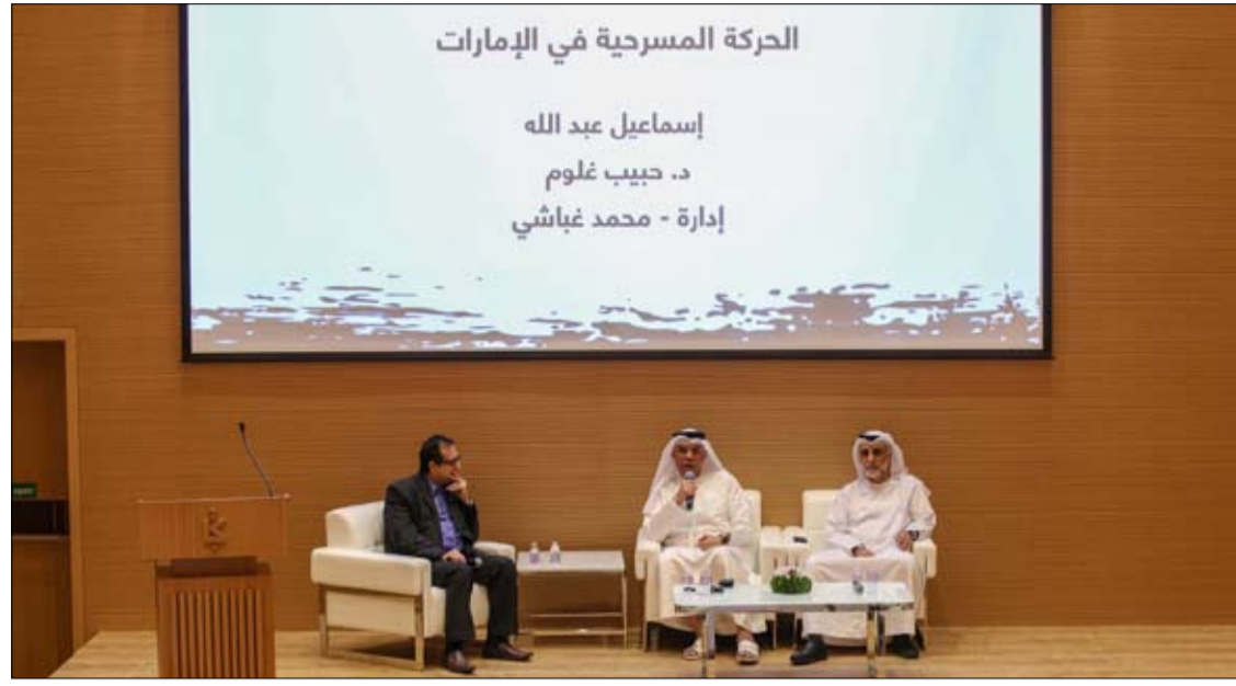
خلال ندوة حوارية حملت عنوان «الحركة المسرحية في الإمارات»

ناقش معرض الكتاب الإماراتي الذي نظمت دورته الأولى هيئة الشارقة للكتاب بالتعاون مع اتحاد كتاب وأدباء الإمارات، أثر الحراك المسرحي الإماراتي في تشكيل المشهد الثقافي في دولة الإمارات، والشخصيات التي لعبت دوراً محورياً في النهوض به، إلى جانب استعراض الخط التاريخي الذي مرّ به والمنعطفات التي خاضها على امتداد مسيرة طويلة تصل إلى أربعين عاماً من العطاء والإبداع.