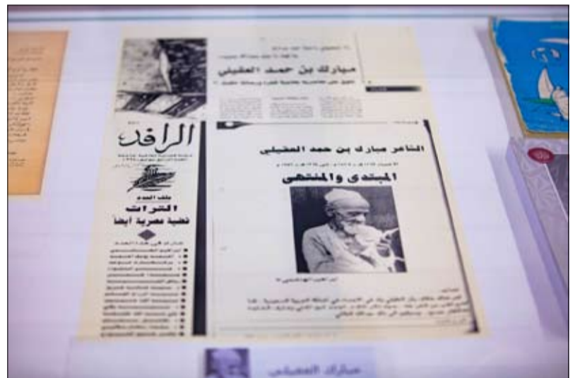
خصصه معرض الكتاب الإماراتي بالتعاون مع مركز جمعة الماجد للثقافة والتراث