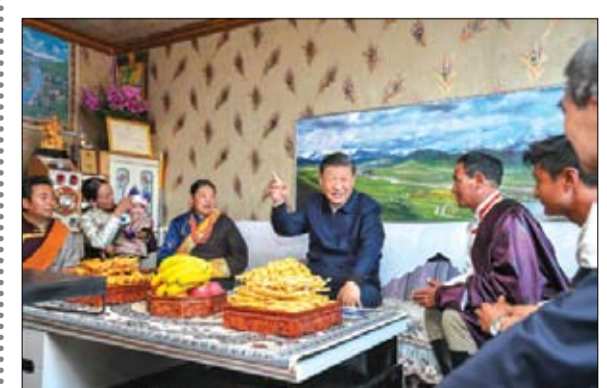
الرئيس الصيني في الطريق لولاية جديدة

المثير للقلق، يقوم اعوان يرتدون زي رواد الفضاء بنشر سحب من المطهرات في كل زاوية وركن في العاصمة الإمبراطورية السابقة، وتم قطع جميع المواصلات بالقطار أو الطائرة. في مواجهة ظهور متحور