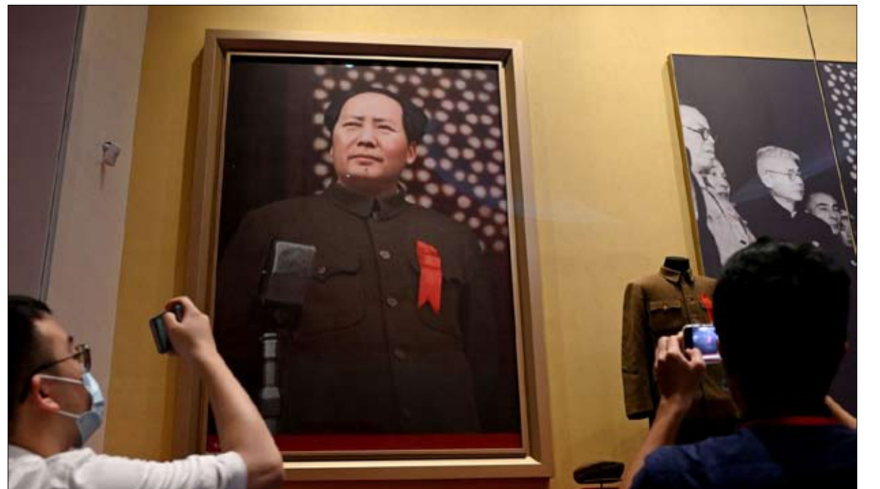
العودة الى القيم الاشتراكية