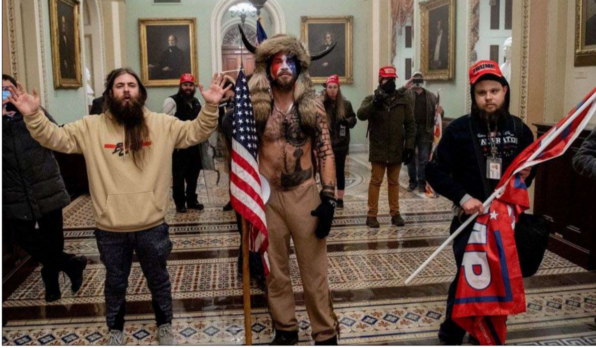
أصناف الرئيس الأمريكي ترامب، عند اقتحام مبنى الكابيتول