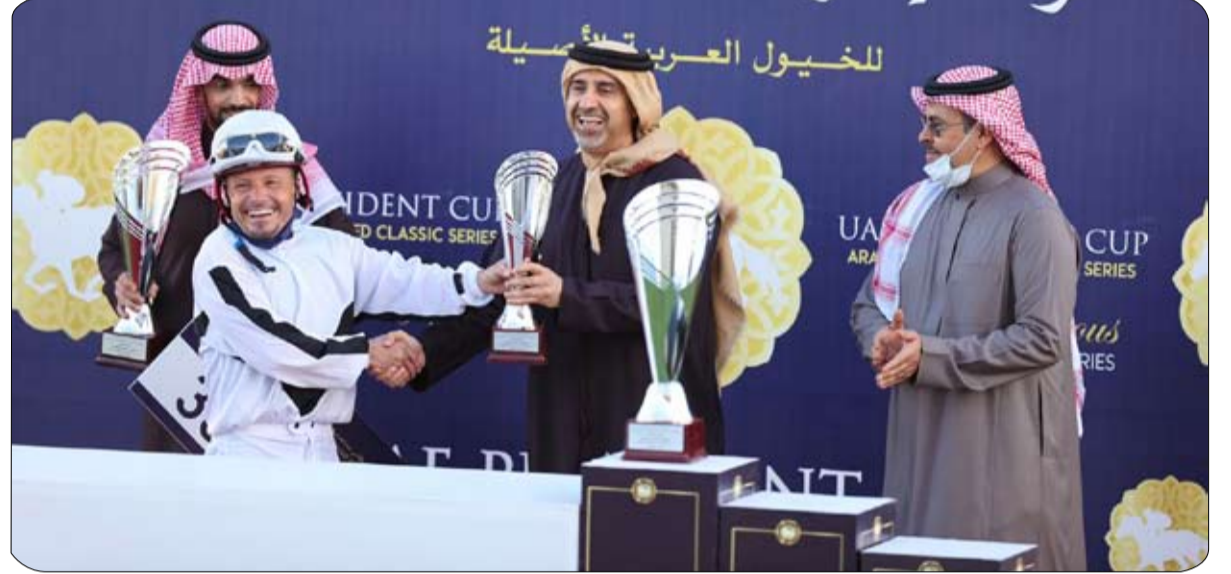
«حمداني خالد الخالدية» يحصد لقب المحطة السعودية لكأس رئيس الدولة للخيول العربية