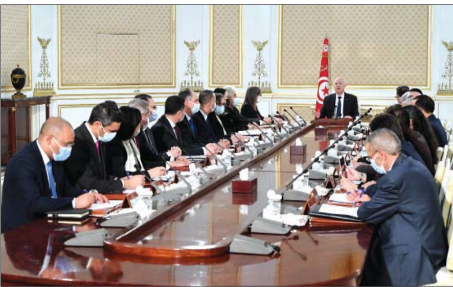
سعيد يرد على منتقديه

أتى ذلك بالتزامن مع ضربات لطيران تحالف دعم الشرعية الذي استهدف تعزيزات وتحصينات الحوثيين في الجبهتين الجنوبية الغربية، وكبد إياها خسائر في الأرواح والآليات والأطقم العسكرية. وكان التحالف أعلن أمس الأول، تنفيذ 28 عملية استهداف للميليشيات في مأرب، و35 عملية في شبوة، خلال 24 ساعة. كما أشار إلى أن الضربات ضد الحوثيين في مأرب دمرت 19 آلية للميليشيات وقتلت 150 عنصراً. يذكر أن الجيش اليمني الذي أطلق معركته المتزامنة على جبهات المحافظتين قبل أسبوع، حقق خلال الأيام الماضية تقدماً ملموساً في مأرب وشبوة على السواء.