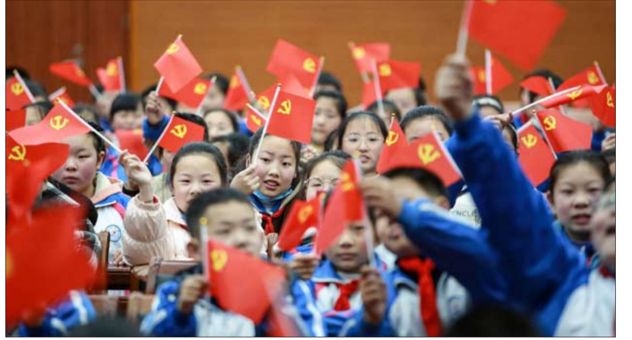
إعادة تأطير المجتمع نحو المحافظة