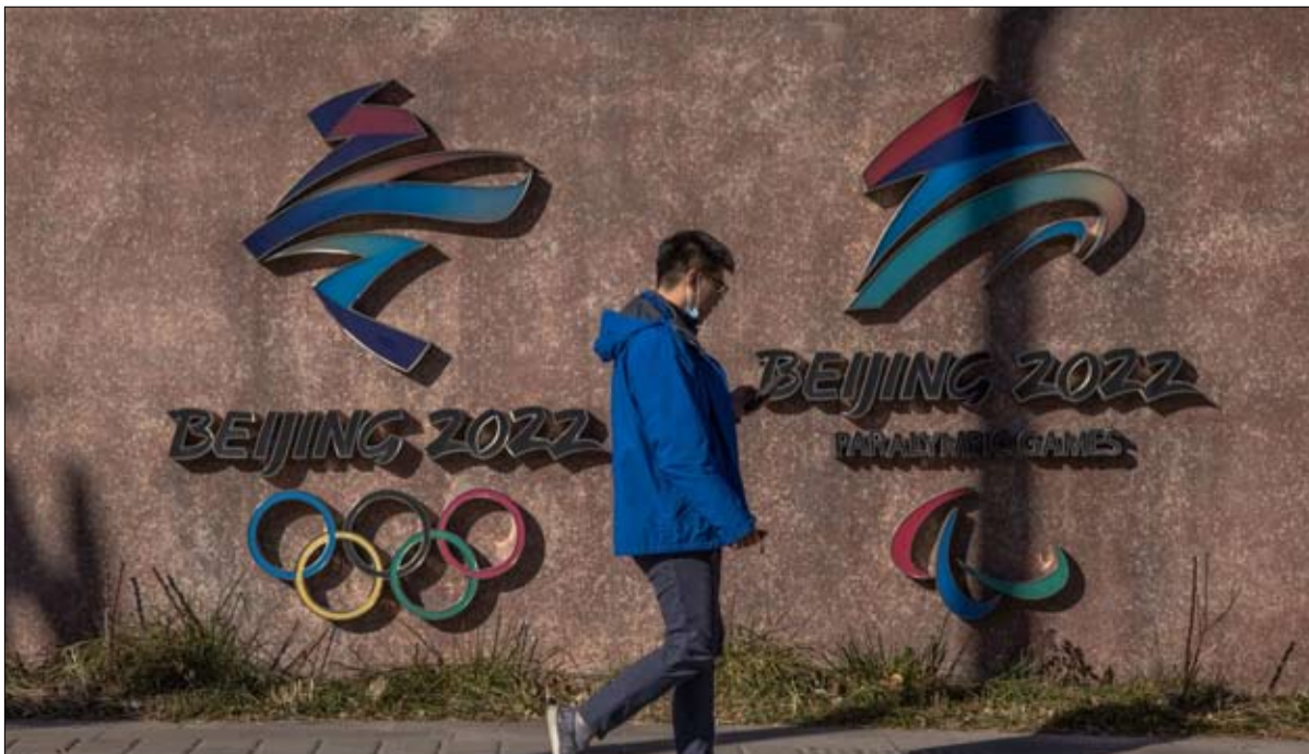
تفادي التشويش على الألعاب الاولمبية