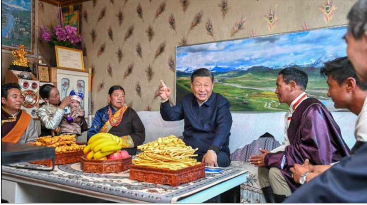
الرئيس الصيني في الطريق لولاية جديدة