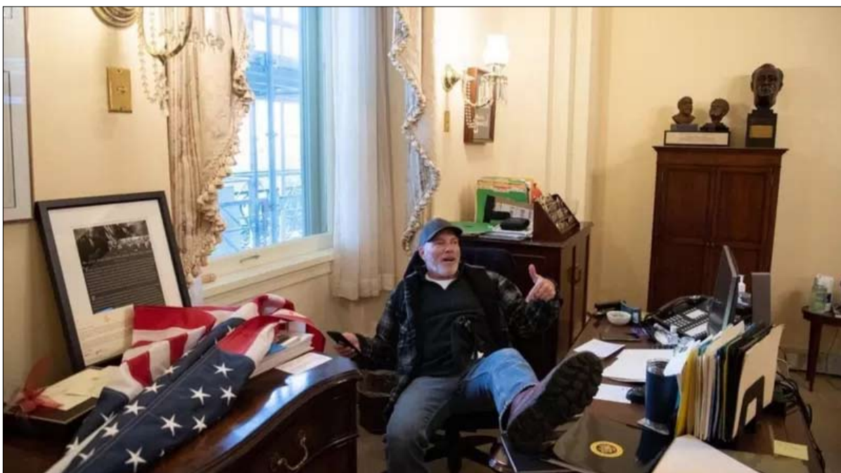
ريتشارد بارنيت، في الصورة وهو يضع قدمه على مكتب بيلوسي