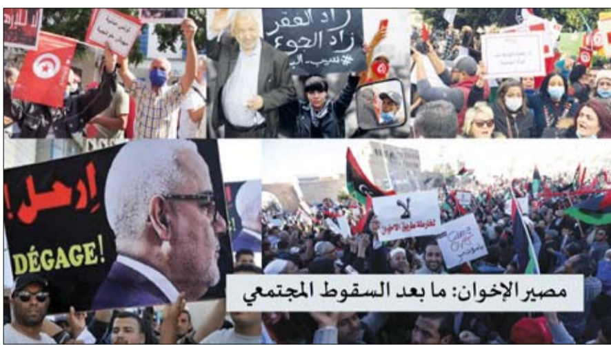
مصر الإخوان: ما بعد السقوط المجتمعي

ثم باد، بعد عقد من الزمن من مراقبة تجربتهم في الحكم في عدد من الدول العربية. ويضيف أن هذا الموقف الشعبي العربي تزامن مع بوادر دولية واقتصادية وعربية لتقطع جسور الدعم والتأييد التي كانت السبب في تقوية موقف “الإخوان”، إذ إن بروزهم السياسي لم يكن بفعل قوتهم الذاتية فقط، وإنما بإرادة خارجية أيضاً. ويؤكد الصوالي أن الموقف الخارجي تطور في الاتجاه الصحيح، بعد استيعاب أصحاب القرار في الغرب لمخاطر تيارات الإسلام السياسي على النسيج المجتمعي وتبايعاتها على قيم الحوار والتسامح، وبعد تقليعة سياسية أو “موضة” سادت