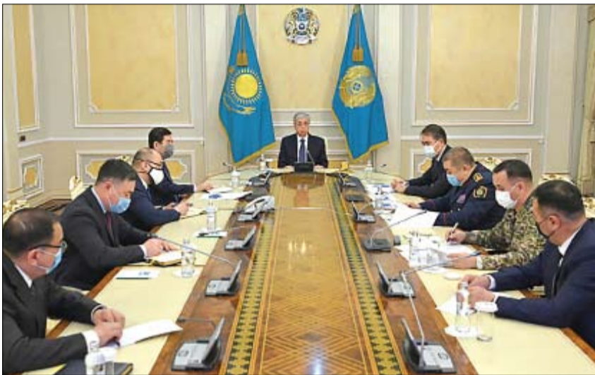
الرئيس الكازاخستاني يعقد اجتماعاً مع مقرر مكافحة الإرهاب في ألما آتا.

وكان توكايف أعلن في وقت سابق، الجمعة، أنه أصدر أوامر بإطلاق النار بقصد القتل في مواجهة أي إقلاق يثيرها من وصفهم بقطاع الطرق والإرهابيين. وبدأت الاحتجاجات في المناطق الغربية بالنفط في الثاني من يناير الجاري، بعد رفع أسعار الغاز المسال المستخدم على نطاق واسع، وسرعان ما امتدت إلى مناطق أخرى بالبلاد، ولا سيما العاصمة