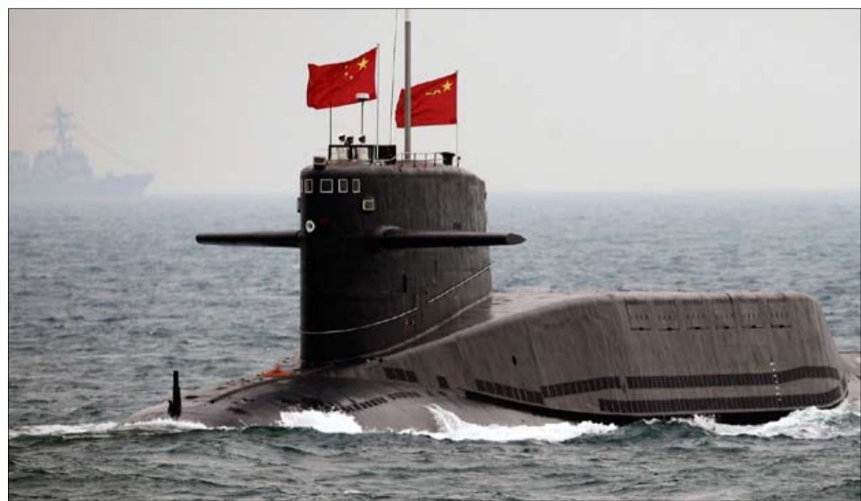
المطالبة باستعادة تايوان

الفجر - سيريل بلويت - ترجمة خيرة الشيباني