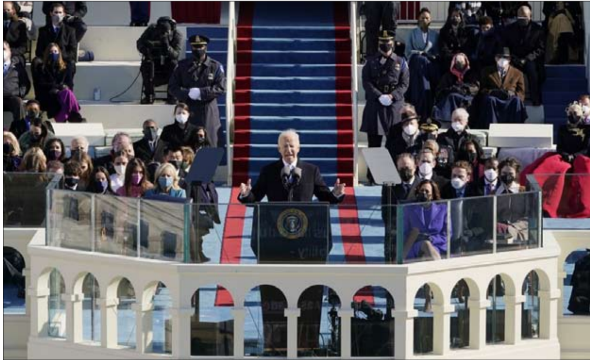
يمكن توقع أن يكون أسلوب الرئيس الجديد ومحيطه مختلفا

من الموقف من وباء كورونا فيروس إلى إدارة نفقات الميزانية، ومن الوجود بالحد من التفاوض الاجتماعي إلى متطلبات القانون والنظام في الولايات المتحدة،