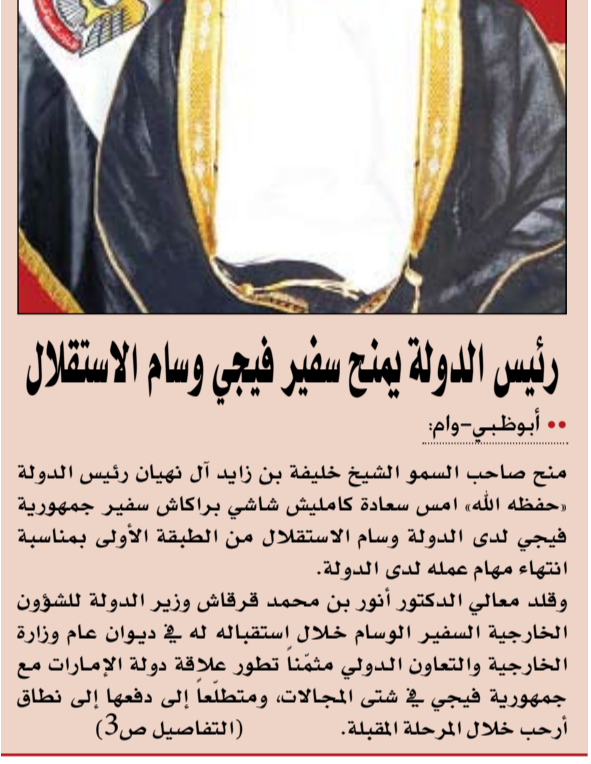
رئيس الدولة يمنح سفير فيجي وسام الاستقلال

•• أبوظبي-وام: منح صاحب السمو الشيخ خليفة بن زايد آل نهيان رئيس الدولة «حفظه الله» أمس سعادة كاملش شاشي براكاش سفير جمهورية فيجي لدى الدولة وسام الاستقلال من الطبقة الأولى بمناسبة انتهاء مهام عمله لدى الدولة. وقد معالي الدكتور أنور بن محمد قرقاش وزير الدولة للشؤون الخارجية السفير الوسام خلال استقباله له في ديوان عام وزارة الخارجية والتعاون الدولي متمنًا تطور علاقة دولة الإمارات مع جمهورية فيجي في شتى المجالات، ومتطلعًا إلى دفعها إلى نطاق أرحب خلال المرحلة المقبلة.