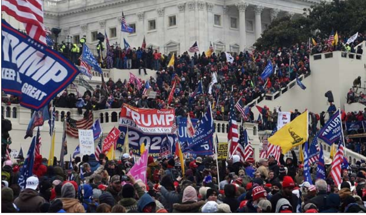
الأكاذيب أدت إلى هذا الهجوم