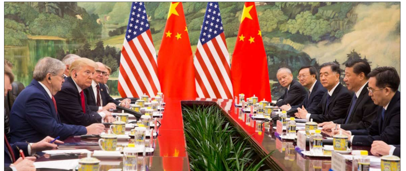
سينغيتير الاسلوب بالتاكيد