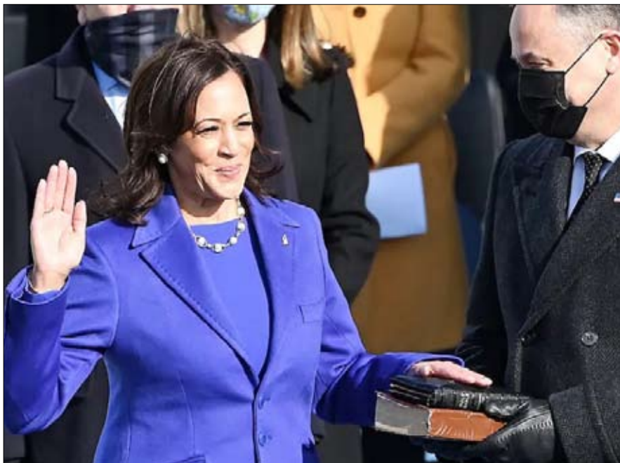
كامالا هاريس استلهمت الروح العلمية من والدتها