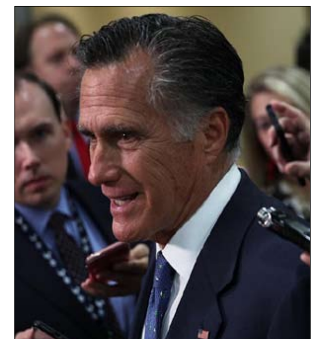
مساندة ميت رومني وتجاوز الحدود الحزبية