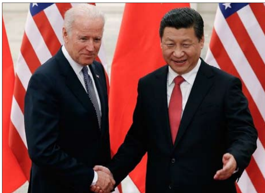
جو بايدن وشي جين بينغ في 4 ديسمبر 2013 في بكين

"يجب أن نواجه الصين من موقع قوة وليس ضعف"، شدد أنتوني بلينكين، مضيفاً أنه من المهم "العمل مع الحلفاء بدلاً من تنويع سمحتهم، والمشاركة في قيادة المؤسسات الدولية بدلاً من الانسحاب منها". يذكر أن دونالد ترامب قرّر سحب الولايات المتحدة من منظمة الصحة العالمية، وكذلك من اتفاقية باريس للمناخ. وصدر قرار بعودة أمريكا الشمالية إلى هذه المعاهدة الأخيرة عندما تولى جو بايدن منصبه... قرار رحب به الصحافة الصينية على الفور. وتؤكد كلمات وزيرة الخارجية الجديد، أن الولايات المتحدة ستسعى لاجتواء التوسع التجاري للصين. ولهذا، هناك اختلاف آخر مع دونالد ترامب، حيث أعلن جو بايدن خلال حملته الانتخابية أنه سيسعى إلى تقريب وجهات النظر مع الدول الأوروبية. وبالتوازي، يجب على الولايات المتحدة أن تنظم محورا