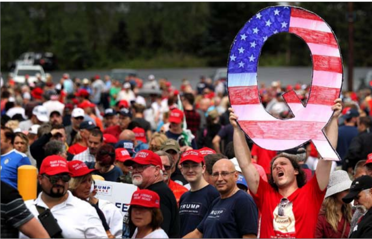
انصار المؤامرة والخرافة