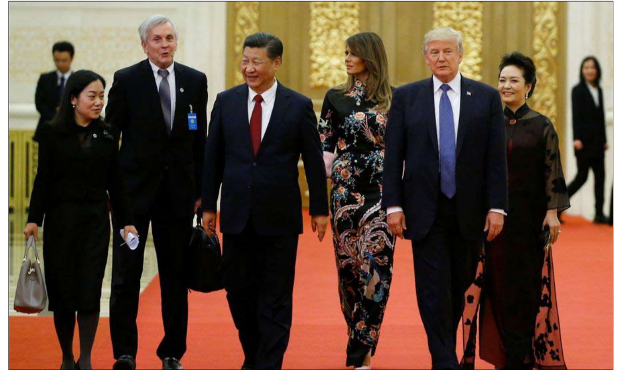
ترامب وزوجته في بكين

في 20 يناير. وهي لا تجرؤ على التفكير في إمكانية حدوث تغييرات حقيقية في علاقة الولايات المتحدة بالصين. وفي الوقت نفسه، أشارت افتتاحيات الصحف الصينية الكبرى إلى رغبة في الابتعاد عن السلوك الأمريكي خلال سنوات ترامب.