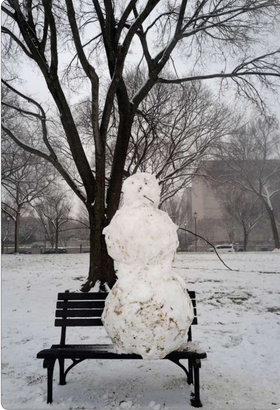
رجل ثلج على مقعد وسط الثلوج في ناشيونال مول بالعاصمة الأمريكية واشنطن.

وأضافت "كان يعالج خلال الأسابيع القليلة الماضية من الالتهاب الرئوي وثبتت الأسبوع الماضي إصابته بكورونا. كان معنا في البيت حتى أمس عندما احتاج لمساعدة إضافية في التنفس. يُعالج في جناح وليس في وحدة العناية المركزة".