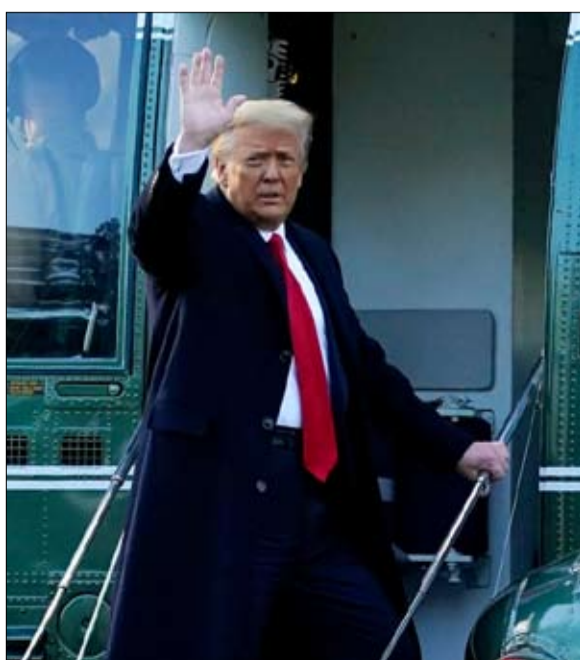
ترامب... الكذب كاذب حتى يصدقوك