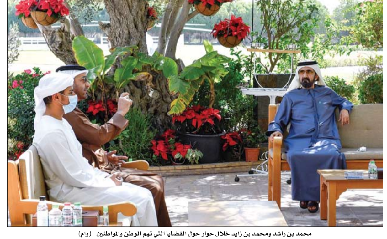
محمد بن راشد ومحمد بن زايد خلال حوار حول القضايا التي تهم الوطن والمواطنين (وام)

التقى صاحب السمو الشيخ محمد بن راشد آل مكتوم نائب رئيس الدولة رئيس مجلس الوزراء حاكم دبي «رعاه الله» وصاحب السمو الشيخ محمد بن زايد آل نهيان ولي عهد أبوظبي نائب القائد الأعلى للقوات المسلحة معاً، أمس، حيث ناقش سموهما جملة من القضايا الوطنية والاستراتيجية. كما أطلع سموهما على آخر استعدادات فريق مشروع الإمارات لاستكشاف المريخ تمهيداً لوصول مسبار الأمل إلى مدار الكوكب الأحمر خلال الأيام المقبلة، حيث قدمت معالي سارة بنت يوسف الأميري وزيرة دولة للتكنولوجيا المتقدمة رئيسة مجلس إدارة وكالة الإمارات للفضاء، شرحاً مفصلاً لرحلة مسبار الأمل إلى المريخ خلال مرحلته الأخيرة، إيذاناً بدخوله مدار الكوكب الأحمر في التاسع من فبراير 2021، لتكون الإمارات بهذا الإنجاز الدولة الخامسة التي تنتج في إطلاق مهمات مريخية، وثالث دولة تصل إلى مدار المريخ بنجاح من المحاولة الأولى، علماً بالإمارات والولايات المتحدة والصين تقود ثلاث بعثات استكشافية للكوكب الأحمر خلال شهر فبراير الجاري. ومع بدء العد التنازلي لوصول مسبار الأمل المريخ، دعا صاحب السمو الشيخ محمد بن راشد آل مكتوم وصاحب السمو الشيخ محمد بن زايد آل نهيان شعب الإمارات وشعب الوطن العربي إلى المشاركة في هذه اللحظة التاريخية، والاحتفال بها كأول إنجاز في تاريخ الأمة العربية، يسهم في وضع العالم العربي على خريطة التميز المعري ويسهم في تعزيز قطاع الصناعات الفضائية في المنطقة.