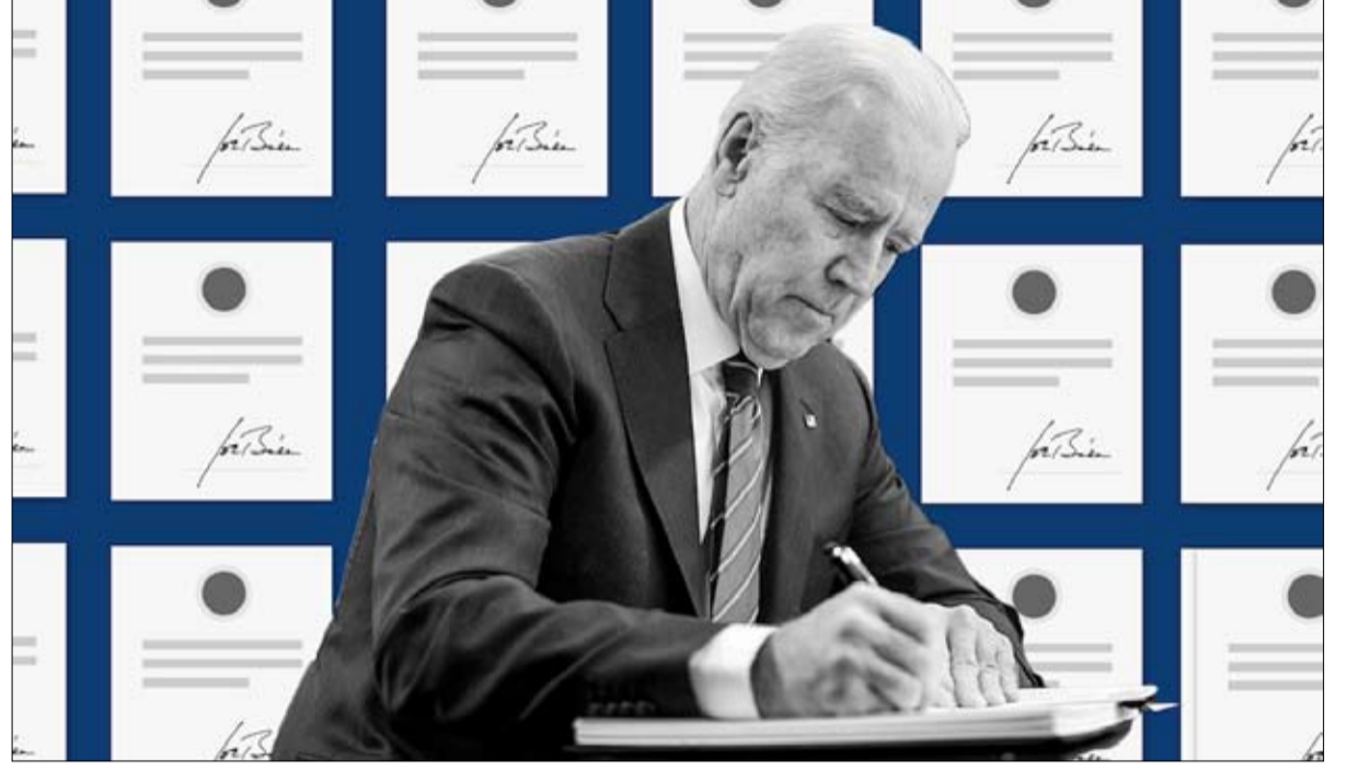
بايدن... الحقيقة أولا

مناقشاتنا حول الإنفاق والتعليم والعدالة الجنائية، إلا أنه بدون مثل هذا الإجماع، فإن الأزمة التي فيها الولايات المتحدة ستنتقل من سن إلى أسوأ.