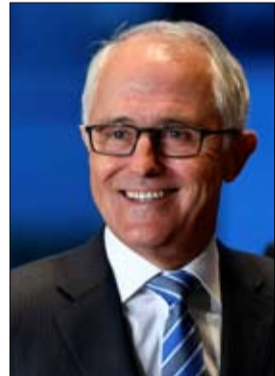
رئيس الوزراء الاسترالي

تريد عائلات يابانيين تشته بان كوريا الشمالية خطفت ابناءها، ان تقوم المحكمة الجنائية الدولية بالتحقيق في اختفائهم وبمعاقبة كيم جونج-اون، كما اعلنت جمعية للدفاع عن هذه الاسر الجمعة. وستقدم هذه العائلات عرضة الى المحكمة الاسبوع المقبل في وقت تركز الاسرة الدولية على بيونغ يانغ وبرنامجها النووي والباليستي. وكانت كوريا الشمالية اقرب في 2002 انها ارسلت عملاء لها لخطف 13 يابانيا في سبعينات وثمانينات القرن الماضي من اجل تدريب جواسيسها على اللغة والعادات اليابانية. وسمح لخمس من هؤلاء المخطوفين بالعودة الى اليابان لكن كوريا الشمالية تؤكد ان الثمانية الآخرين توفوا بدون ان تقدم اذلة على ذلك. من جهتها، تؤكد طوكيو مختف 17 من رعاياها لكن جمعية دعم العائلات تعتقد ان اختفاء عدد يصل الى 470 من اليابانيين يمكن ان يكون مرتبطا بكوريا الشمالية. وقال كازوهيرو اراكي