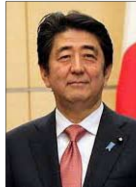
رئيس الوزراء الياباني

المسؤول في جميعه دعم العائلات لوكالة فرانس برس ان عائلات المفقودين وداعميها ستقدم عرضة "تطلب معاقبة (الزعيم الكوري الشمالي) كيم جونج-اون واجراء تحقيق" في فقدان مئة ياباني يعتقد انهم خطفوا. وذكرت وكالة الانباء اليابانية كيودو ان مسودة العرضة تشير الى ان عددا من المخطوفين يشكل "نسبة ليست ضئيلة" ما زالوا على قيد الحياة و "فرضت قيودا صارمة على تحركاتهم.. وتأتي هذه الخطوة في اجواء من التوتر الكبير المرتبط بكوريا الشمالية. ويحث رئيس الوزراء الاسترالي مالكولم ترنبول ونظيره الياباني شينزو ابي هذه المسألة في طوكيو الخميس ووعدا بالدفع باتجاه ابرام اتفاق اممي ثنائي جديد مهم. وقالت الحكومة انها تتعاون بشكل وثيق مع عائلات المفقودين وداعميهم بشأن عرضتهم. وكان تقرير للأمم المتحدة حول حقوق الانسان في كوريا الشمالية قدر بمئتي الف شخص عدد الذين خطفوا من دول اخرى من قبل بيونغ يانغ خلال عقود.