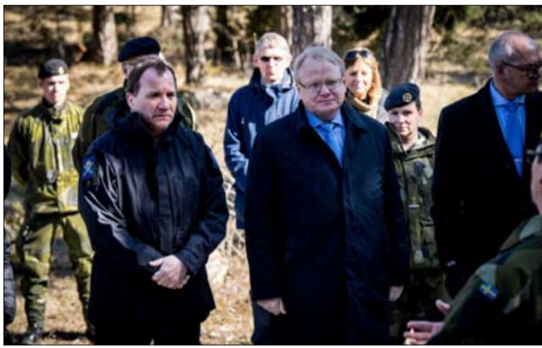
الوزير الاول ووزير الدفاع في السويد