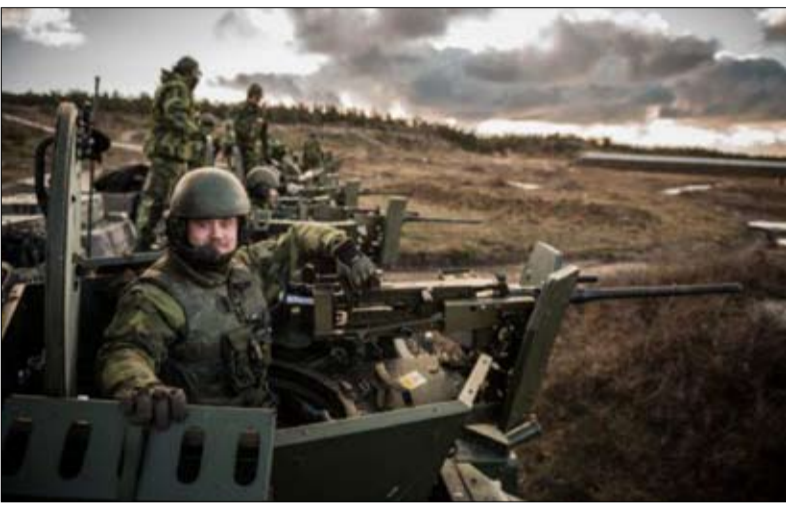
أكبر مناورات في السويد عام 2017