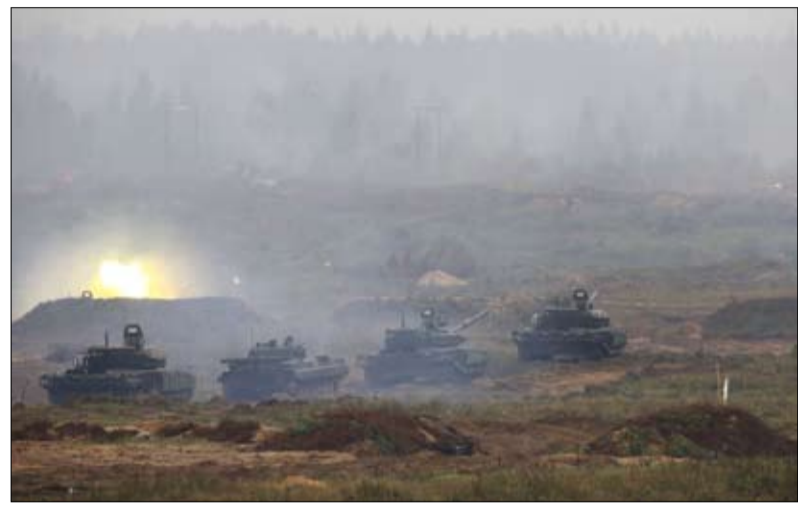
دبابات روسية ومن بيلاروسيا في مناورة مشتركة