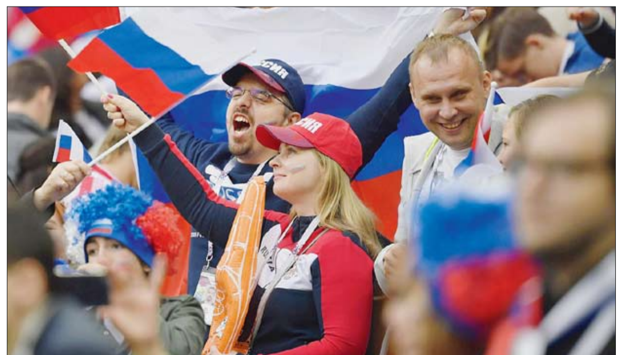
المنتخب الروسي مصدر فخر وكبرياء شعب