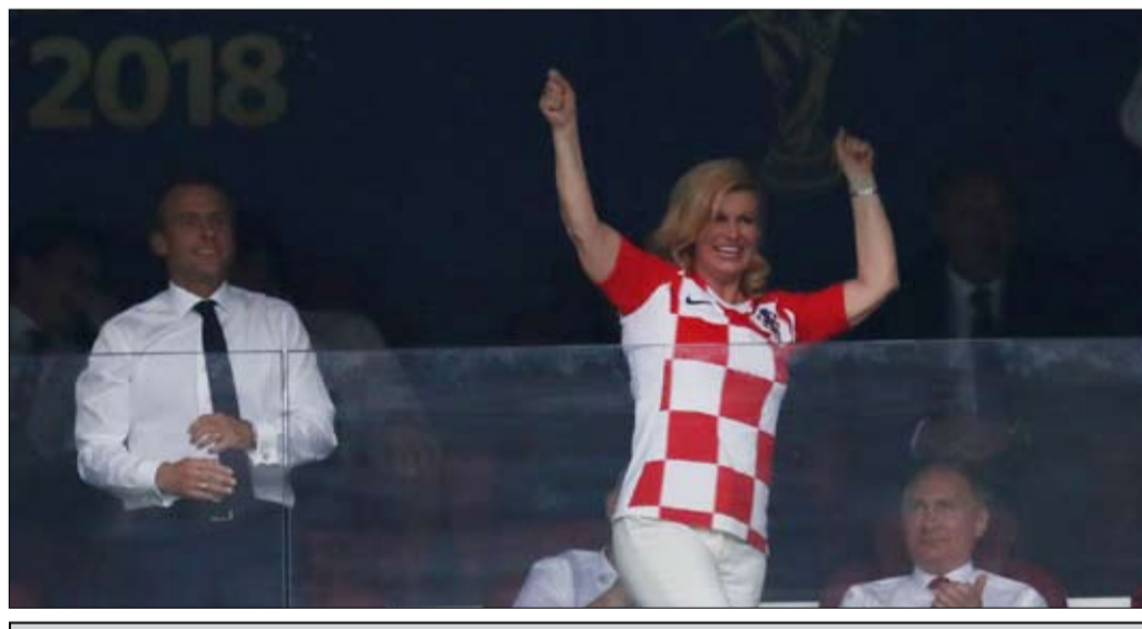
القيصر في حفل الاختتام

اقصاء اسبانيا، شحن المنتخب الروسي بالفخر بلدا لم يعد يهتز لكرة القدم منذ الحقبة السوفياتية. وألهمت مشاهد الاحتجاج مراكز المدن الكبرى مع كل انتصار. ولعبت القنوات التلفزيونية الوطنية، التي اعتمدت البث المباشر من سوتشي إلى فلاديفوستوك، دورها في ان تكون صدى لما يحدث، مادحة الكبرياء الروسي في منطقة تمتد على أكثر من 9 الاف كيلومتر. بالنسبة إلى "جيل بوتين"، هؤلاء الشباب الذين لم يعرفوا الا الرئيس الروسي فقط في السلطة، فإن هذه المشاعر الجماعية أكثر جمالا، وغير مسبوقه ايضا. "نحن نظهر للعالم أننا لسنا عدوانيين، وباردين، وانما منفتحون ونفيض مشاعر حارة وملتهبة"، يبتهم تسارا، وهو رجل في الثلاثين يعيش في موسكو. اما كبار السن فيرون في كأس العالم ذكريات مؤتمر الشباب الشيوعي، عام 1957، عندما التقى طلاب من جميع أنحاء العالم في موسكو بعد أربع