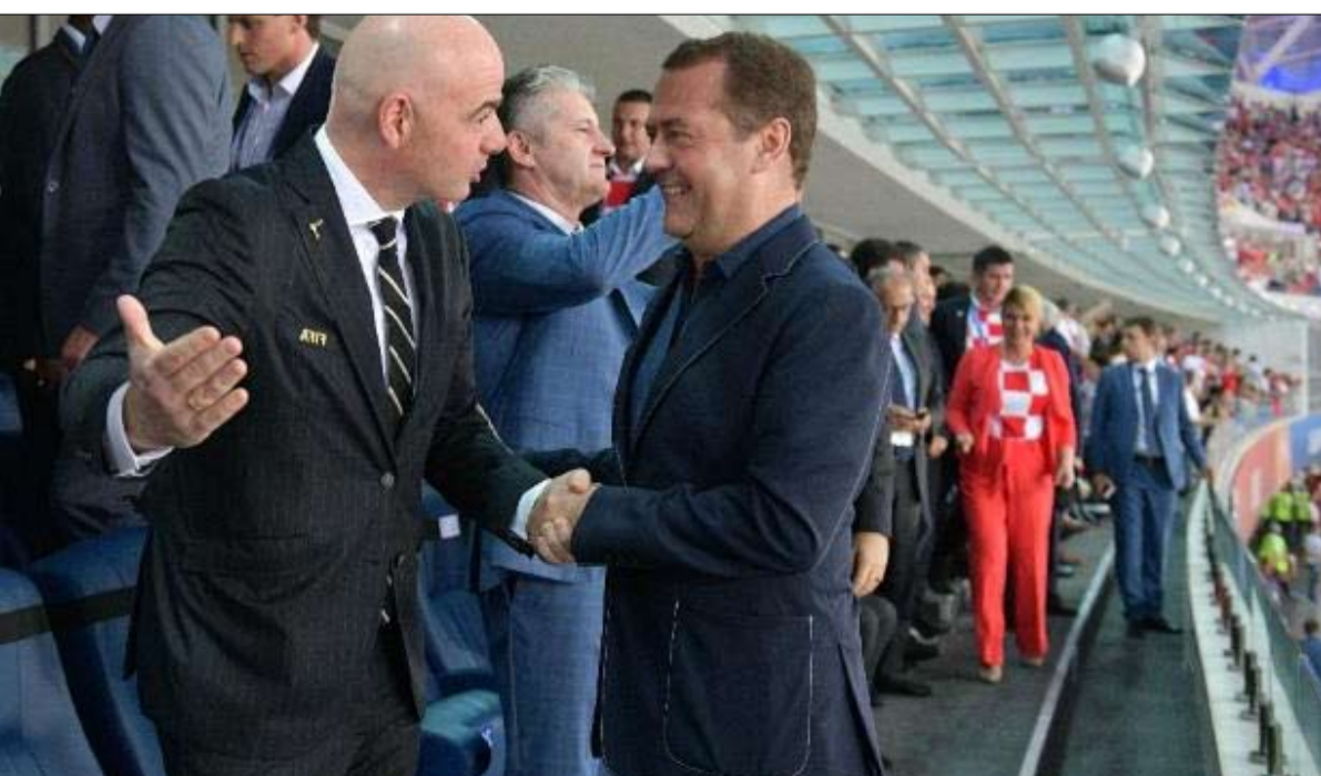
ميدهيديف كان اكثر حضورا من بوتين