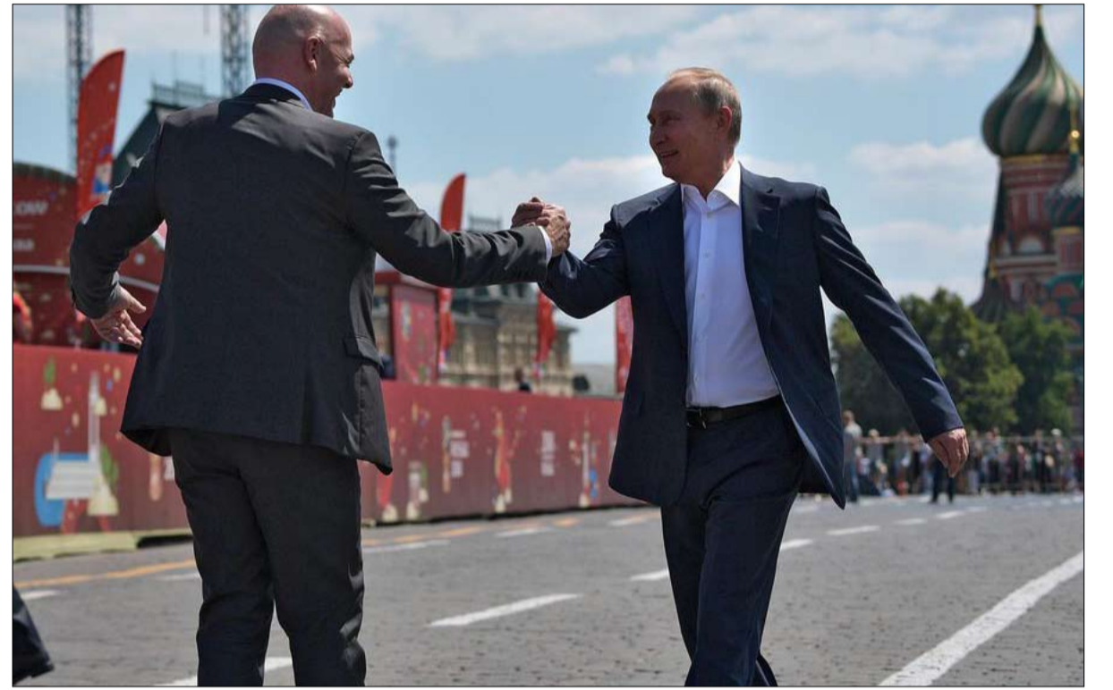
بوتين ورئيس الفيفا والدبلوماسية الناعمة