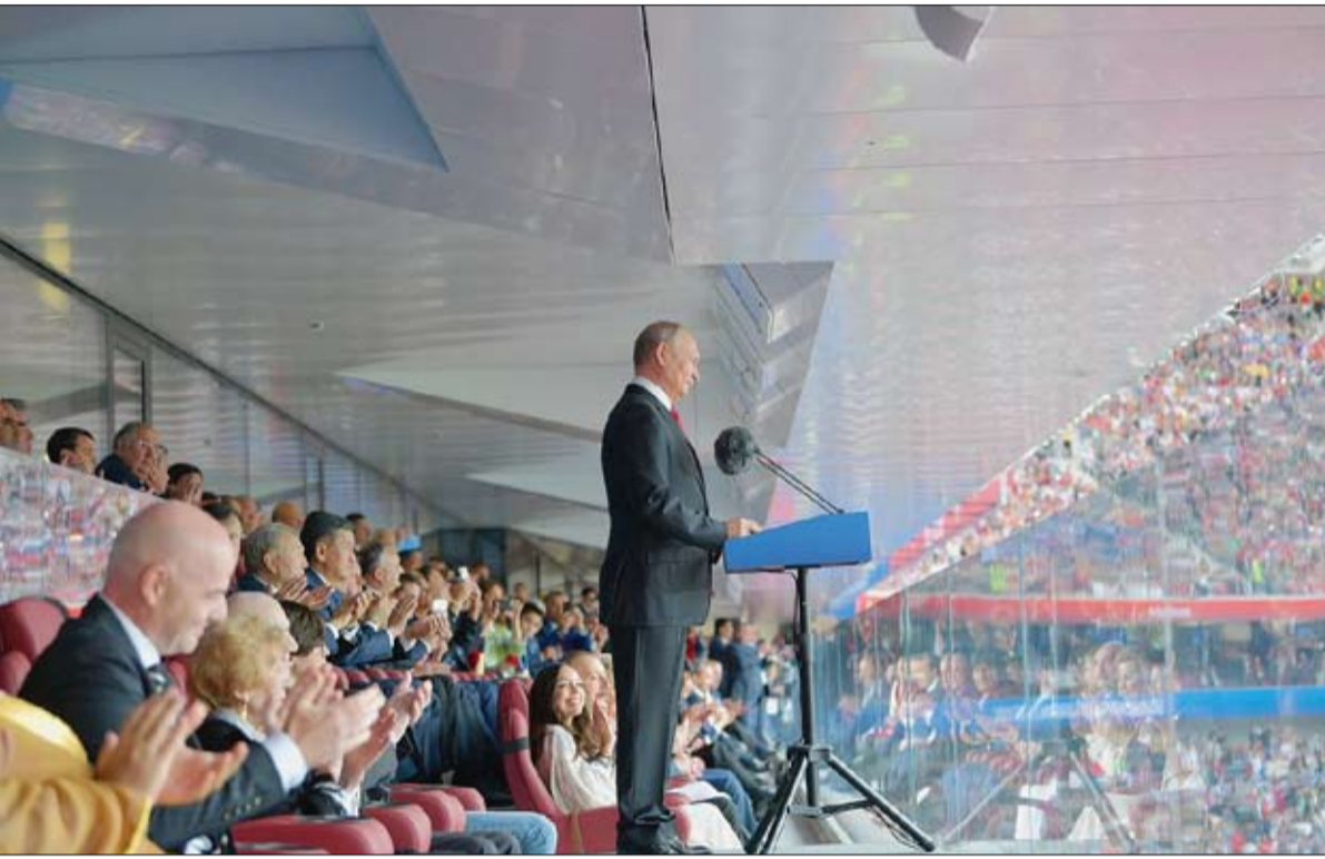
في الافتتاح معلنا انطلاق التظاهرة العالمية