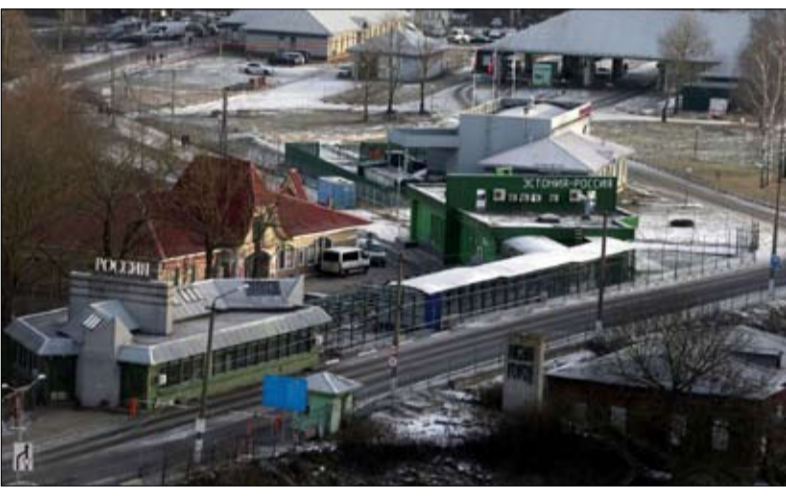
الحدود بين روسيا واستونيا