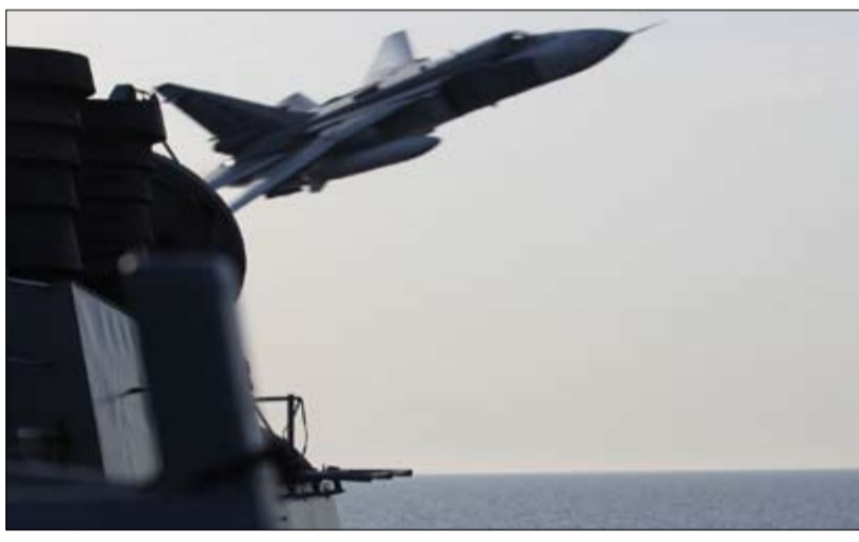
سوخوي روسية في بحر البلطيق