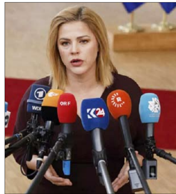
رئيسة الوزراء المستقيلة إيفيكا سيلينا

وقال أندريه سيببها، وزير الخارجية الأوكراني، إن بلاده