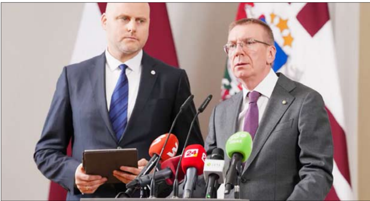
الرئيس اللاتفية كيلف النائب المعارض أندريس كولبيرغس يتكلم في مؤتمر صحفي

وأوضح أن الأسلحة المقدمة لأوكرانيا ليست من النوعية المتطورة التي تعتمد عليها الجيوش الغربية لنفسها، مستنفاً إلى تقارير تحدثت عن استخدام مخزونات قديمة وأقل تأثيراً في القتال.