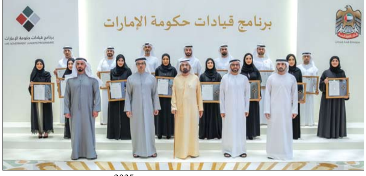
محمد بن راشد خلال حضوره تدفيع برنامج قيادات حكومة الإمارات 2025 بحضور منصور بن زايد

محمد بن راشد يأمر بالإفراج عن 836 نزيلا بمناسبة عيد الأضحى المبارك دبي-وام: أمر صاحب السمو الشيخ محمد بن راشد آل مكتوم، نائب رئيس الدولة رئيس مجلس الوزراء، رعاها الله، بصفته حاكما لإمارة دبي، أمس بالإفراج عن 836 من نزلاء المؤسسات الإصلاحية والعقابية في دبي، من مختلف الجنسيات، وذلك بمناسبة عيد الأضحى المبارك. وقال معالي المستشار عصام عيسى الحميدان، النائب العام لإمارة دبي أن أمر صاحب السمو الشيخ محمد بن راشد آل مكتوم يأتي في إطار حرص سموه على منح المشمولين بالعفو فرصة التغيير نحو الأفضل، إعلاء لقيمة التسامح، وبما يضمن لهم حياة اجتماعية ومهنية مستقرة، ولإدخال البهجة والسرور على نفوس أهلهم وذويهم في مثل هذه المناسبات المباركة. (التفاصيل ص2) حمدان بن محمد يعتمد 1.5 مليار درهم إضافية من التسهيلات الاقتصادية في دبي دبي-وام: اعتمد سمو الشيخ حمدان بن محمد بن راشد آل مكتوم، ولي عهد دبي نائب رئيس مجلس الوزراء وزير الدفاع رئيس المجلس التنفيذي لإمارة دبي، المجموعة الثانية من التسهيلات الاقتصادية في إمارة دبي بقيمة 1.5 مليار درهم، تشمل قطاعات اقتصادية واجتماعية حيوية، تعزز مرونة واستدامة النمو في دبي. وقال سموه: دبي، برؤية صاحب السمو الشيخ محمد بن راشد آل مكتوم، نائب رئيس الدولة رئيس مجلس الوزراء حاكم دبي، رعاها الله، رسخت على مدى عقود قيم الاستعداد للمستقبل والتنوع الاقتصادي، وأرست نموذجا متميزا للتكيف مع التغيرات. (التفاصيل ص2)