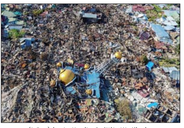
دمار هائل خلفه زلزال وتسونامي إندونيسيا

•• بيروت-رويترز: قال وزير الخارجية اللبناني جبران باسيل أمس إن إسرائيل تسعى لتبرير عدوان آخر بمزاعم زائفة عن مواقع صاروخية لجماعة ميليشيا حزب الله اللبنانية المدعومة من إيران. وعقدت الوزارة اجتماعا مع سفراء أجنبية للرد على اتهامات رئيس الوزراء الإسرائيلي بنيامين نتانياهو، وستنظم لهم جولة في موقع واحد على الأقل من المواقع في بيروت. ووفقا للإعلام اللبناني، شدد باسيل بعد لقاءه السفير المعتمدين في لبنان، على أن إسرائيل لا تحترم القرار الدولي 1701، مشيرا إلى أن رئيس الوزراء الإسرائيلي بنيامين نتانياهو يستخدم منبر الأمم المتحدة لتبرير حرق إسرائيل لقرارات الدولية.