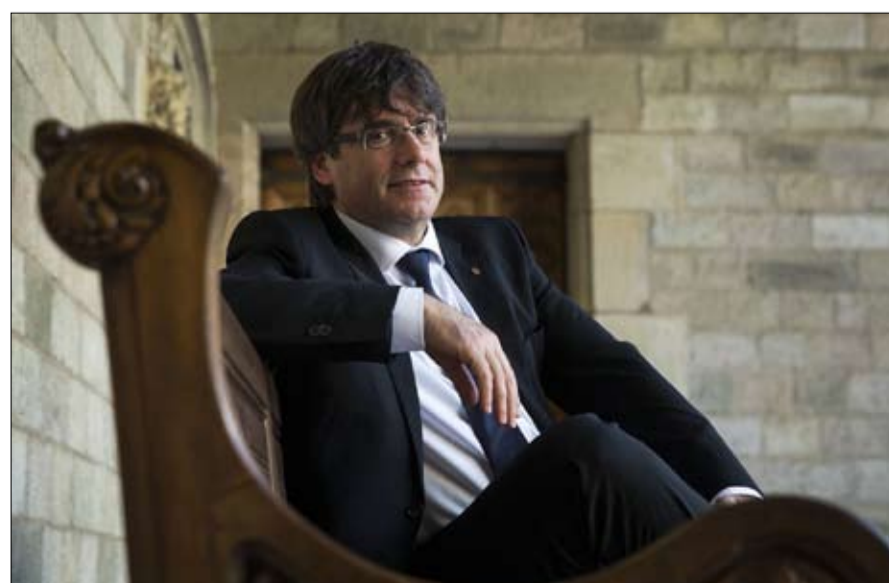
اختار كارليس بويغديمون المنفى