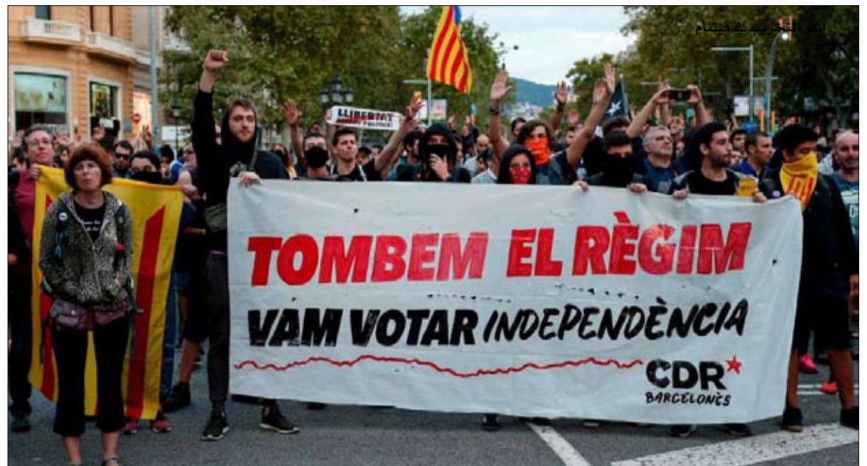
الانفصاليون نفس الارادة والحماص

ليدونز على بعد 70 كيلومتراً شمال برشلونة، وقد صرح لمراسل صحيفة لا فانغورديا، الذي جاء لمحاورته في سبتمبر، إنه قضى ساعات طويلة في ممارسة الرياضة، وتعليم زملائه السجناء.