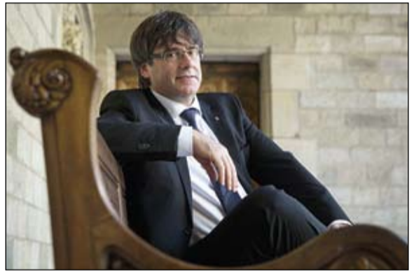
اختار كارليس بويغديومون التضييق

اللحظة التاريخية، حيث اغرقت مؤسسية عرفتها البلاد منذ كل إسبانيا في أسوأ أزمة سياسية نهاية عهد فرانكو والفرنكية.