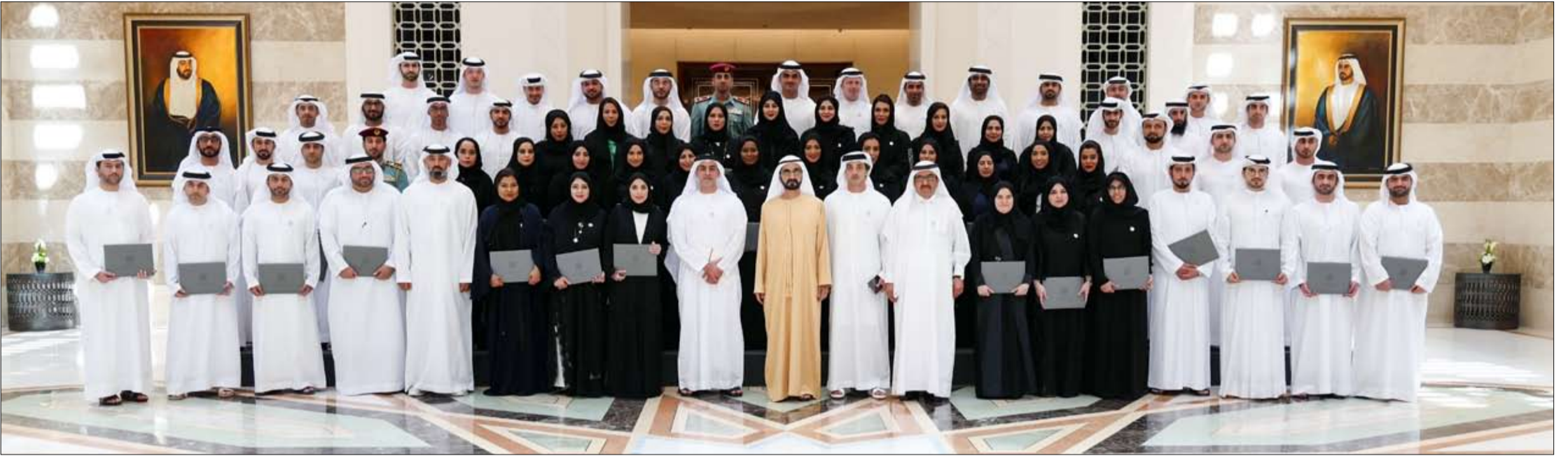
مجلس الوزراء يعتمد نموذج الإمارات للقيادة الحكومية