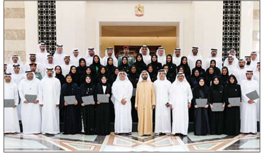
محمد بن راشد خلال تكريمه خريجي دفتين للقيادات التنفيذية في برنامج قيادات حكومة الإمارات (وام)

محمد بن زايد يؤكد على رسالة الإمارات لنشر ثقافة السلم والتسامح والحوار بين مختلف الشعوب والأديان والثقافات •• أبو ظبي-وام: استقبل صاحب السمو الشيخ محمد بن زايد آل نهيان ولي عهد أبوظبي نائب القائد الأعلى للقوات المسلحة أمس - في مجلس قصر البحر - أعضاء الأمانة العامة للمجلس العالمي للمجتمعات المسلمة الذي يعقد اجتماعه الأول في أبوظبي لإقرار خطة