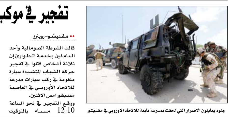
جنود يعاينون الأضرار التي لحقت بمدرعة تابعة للاتحاد الأوروبي في مقديشو

•• مقديشو-رويترز: قالت الشرطة الصومالية وأحد العاملين بخدمة الطوارئ إن ثلاثة أشخاص قتلوا في تفجير حركة الشباب المتشددة سيارة ملغومة في ركب سيارات مدرعة للاتحاد الأوروبي في العاصمة مقديشو أمس الاثنين. ووقع التفجير في نحو الساعة 12:10 مساء بالتوقيت المحلي في الشارع الصناعي وهو شارع رئيسي بقلب العاصمة الصومالية. وقالت الشرطة إن المهاجم قتل كذلك في التفجير. ورأى شاهد من رويترز رجالا يجرون سياراتهم التي لحقت بها أضرار في التفجير. وكانت السيارات المصفحة ترفع علمي إيطاليا والاتحاد الأوروبي. وأعلنت حركة الشباب التي