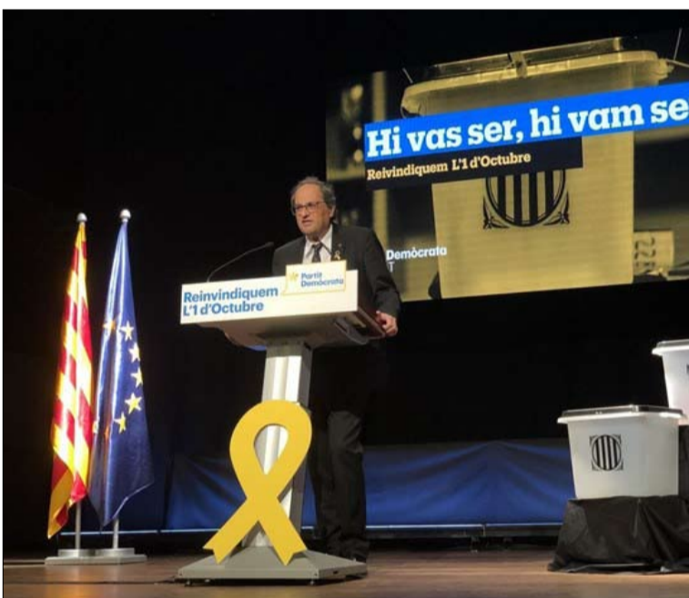
كيم تورا.. الحركة مستمرة

أي عمل انفرادي جديد سيغير مدريد على استعادة السيطرة على المنطقة