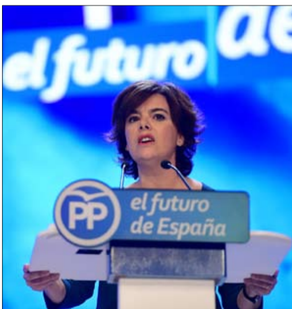
ثريا ساينز تترك السياسة

الحياة وراء القضبان لأوريول بعد أشهر طويلة قضاها في احوال مدريد، تمكن نائب رئيس الحكومة الكاتالونية السابق، من العودة إلى موطنه الأصلي في بداية شهر يوليو. وفي انتظار محاكمته بتهمة التحريض على الفتنة والتمرد والاختلاس، يظل أوريول جونكويريس قيد الاعتقال الاحتياطي للمحاكمة في