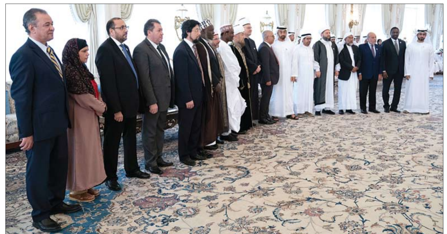
استقبل أعضاء الأمانة العامة للمجلس العالمي للمجتمعات المسلمة