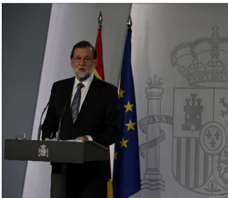
راخوي.. التقاعد القسري

أي عمل انفرادي جديد سيغير مدريد على استعادة السيطرة على المنطقة