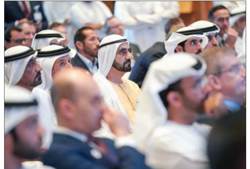
حضر الجلسة الحوارية لـ «مجلس دبي» في دار الأوبرا