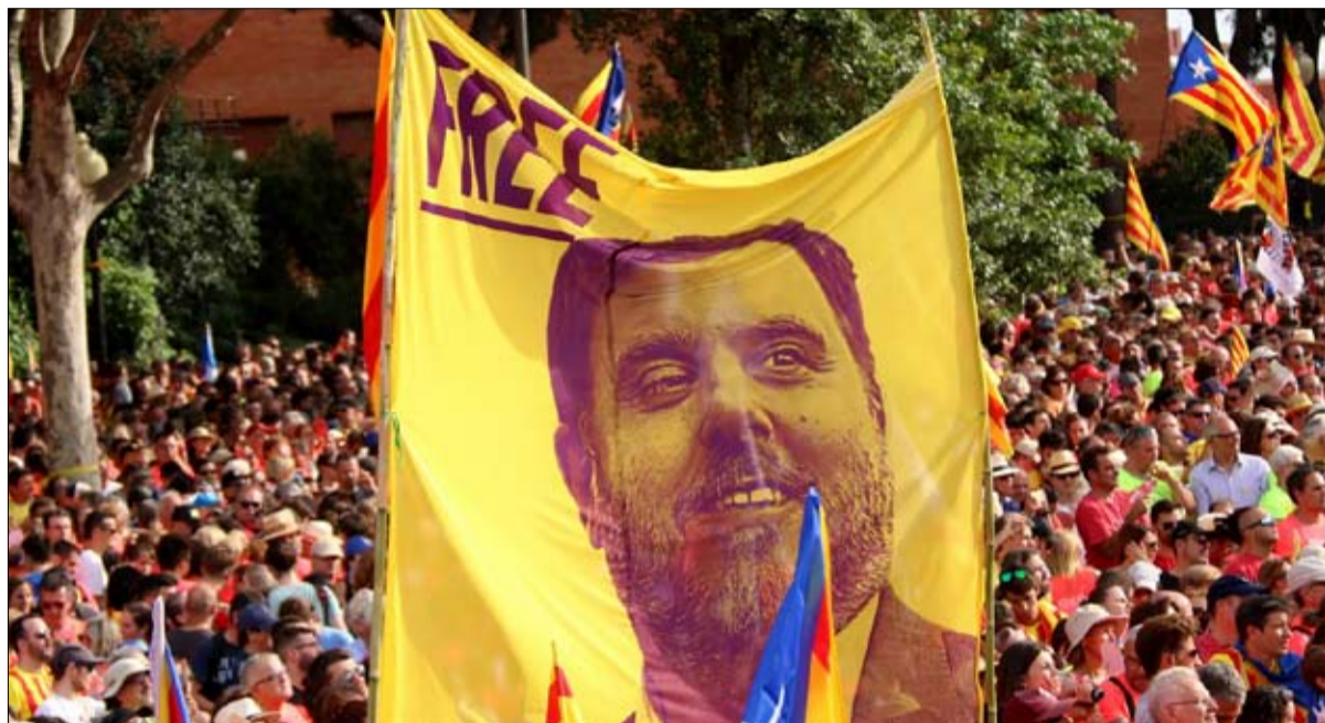
أوريول جونكويريس السجن الأكثر شعبية