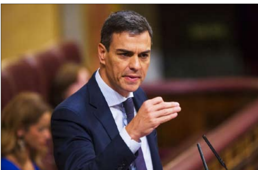
بيدرو سانشيز.. استعداد للحوار

لا سبيل، حسم بيدرو سانشيز، الذي يعتبر أيضاً، أن القيادة الكاتالونيين الذين نظمو تلك الاستشارة، التي قمتها الشرطة الاسبانية، لا ينبغي أن يبقوا