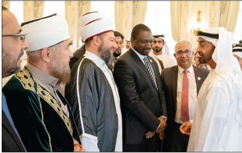
محمد بن زايد خلال استقباله أعضاء الأمانة العامة للمجلس العالمي للمجتمعات المسلمة (وام)

حضر الجلسة الحوارية لـ «مجلس دبي» في دار الأوبرا محمد بن راشد يوجه بضرورة تنفيذ توصيات المجلس بعيدا عن الروتين والبيروقراطية •• أبو ظبي-وام: حضر صاحب السمو الشيخ محمد بن راشد آل مكتوم نائب رئيس الدولة رئيس مجلس الوزراء حاكم دبي «رعاه الله» الجلسة الحوارية لـ «مجلس دبي» في دورته الثانية التي عقدت في دار الأوبرا في دبي قبل ظهر أمس بحضور سمو الشيخ حمدان بن محمد بن راشد آل مكتوم ولي عهد دبي وسمو الشيخ مكتوم بن محمد بن راشد آل مكتوم نائب حاكم دبي. وقد تركز الحوار - الذي شارك فيه صاحب السمو الشيخ محمد بن راشد آل مكتوم بحضور عدد من الوزراء ووزراء ومديري الدوائر الحكومية في دبي ونخبة من رؤساء وممثلي شركات الاستثمار العالمية العاملة في الدولة ورجال مجتمع الأعمال في دبي - حول التوصيات التي خرج بها الاجتماع الأول للمجلس الذي عقد في شهر إبريل الماضي وما تم تنفيذه. (التفاصيل ص2) «الهلال الأحمر» يفتتح ثانوية الصديق بزنجبار بعد إعادة تأهيلها بتمويل إماراتي •• أبين-وام: افتتح المهندس سعيد آل علي رئيس بعثة الهلال الأحمر الإماراتي في عدن و اللواء أبو بكر حسين محافظ أبين .. ثانوية الصديق بزنجبار بعد إعادة تأهيلها بتمويل من دولة الإمارات العربية المتحدة. وأشاد محافظ أبين في تصريحات له خلال الافتتاح بجهود فريق هيئة الهلال الأحمر الإماراتي لإنجاز وتأهيل المدرسة لتكون جاهزة لإستقبال أبناء المحافظة بعد فترة من الانقطاع. (التفاصيل ص9)