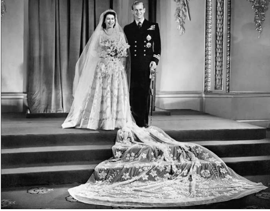
خفف زواج الأميرة إيزابيث من فيليب مونتباتن كآبة ما بعد الحرب

× أستاذة محاضرة في الإعلام، جامعة لانكستر