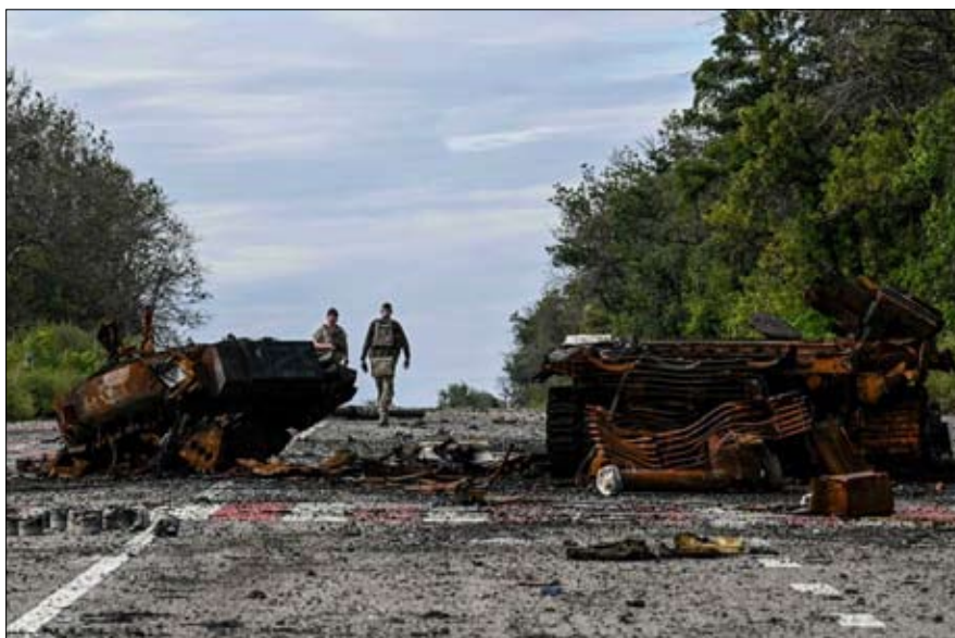
عربات مدرعة مدمرة في منطقة كرخيف يوم السبت