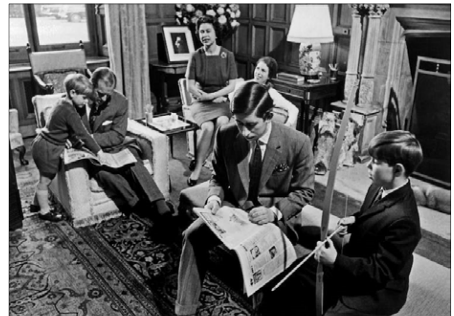
في هذه الصورة التي التقطت مايو 1969 في ساندرينجهام، نرى جميع أفراد العائلة المالكة البريطانية

مكنت وسائل التواصل الاجتماعي النظام الملكي من الوصول إلى جيل الشباب