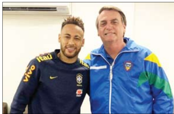
اللاعب نيمار طرف في معركة المؤثرين

واكتفى بالقول إن الحريق اندلع الساعة 6:20 من صباح أمس الثلاثاء، بسبب تلاعب مجهولين بإحدى آبار في حقل «شادغان» للنفط، وتم احتواؤه على الفور. وواصل يقول إن الحقل في حالة أمان كاملة، والبنر المتضررة تحت إدارة موظفي شركة مارون للنفط والغاز، وقد بدأت عمليات تصليحه.