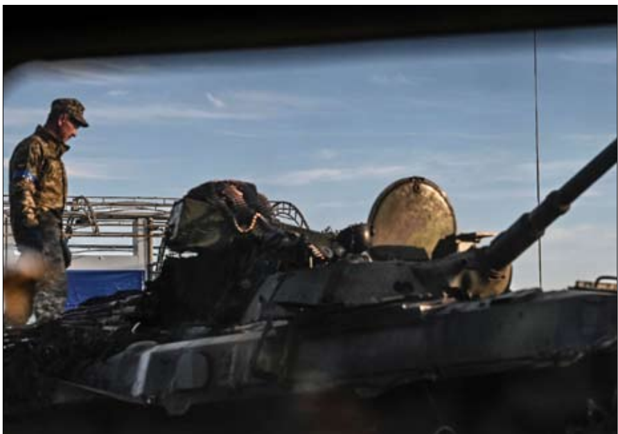
الجيش الاوكراني فاجأ الروس

تتأججه، ولذلك فهي تثير بشكل حاد مسألة الغرض الاستراتيجي الذي تسعى إليه أوكرانيا.