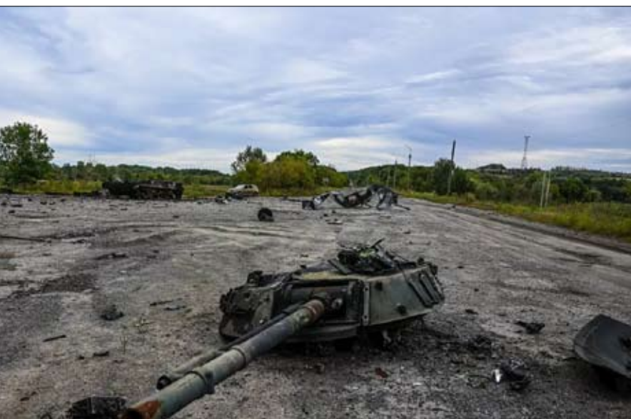
قند الجنود الروس الكثير من المعدات أثناء انسحابهم