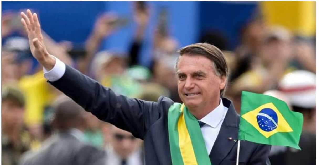
بولسونارو يراهن على محطات التواصل الاجتماعي