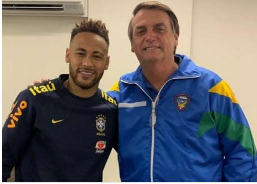
اللاعب نيمار طرف في معركة المؤثرين

العام وتحولت مكاناً متزايداً في سياسات الاتصال". متخصص في ديناميكيات هذه الوسائط الجديدة، يؤكد أن جاير بولسونارو قد خسر مساحة في ساحته المفضلة. "بالإضافة إلى المرشحين