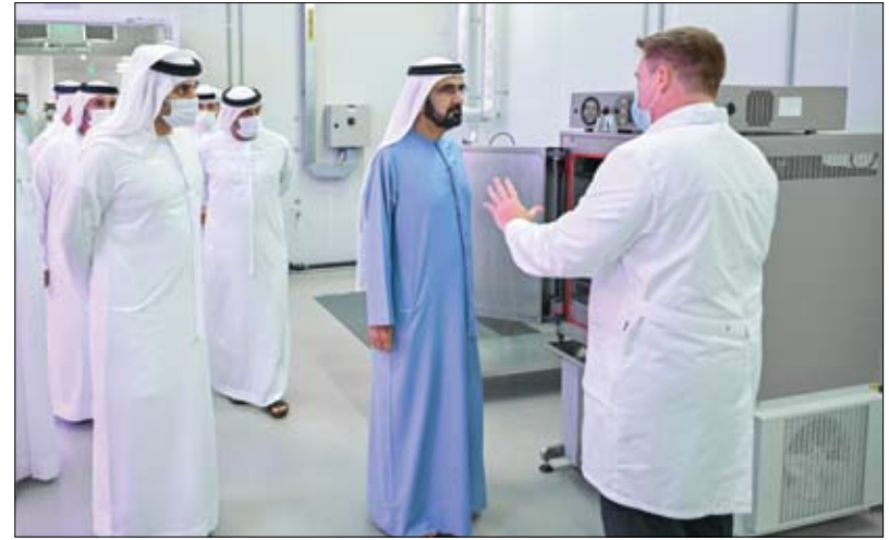
خلال زيارته لـ «بستانك» أكبر المجمعات الزراعية الذكية في العالم