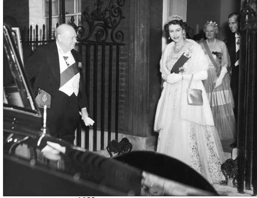
إيزابيث الثانية ووستون تشرشل عام 1955