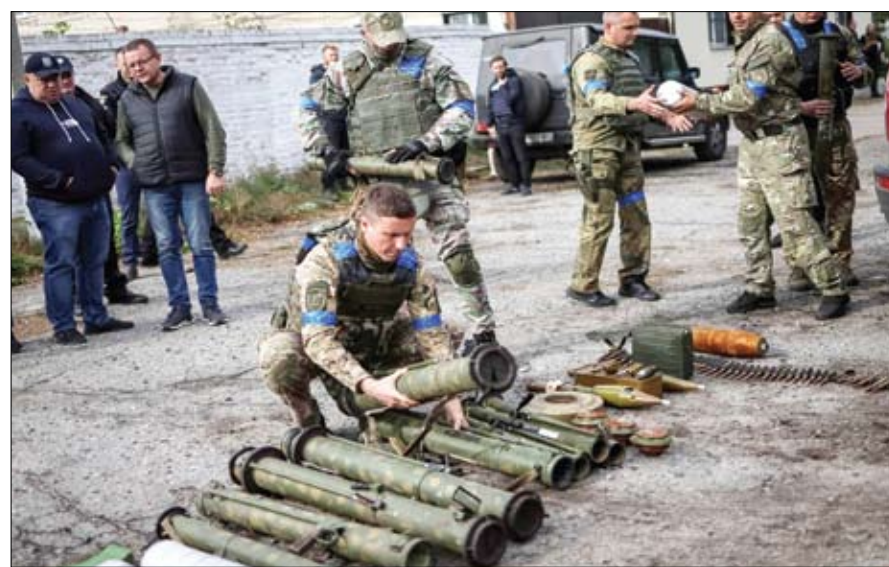
خبراء متفجرات يفرزون قذائف وألغام وأسلة في قرية حررتها القوات الأوكرانية في خاركيف.

على القوات الأوكرانية في كل الجبهات الثلاث. وقالت وزارة الدفاع الروسية في تقريرها اليومي إن القوات الجوية والبالستية والمدفعية الروسية تنفذ ضربات مكثفة على وحدات القوات المسلحة الأوكرانية في كل مناطق العمليات، وفق «فرانس برس». وأشارت إلى عمليات قصف بالقرب من سوليفانسك وكوستانتينيفكا وبياخومت في شرق أوكرانيا، وفي منطقتي ميكولايف وزابوريجيا في الجنوب وكذلك في خاركيف في الشمال الشرقي حيث قادت أوكرانيا هجوما مضادا عنيفا فأجبرت القوات الروسية على الانسحاب من معظم أنحاء المنطقة. وأعلنت أوكرانيا الاثنين أنها استعدت حوالي 6000 كيلومتر مربع من الأراضي في عدة جبهات بهجوم مضاد شن في مطلع سبتمبر، ومع ذلك، قال نائب وزير الدفاع الأوكراني: «من المبرر القول بأن أوكرانيا استعدت كامل السيطرة على خاركيف».