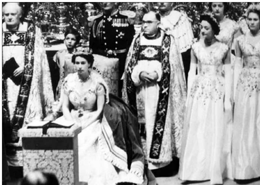
كان تتويجها هو الأول الذي عُرض على الهواء مباشرة على التلفزيون البريطاني

مكنت وسائل التواصل الاجتماعي النظام الملكي من الوصول إلى جيل الشباب