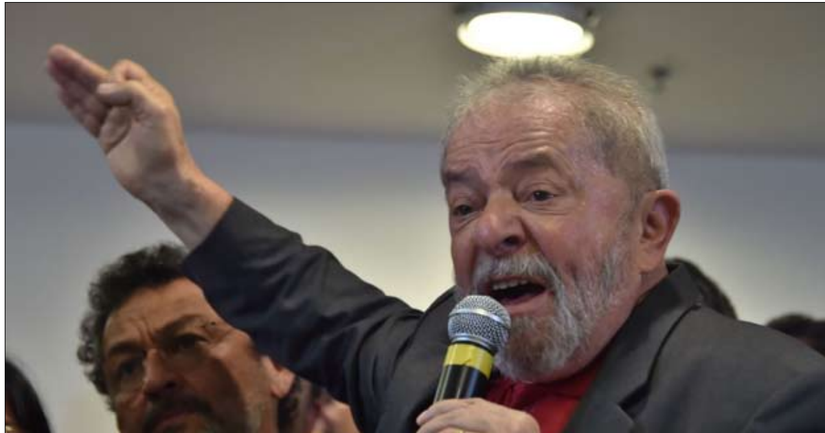
لولا بفضل الخطابة على الاتصال الحديث

أنفسهم، فإن الحركة الدائرة هناك تشمل أيضاً نظمهم البيئية، يثري ماليني، ولا تزال معركة رئيس الدولة تضم بعض الشخصيات العامة يتابعها ملايين من مستخدمي الإنترنت، مثل أبنائه "منحرفون في السياسة، ملاحظة