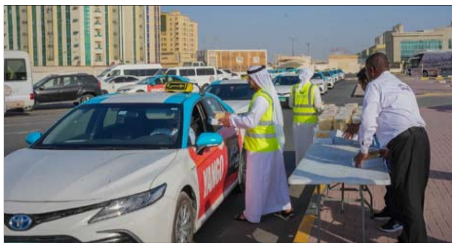
إلى استمرار التعاون بين جمعية الشارقة الخيرية وأجرة الشارقة، ونطلع إلى المزيد من الشركات التي تمكننا من توسيع نطاق العمل الخيري وإيصال الدعم إلى أكبر عدد من المستفيدين. ومن الجدير بالذكر أن أجرة الشارقة، إحدى الشركات التابعة لشركة الشارقة لإدارة الأصول، الذراع الاستثمارية لحكومة الشارقة.