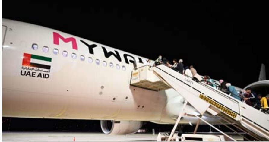
المبادرات استمرراً للجهود الإماراتية القطاع بوتيرة متسارعة ومنسقة والعمل على الحد من تداعياتها السلبية. نتيجة للأزمة الإنسانية المتفاقمة،