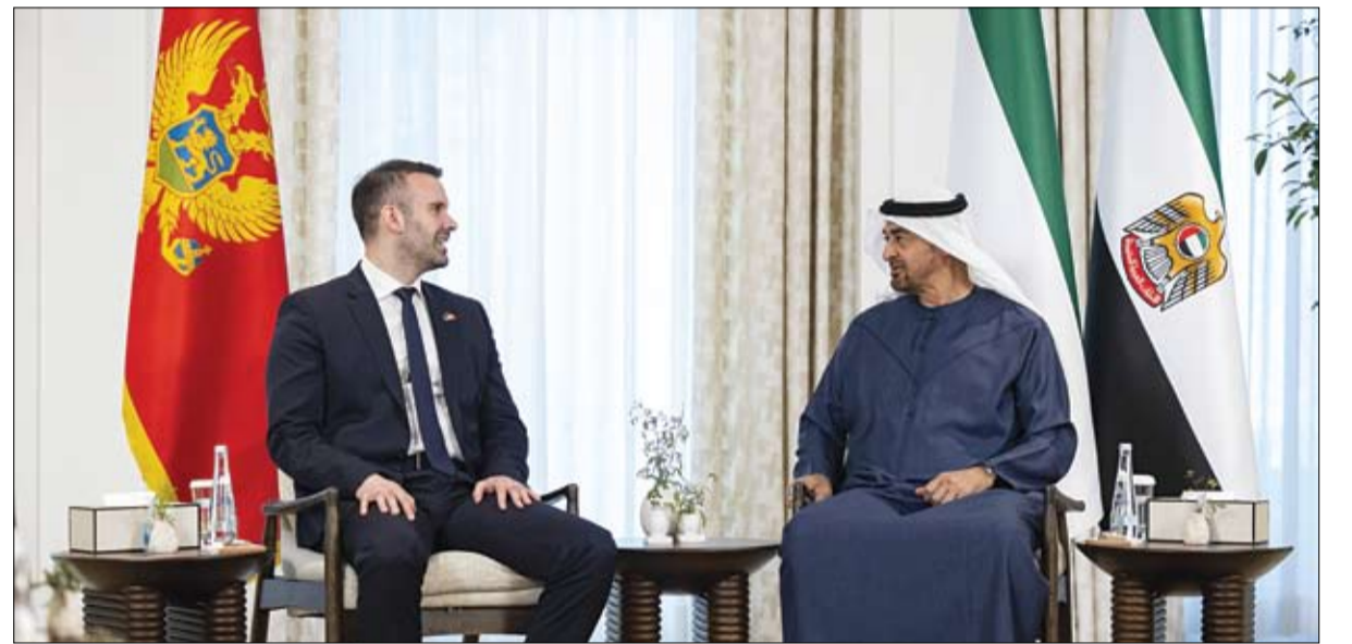
رئيس الدولة خلال مباحثاته مع رئيس وزراء جمهورية مونتينيغرو (وام)

تعقد لجنة تحري هلال شوال لسنة 1446 هـ بمجلس الإمارات للإفتاء الشرعي، وانطلاقاً مما أنيط به من مهام ومسؤوليات وطنية، اجتماعها في موقع الحصن التاريخي بالعاصمة أبوظبي مساء اليوم السبت، 29 رمضان 1446 هـ، الموافق: 29 مارس 2025م، برئاسة معالي العلامة عبدالله بن الشيخ المحفوظ بن بيه، رئيس مجلس الإمارات للإفتاء الشرعي وحضور معالي الدكتور عمر حبتور الدرعي نائب رئيس المجلس، وأعضاء من الخبراء المختصين في الجوانب الشرعية والإفتائية والقانونية والفلكية. وستشرف اللجنة خلال اجتماعها على تدارس المعطيات العلمية والتقارير الدقيقة التي توافيها بها الجهات والؤسسات المشاركة ذات الاختصاص بشأن الحسابات الفلكية للحظة ولادة الهلال، وحسب الإقتران، ومدى إمكانية تحقق الرؤية.