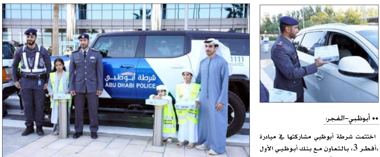
وأشادت شرطة أبوظبي بالتعاون المشترك مع بنك أبوظبي الأول ومؤسسة زايد للأعمال الخيرية في إنجاز المبادرة الإنسانية والتي جسدت أهداف عام المجتمع وأسهمت في تحقيق رؤية الحكومة نحو تعزيز الروابط الأسرية والعمل الخيري والإنساني لخدمة الوطن العطاء. وأسهمت المبادرة في تعزيز التواصل المجتمعي والمشاركة في فعل الخير وغرس روح التطوع والتعاون في النفوس وخصوصاً في أيام شهر رمضان المبارك.