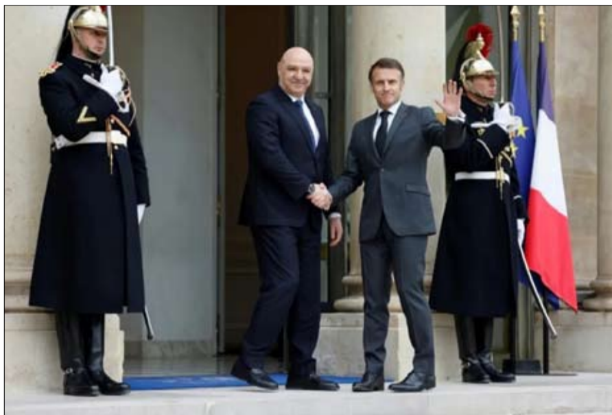
البيئي الإقليمي على الأمن" بحسب الإليزيه. ورات "صداقة فرنسا ودعمها الثابت للبنان". وأنهى انتخاب أوساط ماكرون في زيارة عون دليلاً على تقدير عون وتشكيل حكومة برئاسة الإصلاح نواف

استقبل الرئيس الفرنسي إيمانويل ماكرون نظيره اللبناني جوزاف عون في زيارته الرسمية الأولى إلى دولة غربية منذ انتخابه في كانون الثاني-يناير بمساهمة من فرنسا على أمل إطلاق عملية إصلاحات لإخراج لبنان من أزمة الراهنة. ووصل عون قبل قليل إلى قصر الإليزيه للقاء ماكرون. ويريد الرئيس الفرنسي إضافة بعد إقليمي قوي على هذه الزيارة، إذ بالإضافة إلى اللقاءات الثنائية لعون مع ماكرون الذي زار بيروت لتهنئته في 17 كانون الثاني-يناير، يعقد الرئيس أيضاً اجتماعاً عبر الفيديو مع الرئيس السوري الانتقالي أحمد الشرع. وأوضحت الرئاسة الفرنسية لصحفيين أن الرؤساء الثلاثة سيبحثون في "قضية الأمن على الحدود السورية اللبنانية" حيث أدت "توترات إلى وقوع مواجهات" قبل أسابيع، كذلك يشمل البرنامج اجتماعاً خماسياً "مخصصاً لشرق المتوسط" يضم إلى الرؤساء الثلاثة نظيرتهم القبرصية واليونانية، لمناقشة "التحديات" المرتبطة بـ "الأمن البحري" و"التأثير