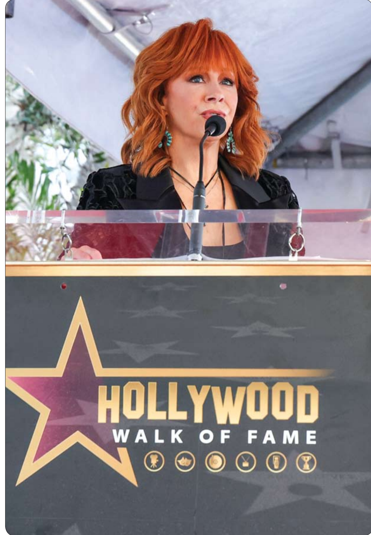
الغنية والممثلة الأمريكية ريبا ماكناير تتحدث خلال حفل تكريم مغنية الريف الأمريكية تريشا بيروود بنجمة مشي المشاهير في هوليوود.

ويستخدم التحفيز المغناطيسي المتكرر عبر الجمجمة لمفأ لتوليد نبضات مغناطيسية تحفز مناطق دماغية محددة.