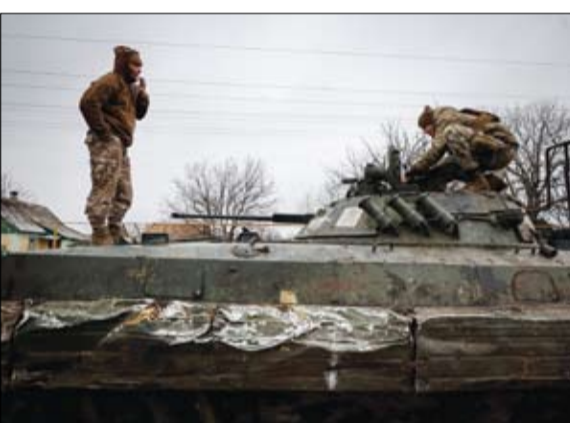
جنديان أوكرانيان على مدرعة على خط المواجهة في منطقة دونيتسك.

وزير الدفاع الأوكراني أوليكسي ريزنيكوف، من أن روسيا تخطط لشن هجوم كبير يتزامن مع الذكرى السنوية الأولى للحرب في أوكرانيا في 24 فبراير. وفي حديثه لوسائل الإعلام الفرنسية، حذر ريزنيكوف من أن روسيا ستستدعي وحدة كبيرة من القوات المحشودة، بحسب ما نقلت الغارديان البريطانية.