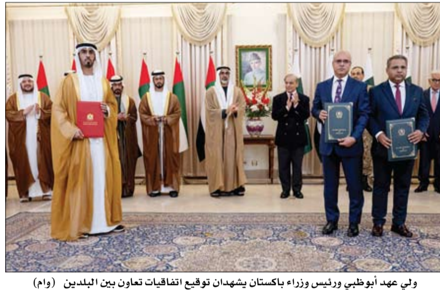
ولي عهد أبوظبي ورئيس وزراء باكستان يسهدان توقيع اتفاقيات تعاون بين البلدين (وام)

عقد سمو الشيخ خالد بن محمد بن زايد آل نهيان، ولي عهد أبوظبي، أمس، جلسة مباحثات رسمية مع دولة محمد شهباز شريف، رئيس وزراء جمهورية باكستان الإسلامية، في مقر رئاسة الوزراء في العاصمة إسلام آباد. وجرى لسمو الشيخ خالد بن محمد بن زايد آل نهيان، لدى وصوله مقر رئاسة الوزراء، مراسم استقبال رسمية، حيث اصطحب دولة محمد شهباز شريف، سمو الشيخ خالد بن محمد بن زايد آل نهيان، إلى منصة الشرف، وعزف خلال المراسم السلطان الوطني لدولة الإمارات وجمهورية باكستان الإسلامية. (التفاصيل ص3)