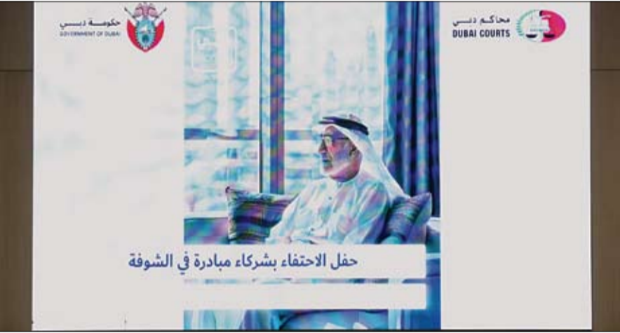
حفل الاحتفاء بشركاء مبادرة في الشوفة

حرص محاكم دبي على ترسيخ قيم العدالة والإنصاف في المجتمع، ويتبرج رؤية دبي في تعزيز الشفافية النظام القضائي، كما يُعتبر هذا التكريم تجسيدا لرؤية محاكم دبي المساواة من خلال تحسين بيئة