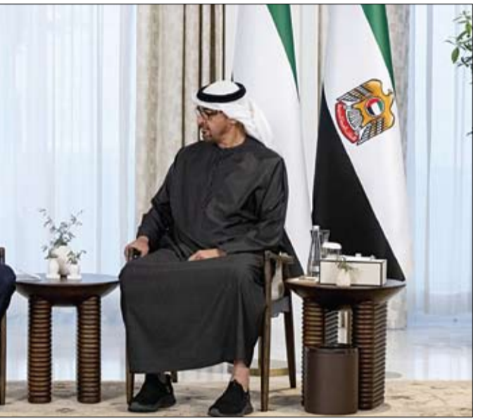
رئيس الدولة خلال مباحثاته مع رئيس وزراء اليونان

20 صفحة - الثمن درهمان أسسها عام 1975 عبيد حميد المزروعى www.alfajrnews.ae