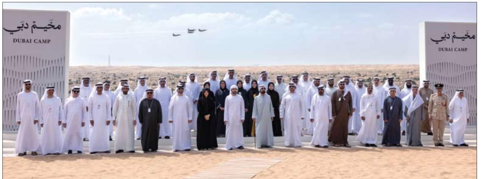
خلال حضوره مخيم دبي