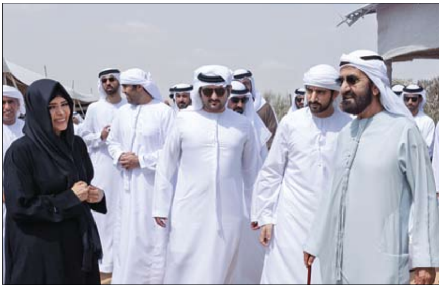
محمد بن راشد خلال حضوره فعاليات مخيم دبي

وذلك في إطار الشراكة الاستراتيجية الشاملة بين البلدين. ورحب صاحب السمو الشيخ محمد بن زايد آل نهيان - خلال اللقاء الذي جرى في قصر الشاطئ في أبوظبي - بمعالي رئيس وزراء اليونان والوفد المرافق، متطلعاً إلى أن تسهم زيارته إلى الدولة في تعزيز العمل المشترك لتحقيق أهداف الشراكة الاستراتيجية لصالح البلدين وشعبيهما. (التفاصيل ص2)