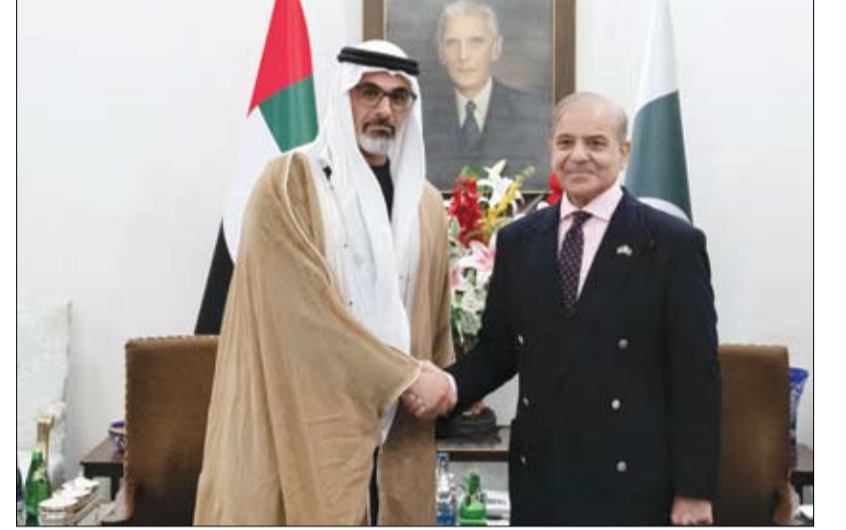
شهدا توقيع اتفاقيات تعاون بين البلدين