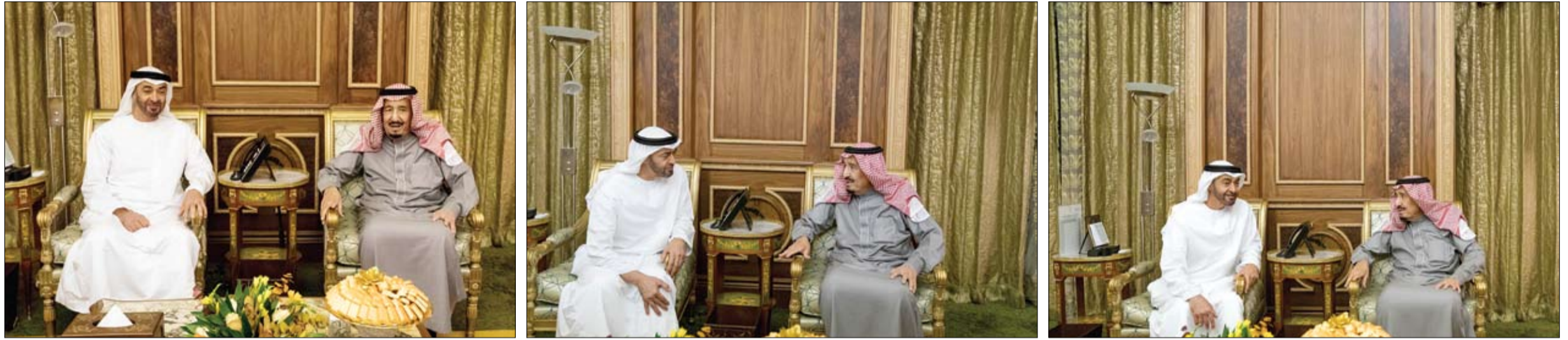
بحث مع العاهل السعودي العلاقات الاستراتيجية بين البلدين وتعزيز التضامن العربي والتطورات على الساحتين الفلسطينية واليمنية