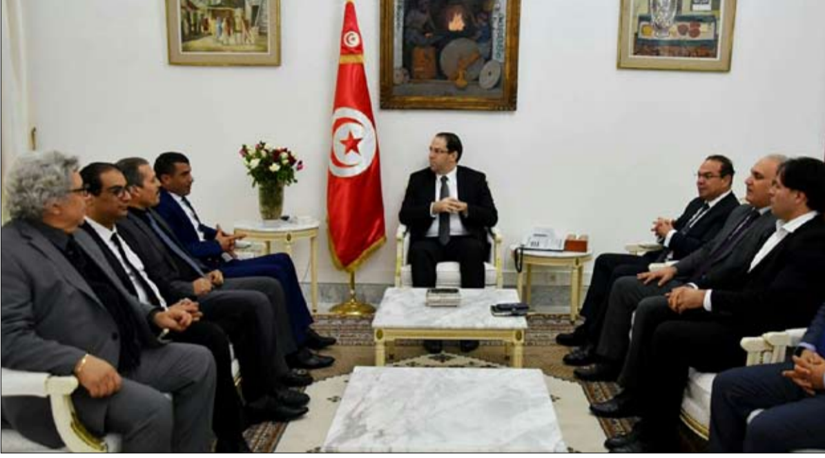
الشاهد... يستقبل الهيئة العليا للانتخابات امس