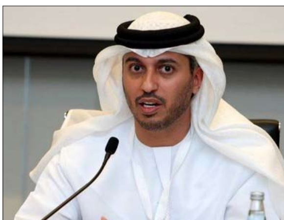
وزير دولة لشؤون التعليم العالي الدكتور أحمد بالهول الفلاسي

التكلفة السنوية للطالب الجامعي 81776 درهماً وهي الأعلى بعد أمريكا وبريطانيا