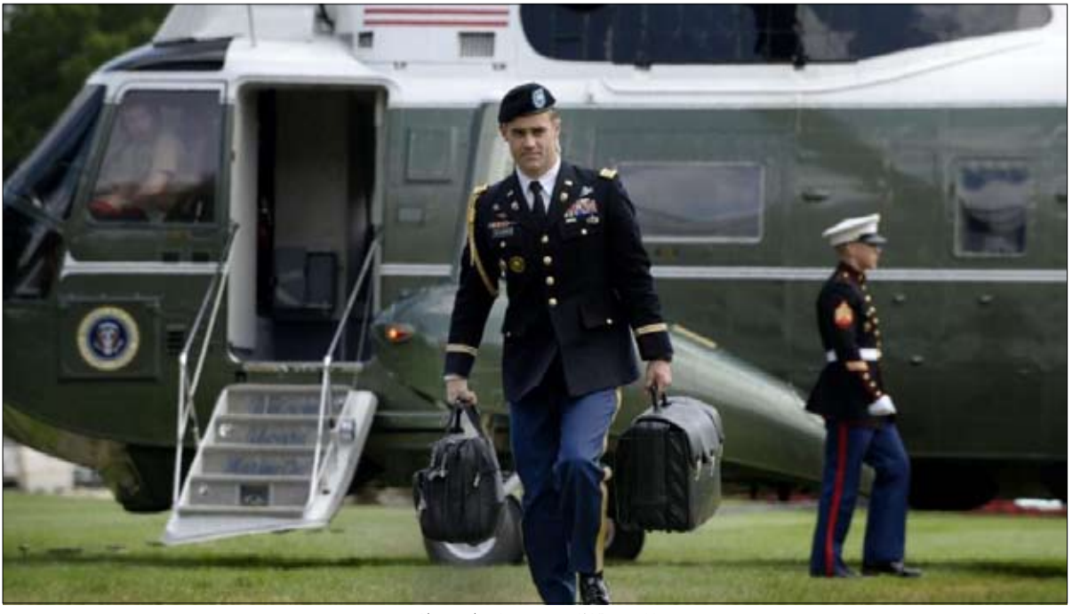
الحقيبة للفجر مصدر اوهايم وخيال