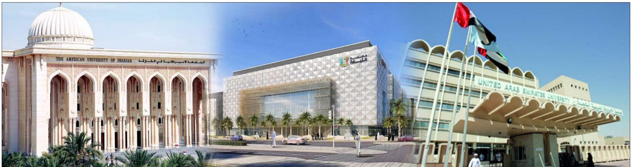
الإمارات وخليفة وأمريكية الشارقة من بين 500 جامعة مصنفة عالمياً

كرم سمو الشيخ عبدالله بن زايد آل نهيان وزير الخارجية والتعاون الدولي ومعالي الشيخ نهيان بن مبارك آل نهيان وزير التسامح ومعالي العلامة الشيخ عبد الله بن بيه رئيس «منتدى تعزيز السلم في المجتمعات المسلمة» مساء أمس الأول مبادرة «بيت العائلة المصرية» الفائزة بجائزة الحسن بن علي للسلم الدولية لعام 2017 وذلك ضمن فعاليات المنتدى الرابع لمنتدى تعزيز السلم في المجتمعات المسلمة. تسلم التكريم الدكتور محمود حمدي زقزوق الأمين العام لمبادرة