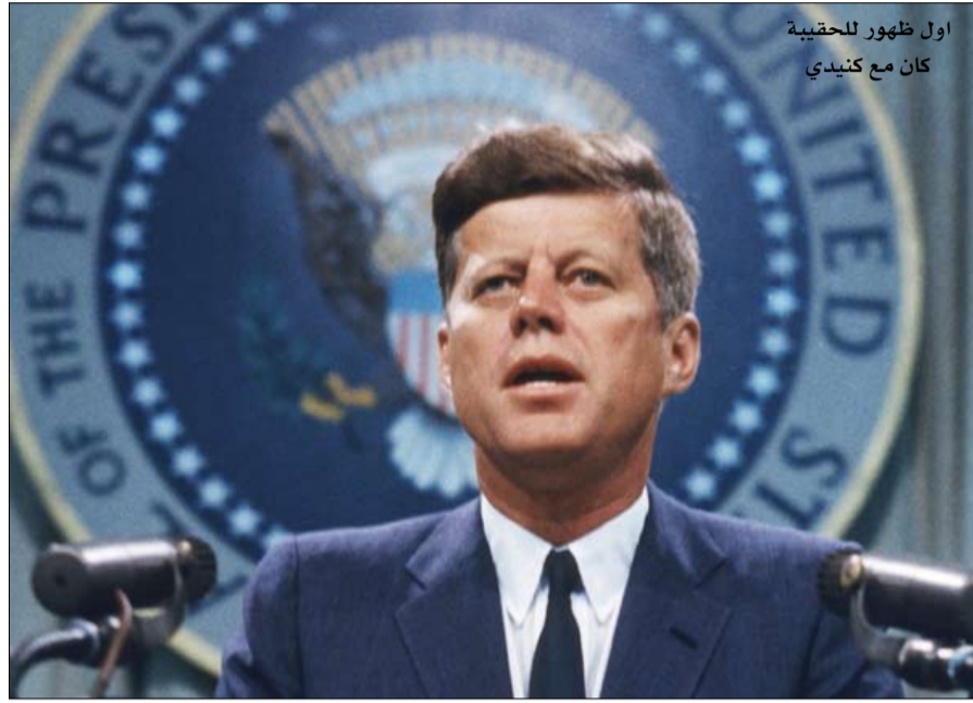
اول ظهور للحقيبة كان مع كينيدي

تجدد الاهتمام بها منذ التصعيد اللفظي بين دونالد ترامب وزعيم كوريا الشمالية كيم جونج أون، على خلفية أزمة الصواريخ الباليستية التي أطلقتها بيونغ يانغ. السبب، انها الحقيبة التي تسمح للرئيس بشن ضربات نووية في أي وقت. كتاب أسود ويسكويت هذا الكائن، هو في الواقع حقيبة هاليبورتون