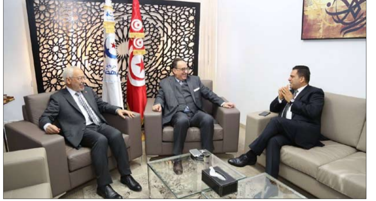
الترويكا الجديدة ترغب في تأجيل الانتخابات