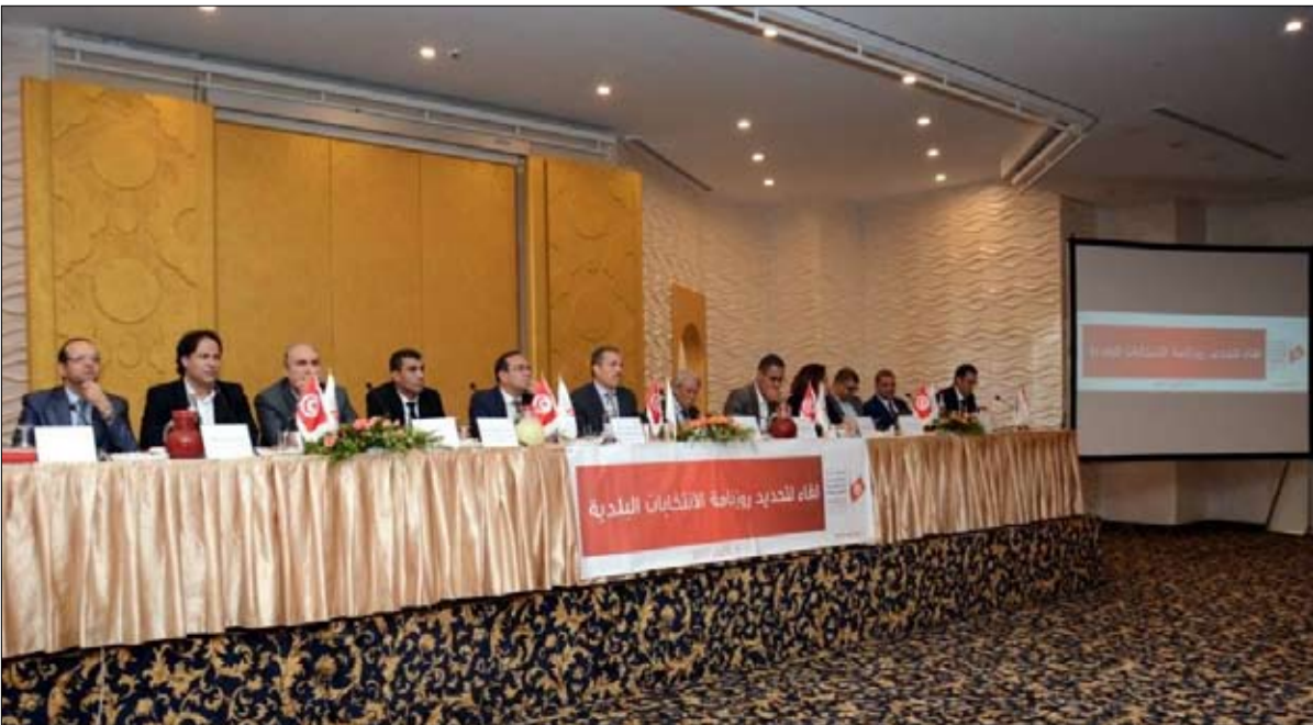
وجع جديد داخل الهيئة العليا