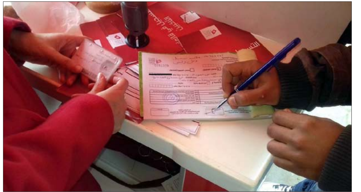
الانتخابات البلدية محل تجاذب مرة اخرى