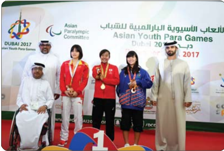
كما التقى سمو الشيخ منصور بن محمد بن راشد آل مكتوم .. رئيس وأعضاء اللجنة البارالمبية الآسيوية وشارك في تتويج أبطال اليوم الختامي للبطولة. وتوجه سعادة ثاني جمعة بالرقاد رئيس نادي دبي لأصحاب الهمم نائب رئيس اللجنة المنظمة

جدير بالذكر أن نسخة دبي شهدت مشاركة قياسية من حيث عدد الدول لتتبع الإمارات في استضافة هذا الحدث الآسيوي المهم في زمن قياسي والذي شاركت فيه 100 من كبار الشخصيات و500 متطوع ومتطوعة وما يزيد عن 1200 من الوفود التي شاركت في الحدث.