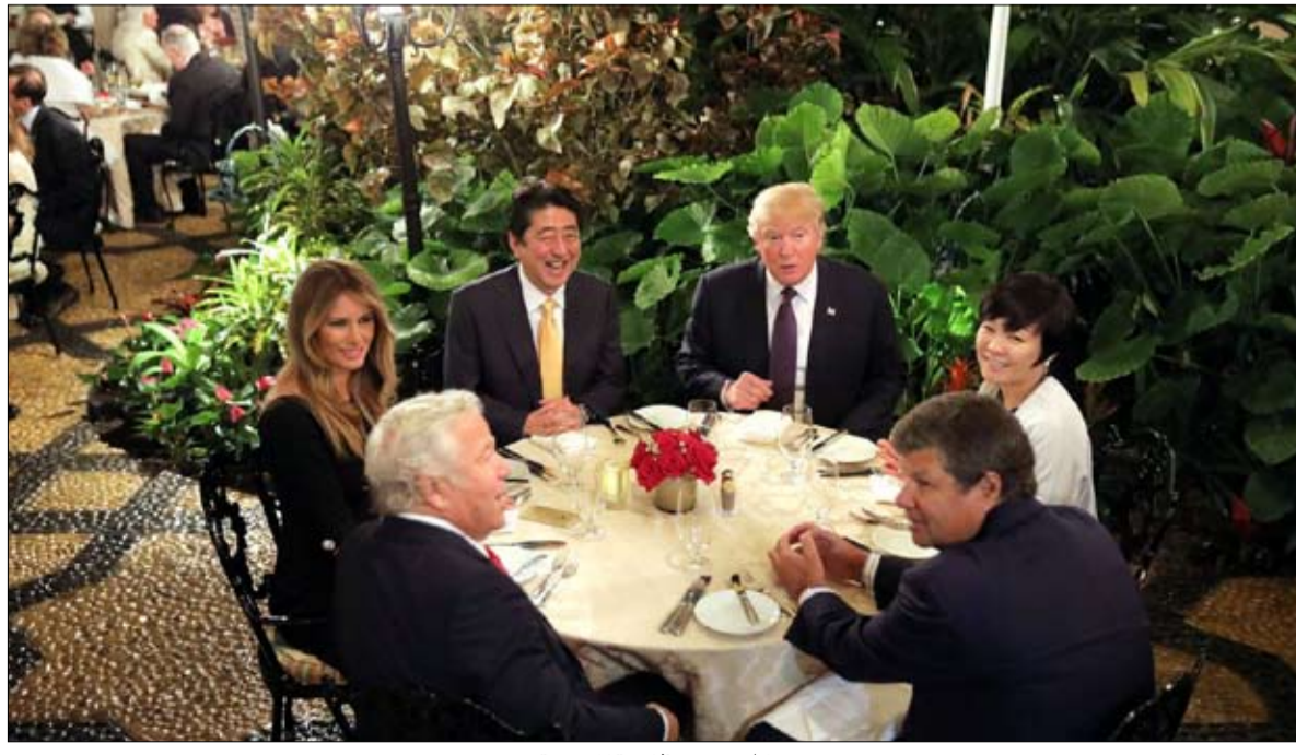
عشاء تسبب في أزمة الحقيبة