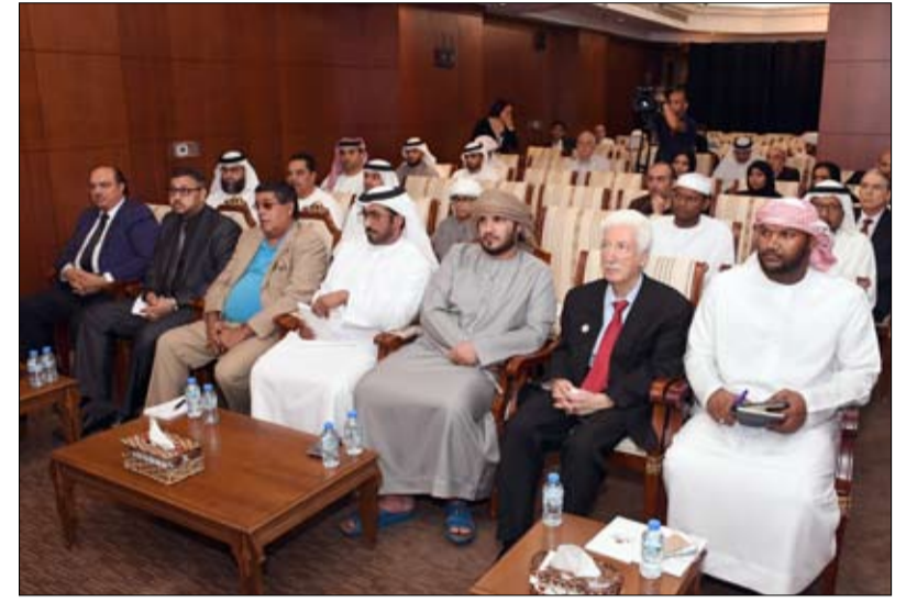
في محاضرة بمركز سلطان بن زايد