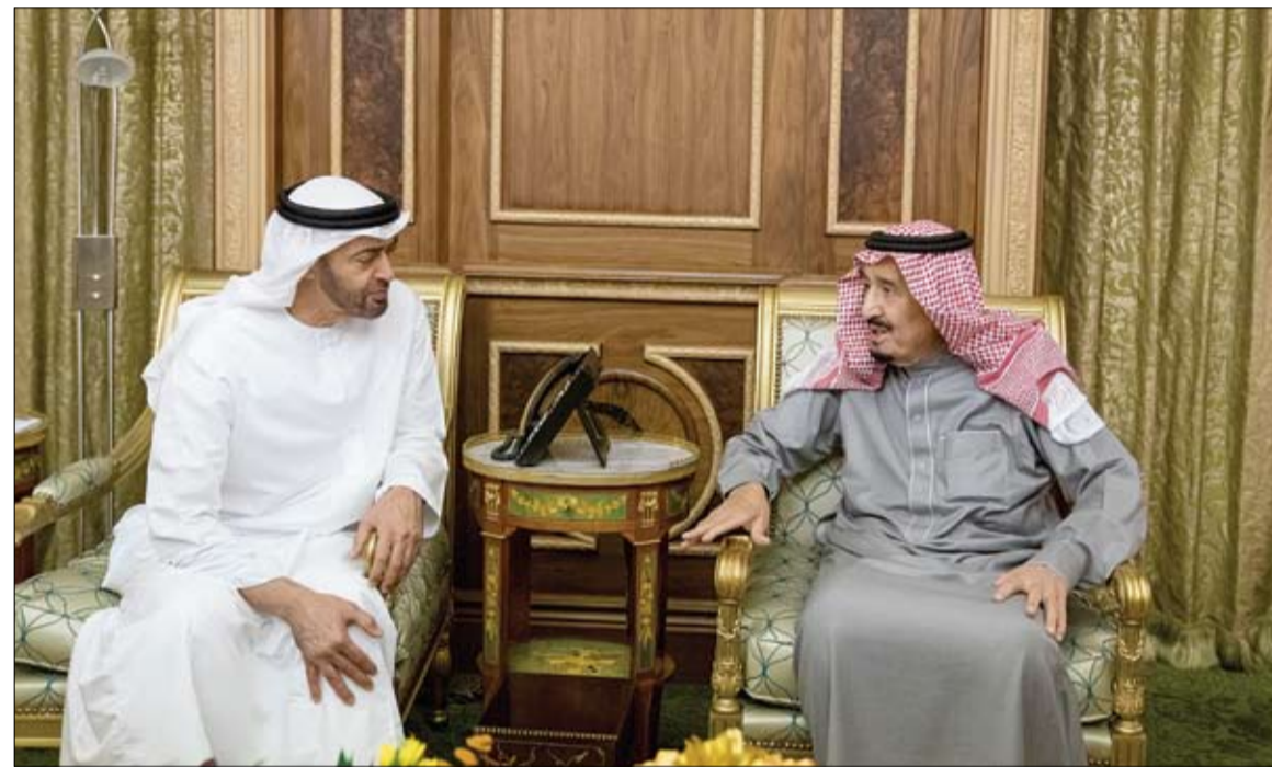
محمد بن زايد خلال مباحثاته مع خادم الحرمين الشريفين في الرياض (وام)

الرياض - وام: بحث خادم الحرمين الشريفين الملك سلمان بن عبد العزيز آل سعود عاهل المملكة العربية السعودية الشقيقة وصاحب السمو الشيخ محمد بن زايد آل نهيان ولي عهد أبوظبي نائب القائد الأعلى للقوات المسلحة تعزيز العلاقات الأخوية والاستراتيجية بين البلدين الشقيقين ومجمل القضايا الإقليمية والدولية ذات الاهتمام المشترك. جاء ذلك خلال استقبال الملك سلمان بن عبد العزيز آل سعود .. صاحب السمو الشيخ محمد بن زايد آل نهيان والوفد المرافق امس بقصر عرقة بالرياض. ونقل صاحب السمو الشيخ محمد بن زايد آل نهيان في بداية اللقاء تحيات صاحب السمو الشيخ خليفة بن زايد آل نهيان رئيس الدولة حفظه الله إلى أخيه خادم الحرمين الشريفين الملك سلمان بن عبد العزيز آل سعود وتمنياته للمملكة العربية السعودية الشقيقة كل خير وتقديم وازدهار. كان خادم الحرمين الشريفين قد رحب بزيارة صاحب السمو الشيخ محمد بن زايد آل نهيان والوفد المرافق وحمله تحياته إلى أخيه صاحب السمو الشيخ خليفة بن زايد آل نهيان رئيس الدولة حفظه الله وتمنياته له بموفقور الصحة والعافية وللدولة الامارات قيادة وشعبا دوام الرقي والازدهار. ويبحث الجانبان خلال اللقاء سبل تعزيز العلاقات الأخوية المتينة و الراسخة بين البلدين والشعبين الشقيقين وتعاونهما الاستراتيجي في العديد من القضايا الثنائية والإقليمية وجودهما في التصدي للتحديات والتدخلات الإقليمية الساعية لزعزعة أمن واستقرار المنطقة. (التفاصيل ص 2)