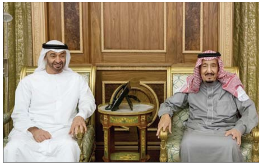
سموه يؤكد ضرورة تعزيز وحدة الصف العربي وتلاحمه خاصة في ظل الظروف التي تمر بها منطقتنا