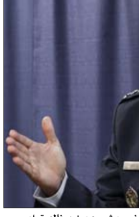
الجنرال جون هيتن سيعارض أمرا غير مشروع من دونالد ترامب

توجد حقيبة نووية قديمة في المتحف الوطني للتاريخ الأمريكي في واشنطن اليوم.. افرغت من محتواها، حتما.