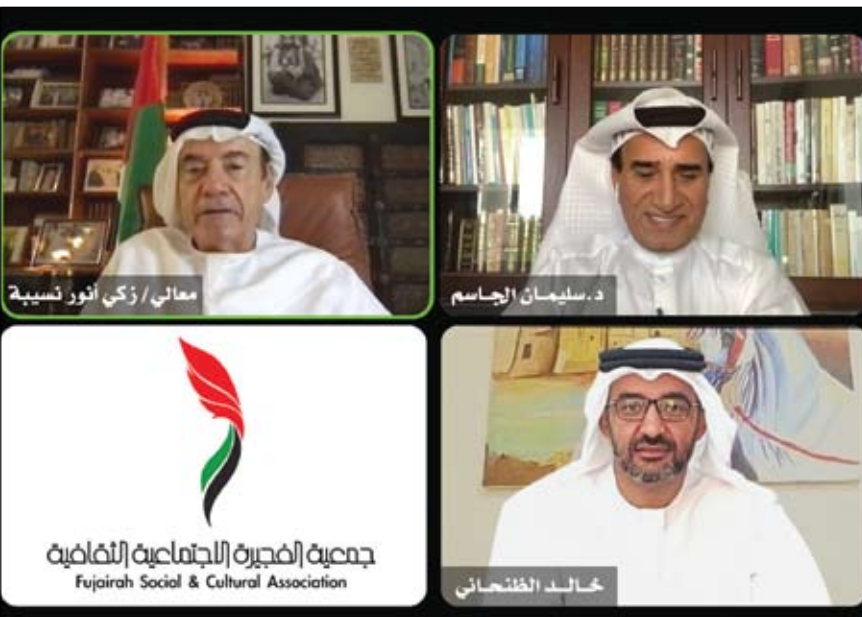
معالي زكي نسيبة، د. سليمان الجاسم، خالد الطنحاني

وأشار الطنحاني إلى أهمية استراتيجية الإمارات في تبني مفهوم القوة الناعمة التي تشمل كافة القطاعات الاقتصادية والثقافية والفنية والسياحية والإنسانية والمجتمعية، مؤكداً على نجاعة التوجهات الإنسانية والحضارية التي تنتهجها القيادة الرشيدة لإبراز الصورة الحضارية للدولة وإرثها وهويتها وثقافتها الأصيلة.