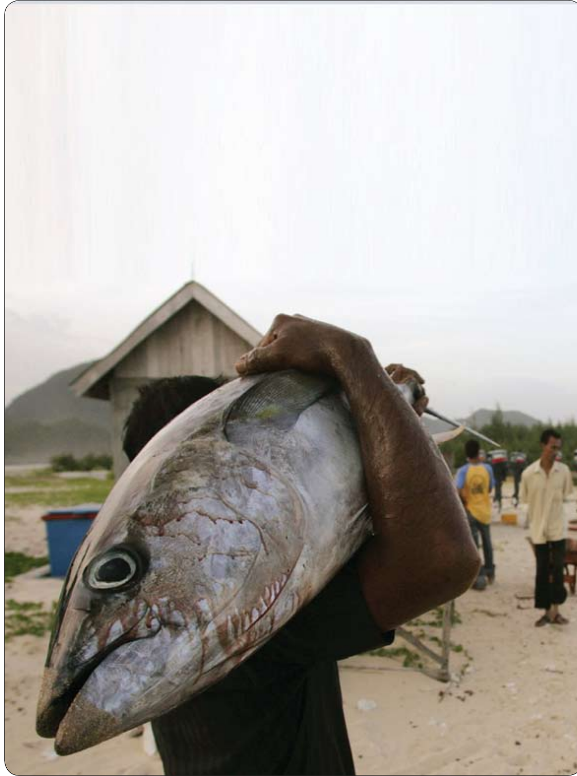
صياد يحمل سمكة تونة اصطادها بميناء في لامبوك من ضواحي باندا أتشي، إندونيسيا.