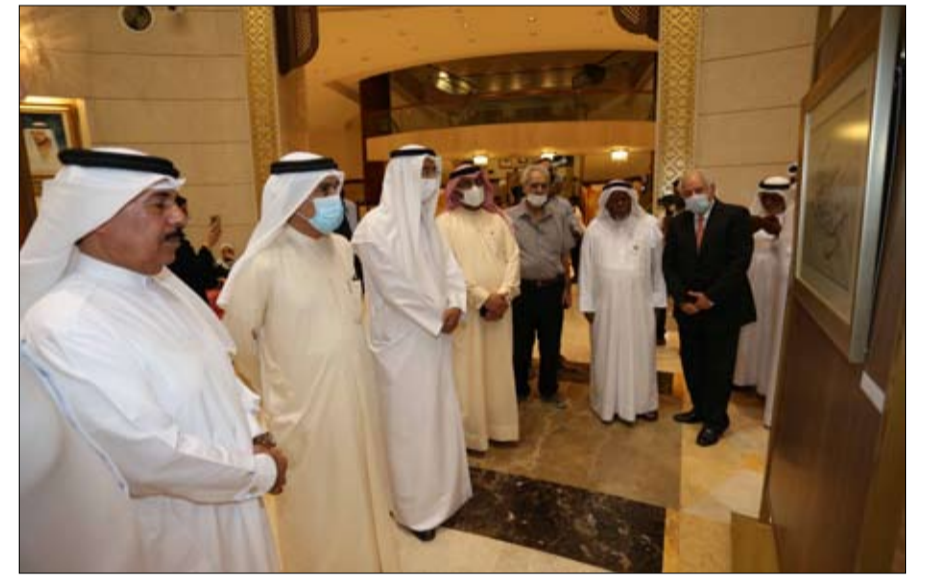
باكورة احتفالات اليوم الوطني الخمسين