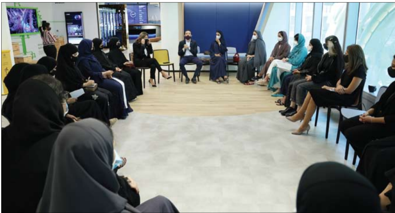
دبي - الفجر

شاركت طالبات جامعة زايد في جلسة نقاشية لتصميم حلول مبتكرة لمجموعة متنوعة من التحديات المطروحة من قبل الهدف العالمي الخامس للتنمية المستدامة (SDG5) للمساواة بين الجنسين وتمكين المرأة وتفعيل دورها في جميع القطاعات وشغلا المناصب العليا، أقيم الحدث في جناح "ساب" SAP في إكسبو دبي 2020 مؤخراً بالشراكة بين مركز تكنولوجيا الجيل القادم الذي تديره كلية الابتكار التقني بجامعة زايد ، وشركة "ساب" الدولية لتكنولوجيا المعلومات، ومنصة "People of Impact" المعنية بالاستشارات والابتكارات في مجال التأثير الاجتماعي. وأكد الدكتور هاني القاضي، عميد كلية الابتكار التقني في جامعة زايد، بأن "هذه المشاركة تعتبر جزءاً من مهمة الكلية في تخريج دفعة متكاملة من الخريجات الطالبات اللواتي سيحدثن فرقاً ملحوظاً في مجتمع دولة الإمارات وعلى مستوى العالم ككل، حيث قدمن نبذة من جانبهن الشخصي والمجتمعي حول التحديات التي تواجه النساء في جميع أنحاء العالم وتوصلا إلى حلول باستخدام التكنولوجيا الناشئة لمساعدتهن على طرح أفكارهم وخطط أعمالهن". وأشار القاضي إلى أحد الحلول المقترحة وهو عبارة عن منصة إلكترونية تسمى "Startup" والتي ستساعد النساء على اكتساب المعرفة والخبرة والتعلم من رواد الأعمال الآخرين من مختلف دول العالم، وتهدف هذه المنصة إلى منح النساء الفرصة لتعزيز الأنظمة الداعمة التي ستدعمهن في