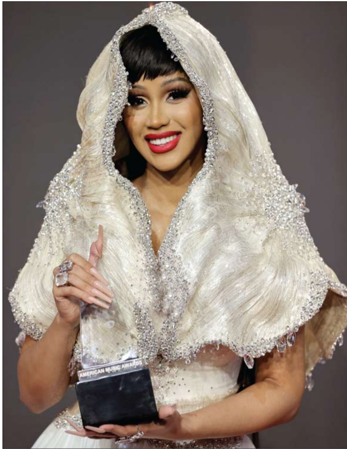
كاردي بي الحائزة على جائزة هيب هوب سونغ المفضلة، تقف في غرفة الصحافة خلال حفل توزيع جوائز الموسيقى الأمريكية لعام 2021 في لوس أنجلوس.

تشير بيانات جديدة واعدة من دراسة حديثة إلى أن الأشكال النشطة لفيتامين (د) يمكن أن تمنع تكرار وتطور "كوفيد-19". وتشير نتائج الدراسة أيضاً إلى أن اللومستيرول، وهو جزء من عائلة فيتامين (د) من مركبات الستيرويد، والذي ينتج عن تفاعل كيميائي في الجسم باستخدام الضوء، يعمل على منع "كوفيد-19". وكان فيتامين (د) ومستقلبات اللومستيرول قادرين على منع إنزيمين محددين (Mrpo و RdRp) مطلوبين لدورة حياة SARS-CoV-2، وفقاً لفريق الباحثين من جامعة ألاباما في برمنغهام، ومركز البحث متعدد التخصصات في العلوم الأساسية في نيودلهي بالهند، وجامعة غرب أستراليا.